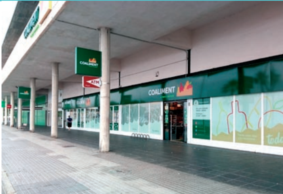
El nou model de supermercat de proximitat s'ha posat a prova en un dels establiments de la cadena a Caldes

Amb aquests resultats, l'empresa ha decidit expandir el nou Coaliment Compra Saludable, amb cinc botigues més, situades a Granollers,