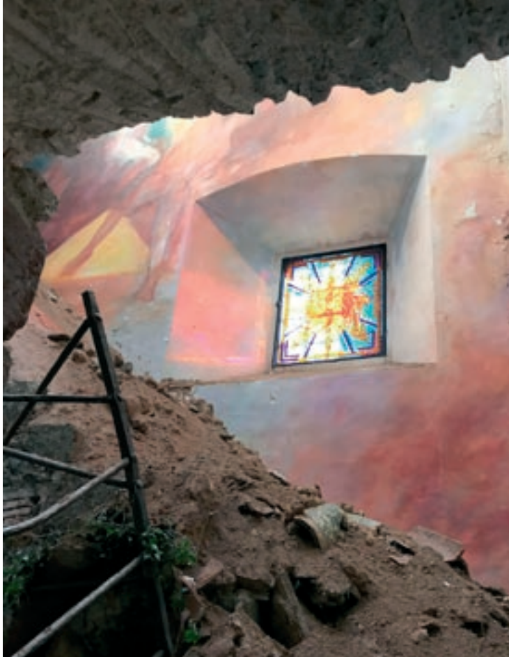
L'esfondrament no va malmetre el vitrall fet per un artista fa uns anys

El Centre d'Art la Rectoria de Sant Pere manifesta en un comunicat la seva "consternació i preocupació per l'esfondrament d'una part de la coberta de l'església". "No solament es tracta d'un edifici històric que ha acompanyat durant segles el nostre poble, sinó que té un especial significat en la mesura que el Centre, juntament amb molts veïns i veïnes del poble, va col·laborar en la seva rehabilitació amb l'aportació d'artistes residents i vinculats al Centre que hi van dipositar un conjunt d'obres d'art d'un