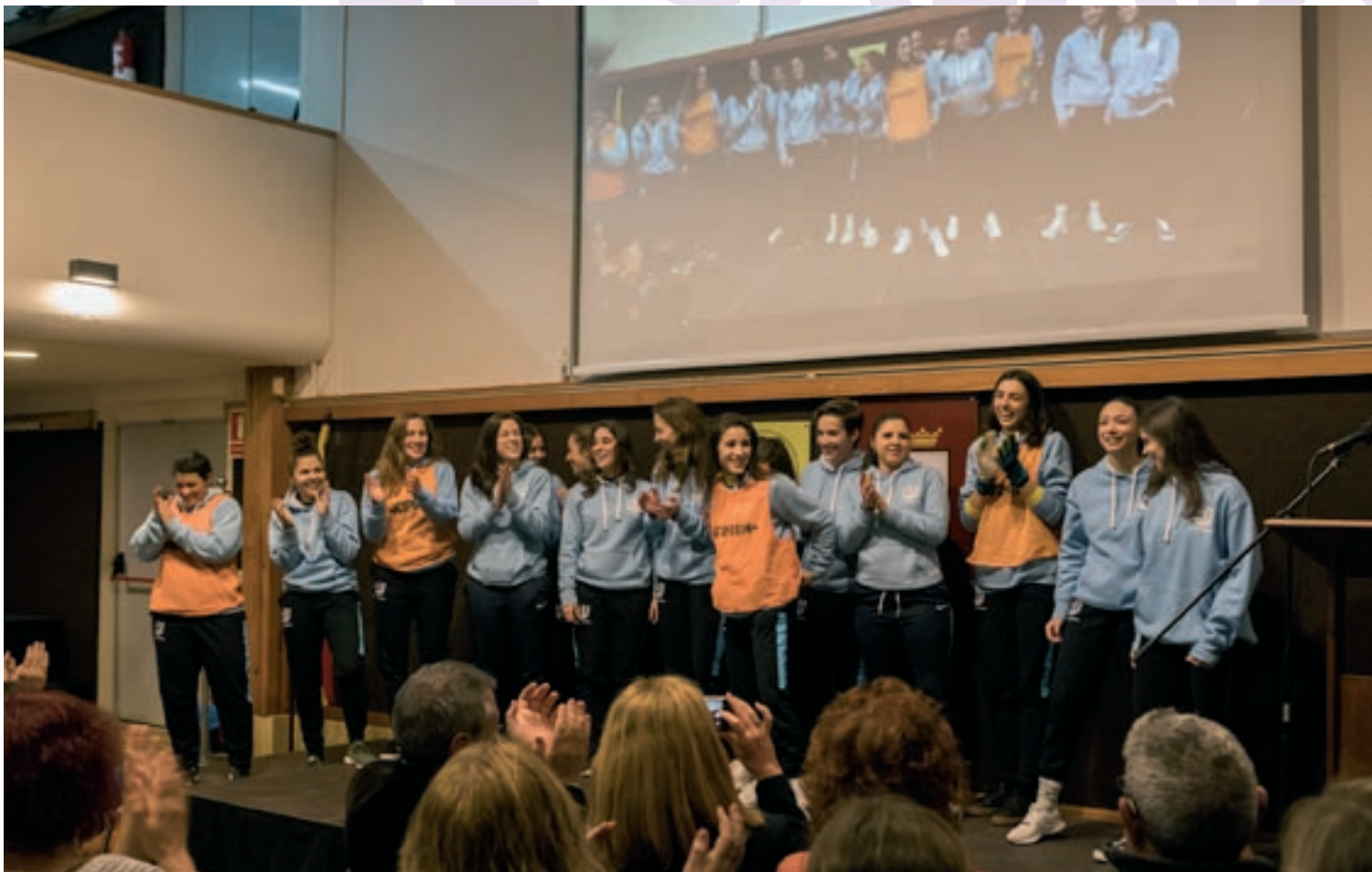
L'equip sènior femení de futbol va ser l'encarregat de fer el pregó de festa major, divendres al vespre