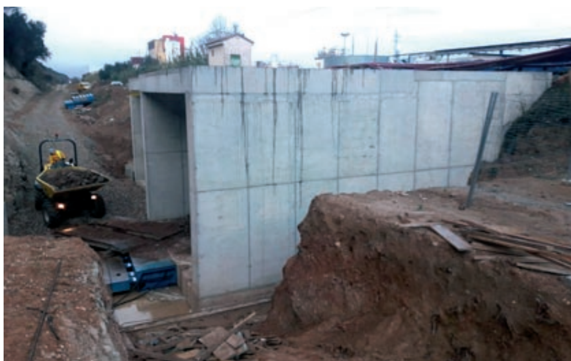
Amb gats hidràulics s'empenyen l'estructura construïda fora de les vies fins a col·locar-se sota el traçat ferroviari

A la Garriga, estan avançades les obres per suprimir el pas