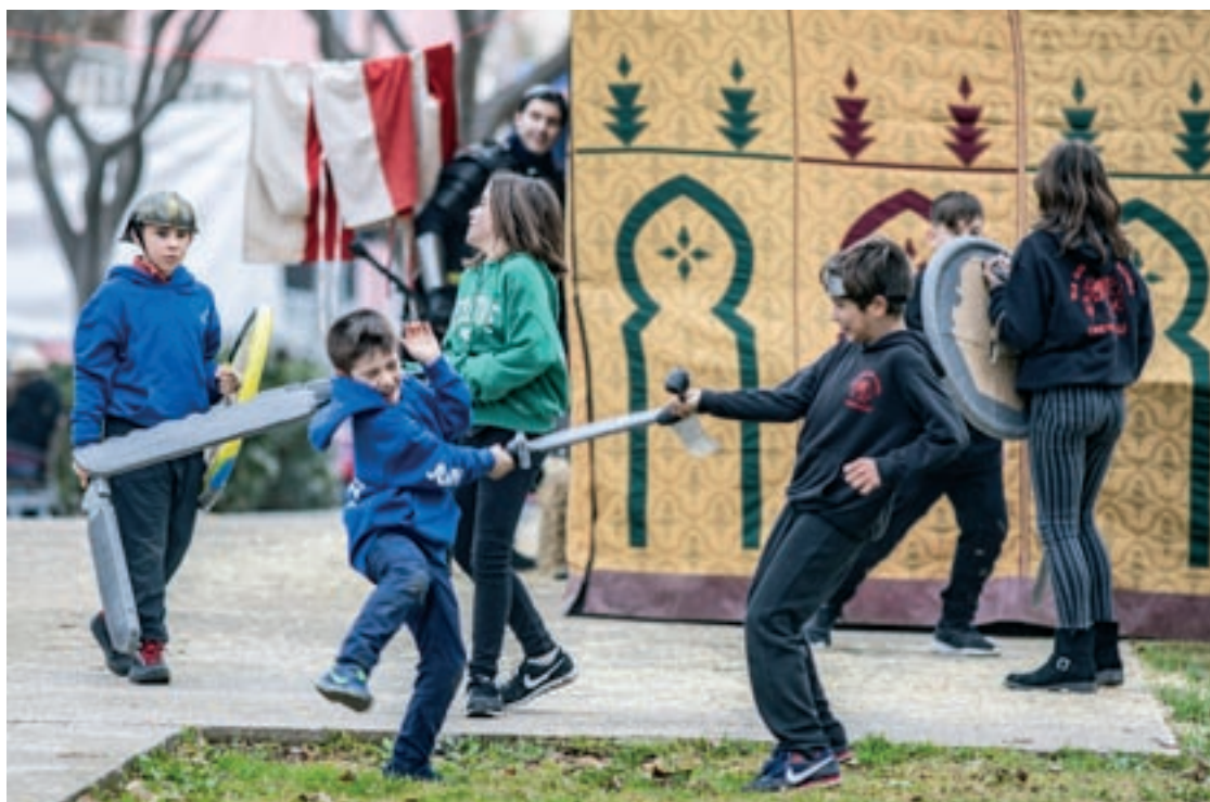
La Fira Medieval és l'activitat central de la festa major d'hivern de Parets

Entre les novetats hi havia la celebració dels 15 anys de la bèstia de la colla Diables Parets. I ho van fer amb una trobada i un espectacle infernal dissabte a la nit en què hi van participar 15 bèsties d'altres municipis. També es va