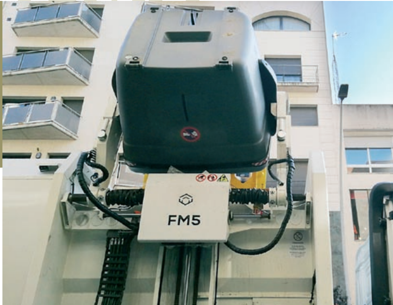
Un vehicle del Consorci de Residus recull un dels nous contenidors de recollida selectiva de càrrega lateral que es van instal·lar a Granollers.

I, en el cas de les licitacions fetes, la Sindicatura enumera nombroses deficiències: els expedients del contractes licitats a través d'un procediment obert i en forma de concurs contenien "mancances formals": els plecs de condicions no havien estat aprovats o no hi havia informe de fiscalització prèvia de la intervenció. També es parla de "mancances significatives en el compliment de la publicitat legalment exigida en set contractes licitats a través d'un procediment obert i en els contractes menors. Sobre aquest darrer tipus de contractacions, s'assegura que "es renovaven de forma periòdica anualment" als mateixos proveïdors "incomplint el requisit de no superar la durada màxima d'un any". És, recorda la Sindicatura, "un incompliment del que estableix la normativa de contractació pública". I conclou: "Hi va haver un fraccionament indegut del contracte".