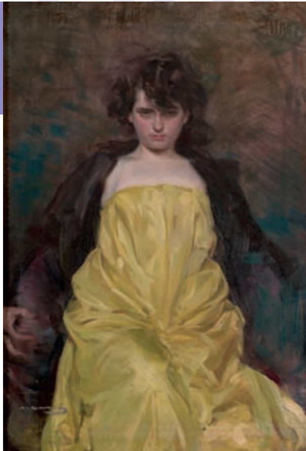
RAMON CASAS (1866-1932) / CÍRCULO DEL LICEO