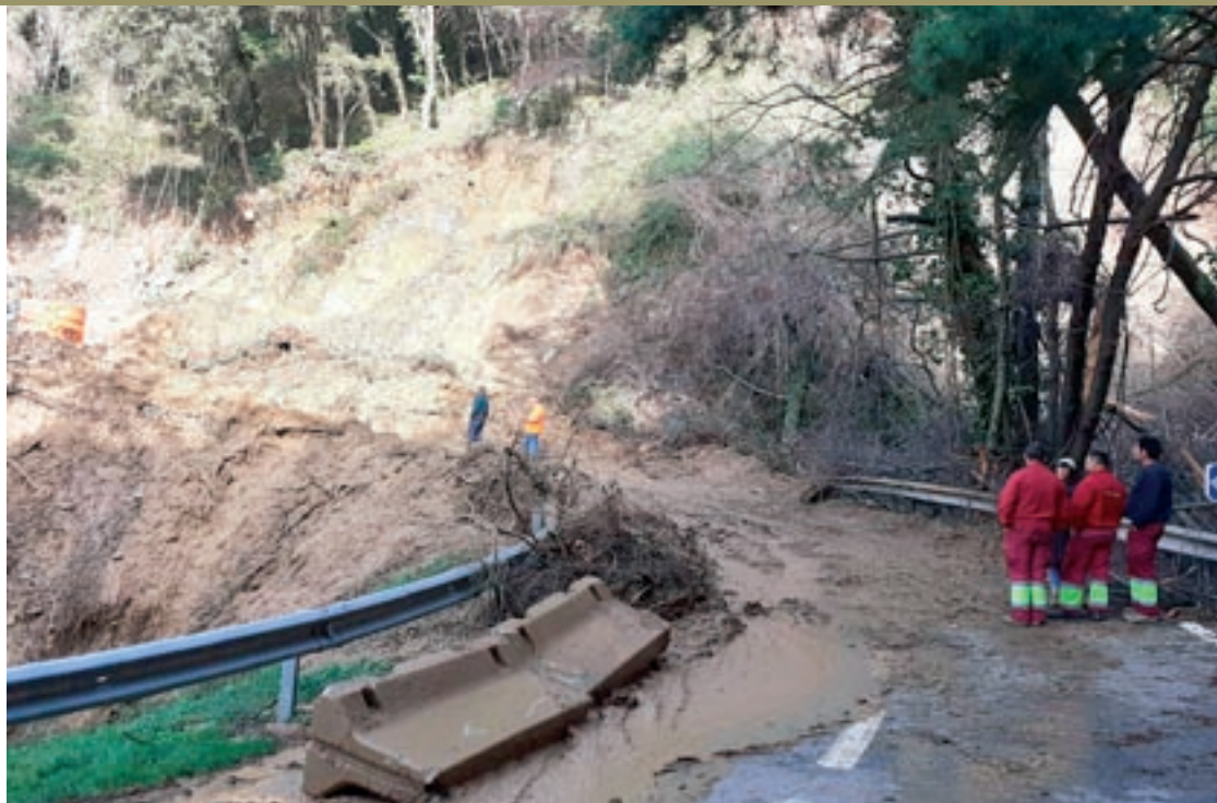
Uns operaris a la zona on es va produir la principal afectació a la carretera que uneix Montseny amb el Brull

El temporal de la setmana passada va agreujar els efectes que ja havia tingut sobre un tram d'aquesta carretera la llevantada del mes de desembre. Quan encara s'estava pendent de l'actuació per acabar d'arranjar els efectes d'aquell primer temporal, que consistien a refer un mur i col·locar malles de protecció per evi-