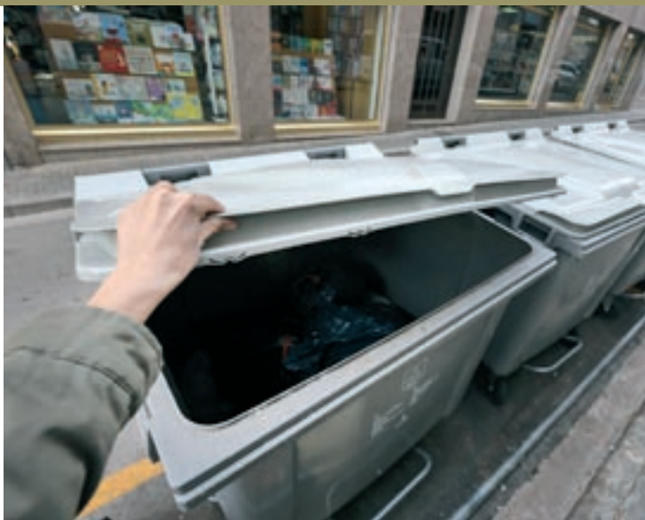
Contenidors de rebuig en un carrer de Caldes

Per aquest 2020, s'ha aplicat una nova pujada de les taxes. L'objectiu és continuar amb la renovació de camions