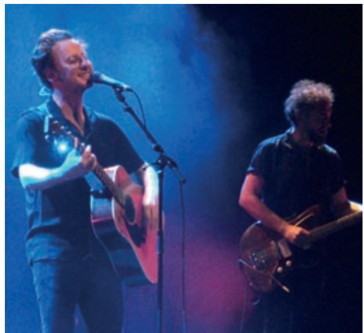
La gira que està fent la banda barcelonina pels 20 anys es va aturar al TAG

Pràcticament una quarta part del repertori que van oferir es va nodrir d'encerts recents com les pinzellades folk de "Jimi" o la penombra post-punk de "S'haurà de fer de nit" –aquesta última, dedicada als presos polítics–. La resta del setlist va alternar tota una bateria d'himnes generacionals –"Tornarà a tremolar", "Qui n'ha