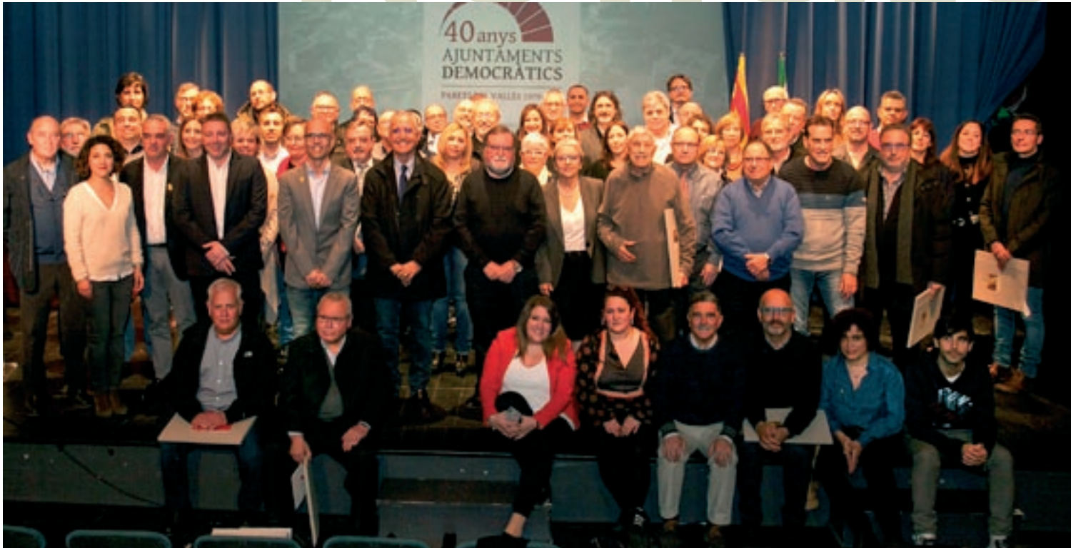
Els regidors i regidores, alcaldes i alcaldessa que ha tingut Paret en els darrers 40 anys, a l'escenari del Teatre de Can Rajoler, divendres al vespre