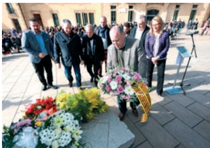
AJUNTAMENT DE LES FRANQUESSES

Durant la junta també es van repassar les diferents sessions de difusió de qüestions relacionades amb la seguretat que han fet els cossos policials.