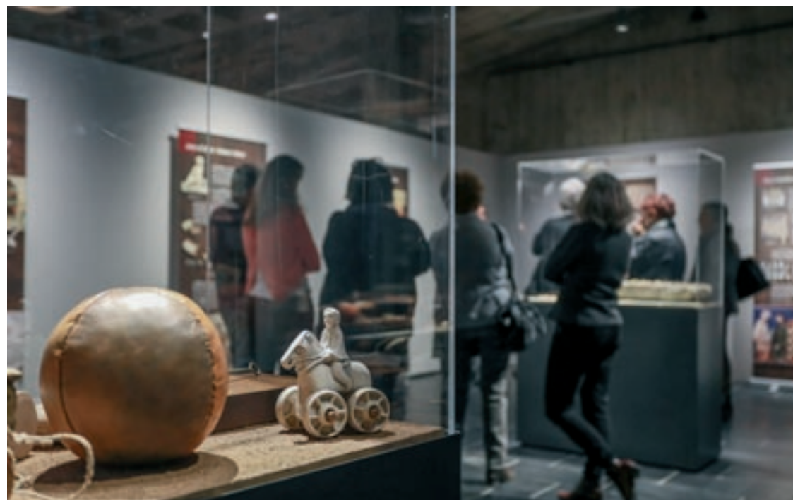
L'exposició es va presentar fa més d'un any al Museu de Granollers

L'exposició s'estructura en sis àmbits -Jugar a cuinetes, Sons i bales, Alea iacta est.