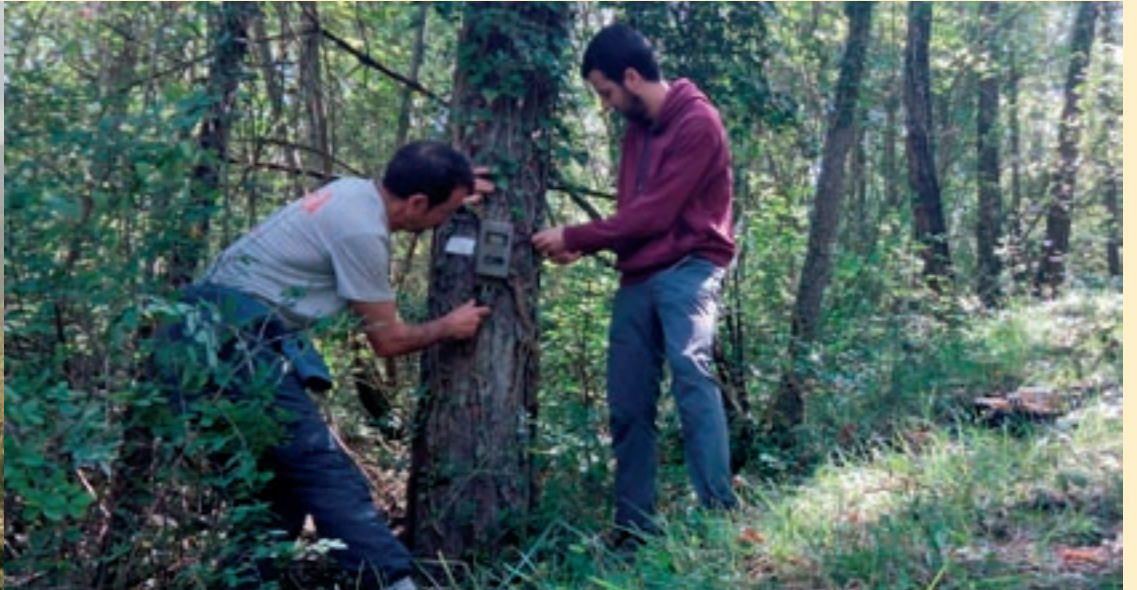
Sector occidental del massís del Montseny, on habita una petita població de gat fer