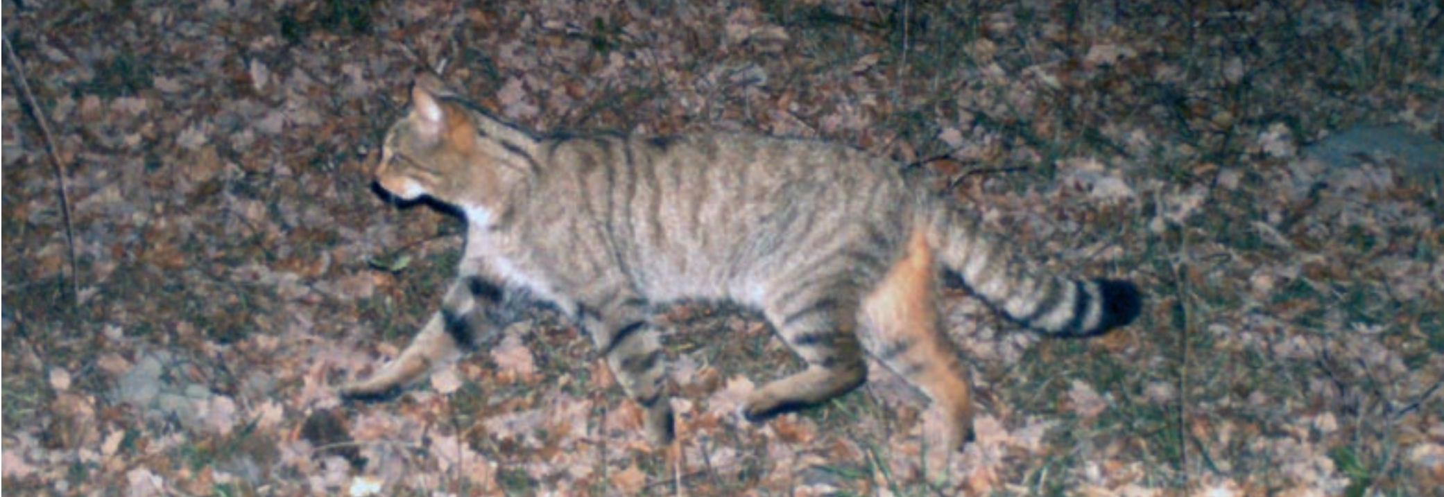
Un dels primers exemplars de gat fer fotografiats a la comarca d'Osona, l'any 2013

Un gran nombre de llars estan familiaritzades amb la presència de gats domèstics, però els seus homòlegs salvatges, els gats fers, passen molt més desapercebuts: poques persones poden afirmar haver-ne observat algun individu en llibertat. La seva activitat fonamentalment nocturna i la seva preferència per indrets allunyats de la civilització humana són les principals causes del desconeixement que l'envolta. Durant aquests darrers anys, però, l'estudi del gat fer ha permès descobrir noves característiques de l'espècie i confirmar la seva presència a llocs inesperats.