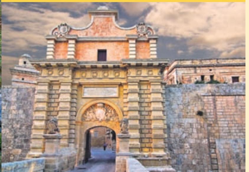
Mdina Gate, Malta, escenari de 'Joc de Trons'