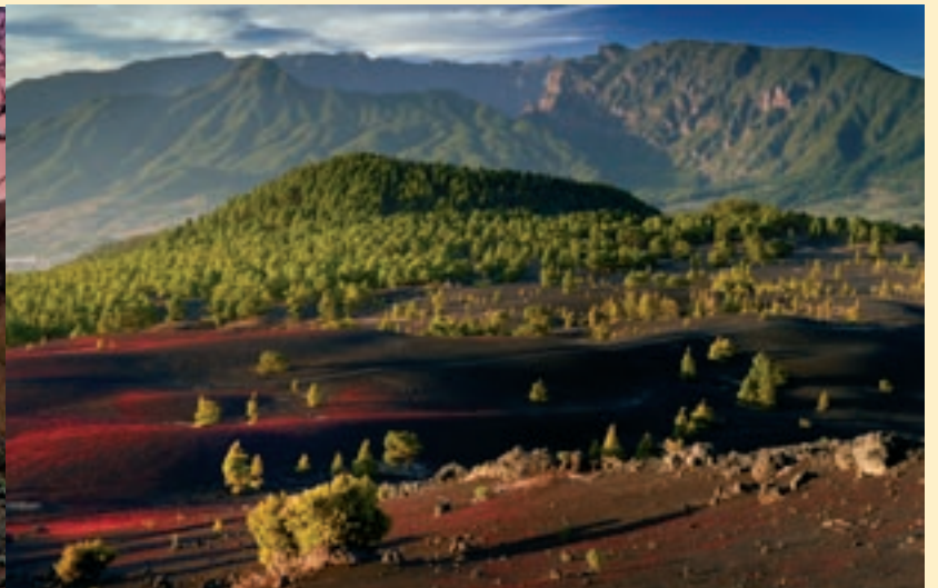
Llanos del Jable, a l'illa La Palma