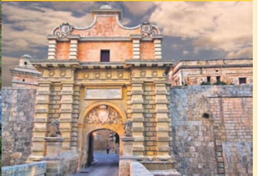
Mdina Gate, Malta, escenari de 'Joc de Trons'