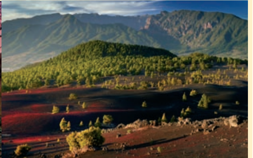
Llanos del Jable, a l'illa La Palma