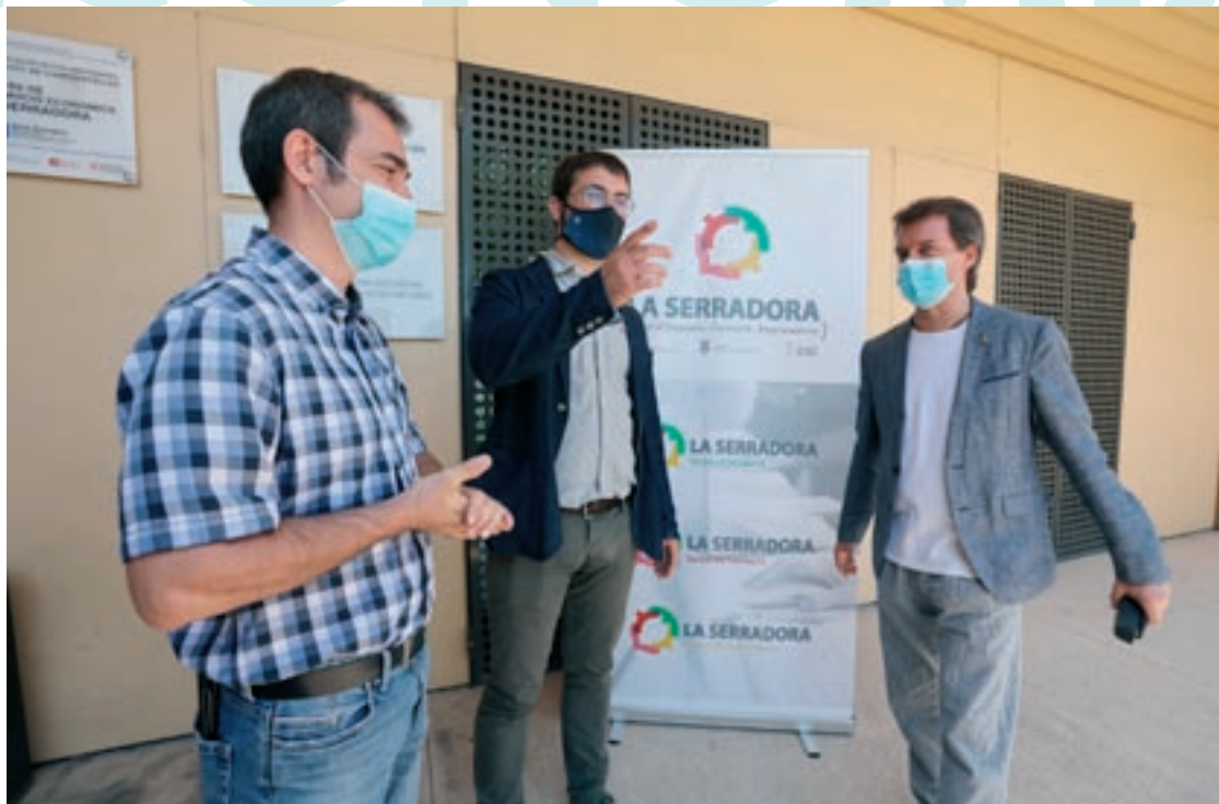
Els alcaldes de Santa Maria, Martorelles i Sant Fost conversen després de presentar el nou servei mancomunat

Saci ha traslladat l'activitat des de Badalona a la nova planta de 7.500 metres quadrats a Granollers, inaugurada el novembre passat. L'empresa és present en més de 85 països i preveu incrementar aquesta presència internacional. La firma instal·ladora, amb seu a Vic, ha fet altres projectes d'energia solar, com el de la planta de Henkel a Montornès.