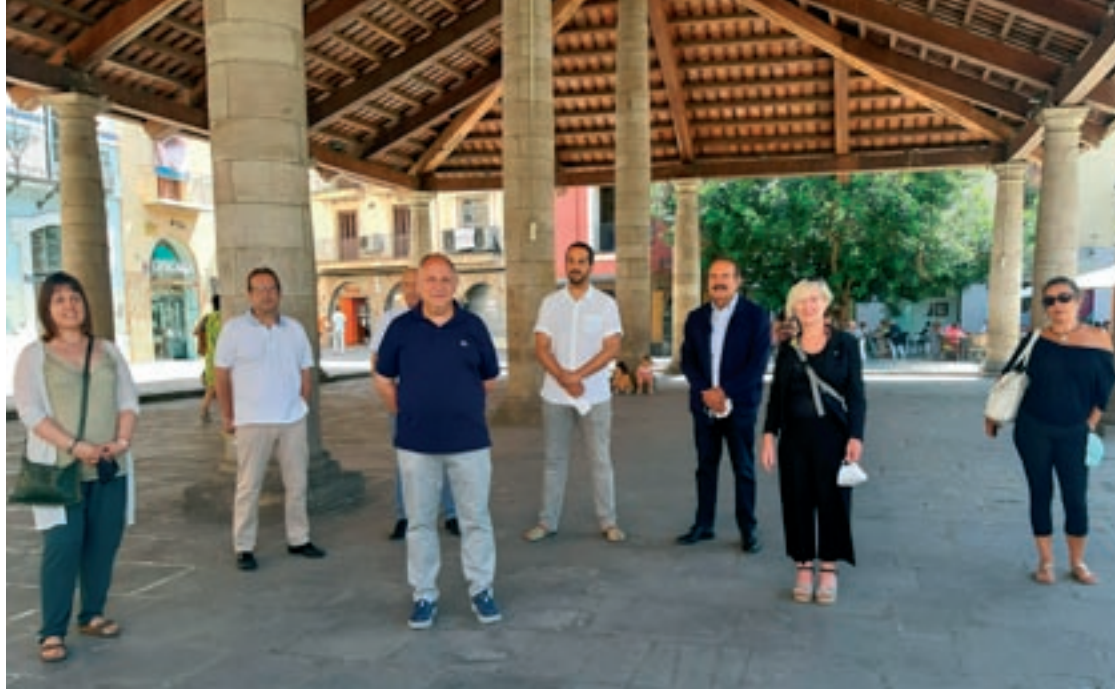
Representats del Consell Comarcal, ajuntaments i entitats empresarials i sindicals van presentar el pla divendres

L'establiment de la línia d'ajuts amb els bancs és una de les mesures destacades del pla. La dotació de les 12 mesures dependrà en gran