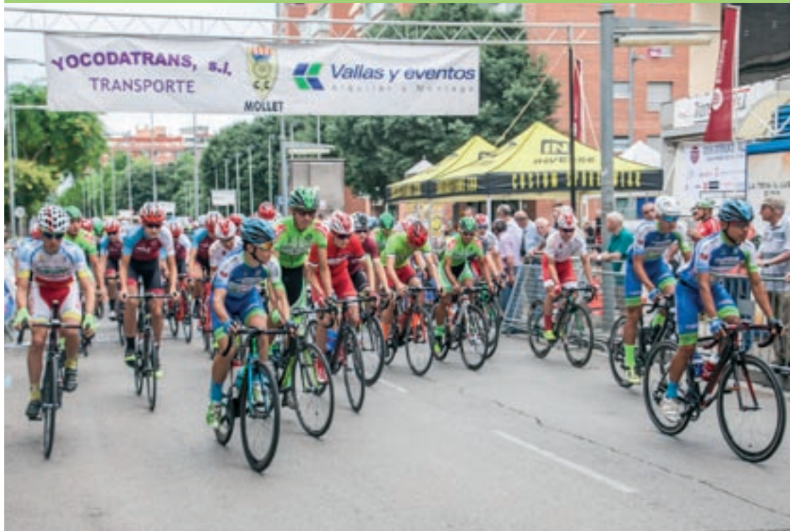
El Critèrium júnior del Vallès, que ja va ser Campionat de Catalunya fa cinc anys, en una imatge del 2018

La prova, que aquest any serà Campionat de Catalunya, sol celebrar-se a finals de juliol