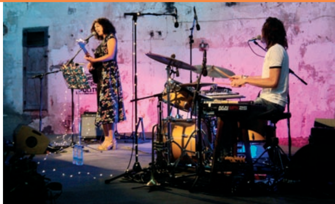
La cantautora barcelonina va protagonitzar el primer concert de la desescalada a Granollers

Va refermar l'aposta pel seu present creatiu amb "Quin doll". Va alternar la reivindicació de gènere en clau Americana d'"El teu John Wayne" amb la psicodèlia vaporosa de "Laranja Nu Azul". Va rebaixar tensions amb el contagiós folk pop