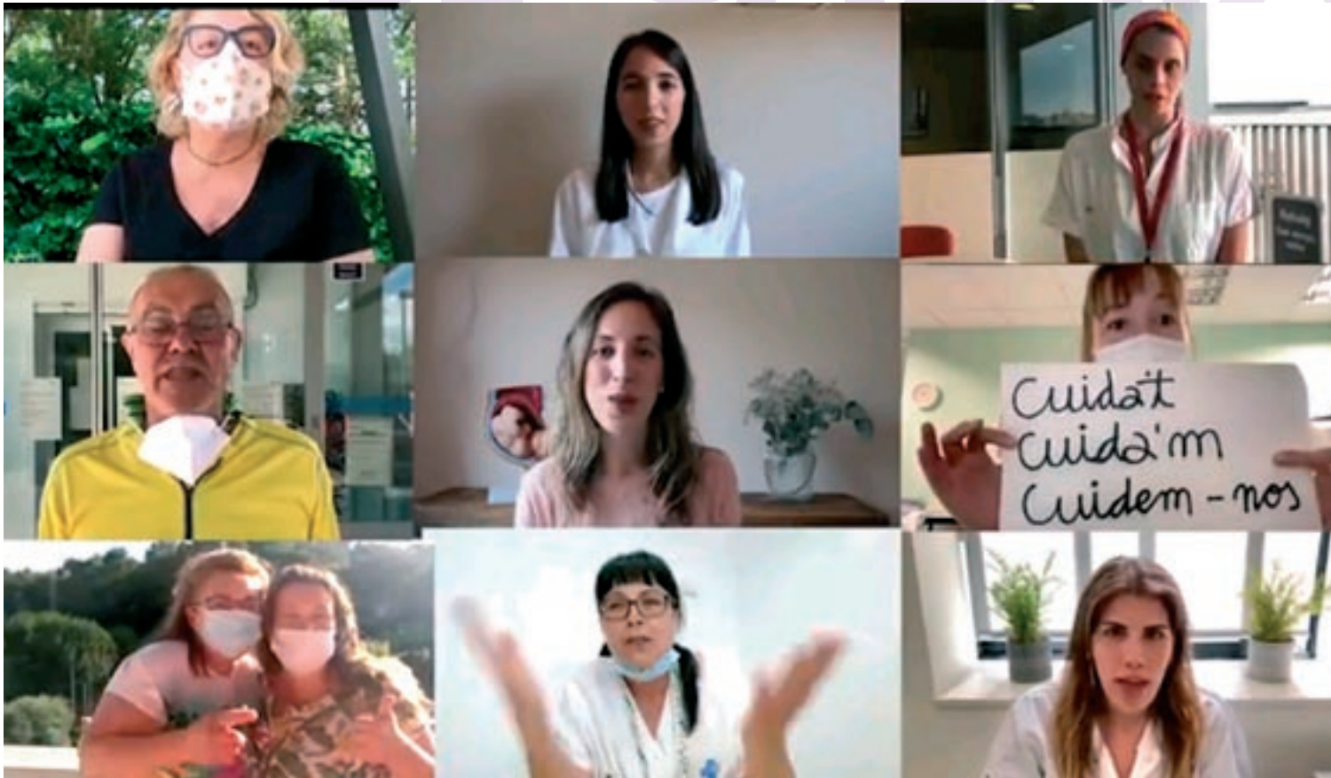
Els participants al vídeo del pregó col·lectiu de la festa major de Lliça de Vall que es troba al canal de Youtube de l'Ajuntament

Vila. Finalment, els organitzadors proposen un final de festa original: a les 10 del vespre del diumenge, tots els veïns i veïnes estan convidats a il·luminar balcons i finestres amb bengales.