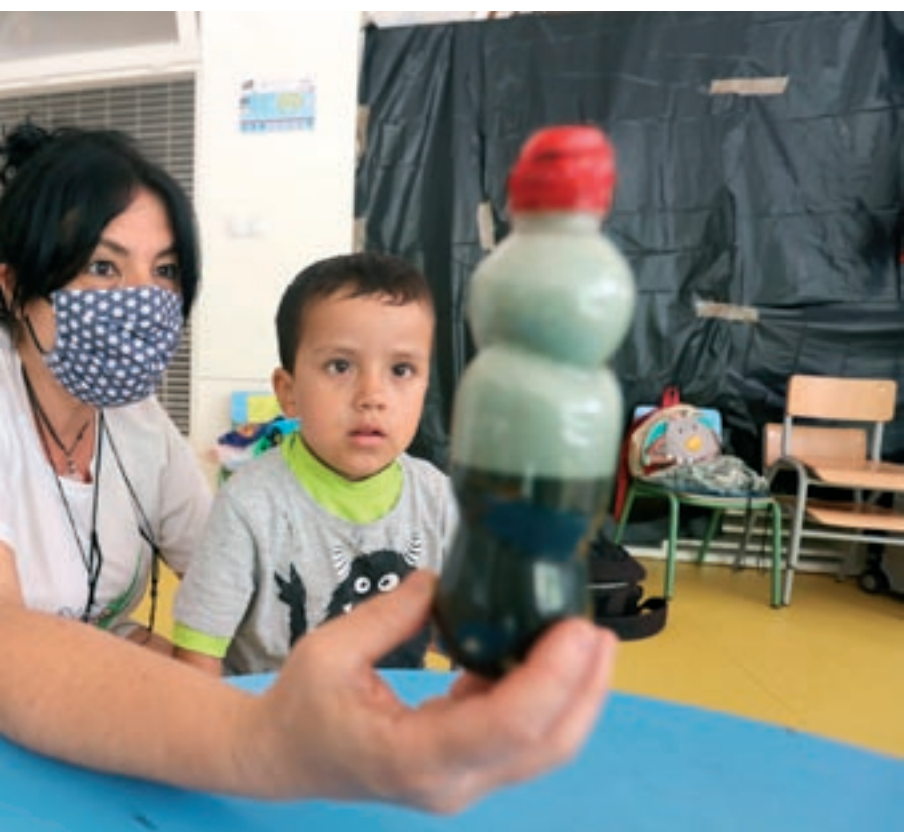
al de l'escola Soler de Vilardell de Sant Celoni

que en un estiu qualsevol. Els infants ho estan vivint molt intensament", conclou. Els casals dels dos centres escolars de Sant Celoni van començar dilluns passat, i el de Martorelles ho va fer dijous. Aquests dos són pràcticament els únics casals a la comarca que van començar la setmana passada; la resta es repartiran entre aquest dilluns (una quinzena) i el dia 6 de juliol.