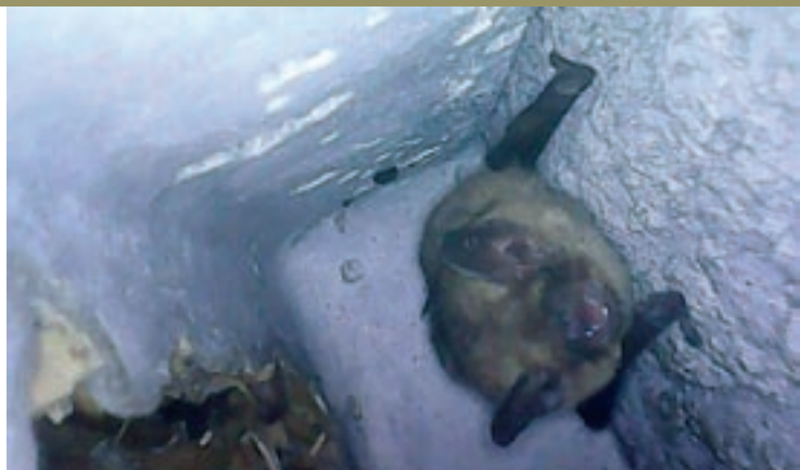
El ratpenat detectat a la caixa-niu instal·lada a Can Luna