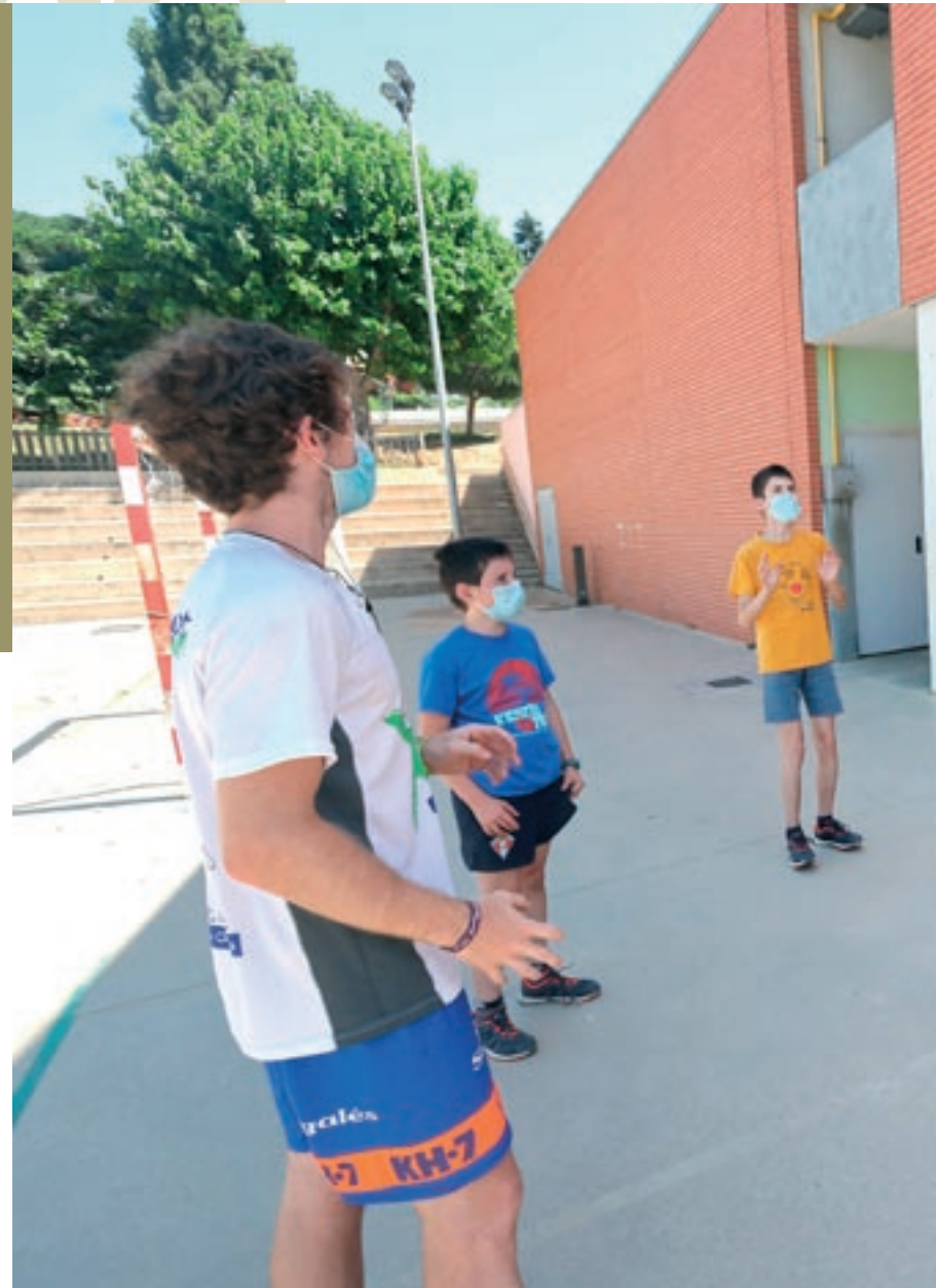
Un grup de nens juga a passar-se la pilota mantenint la distància de seguretat, aquest divendres

Segons Rodríguez, la por del possible contagi de la Covid-19 no ha tingut tant de pes en la decisió de les famílies de no apuntar els seus fills als casals com es podria pensar. “Ara no hi ha tanta por com fa un temps. Els pares i mares veuen que tornen a poder anar als parcs i estan una mica més confiats. És més que res una qüestió logística: els pares que han de treballar presencialment estan portant els fills als casals. A més, els agrada veure els nens contents, amb els seus amics, perquè