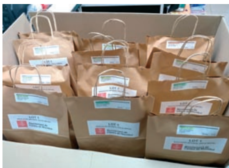
AJUNTAMENT DE CALDES

L'Ajuntament de Cardedeu ha anunciat que reobrirà les fonts públiques aquest dilluns. Quedaran totes en funcionament llevat de la plaça de la Creu i la de la plaça Romà i Julià, totes dues per qüestions tècniques que s'espera que es puguin solucionar durant la mateixa setmana. Abans de tornar a posar les fonts en funcionament, tal com indica el Departament de Salut, es farà la neteja i desinfecció seguint el procediment habitual que es fa servir davant les aturades. Cardedeu té un total de 35 fonts públiques, de les quals 4 també són aptes perquè els gossos en puguin beure. Aquestes estan situades a l'avinguda Diumé, al parc de la Serreta, a l'avinguda de la Coma i a la plaça de la Pubilla.