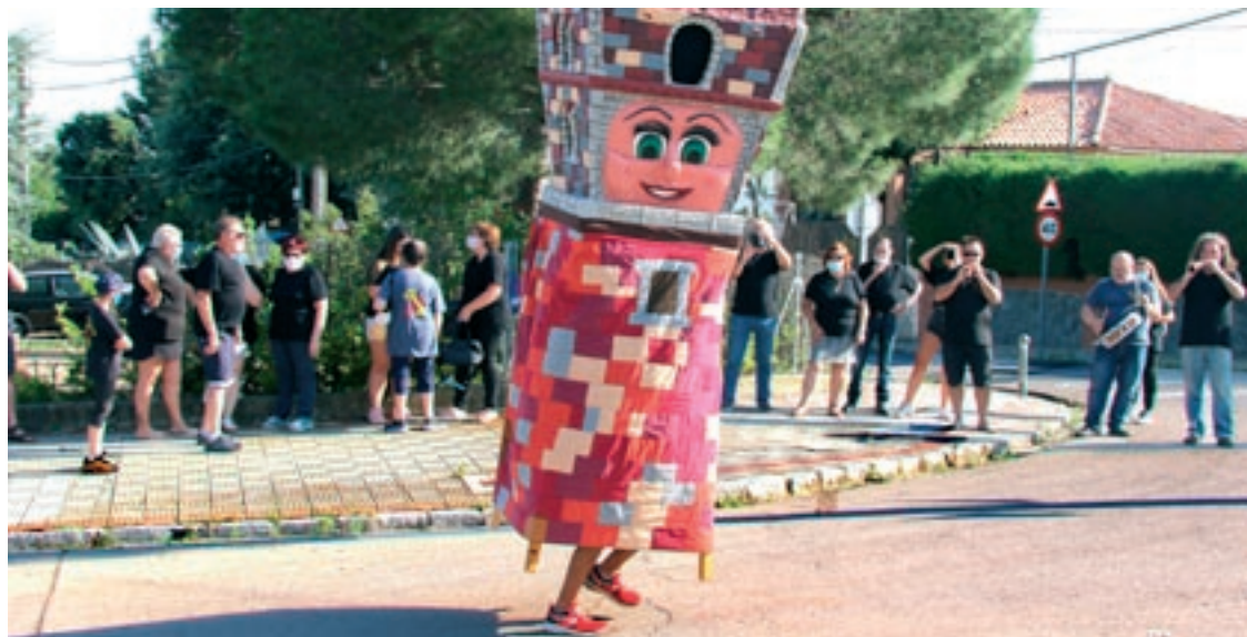
La gegantona Torre Roja en un dels punts de trobada amb el veïns de Sant Pere