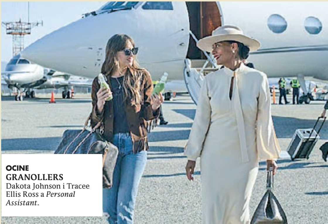
OCINE GRANOLLERS Dakota Johnson i Tracee Ellis Ross a Personal Assistant .