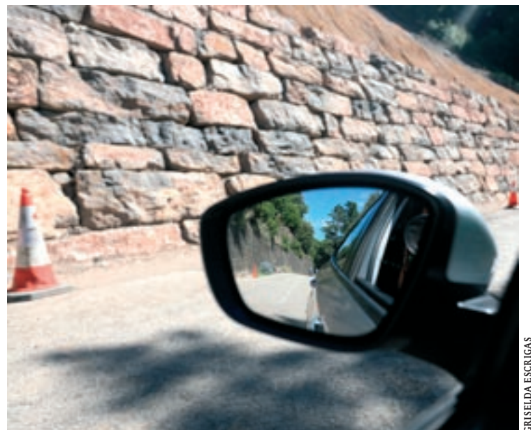
Una de les noves esculleres que protecció que s'han construït a la via

la instal·lació de geomalla i membranes d'alta resistència, reforçades amb cable d'acer i ancoratges. L'obra ha inclòs la reconstrucció d'un mur de formigó de quatre metres d'alçada i les tasques com la reconstrucció del ferm en els trams afectats, la reposició de barreres de seguretat o l'adequació d'elements de drenatge.