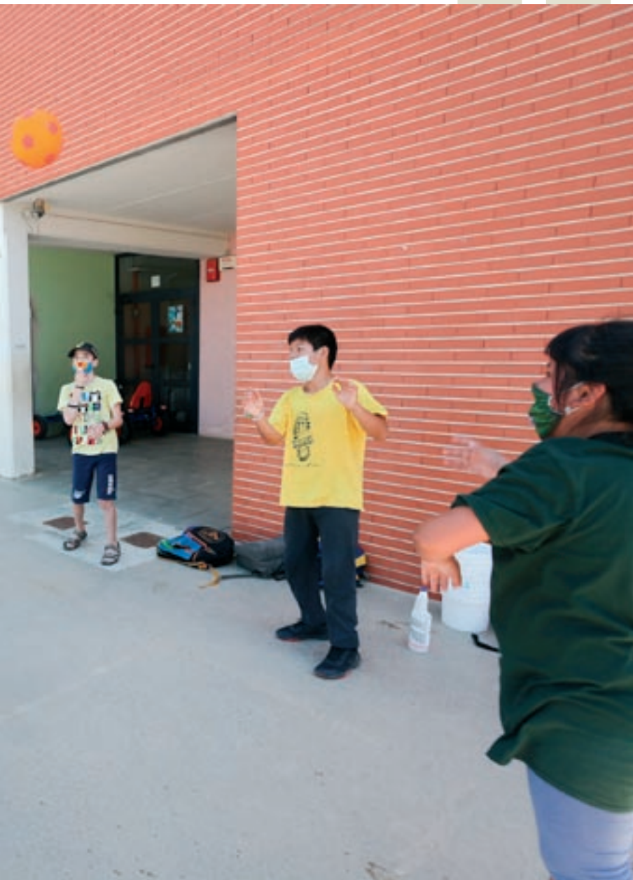
al casal d'estiu de l'institut escola La Tordera de Palautordera

titut Escola la Tordera, de Palautordera, i l'escola Soler de Vilardell de Sant Celoni, també es fa seu aquest curs. "Algunes famílies ens explicaven que els seus fills habitualment no els expliquen res quan tornen de l'escola i el primer dia de venir al casal els ho explicaven tot amb entusiasme. S'ha confirmat el que ja pensàvem: enguany aquests casals són molt i molt necessaris, més