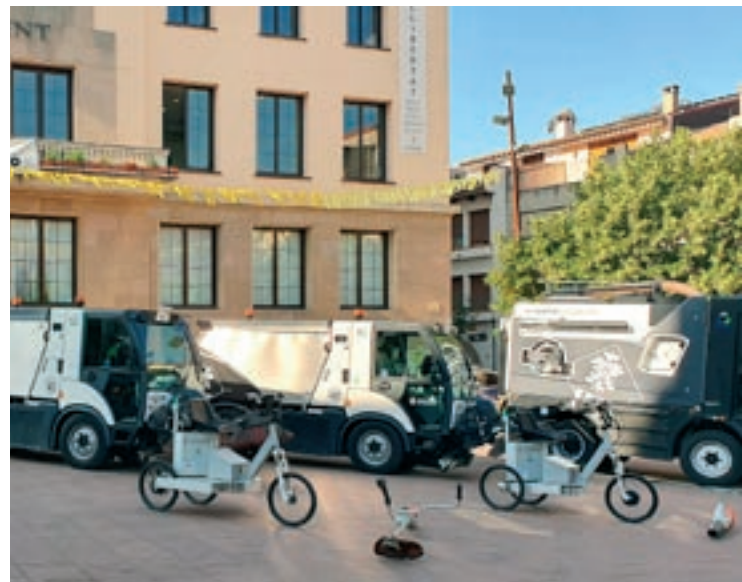
Els nous vehicles aquest divendres a la presentació a la plaça de l'Església

dan. De fet, 8 dels 11 vehicles són elèctrics. Una altra novetat és la incorporació d'un equip de neteja amb aigua calenta a pressió; fins ara només es podia fer en fred. També hi ha sis tricicles elèctrics que facilitaran el trasllat de les persones que escomben des de la base al punt on actuen.