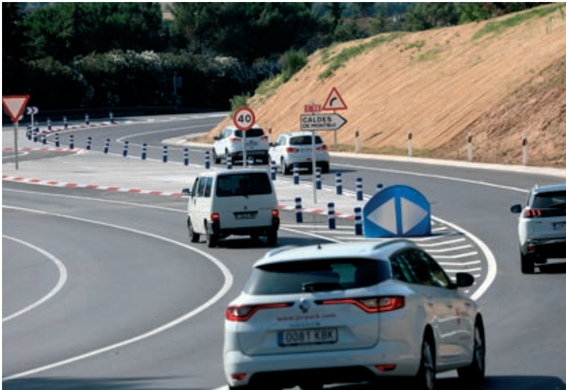
El nou vial permet als vehicles que van en direcció a Caldes seguir la marxa sense haver d'aturar-se a la rotonda