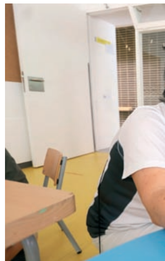
Una monitora juga amb un nen aquest divendres al cas

Pel que fa als espais, s'han de desinfectar abans i després de cada ús i han de ser prou amplis per garantir la distància de 2,5 metres entre nens. A la porta, a més, hi ha un full de control de neteja. Finalment, hi ha un protocol per si es detecta un possible positiu de Covid-19; arribat el cas, la distribució per grups permet traçar les persones amb qui la persona afectada ha estat en contacte.