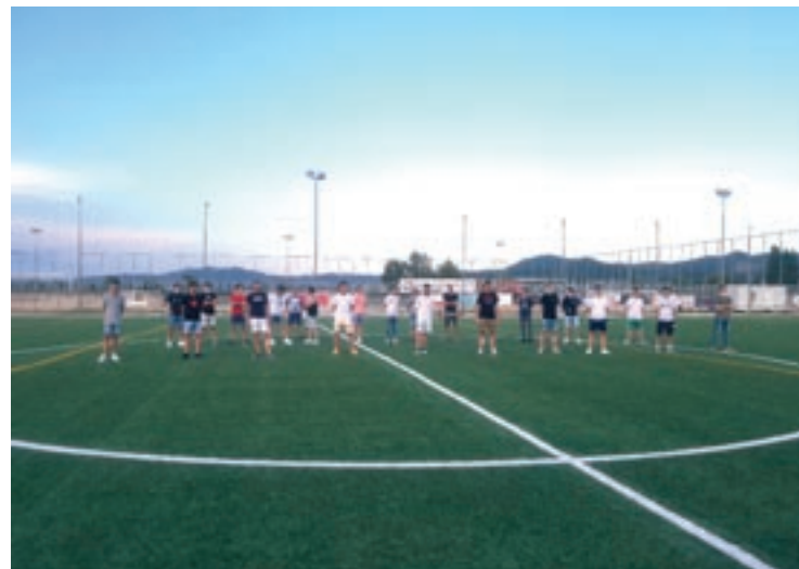
La plantilla de la propera temporada del Mollet forma al centre del camp

El petit dels Espargaró no continuarà a la marca austríaca l'any que ve –tot apunta que fitxarà per Honda–, però sembla decidit a acomiadar-se amb una gran temporada. No en va, des que es va incorporar a KTM el 2017, no ha deixat de millorar els seus resultats al Mundial: 17è el 2017, 14è el 2018 i 11è el 2019. Pol reconeixia que els resultats dels tests el van deixar impressionat. “Estic sorprès amb tot el treball que hem fet. Ha estat una feina molt interessant perquè la moto ha demostrat tenir més grip amb l'asfalt [s'hi agafava més]”, destacava el petit dels Espargaró. El germà gran també es mostrava satisfet amb les prestacions de la nova Aprilia. “Després d'una aturada tan llarga ha estat emocionant tornar. Poder fer moltes voltes ha estat bàsic perquè, tot i que la moto té un gran potencial, necessita rodatge. Misano no és la nostra pista preferida però hem confirmat les bones sensacions”, va ressaltar Aleix.