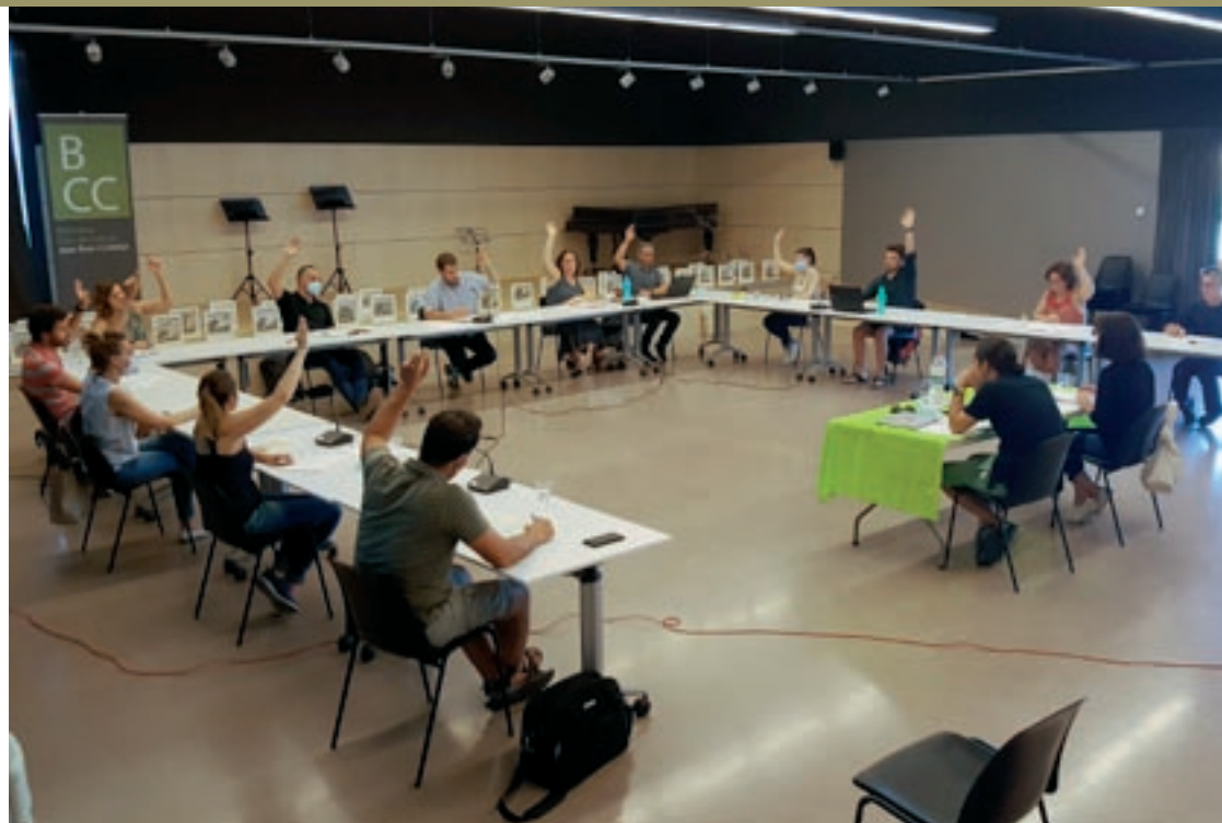
Tots els grups van votar a favor del pla en el ple que es va fer a la sala Pau Casals de la biblioteca

En el bloc de mesures d'emergències destaca una partida de 9.000 euros a ajuts socials per cobrir necessitats bàsiques, evitar la pobresa energètica i inscripcions als casals d'estiu per als infants. 7.000 euros més es destinaran al servei d'atenció domiciliària per a la gent gran, 4.000 per augmentar el suport a l'associació de voluntaris de Protecció Civil, 2.500 en desinfecció de carrers, 1.500 en lots de material escolar, 1.500 a readaptar la fira Lliga't a la Terra, amb repartiment a domicili, 1.000 a l'exempció de les quotes de l'escola bressol i els cursos culturals i educatius de la La Fàbrica i 1.000 més a una campanya de comunicació i