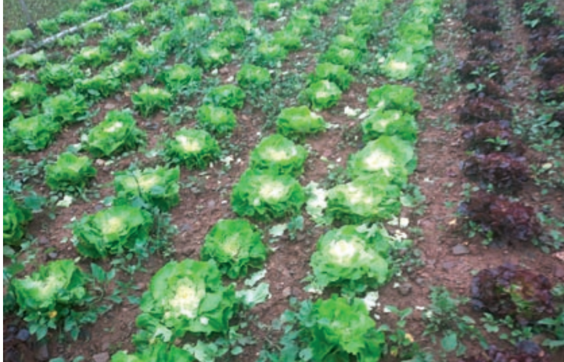
Els senglars es van menjar completament algunes varietats mentre que, en d'altres, només una part