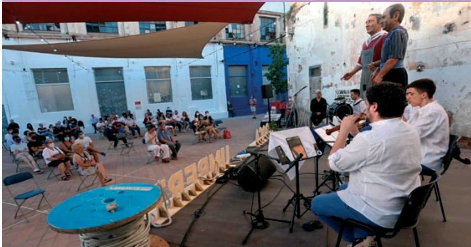
Els components del grup de grallers Els Rajolers interpretant una de les peces amb el públic repartit en petits grups a les quadricules marcades al paviment

► El treball es presenta a Roca Umbert amb un concert d'algun dels temes