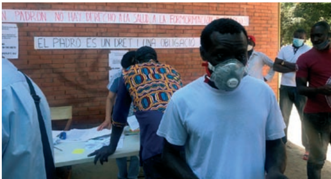
Un centenar de persones es van aplegar diumenge a la plaça Joventut, a Canovelles, on s'havia fet la convocatòria

Oferirà informació i assessorament sobre la diversitat sexual i de gènere i acompanyament en processos personals d'identitat de gènere, orientació sexual i expressió de gènere. També estarà enfocat a assessorar les famílies. Vol donar resposta a situacions de discriminació i a qualsevol necessitat d'acompanyament que tingui la ciutadania sobre diversitat sexual i de gènere.