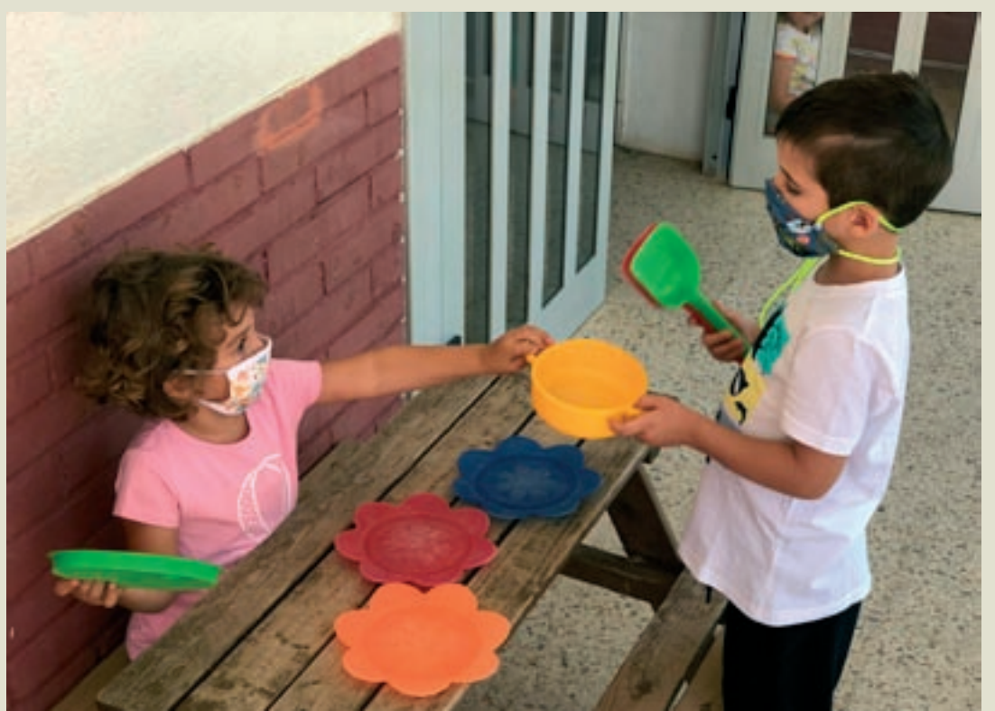
Dos infants juguen amb la mascareta posada, tal com marquen les normes de seguretat per a les distàncies curtes