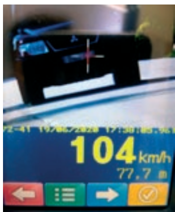
El vehicle enxampat amés de 100

Segons fonts municipals, el trànsit rodat de motocicletes a la carretera d'accés al parc natural del Montseny s'ha reduït gairebé en un 80% en comparació amb les setmanes anteriors. Diumenge de la setmana passada al matí