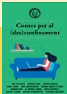
'Contes per al (des)confinament' Div. autors / Males Herbes