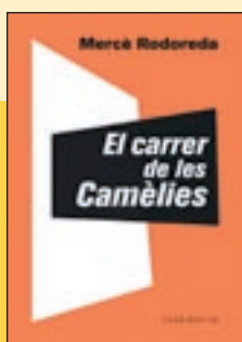
'El carrer de les Camèlies' Mercè Rodoreda / Club Editor