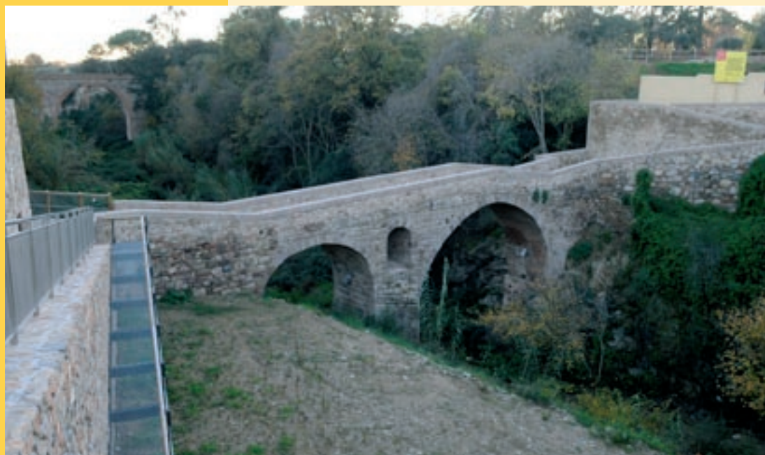
Pont romànic de Caldes de Montbui

Aquesta secció de ponts que avui inaugurem constarà de 10 articles dedicats a diferents ponts de les comarques d'Osona, el Vallès i el Ripollès.