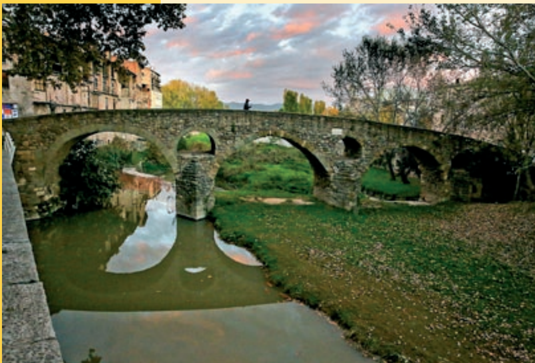
Pont de Queralt Vic

El pont de Queralt, també dit pont de Sant Francesc o de la Calla, és el més antic i espectacular de Vic. Se'l classifica com a pont romà, perquè el més probable és que hagi arribat als nostres dies com a resultat de l'evolució d'un pont originari que els romans van construir a l'antiga ciutat d'Ausa. Datat cap al final del segle XI, el seu pas permetia travessar el riu Mèder i enllaçar des del carrer de Sant Francesc o de la Calla al Portal de Queralt, una de les set portes de la muralla de la ciutat des d'on es controlava el pas de vianants i mercaderies que entraven o sortien de Vic.