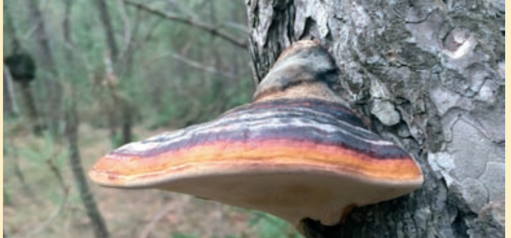
Organismes propis de la maduresa d'un bosc, bolet d'esca (' Fomitopsis pinicola ').

tius. Es pot parlar, per exemple de rodals de bosc amb objectius productius que integren components essencials d'etapes més madures de la successió forestal i que estableixen circuits per caminar, córrer, prendre "banys de bosc" o per a activitats educatives. La integració inclou la preservació d'espècies amenaçades a escala europea i local, així com el manteniment d'estructures d'hàbitat pel conjunt de la biodiversitat, amb una atenció especial per a les espècies clau i els grups funcionals. Per exemple, en un rodal productiu de fusta, en el qual es tallen els arbres molt abans de la seva mortalitat natural, s'hi incorporen arbres grossos i decaiguts que no es tallaran mai, diferents tipus de fusta morta i microhàbitats (per exemple, cavitats en tronc o soques amb epífits) i altres elements diversificadors, com ara les heures i altres lianes enfiladisses i la coberta arbustiva, sense estassar-la totalment per sistema.