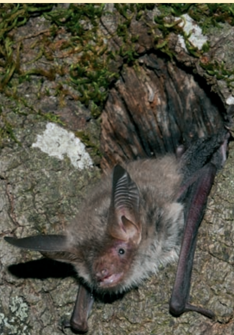
Ratpenat de Bechstein ('Myotis bechsteini').