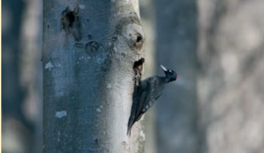
Picot negre (' Dryocopus martius ') a la fageda de la Grevolosa, un ocell que vol arbres de tronc gruixuts on perforar el niu amb el seu potent bec.