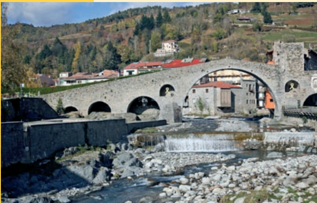
El pont Nou de Camprodon

Declarat bé cultural d'interès nacional, el pont Nou de Camprodon s'alça sobre el riu Ter en el punt on s'uneixen el Ter i el Ritort. Aquesta construcció va ser de gran valor estratègic, atès que va obrir el camí de ferradura cap a la Cerdanya i amb això s'aconseguia comunicar el Ripollès amb la comarca pirinenca de la Cerdanya. Sembla que el pont es va aixecar damunt les restes d'un altre de més antic, raó per la qual a partir d'aquell moment la gent de la vall de Camprodon el va anomenar el pont Nou.