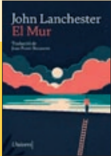
'El mur' John Lanchester Univers

Una inquietant distopia, la que ens porta aquesta novel·la. El Mur és el que protegeix el país-illa des que el nivell del mar va pujar. Sempre pendents de la possible invasió dels Altres. Allà arriba en Kavanagh, un jove que hi ha de complir dos anys de servei. Vigilant. "Al Mur hi fa un fred que pela". Això és el primer que te n'explica tothom.