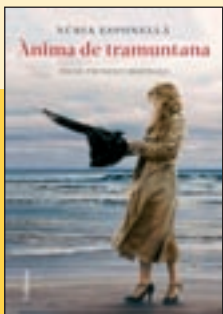
'Ànima de tramuntana' Núria Esponellà Columna

Per primera vegada, tot la narrativa de Montserrat Roig queda recollida en un sol volum. Des del recull Molta roba i poc sabó... i tan neta que la volen , amb el qual va guanyar el Premi Víctor Català de 1970 fins als darrers que va publicar en premsa. Tots plegats dibuixen un recorregut per la seva obra literària, amb il·lustracions de Sònia Pulido.