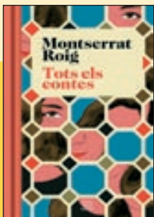
'Tots els contes' Montserrat Roig Rosa dels Vents

Una inquietant distopia, la que ens porta aquesta novel·la. El Mur és el que protegeix el país-illa des que el nivell del mar va pujar. Sempre pendents de la possible invasió dels Altres. Allà arriba en Kavanagh, un jove que hi ha de complir dos anys de servei. Vigilant. "Al Mur hi fa un fred que pela". Això és el primer que te n'explica tothom.