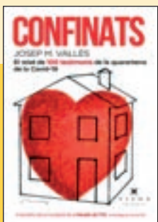
'Confinats' Josep M. Vallès Viena Ed.

La novel·la guanyadora del darrer premi Prudenci Bertrana uneix en la distància dels temps les vides de dues dones. Una és la Mínia, una arqueòloga que excava a la ciutat ibèrica d'Ullastret, enmig d'una situació personal difícil. L'altra és Ekinar, una dona del segle III aC, que viu en una cultura arrelada a la natura.