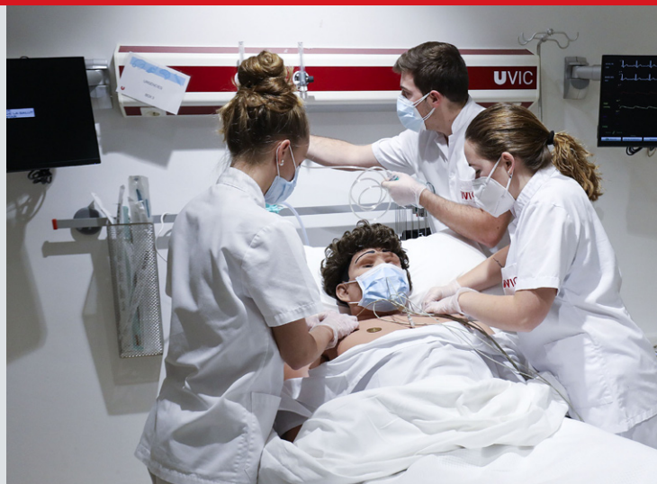
Estudiants d'Infermeria, al box de simulació clínica de la UVic-UCC

El reconeixement social dels professionals sanitaris i les perspectives laborals del sector arran de la pandèmia han fet augmentar els estudiants del grau d'Infermeria de la UVic-UCC. S'ha obert una tercera línia per encabir els 180 alumnes de primer. Davant de l'elevada demanda laboral, estudiants dels últims cursos combinen els estudis amb la feina.