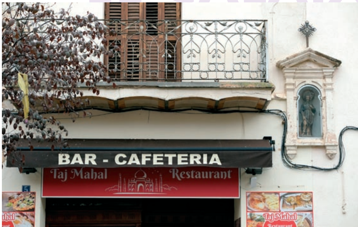
La capelleta de Sant Roc, entre els números 5 i 6 de la plaça de l'Església, és l'element que dona nom al barri

la ciutadania s'hi refereix senzillament com a barri del centre . Entre els números 5 i 6, pràcticament desapareguda a tocar d'un balcó i un establiment i desgastada pel pas del temps i la intempèrie, hi ha la capelleta de Sant Roc, element patrimonial centenari. Aquesta capelleta és el testimoni d'una devoció per aquest sant que ve de