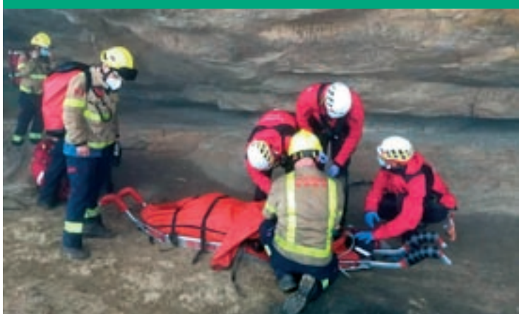
BOMBERS DE LA GENERALITAT

(Pàgina 14) Els Bombers van traslladar el ferit en llitera