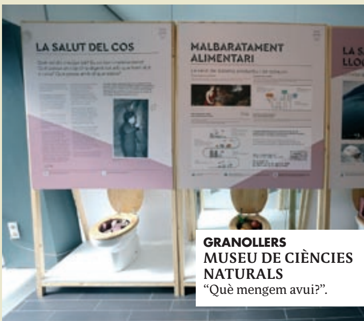
GRANOLLERS MUSEU DE CIÈNCIES NATURALS "Què mengem avui?".