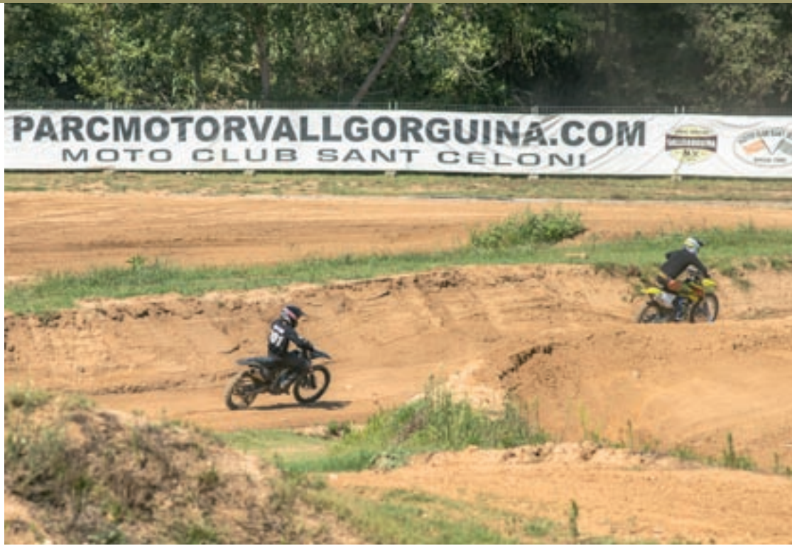
El parc motor de Vallgorguina en una imatge del mes d'agost passat

Si les restriccions per la pandèmia ho permeten, els motors sonen de manera més intensa els caps de setmana fins a l'hora de dinar. Tot i haver complert 18 anys des de la fundació –el 2002–, el Parc Motor segueix, encara ara, sense llicència. Els terrenys estan qualificats com a zona no urbanitzable pel POUM de Vallgorguina. Amb l'opció que es puguin requalificar, segons apunta l'alcal-