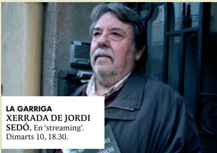
LA GARRIGA XERRADA DE JORDI SEDÓ. En 'streaming'. Dimarts 10, 18.30.

Granollers. Entrega del Premi de Pintura Paco Merino i inauguració d'una selecció de les obres presentades. Espai