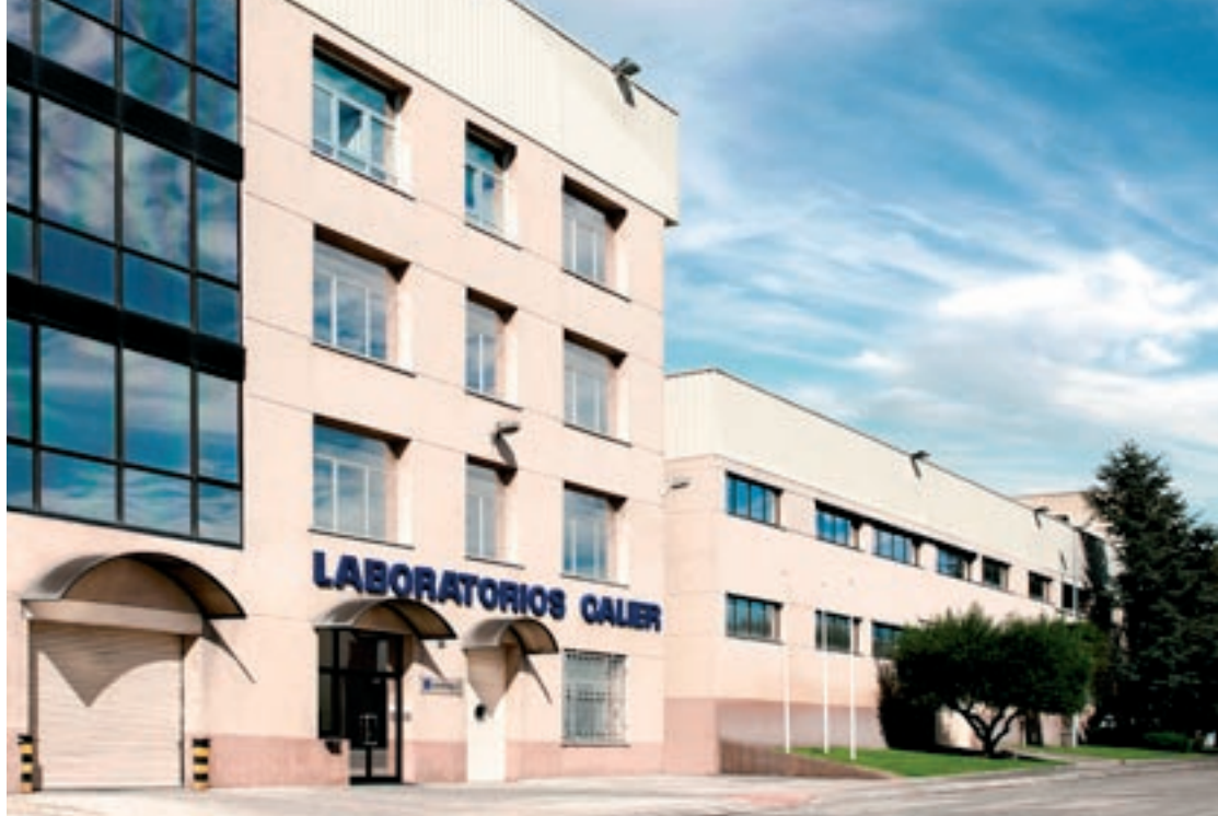
Aspecte exterior de la seu de la companyia al polígon del Ramassar, a les Franqueses

Aquest trasllat ha estat una de les operacions que va portar a terme la companyia en l'exercici passat, durant el qual va treballar en nous projectes d'eficiència a les plantes de les Franqueses i la que té a Lleó. En total, l'empresa va fer inversions per valor de 2,5 milions d'euros en les diverses millores productives i logístiques que va desenvolupar durant l'exercici passat, amb l'objectiu de tenir millor preparació per donar resposta a les exigències