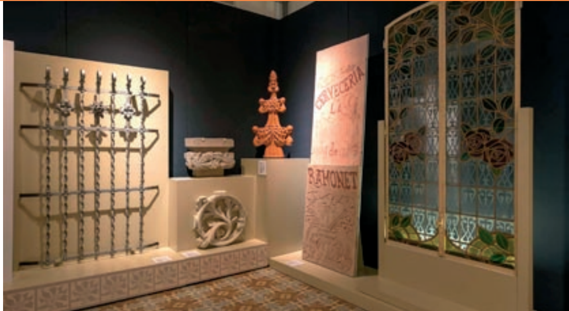
L'exposició es podrà visitar al Museu Abelló fins al 24 de gener

"La natura, la font de la inspiració" és el primer dels quatre àmbits en què s'estructura la mostra i s'hi analitza el procés creatiu dels artistes per capturar la imatge de les plantes i les flors. Es detalla l'estudi directe del món vegetal com a exercici d'observa-