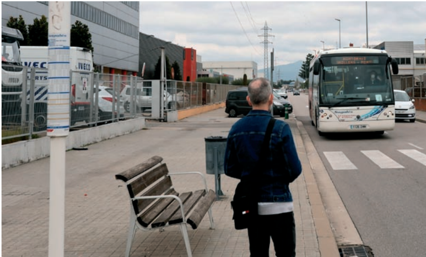
Un treballador espera l'autobús aquest divendres al migdia al polígon Congost, de Granollers, que sí que té accés amb transport públic. En moltes àrees d'activitat econòmica això

El pla pilot preveu una inversió d'1,4 milions en unes actuacions que s'acabaràn de planificar en els propers mesos d'acord amb els ajuntaments. Totes es testaran l'any 2021. El projecte implica les administracions –Generalitat, ajuntaments, Consell Comarcal i organismes públics de sectors relacionats amb la mobilitat– però també el teixit empresarial a través d'organitzacions com Pimec, la Unió Empresarial Intersectorial o l'Agrupació d'Industrials del Baix Vallès, entre d'altres. El pla està pensat pel conjunt de la comarca en un àmbit amb 127 polígons industrials que acullen més de 3.500 empreses. El 33% dels 39 municipis –i el 65% de la població–