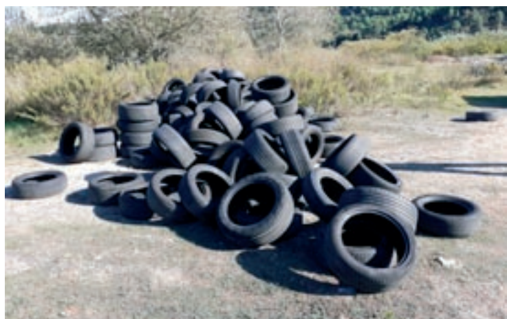
L'abocament dels pneumàtics es va trobar en una zona propera al cementiri

retirar el vehicle accidentat de l'interior del Congost en una operació que es va allargar diverses hores.