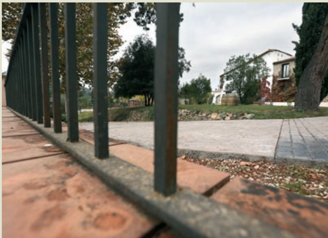
L'hotel Can Galvany està tancat des del confinament