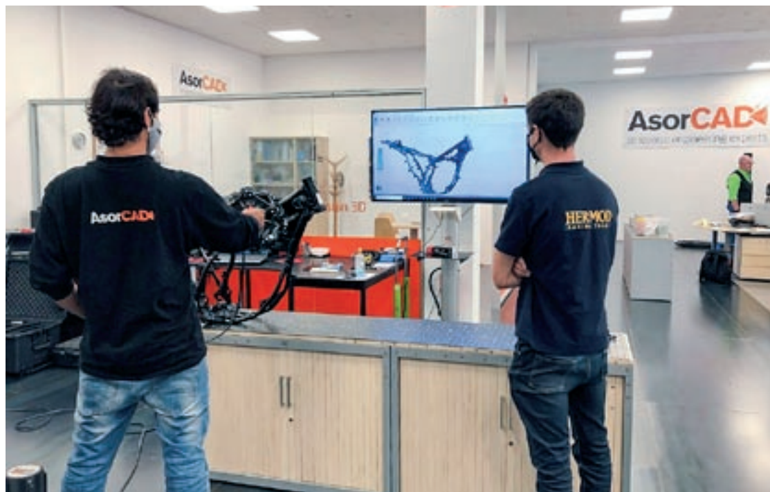
Un dels treballs de disseny de la moto, amb la col·laboració de l'empresa de Parets Asorcad

L'expedient afecta la totalitat de la plantilla, arran de les restriccions imposades per les autoritats sanitàries a les grans superfícies comercials. La secció sindical de Comissions Obreres apunta, però, que l'ERTO s'anirà executant en funció de les necessitats, perquè determinats departaments formen part dels considerats serveis essencials i, a més, una part de l'activitat es pot conservar a través del comerç electrònic. Per aquest motiu, el sindicat considera que l'afectació en el departament logístic es preveu molt limitada. Al contrari que l'ERTO del mes de març, l'empresa no complementarà el salari. Els sindicats han demanat que l'afectació sigui voluntària i que hi hagi rotació en els contractes suspesos.