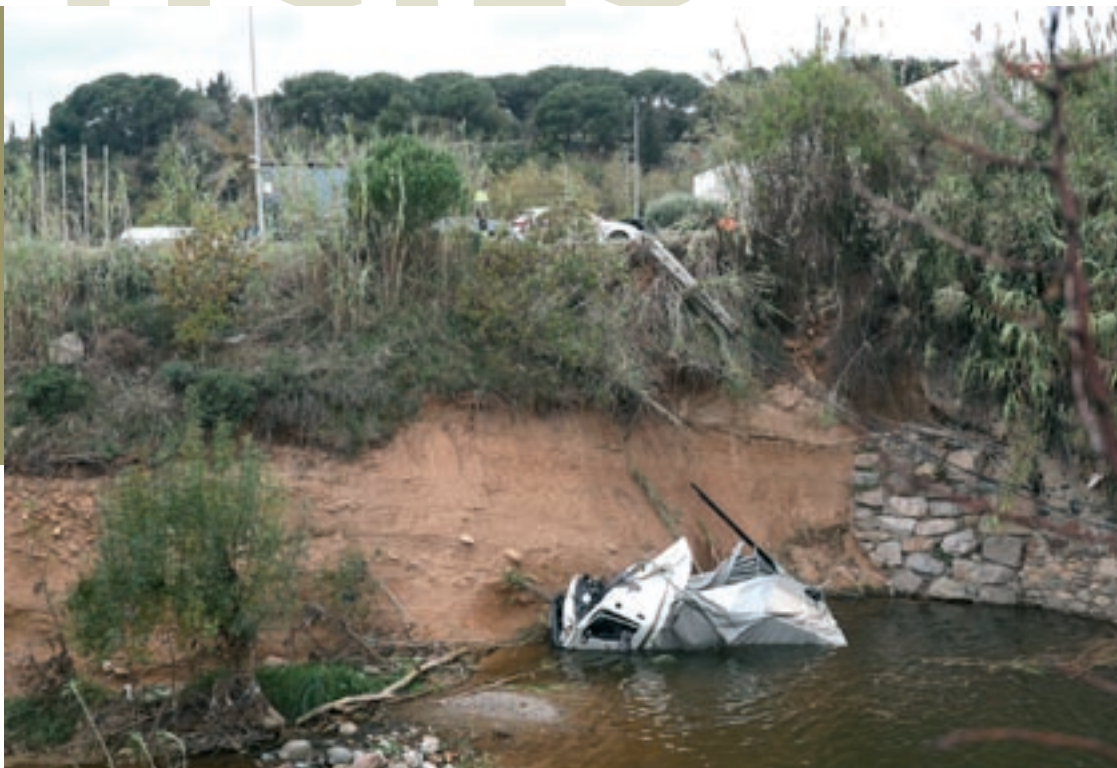
Després de topar amb el fanal i el pal telefònic, el camioner es va precipitar al riu en un punt on hi ha un gorg

El xofer, que presentava ferides lleus, va ser atès al mateix lloc de l'accident i, després, va ser traslladat per efectius del Sistema d'Emergències Mèdiques (SEM) a l'Hospital General de Granollers. La Policia Local