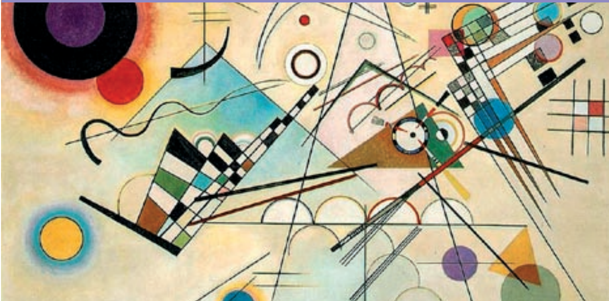
VASSILI KANDINSKI (1866-1944) / GUGGENHEIM MUSEUM (NOVA YORK)