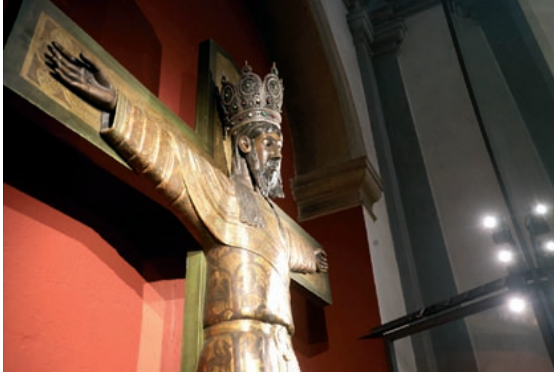
La Santa Majestat de Caldes és una talla romànica amb influències bizantines

La Santa Majestat venerada a l'església parroquial de Santa Maria és la imatge de Crist Majestat. Es tracta d'una reproducció de la imatge antiga que es va cremar el dia 21 de juliol de 1936 durant la Guerra Civil espanyola, a excepció del