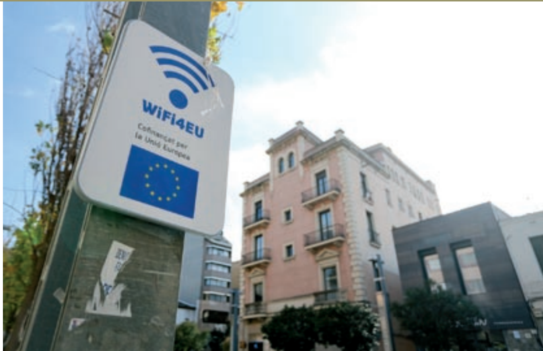
La senyalització de la xarxa instal·lada amb el finançament de la Comissió Europea a la plaça Maluquer i Salvador

Els punts on la xarxa wifi està disponible són: la plaça de la Corona, la plaça de la Porxada, el Museu de Granollers, la plaça Maluquer i Salvador, la biblioteca de Can Pedrals, l'edifici de l'antic AISS, el parc Torras Villà, el Parc Firal, el centre cívic de Can Bassa, el centre cívic Jaume Oller i el Museu de Ciències Naturals La Tela. Un cartell informa en tots aquests espais de l'existència d'aquesta xarxa wifi. Hi ha la