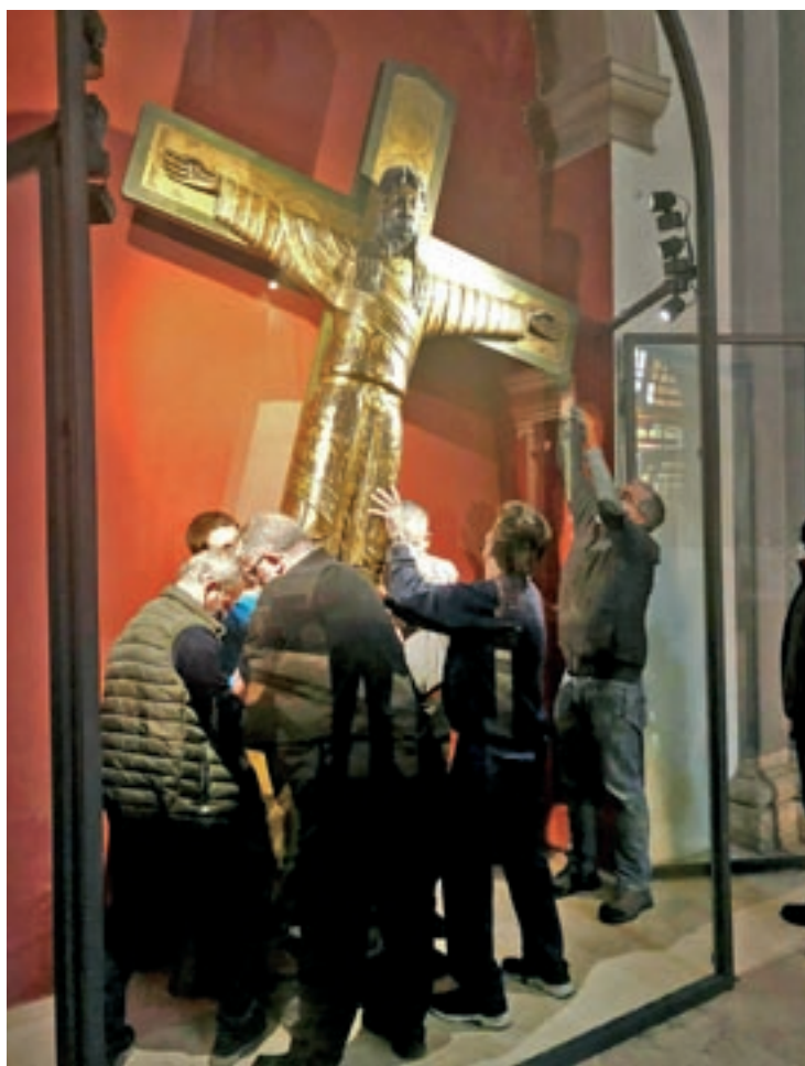
Diverses persones van despenjar la talla per al seu trasllat

cap, que es va poder salvar del mig de les flames. "És una talla romànica amb influències bizantines, de fusta massissa que constitueix una autèntica joia escultòrica, que molta gent ja voldria tenir", considera mossèn Blanco. Des de la parròquia ja fa temps que es treballa per posar-la en valor i donar-la a conèixer molt més, ja que consideren que és poc coneguda tenint en compte la seva importància. "Li volem donar més prota-