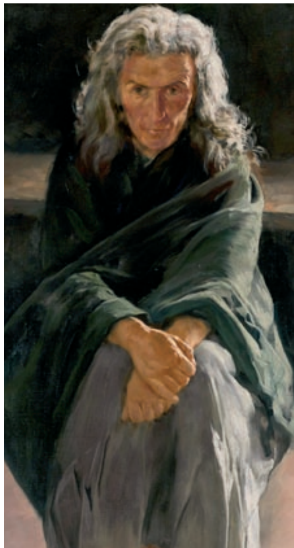
ANTONI FABRÉS (1854-1938)

El sentiment individualitzat –o sigui, el fet de decidir des del jo– domina les societats on les persones estan poc evolucionades, amb unes ànimes presoneres centrades en elles mateixes, això és l'origen de les grans solituds i de molts malestars