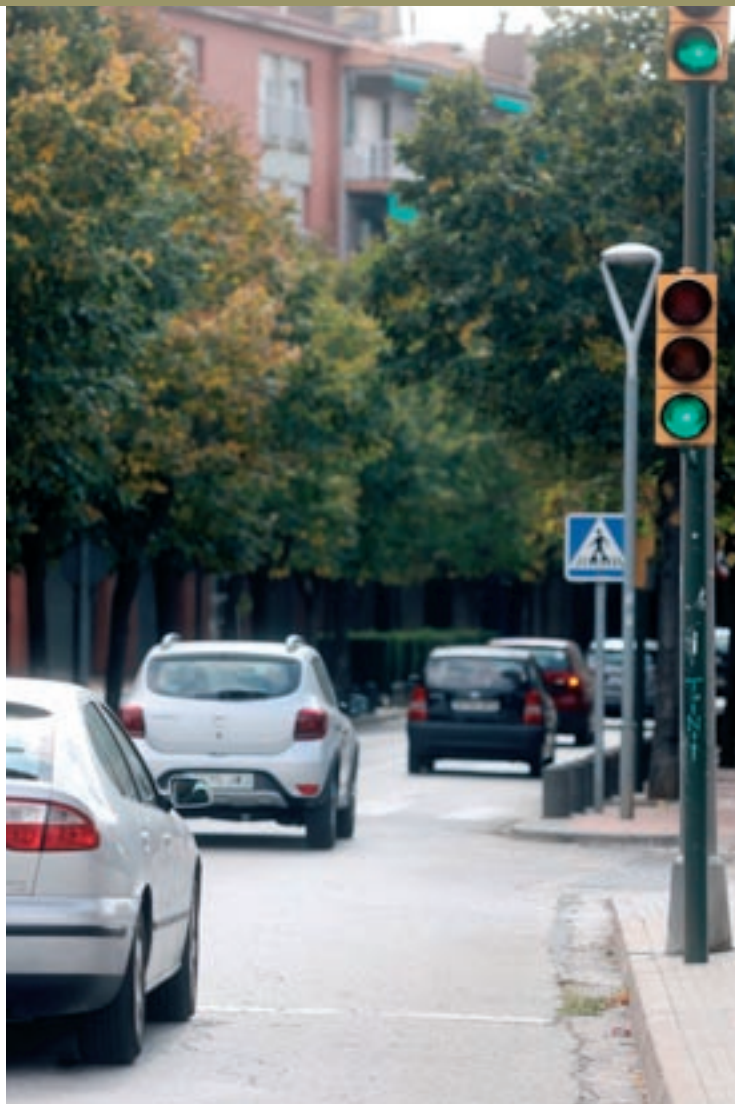
La cruïlla dels carrers Vic i Doctor Robert és la única regulada per semàfors

A la vegada, l'Ajuntament vol solucionar les barreres arquitectòniques que hi ha actualment en aquesta cruï-