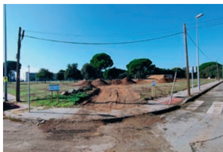
A curt termini, l'Escola tindrà un circuit de BMX i un altre de BTT

L'equipament s'està construint al polígon del Pla de Llerona