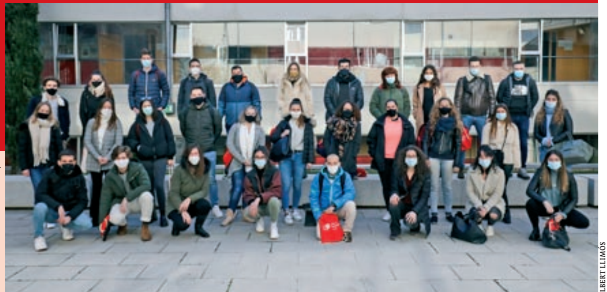
Foto de família amb tots els nous estudiants de la UVic-UCC durant els propers mesos

de descobrir una nova cultura, una nova ciutat, d'aprendre a viure pel seu compte i, sobretot, d'enriquir el seu currículum i la seva formació personal i professional. A la contraportada parlem amb cinc d'ells una setmana després de la seva arribada a la capital osonenca.