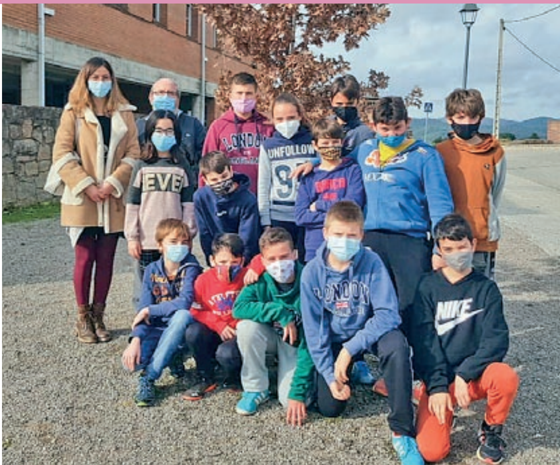
El grup que s'ha creat a l'escola Els Roures de Sant Feliu Sasserra, que ha pres el nom de Roures Art

Per a la seva creació s'han tingut en compte diferents fases que passen entre altres pel disseny i la imatge de l'entitat, la tria de productes, la cerca de finançament, i finalment la venda i els beneficis, que aniran destinats a projectes socials. Es treballen les competències de manera transversal i es fomenta l'esperit empre-