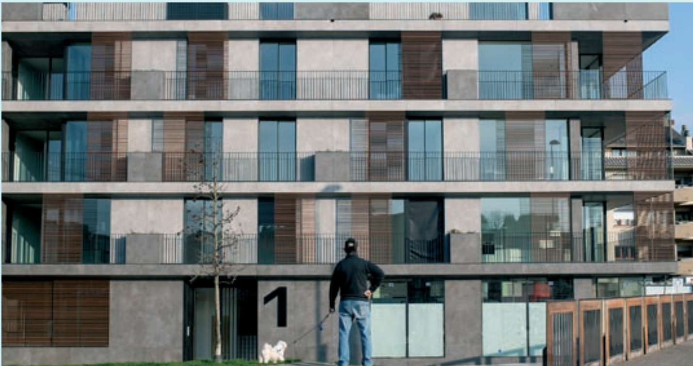
Edifici plurifamiliar de nova construcció a Vic