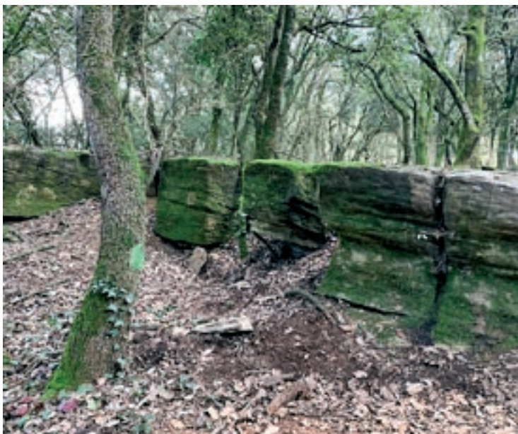
Les roques on va tenir lloc l'accident

cos, i també dues ambulàncies i l'helicòpter del SEM, a banda d'efectius dels Mossos d'Esquadra.