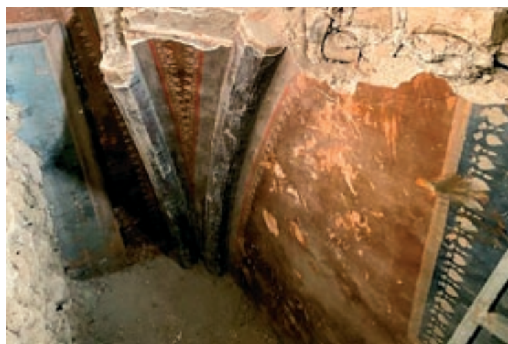
AJUNTAMENT DE RIPOLL

19 alumnes de 4t C de l'escola Guillem de Montrodon, de Vic, que treballen la comarca, han visitat les instal·lacions d'EL 9 NOU, EL 9 TV i EL 9 FM. La visita s'ha fet tenint en compte totes les mesures de seguretat.