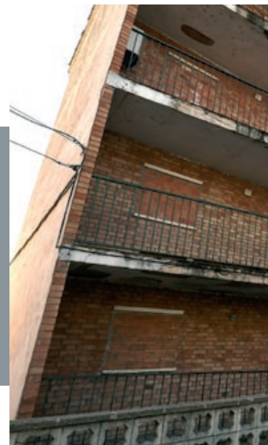
L'edifici de l'antiga caserna, divendres passat

Amb aquest acord es posa fi a un llarg litigi que va començar quan l'Ajuntament es va remetre al conveni de cessió del terreny signat el 1970, que estableix el seu dret a recuperar-ne la titularitat si 30 anys després la caserna deixava de donar servei, com així va ser. El Ministeri va reconèixer aquest principi de reversió, però no estava disposat a regalar l'edifici a cost zero i en demanava mig milió d'euros. Des del primer moment, l'Ajuntament va considerar el preu excessiu i llavors va prendre una