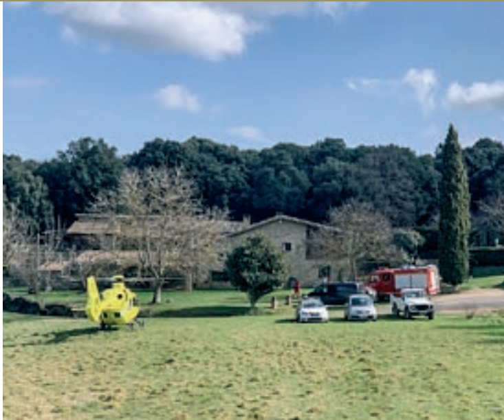
Els helicòpters van aterrar al Bosc del Quer, el punt més proper al sinistre

Fins a la zona s'hi va desplaçar un helicòpter amb la unitat sanitaritzada del Grup d'Actuacions Especials (GRAE) dels Bombers i una dotació terrestre del mateix