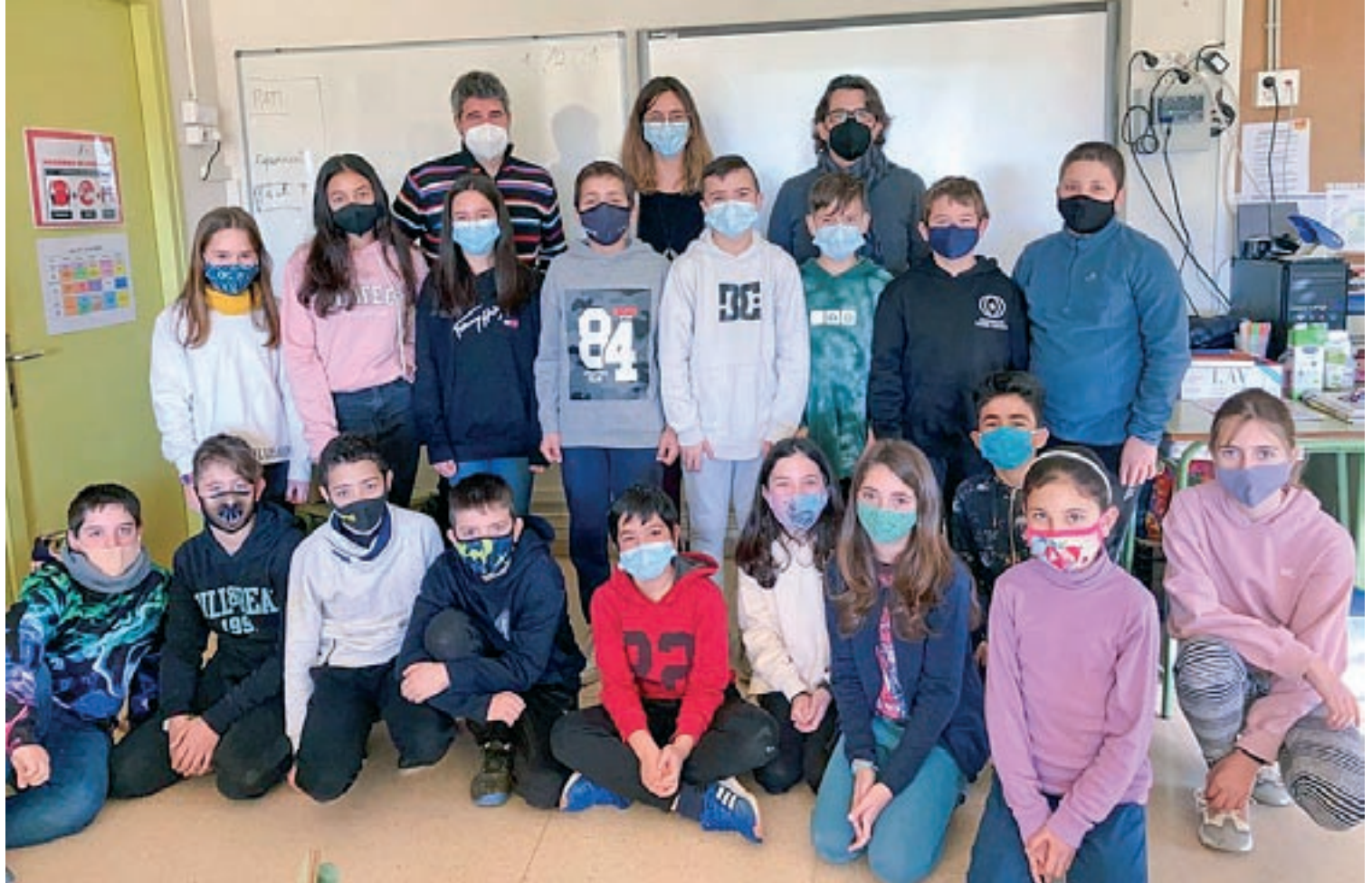
La cooperativa escolar que s'ha creat a l'escola La Monjoia, de Sant Bartomeu del Grau, que es presenten com a Crafters

El calendari del Lluçanès anima a redescobrir edificis barrocs i neoclàssics