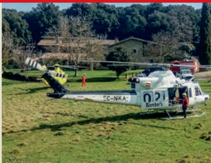
Els helicòpters van aterrar al Bosc del Quer, el punt més proper al sinistre

Un veí de Centelles de 71 anys va morir aquest diumenge després de patir un accident amb bicicleta al camí de la Carena, que enllaça Sant Julià de Vilatorrada amb el santuari de Puig-l'agulla. Es va activar un helicòpter dels Bombers i un altre del SEM, però no van poder fer res per salvar-li la vida.