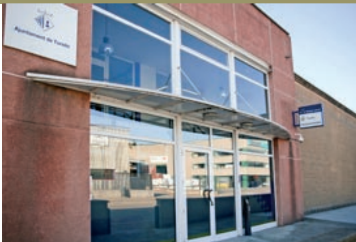
La comissaria de la Policia Local de Torelló, al carrer del Ter

una mesura d'autodefensa dels mateixos policies i que utilitzen altres policies locals –cap de les d'Osona i el Ripollès–. Segons el cap, “no porten arma i s'hauria de trobar una solució” ja que, assegura, “estan sotmesos a uns riscos i hi ha el nivell d'alerta terrorista”. Actualment aquests agents interins ja porten, a banda d'una porra, un petit esprai de gas pebre, els mateixos que pot adquirir qualsevol ciutadà. Gràcia comenta que aquests esprais “fan un núvol i no van tant directament a la persona que vol fer una actuació”, per exemple, algú a qui cal reduir per algun fet determinat. Utilitzar la pistola de gas pebre suposaria “sofisticar” el que ja estan utilitzant fins ara, i tot i que