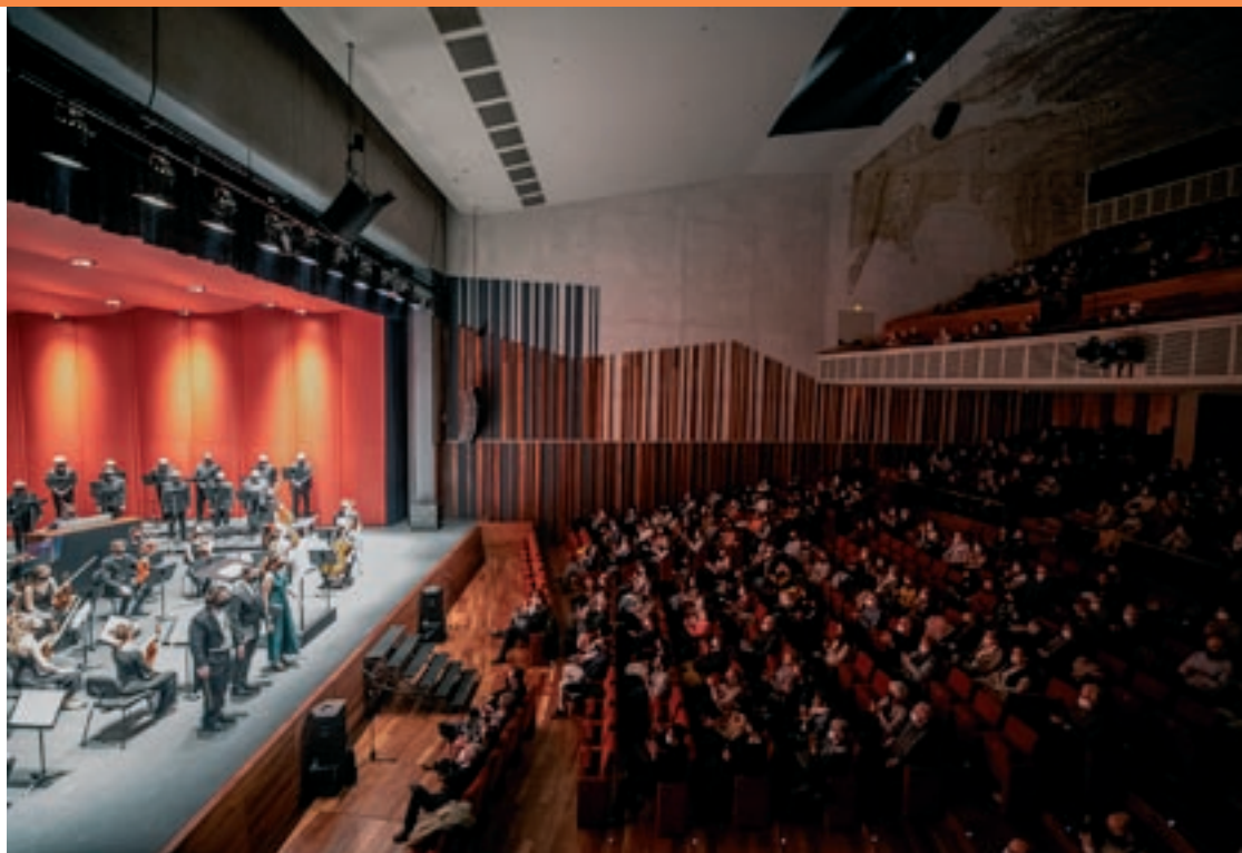
Músics i platea, aquest diumenge a la tarda a la Sala Ramon Montanyà de L'Atlàntida

La Cantata BWV 131 de J. S. Bach va obrir el concert, o va trencar el silenci després