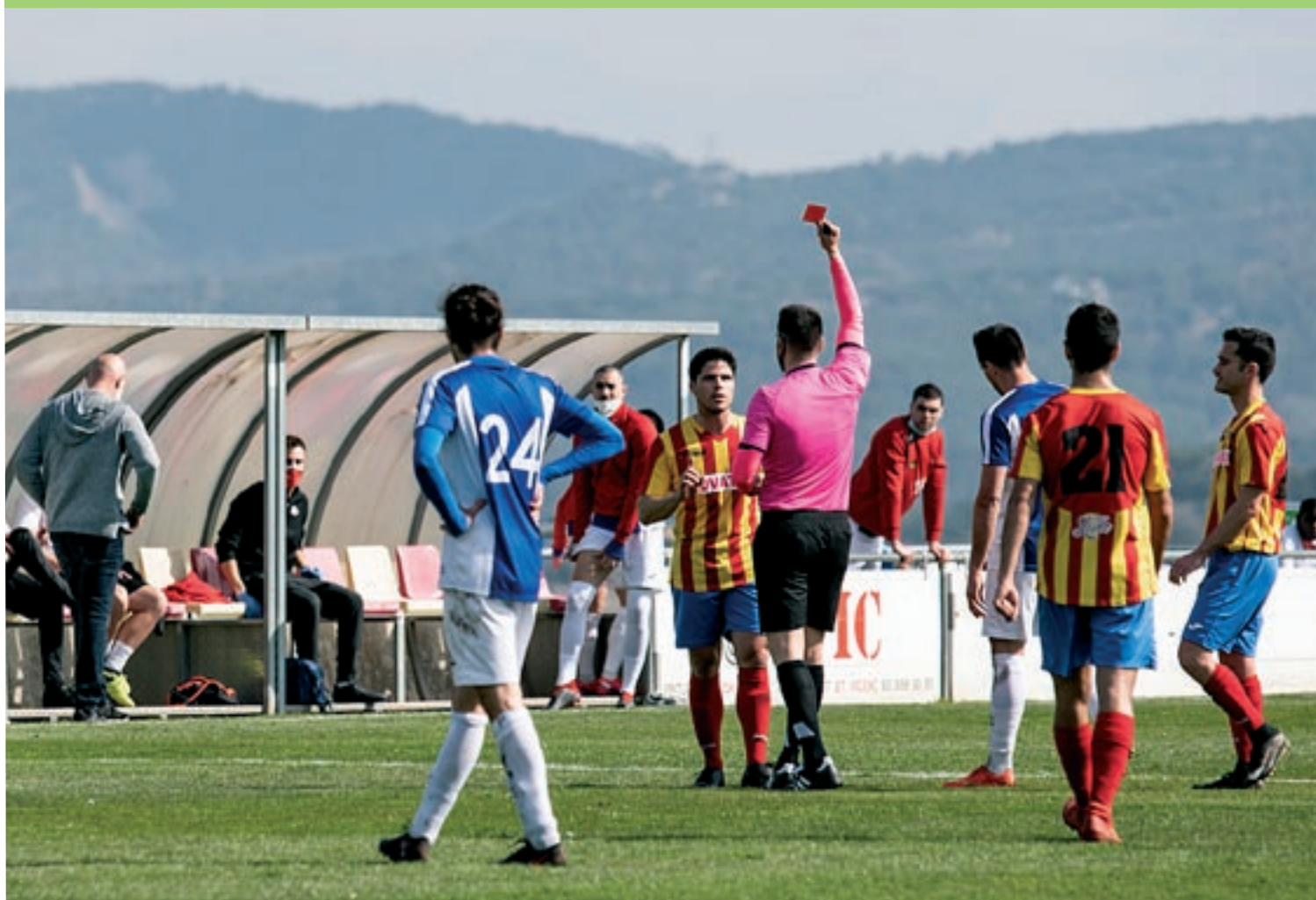
Els vigatans van ser molt superiors a un Tona que va jugar més de 60 minuts amb nou jugadors

El conjunt d'Albert Cámara supera clarament el Tona per 0 a 4