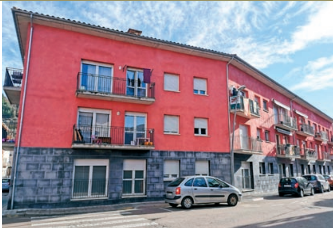
Vista del bloc de pisos, pel qual el consistori haurà de pagar una indemnització de mig milió d'euros