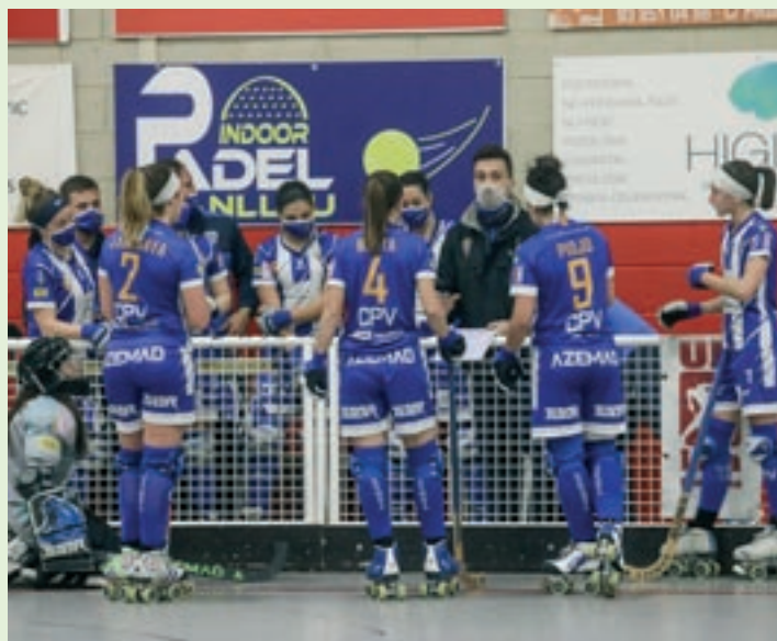
Banquetes del Manlleu Magic Studio i el Voltregà Stern Motor

quatre detalls i tenir més gana de gol. Si fem tot això, estic segur que podem fer