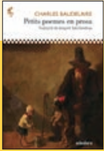
'Petits poemes en prosa' Charles Baudelaire Ed. Adesiara

Es compleixen 200 anys del naixement de Charles Baudelaire. Bon moment, sens dubte, per recuperar els Petits poemes en prosa , una obra fonamental que és, de fet, la primera gran creació d'aquest gènere, on emergeixen la malenconia, el pas del temps o la crítica a la hipocresia social. Joaquim Sala-Sanahuja és l'autor d'aquesta traducció.