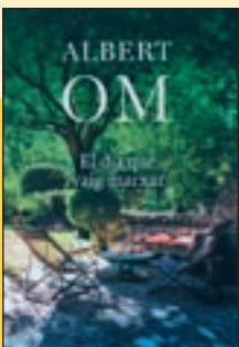
'El dia que vaig marxar' Albert Om Univers

Es compleixen 200 anys del naixement de Charles Baudelaire. Bon moment, sens dubte, per recuperar els Petits poemes en prosa , una obra fonamental que és, de fet, la primera gran creació d'aquest gènere, on emergeixen la malenconia, el pas del temps o la crítica a la hipocresia social. Joaquim Sala-Sanahuja és l'autor d'aquesta traducció.