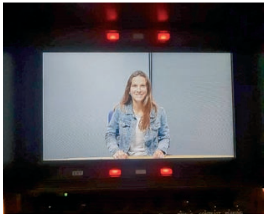
d'un gol i una imatge durant una pràctica al plató de televisió de la UVic

La meua intenció com a periodista no és treballar en el món esportiu. Tot i que m'agrada moltíssim i jo sense el futbol no podria viure, voldria posar-me en altres àmbits com informatius o periodisme polític. De moment amb el periodisme esportiu no m'hi posaria perquè ja ho tinc al meu dia a dia, per tant m'agradaria conèixer altres coses. Però tinc clar que si em criden per comentar algun partit de futbol femení no m'ho pensaré dues vegades.