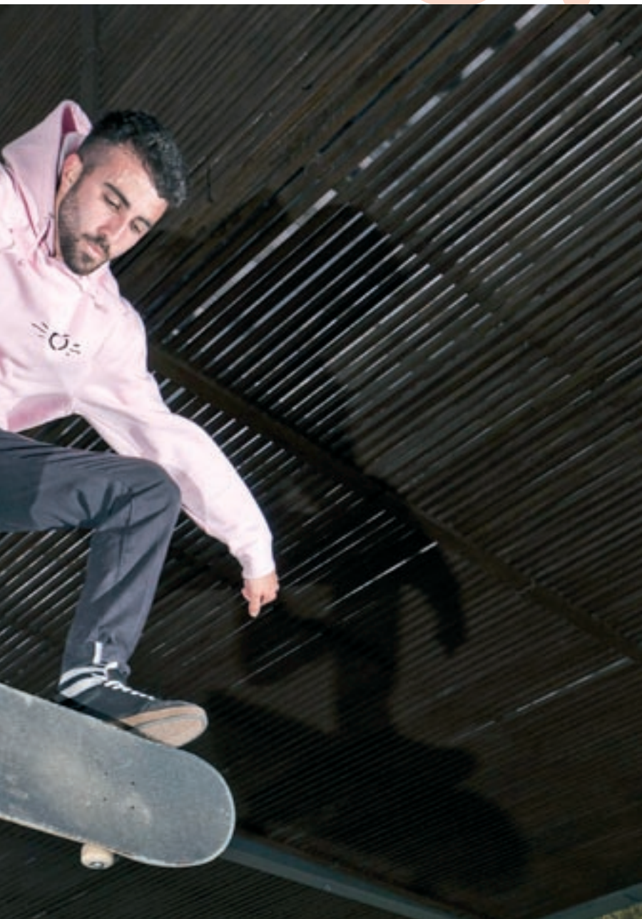
ra ha creat una acadèmia en línia de 'skateboarding'