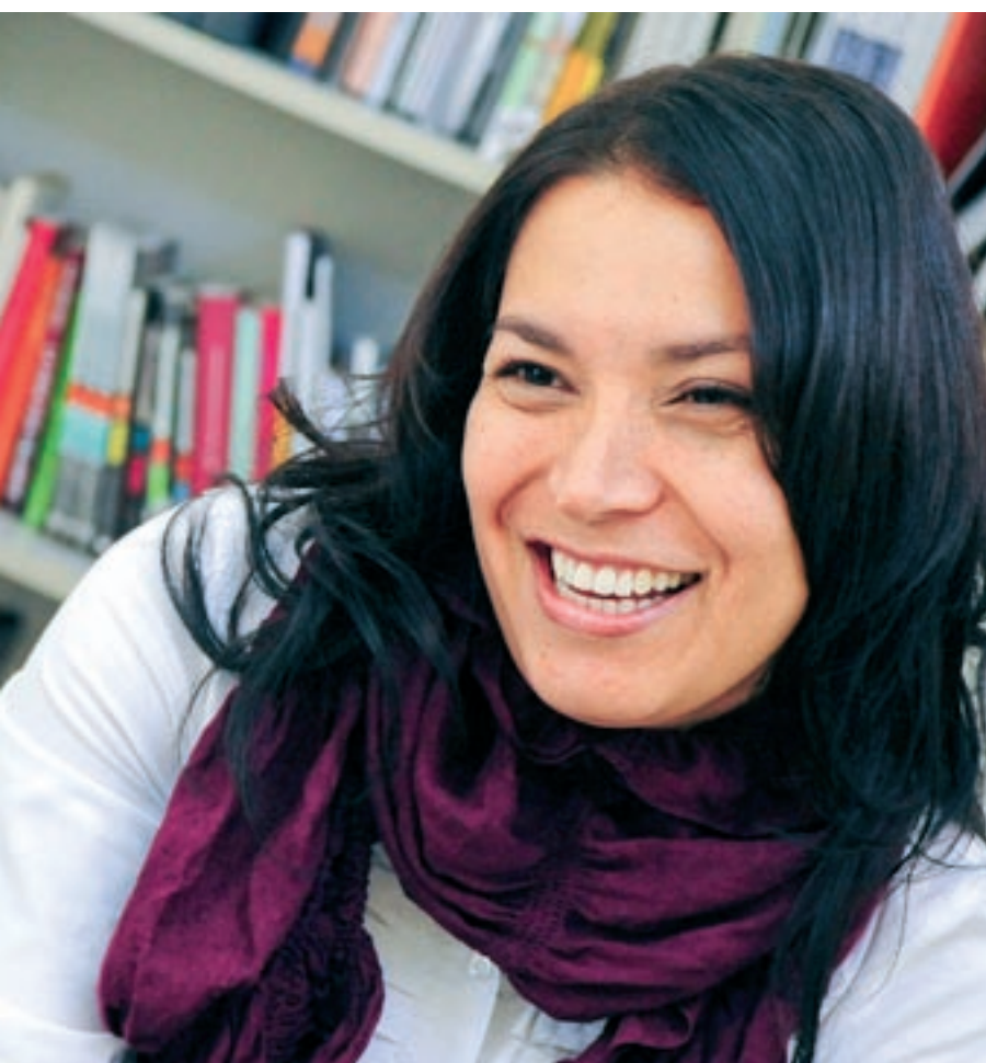
en continguts multimèdia

equiparable amb tot el treball que han tingut darrere". En general, les xarxes socials necessiten les persones que volen estar dins i, sobretot, volen influencers que tinguin estructurades moltes facetes: dominar el tema dels continguts, el màrqueting i