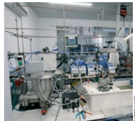
umann. A la dreta, diferents aspectes dels laboratoris, centre d'anàlisi i plantes pilot de diversos projectes