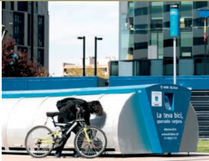
Un dels Bicibox instal·lats per l'Àrea Metropolitana de Barcelona

L'Ajuntament de Granollers iniciarà després de l'estiu –en concret, al mes de setembre– els treballs per a la instal·lació de nou mòduls tancats per aparcar bicicletes de manera segura a la via pública. Es col·locaran en nou punts diferents de la ciutat, la majoria prop d'equipaments. El consistori ha adjudicat a l'empresa Semab el contracte per proveir i instal·lar els mòduls, que tindran capacitat per a cinc bicis cadascun. Es gestionaran a través d'una aplicació per a telèfons mòbils que permetrà als usuaris obrir-los i tancar-los per deixar-hi la bicicleta. És un sistema similar al que ja funciona a l'aparcament per a bicicletes que hi ha al costat de l'estació de Granollers-Centre, que es va estrenar el febrer de 2020. De fet, el funcionament de tots els aparcaments està previst que quedi integrat a la mateixa plataforma. L'adjudicació ja s'ha fet per poc més de 115.000 euros i el contracte entre l'Ajuntament i l'empresa ja està signat. Només dues empreses