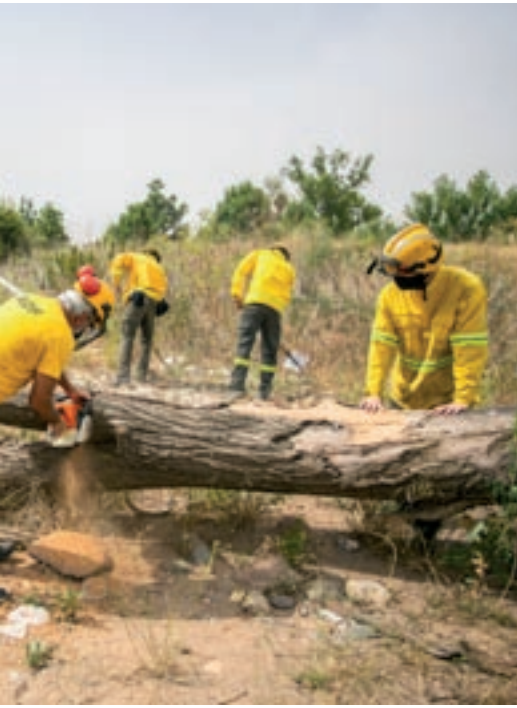
Pràctiques amb eines manuals dissabte a les Franqueses