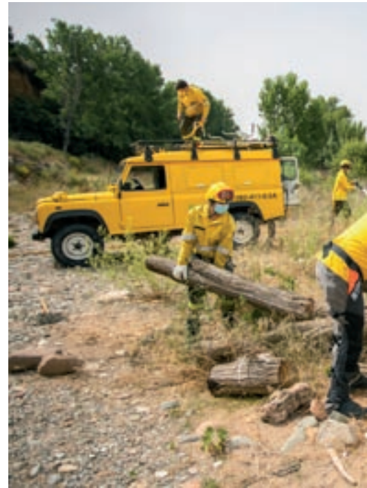
Membres del GREM de l'ADF Montseny Congost feien p

Mayà preveu un "comportament normal d'estiu", en què "hi ha d'haver focs" per les característiques del clima mediterrani. Sí, però, que "va un parell de setmanes avançat perquè la primavera ha estat seca". El nombre absolut d'incendis a la Regió Metropolitana Nord –i al conjunt de Catalunya– està una mica per damunt de