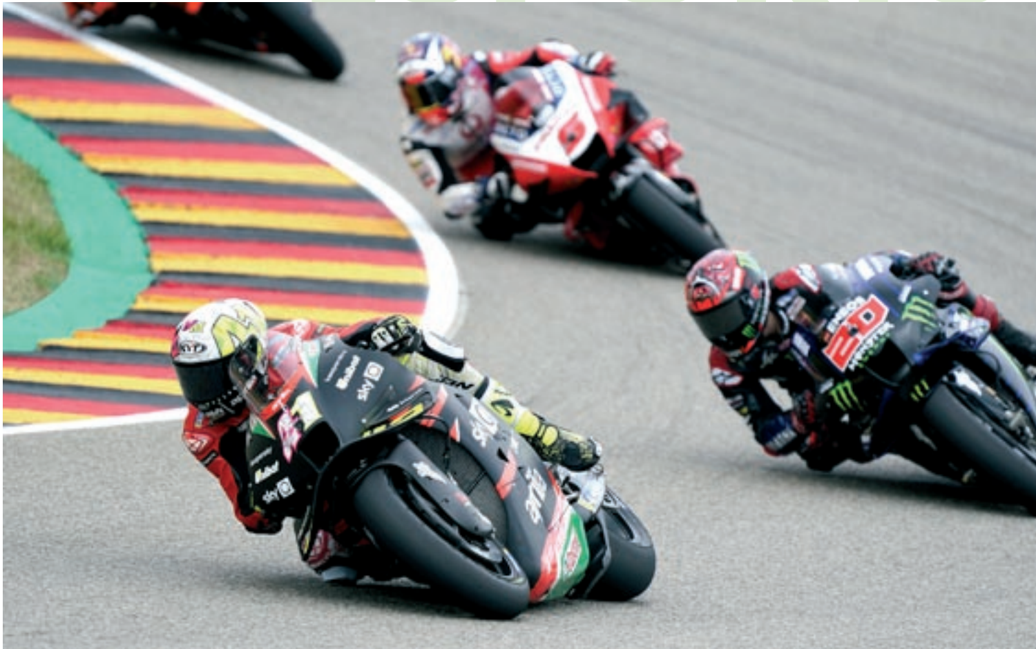
Aleix Espargaró roda davant de Miguel Oliveira, segon al Gran Premi d'Alemanya. El Circuit d'Assen acollirà una nova cursa aquest proper cap de setmana