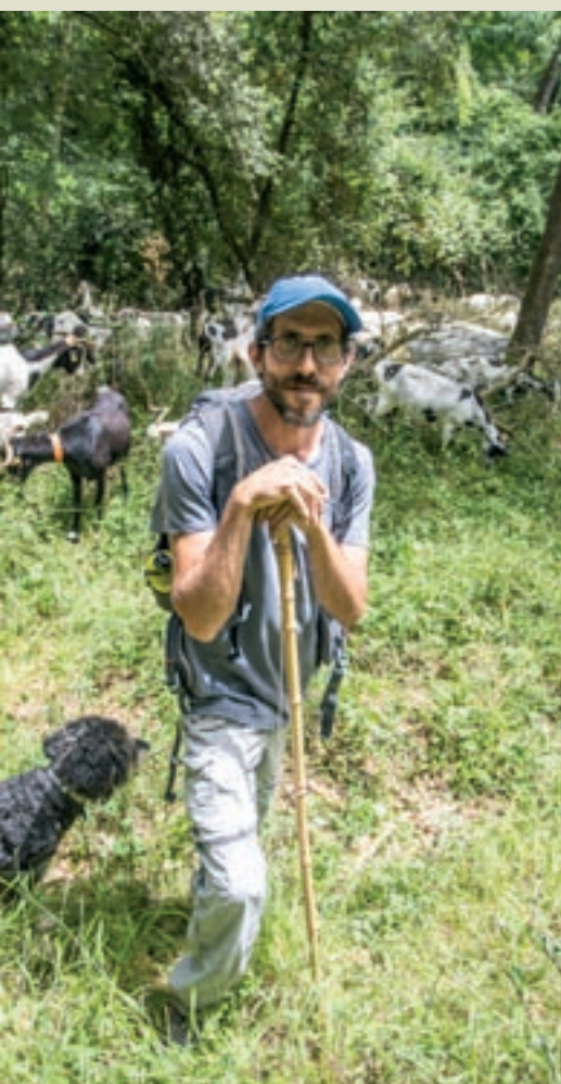
Pasturant a l'entorn de barris de Sant Pere dissabte