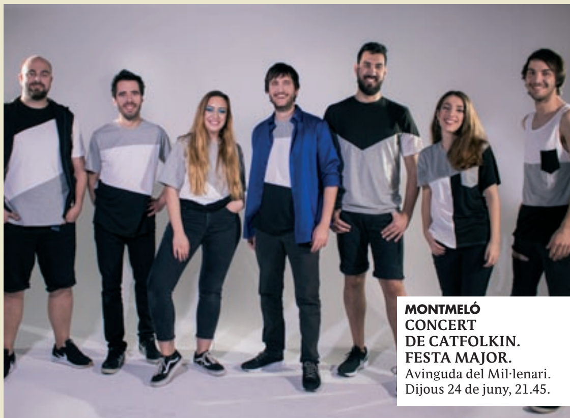
MONTMELÓ CONCERT DE CATFOLKIN. FESTA MAJOR. Avinguda del Mil·lenari. Dijous 24 de juny, 21.45.

Granollers. "Obrim les cartes de la postguerra". Taller de descripció de correspondència històrica.