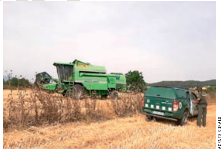
Una parella d'agents rurals en un camp de la Roca que se segava divendres

Nebot també recorda el risc afegit que representa, al Vallès, l'existència de nuclis importants de població envoltats de boscos. “Cal traslladar el missatge de risc perquè la gent faci autoprotecció.” I, en cas d'incendi actiu, “fer cas de les autoritats és sagrat”.