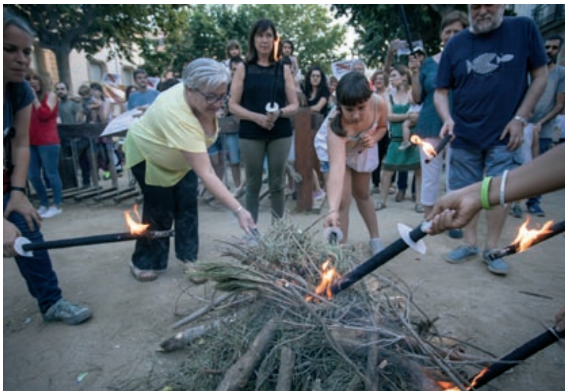
L’arribada de la Flama del Canigó a Cardedeu, ara fa dos anys

A Granollers, la flama arribarà fins al carrer Anselm