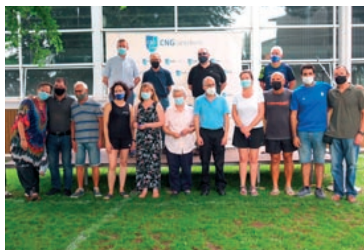
Alguns dels socis que el Club va reconèixer durant la Diada del Soci

L'entitat va homenatjar una cinquantena de persones