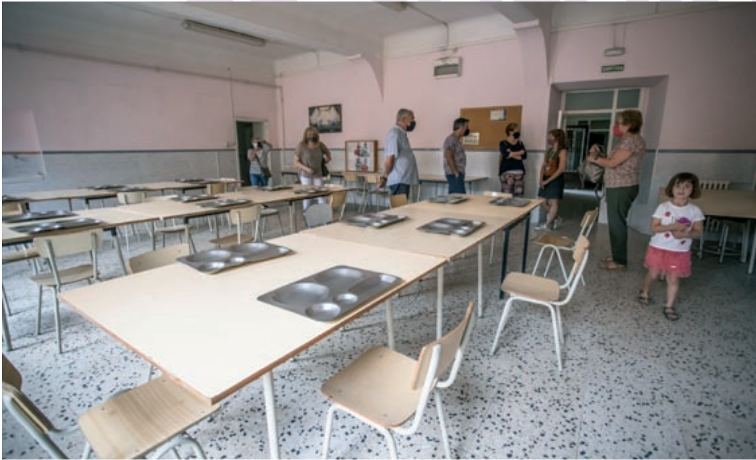
Els visitants van poder fer un recorregut per diferents espais de l'escola, com el menjador