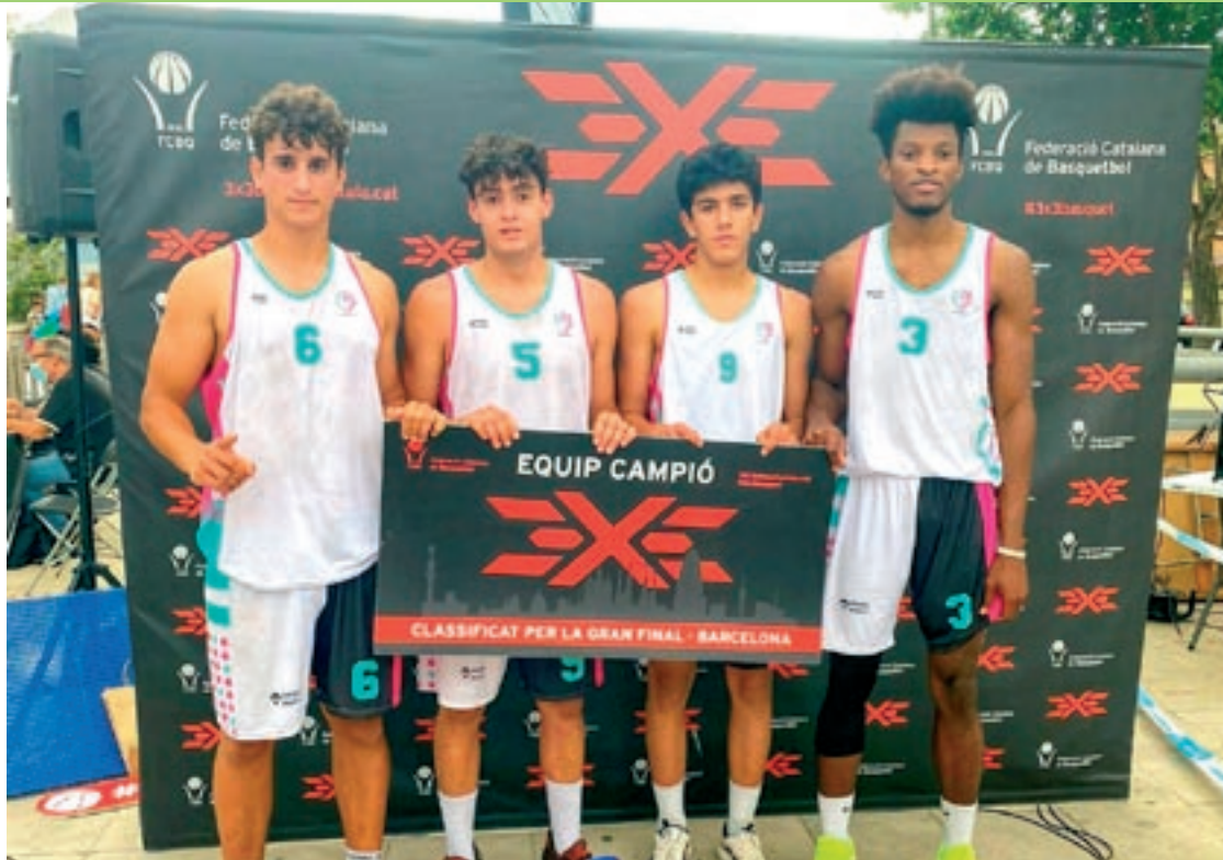
L'equip vallesà que anirà a Pau es va proclamar campió del primer torneig del Circuit Català, a Badalona

Al torneig de Pau els integrants de The 3x3 Academy