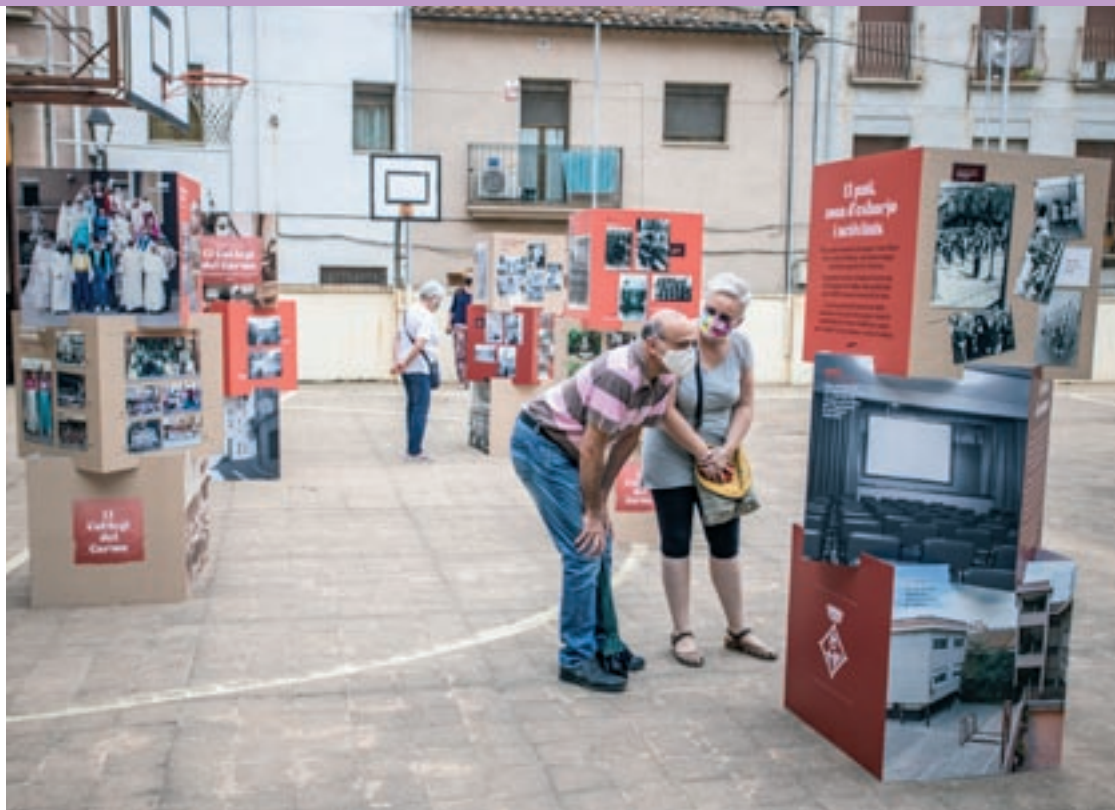
Al pati del centre hi havia una petita exposició de fotografies cedides per la ciutadania

Al pati del centre es podia visitar una exposició de fotos cedides per la ciutadania. En la mostra s'hi reflectien diverses generacions escolars, equips educatius i l'evolució de l'uniforme del centre; entre altres etapes de l'escola. Un catàleg fotogrà-