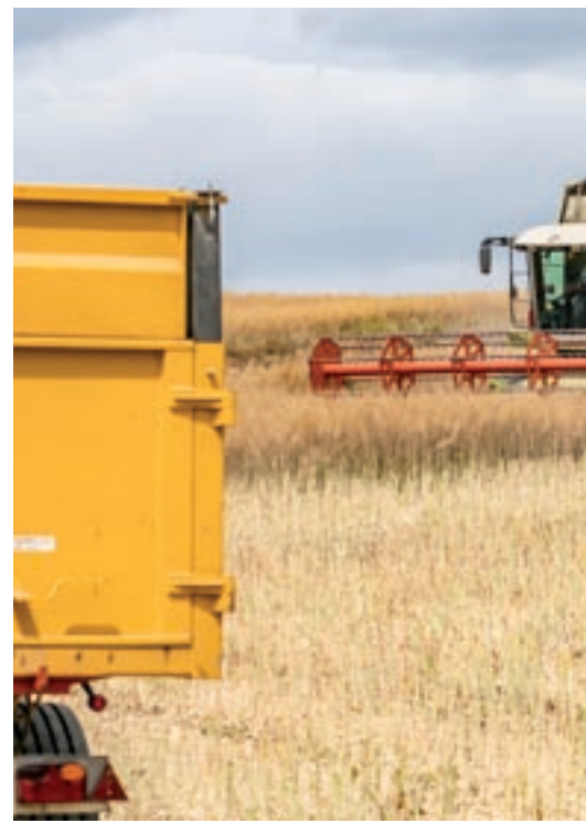
Treballs de sega aquest diumenge a la zona de Gallecs. I

La campanya de vigilància s'allarga fins a l'1 de setembre. S'actua a les hores de més risc: des de 2/4 d'l migdia a 2/4 de 8 del vespre.