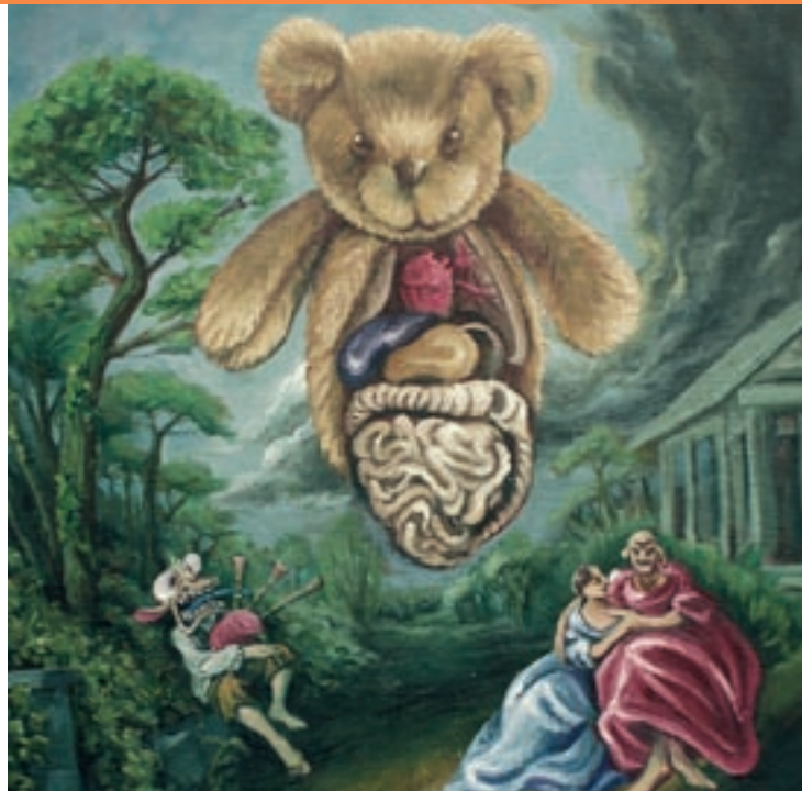
Un dels quadres que es pot veure a l'exposició

Les següents, de fet, aprofundeixen molt més en la