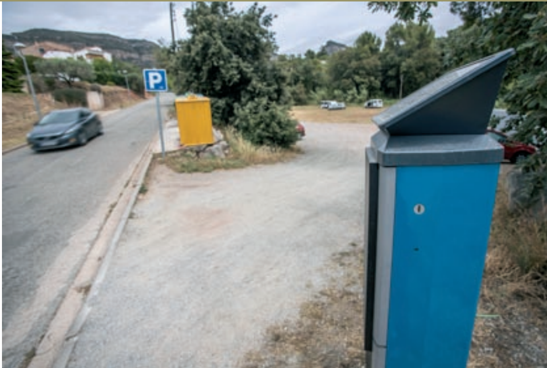
El parquímetre col·locat a l'accés de l'aparcament que hi ha al costat del carrer Mossèn Jaume Plans

Els aparcaments de Mossèn Jaume Plans i de Vilaplana, a Riells, seran, a partir d'aquest dissabte, zones d'estacionament controlat de tiquet obligatori. Per a les persones residents al municipi, l'estacionament no tindrà cap cost però igualment hauran de tenir el tiquet. Pel que fa als visitants d'altres municipis,