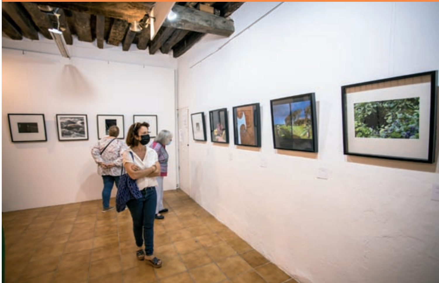
L'exposició es va inaugurar aquest dissabte amb les obres de 24 artistes catalans, suecs i japonesos

El Centre d'Art La Rectoria presenta l'exposició col·lectiva "Equidistància", amb 24 artistes