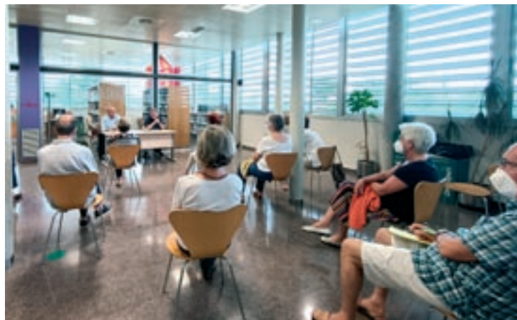
Cardús durant la xerrada de dijous a la biblioteca de l'Ametlla

Una xerrada, la seva setena al poble, que portava per nom “L'auge de l'extrema dreta i altres formes d'intolerància actuals” i que va