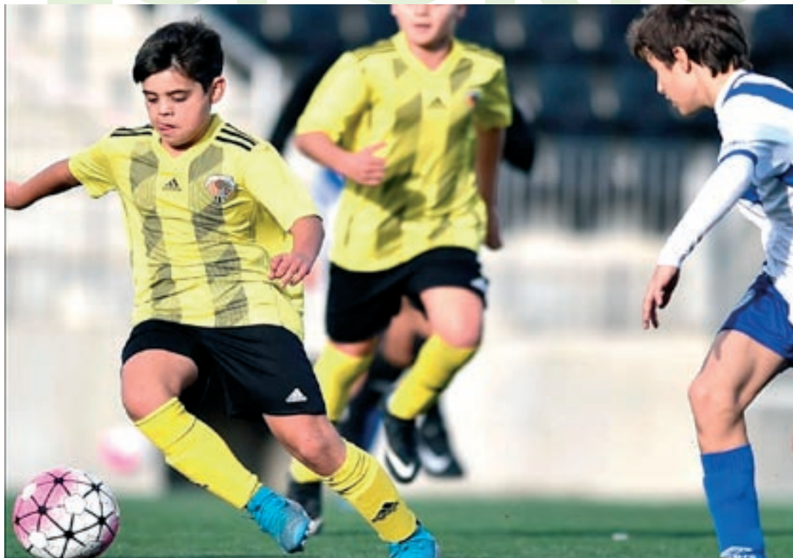
La UE Mataró i el CE Europa, entre d'altres, són equips habitualment presents a la competició