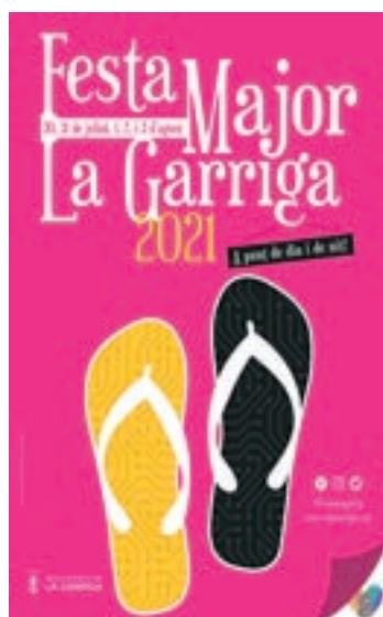
El cartell guanyador

Un grup de veïns de Sant Celoni està preparant la commemoració de les colònies, l'esplai dels dissabtes i el Mercat de l'Encerada, que es van fer des de principis dels 60 fins a mitjan anys 80. Per això, han començat a aplegar fotos i materials i han intentat contactar amb aquelles persones que, de joves, hi van participar.