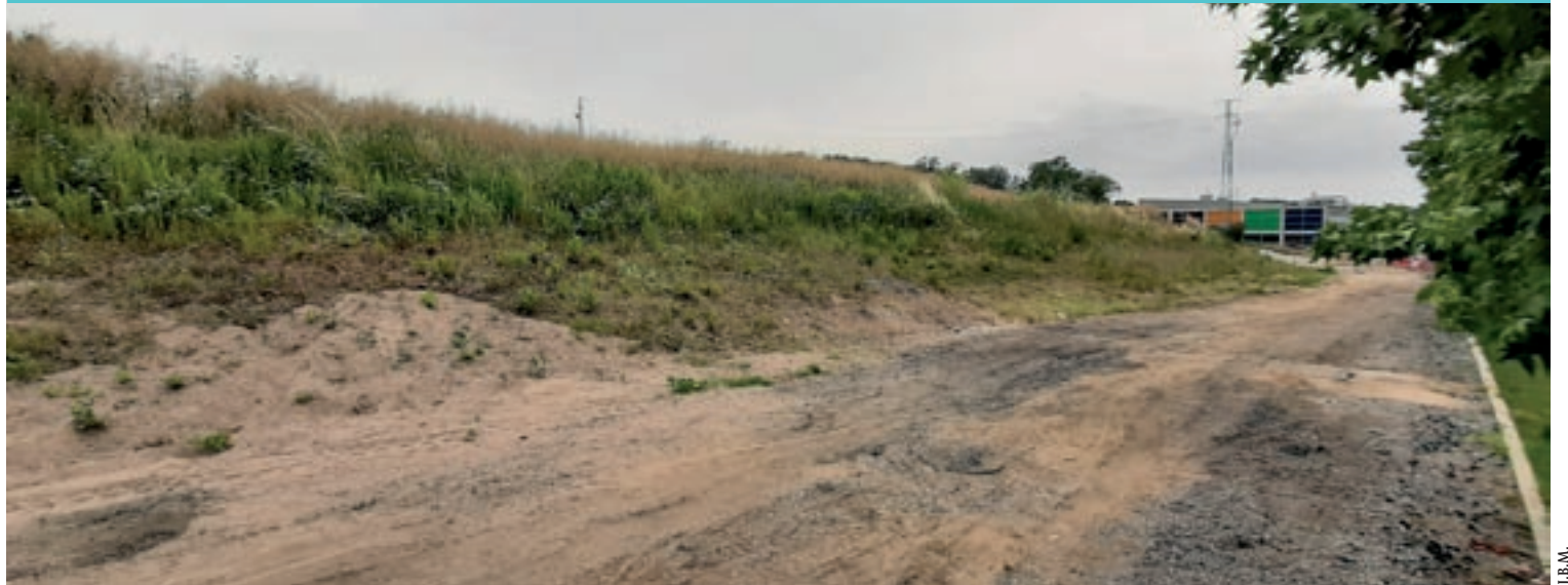
Els terrenys on s'edificarà el supermercat estan en un lloc proper a un nou aparcament que s'està edificant a Llinars

La cadena preveu obrir el supermercat, de 1.400 metres quadrats, a final d'any