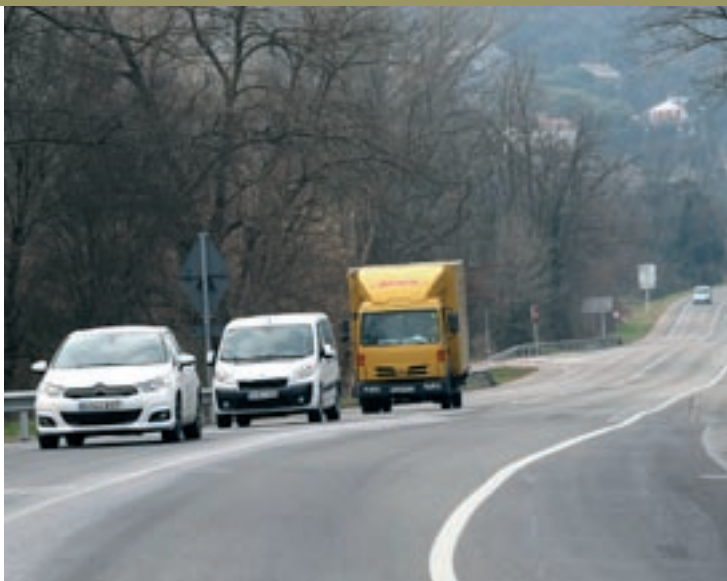
Un tram de la C-35 a tocar de Sant Celoni que s'ampliarà amb un tercer carril

En el tram d'1,2 quilòmetres entre el túnel de Vilalba i l'accés a Baronia del Montseny, les característiques del traçat no permeten eixamplar la calçada per generar un tercer carril. Amb tot, també s'hi faran millo-