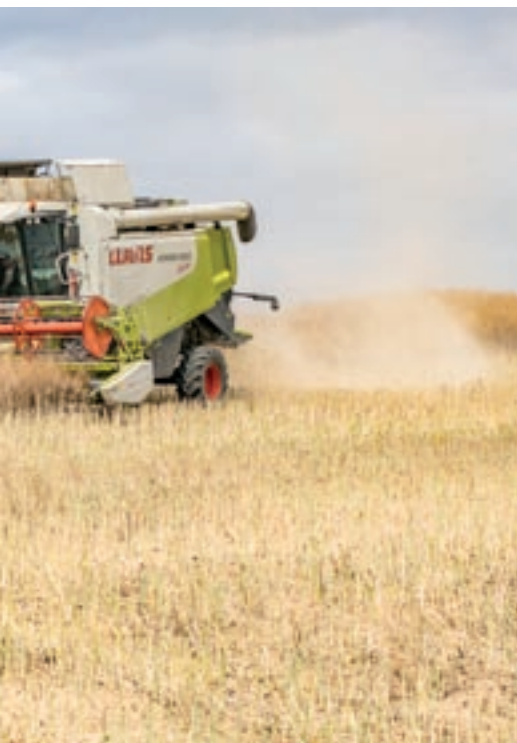
Els camps segats redueixen el risc d'incendi

la mitjana dels darrers 15 anys. En canvi, la superfície cremada en aquests incendis està clarament per sota. Les previsions meteorològiques a llarg termini pronostiquen un estiu força normal, explica el cap dels Agents Rurals a la comarca.