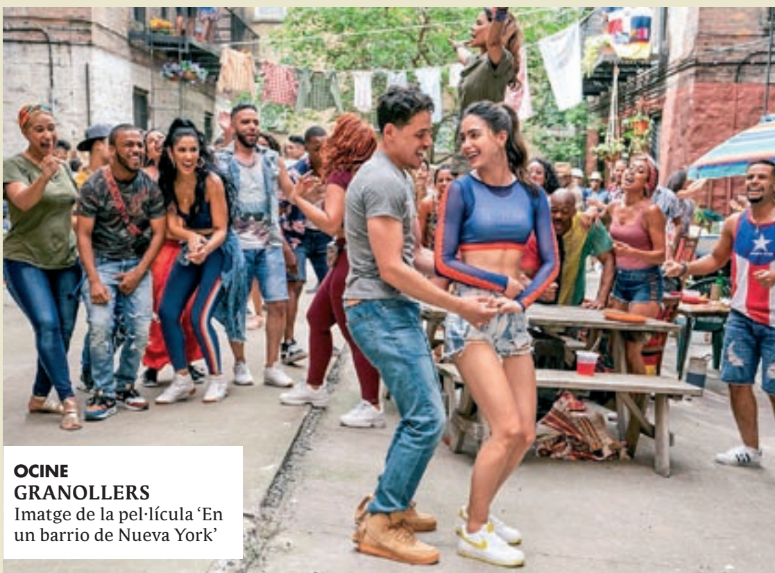
Imatge de la pel·lícula 'En un barrio de Nueva York'

Japó 2020. Dir. Goro Miyazaki. Animació. No a tots els orfes els agrada viure a l'orfenat de St. Morwald's, però Earwig ho adora. Té tot el que necessita per ser una noia feliç des del primer dia que es van obrir per a ella les portes del centre. No obstant això, tot canvia el dia que Bella Yaga i la Mandràgora visiten St. Morwald disfressats de pares adoptius. Earwig es trasllada al seu domicili, una enorme casa plena d'habitacions invisibles, pocions i llibres d'encanteris, amb màgia a cada racó. Encara que molts nens haguessin fugit d'allà sense pensar-s'ho dues vegades, Earwig decideix investigar. Ajudada pel seu propi enginy (i una mica des suport d'un gat xerraire), decideix