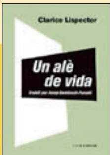
'Un alè de vida' Clarice Lispector Club Editor

Reedició de dos clàssics que han entusiasmat generacions de lectors d'arreu del món: La meva família... i Ocells, bèsties i parents , on Gerald Durrell explica la seva felicitat i esbojarrada infantesa a l'illa de Corfú (Grècia). La família Durrell s'hi va traslladar l'any 1935 fugint de la plujosa Anglaterra. Passió pels animals, personatges singulars i humor.