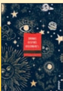
'Crema'l després d'escriure'l' Sharon Jones / Shaka

L'Elisabet és una adolescent de pares divorciats que ha canviat de ciutat i té problemes per integrar-se al nou institut. La seva vida donarà un gir inesperat quan l'ataqui un poderós dimoni recaptador d'ànimes i la converteixi en un ésser híbrid, amb dobles reptes a la seva estranya vida. Una novel·la de literatura fantàstica per a lectors joves.