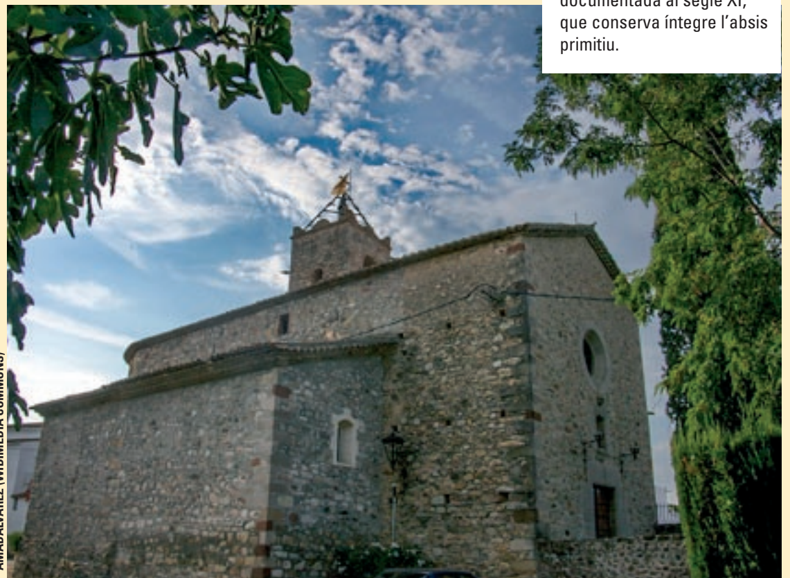
AMADALVAREZ (WIKIMEDIA COMMONS)

Ramon Garriga (Vic, 1876 - Samalús, 1968) va ser ordenat sacerdot el 1901. El 1915, després de passar per la parròquia de Cerdanyola del Vallès, va decidir retirar-se a Samalús. Des de llavors va ser conegut com l'Ermità de Samalús. Vivia en una casa prop de la parròquia, el mas Cuní, per on van passar al llarg dels anys amics poetes que amb els seus textos han fixat el record del personatge, el seu tarannà ben peculiar. Els podem llegir per l'entorn de l'església romànica documentada al segle XI, que conserva íntegrament l'absis primitiu.