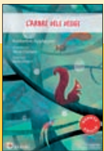
'L'arbre dels desigs' Katherine Applegate Pagès Ed.

El mes de maig passat, l'Scottish National Party (SNP) obtenia la seva quarta victòria en unes eleccions generals. Quines raons expliquen l'hegemonia d'aquesta formació, que a Escòcia s'ha imposat als tradicionals partits de matriu anglesa? Aquest llibre fa un repàs a l'evolució de l'SNP des que es va fundar, als anys 30 del segle passat.