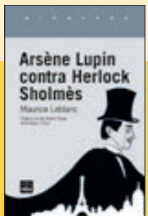
'Arsène Lupin contra Sherlock Holmes' M. Leblanc / Ed. de 1984