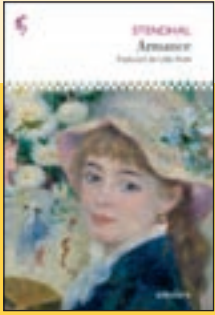
'Armance' Stendhal Ed. Adesiara