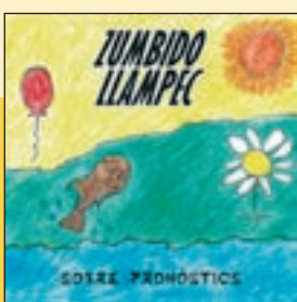
ZUMBIDO LLAMPEC 'Sobre pronòstics'

Nova entrega de Zumbido Llampec, un dels grups més esparracats de l'escena nostrada que no han parat –amb el permís de la pandèmia– des que es van reagrupar el 2018. A Sobre pronòstics la claven de nou amb 10 temes que parteixen del punk-rock clàssic, sempre anant de dret a barraca, amb lletres desenfadades i sovint divertides que trenquen amb els tòpics del rock. Molen La Betty i el tiu que no tenia gaire flexibilitat , Sort n'hi ha del rock'n'roll o una que defineix perfectament el tarannà de la formació: L'important és passar-ho bé . Uns cracks.