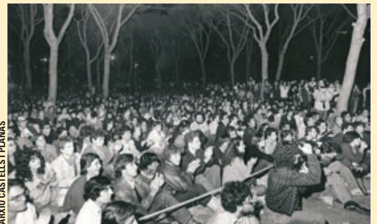
ARXIU CASTELLS I PLANAS