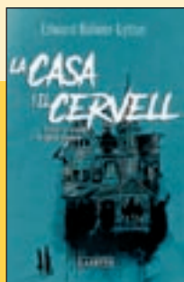
'La casa i el cervell' Edward Bulwer-Lytton Ed. Laertes