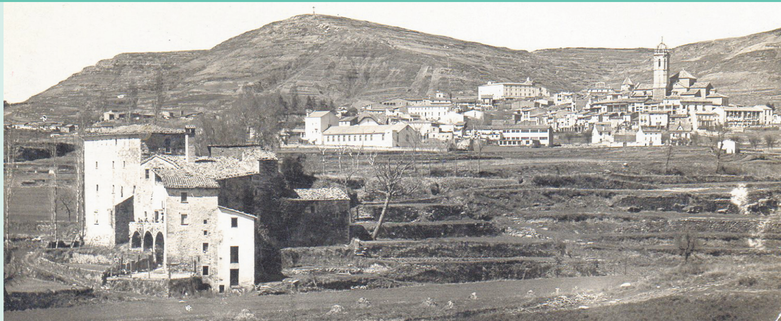
SALVADOR RENOM (ARXIU HISTÒRIC DE MOIÀ)

El Temps era temps de l'última pàgina d' El 9 Moianès farà salts al passat gràcies al patrimoni visual que es conserva als arxius de la comarca. En aquest cas, es tracta d'una vista parcial de Moià des de la banda sud entre el 1920 i el 1923. En primer terme es veu Castellnou de la Plana; en segon terme, la fàbrica d'El Vapor, i al fons, les cases del poble. La foto és de Salvador Renom i pertany a la col·lecció d'imatges de Ramon Tarter.