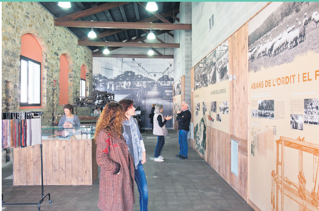
Vista de l'interior de l'Espai Hemalosa

A banda del punt d'informació de l'Ecomuseu, l'Espai Hemalosa disposa d'un gran auditori i dues sales