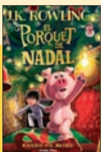
'El porquet de Nadal' J.K. Rowling Estrella Polar