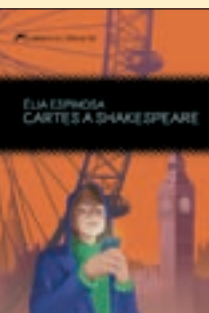
'Cartes a Shakespeare' Èlia Espinosa Llibres del Delicte

Una història de la rebel·lia moderna, l'entrada a un nou humanisme... Així s'ha definit aquesta obra d'Albert Camus que ara ha publicat Raig Verd en traducció catalana. És la primera de quatre obres del pensador i escriptor francès que traurà a la llum. Vindran després La caiguda i El primer home i més endavant els Escrits llibertaris .