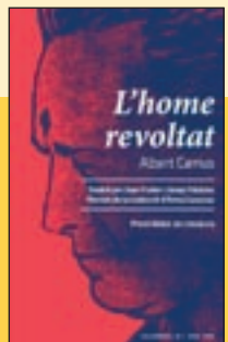
'L'home revoltat' Albert Camus Raig Verd