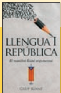
'Llengua i república' Grup Koiné Nexum Ed.

“El nostre Far West comprèn les terres del Sud, les Terres banyades pel gran riu, i també a Ponent, la Terra Ferma fins als Pirineus. Al nostre Far West hi ha vinya, oliveres, cereals, alguns animals i arbres fruiters”, diu l'autor. Aquí viu la Míriam Cabot, vídua amb quatre fills, que mor i els deixa la consigna que estiguin sempre units.