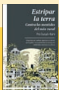
'Estripar la terra' Pol Dunyó Raig Verd

El Manifest del grup Koiné sobre el català, promogut per l'associació Llengua i República, i presentat el març del 2016, va crear impacte i polèmica. Els seus autors responen aquí amb arguments els atacs que han rebut durant quatre anys. Un llibre que farà possible continuar el debat, però ara sobre bases de discussió sòlides.