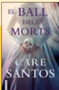
'El ball dels morts' Care Santos Fanbooks

Ara que s'ha entregat el Premi Planeta de 2021, amb tota la polèmica i rebombori mediàtic que l'acompanya, es publica la traducció catalana de la novel·la guanyadora a l'edició de l'any passat. Un thriller d'ambientació medieval que arrenca l'any 1137, amb l'assassinat a Compostel·la del duc d'Aquitània, llavors la regió més cobdiciada de França.