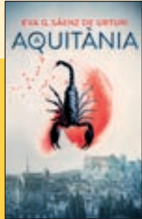
'Aquitània' Eva G. Sáenz de Urturi Columna

Ara que s'ha entregat el Premi Planeta de 2021, amb tota la polèmica i rebombori mediàtic que l'acompanya, es publica la traducció catalana de la novel·la guanyadora a l'edició de l'any passat. Un thriller d'ambientació medieval que arrenca l'any 1137, amb l'assassinat a Compostel·la del duc d'Aquitània, llavors la regió més cobdiciada de França.