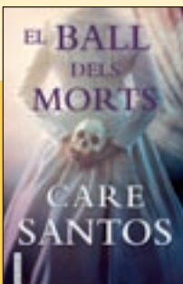
'El ball dels morts' Care Santos Fanbooks

Ara que s'ha entregat el Premi Planeta de 2021, amb tota la polèmica i rebombori mediàtic que l'acompanya, es publica la traducció catalana de la novel·la guanyadora a l'edició de l'any passat. Un thriller d'ambientació medieval que arrenca l'any 1137, amb l'assassinat a Compostel·la del duc d'Aquitània, llavors la regió més cobdiciada de França.