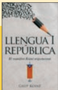
'Llengua i república' Grup Koiné Nexum Ed.

“El nostre Far West comprèn les terres del Sud, les Terres banyades pel gran riu, i també a Ponent, la Terra Ferma fins als Pirineus. Al nostre Far West hi ha vinya, oliveres, cereals, alguns animals i arbres fruiters”, diu l'autor. Aquí viu la Míriam Cabot, vídua amb quatre fills, que mor i els deixa la consigna que estiguin sempre units.