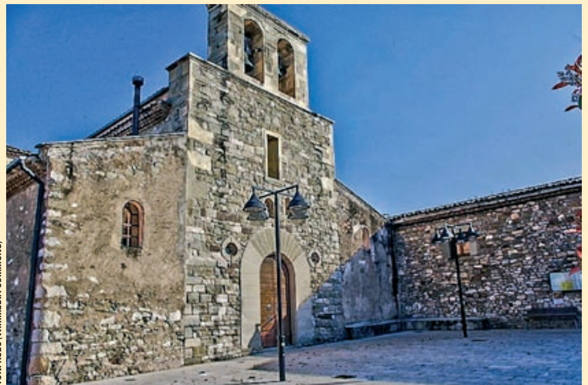
TONI XUEC (WIKIMEDIA COMMONS)

Josep Fàbrega (Súria, 1947) resideix a Calders. Va començar la seva trajectòria literària publicant Postals de Calders , d'on extraiem aquest sonet que proposem per ser llegit a la plaça del poble. L'han anat seguint una sèrie de títols publicats associats a diversos premis literaris. A més, és autor de diversos poemaris no publicats, però també reconeguts en certàmens.