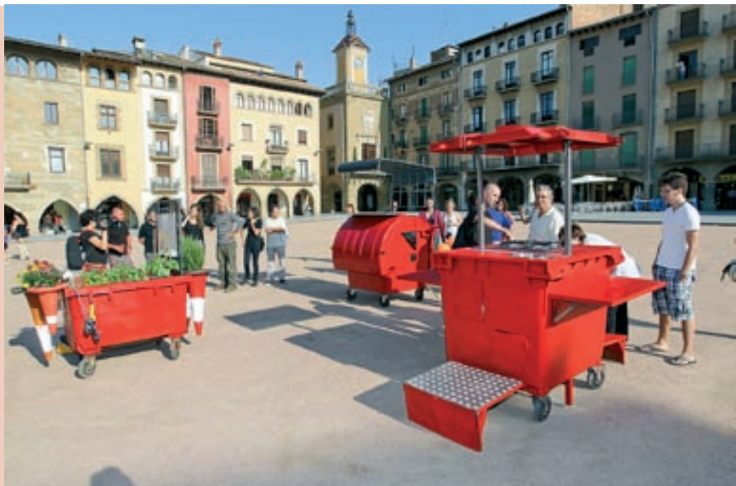
JORDI CABANAS / JORDI PUIG