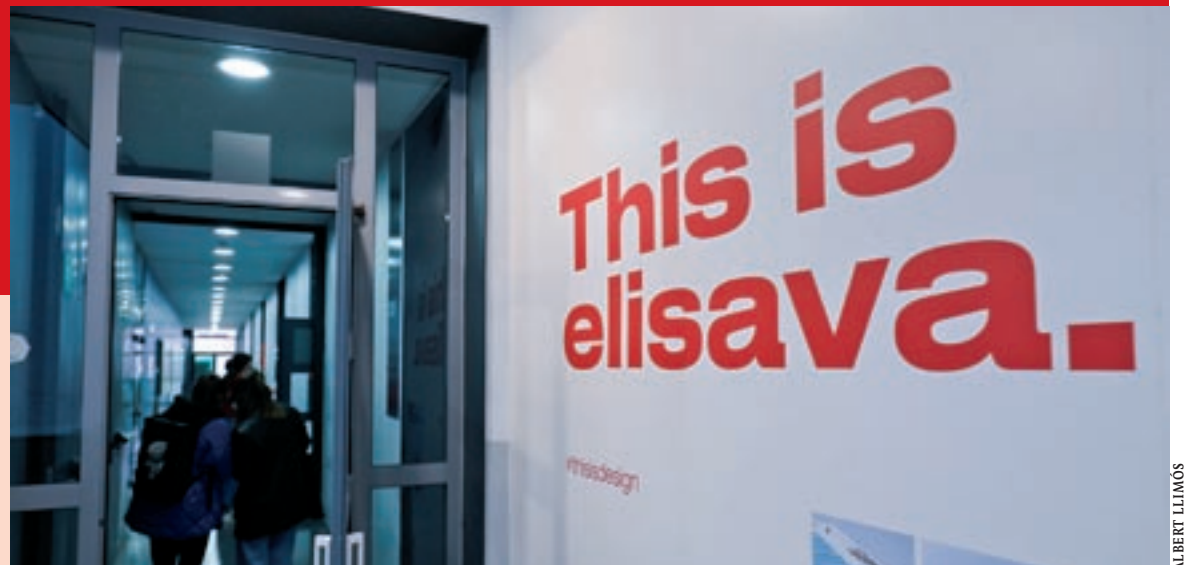
Entrada a un dels passadissos d'aules d'Elisava, a la seva seu actual de la Rambla

es converteix en la Facultat de Disseny. D'aquesta manera, augmenta la presència de la UVic-UCC a Barcelona. D'aquí a tres anys començaran les obres d'una nova seu, que integrarà Elisava i altres serveis universitaris a la capital de Catalunya.