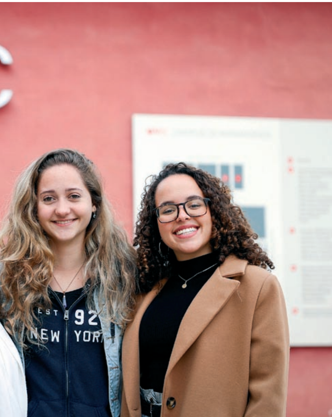
Est dimarts al campus de la Universitat de Vic

desagradables. “Algunes persones s’han negat a parlar-nos en castellà i això ens ha impactat bastant perquè no sabíem català”, afirmen. Però això tampoc els ha suposat grans problemes més enllà de situacions puntuals.