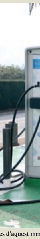
Des d'aquest mes