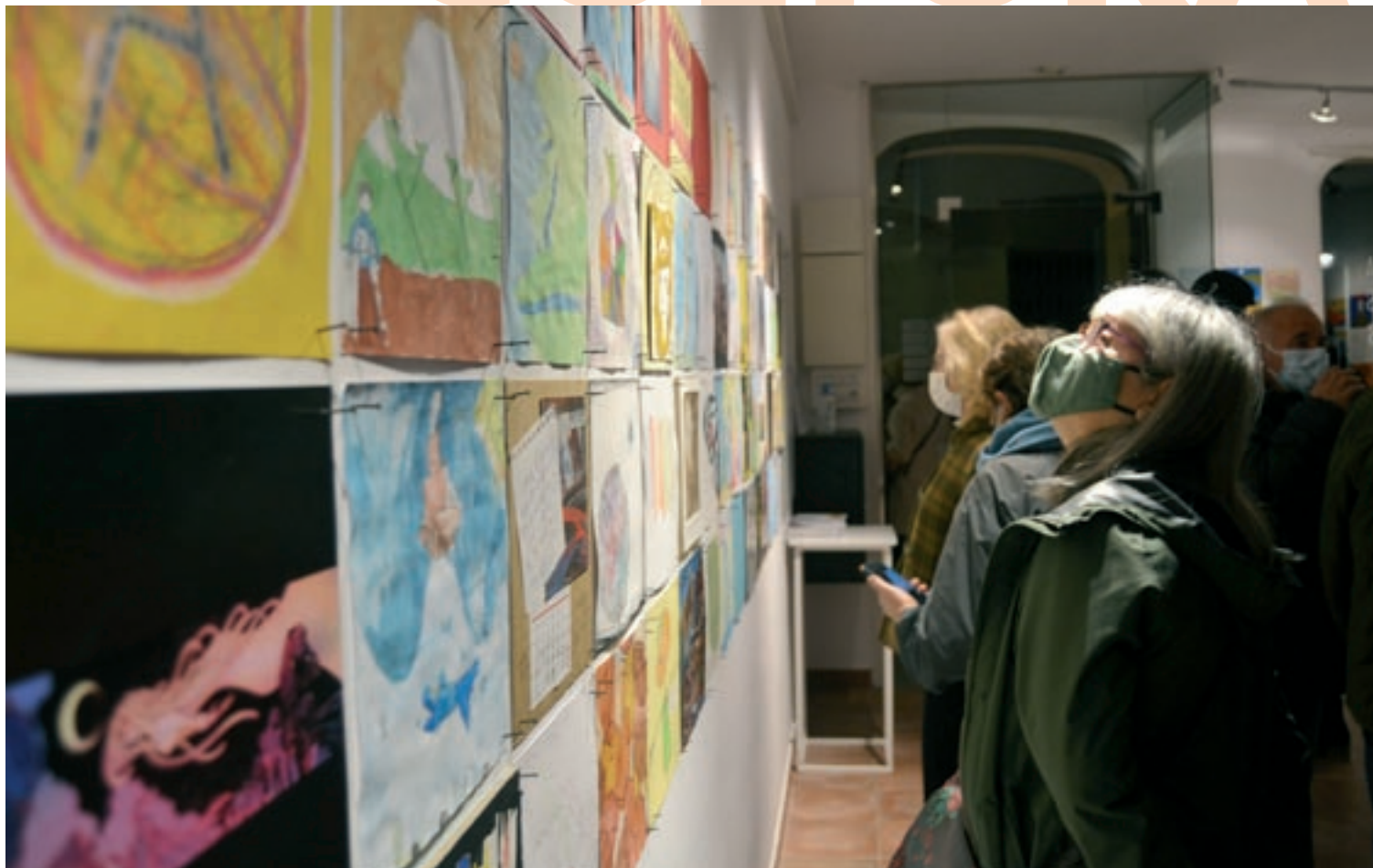
La mostra, impulsada per quatre amigues de l'artista, es va inaugurar divendres passat a la sala Delger de Caldes