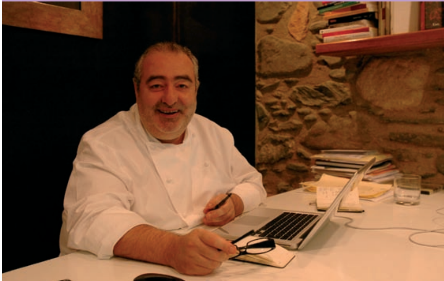
Santi Santamaria al seu restaurant, el Racó de Can Fabes de Sant Celoni, en una imatge de l'any 2009

L'Acadèmia de Gastronomia celebrarà aquest dimecres un sopar a la memòria del xef de Sant Celoni