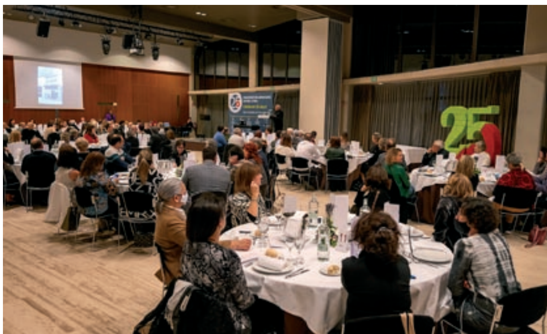
L'acte va aplegar unes 150 persones entre representants del sector comercial i del món polític