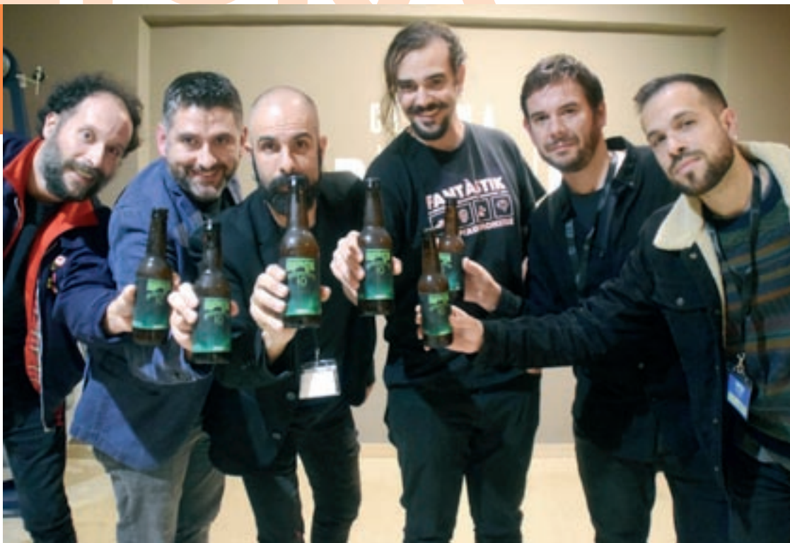
Els membres de l'organització del festival Fantàstik, aquest cap de setmana al Cinema Edison de Granollers

Dit això, la passada mostra va tornar a destacar en diversos camps. D'entrada, i com ja és habitual, les dues sessions amb els 16 curtsmetratges finalistes van acaparar els entusiasmes aplaudiments d'uns espectadors que, en el vot popular, van premiar la costumista comèdia de zombis Llengua amb tàperes . En canvi, el jurat oficial, format pels sis membres de l'organització, va guardonar el notable relat de terror Night Breakers com a millor film