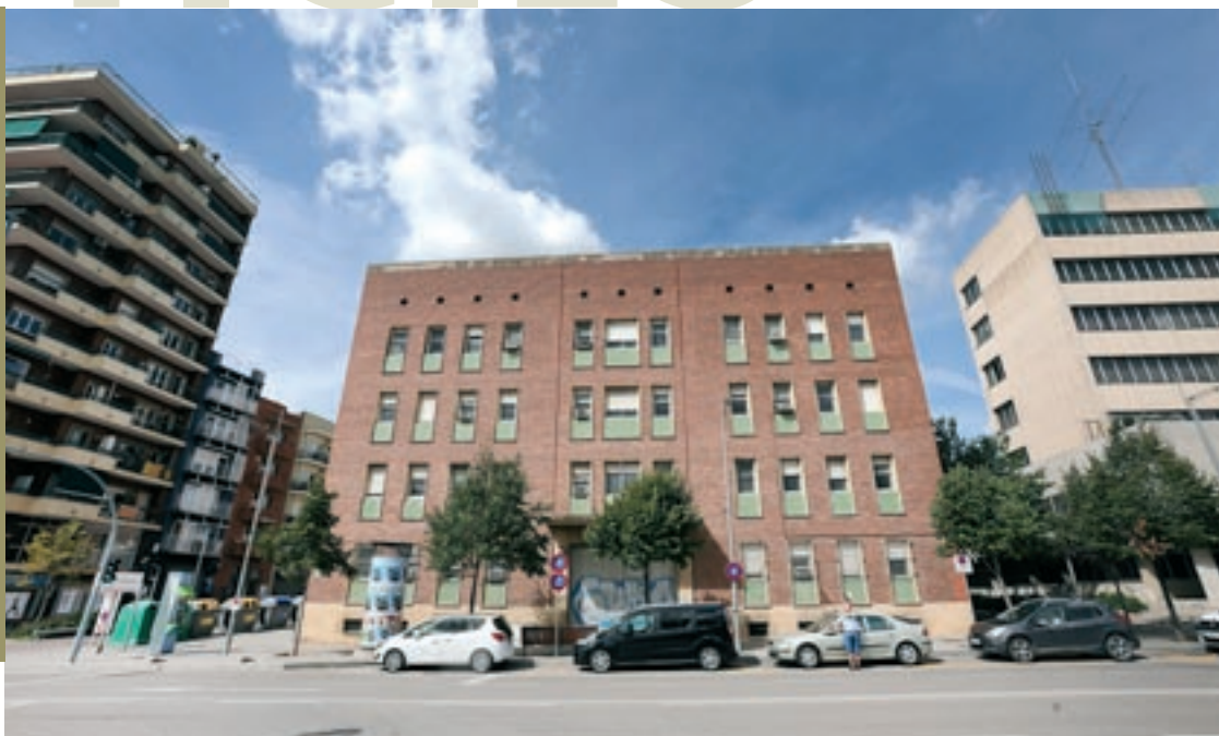
L'edifici dels antics jutjats de Granollers, on el Consell Comarcal hi podria tenir la seva seu