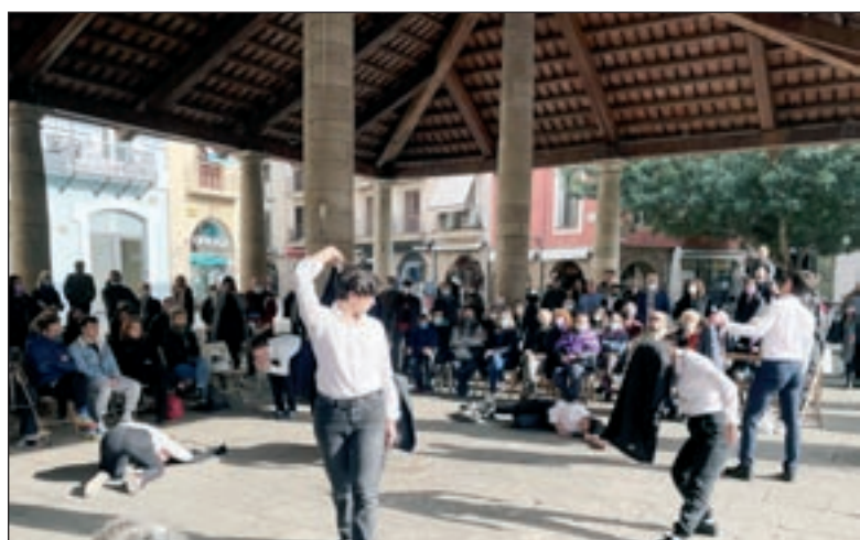
Alumnes de l'escola de teatre Arsènic van fer una 'performance' a la Porxada

I el mateix passa amb el delictes d'atemptat a l'autoritat. Que hi hagués incidents al pont no implica que totes les persones qui hi havia allà, pel sol fet de ser-hi, cometessin el delictes d'atemptat als agents de l'autoritat. La sentència també declara que les costes seran d'ofici.