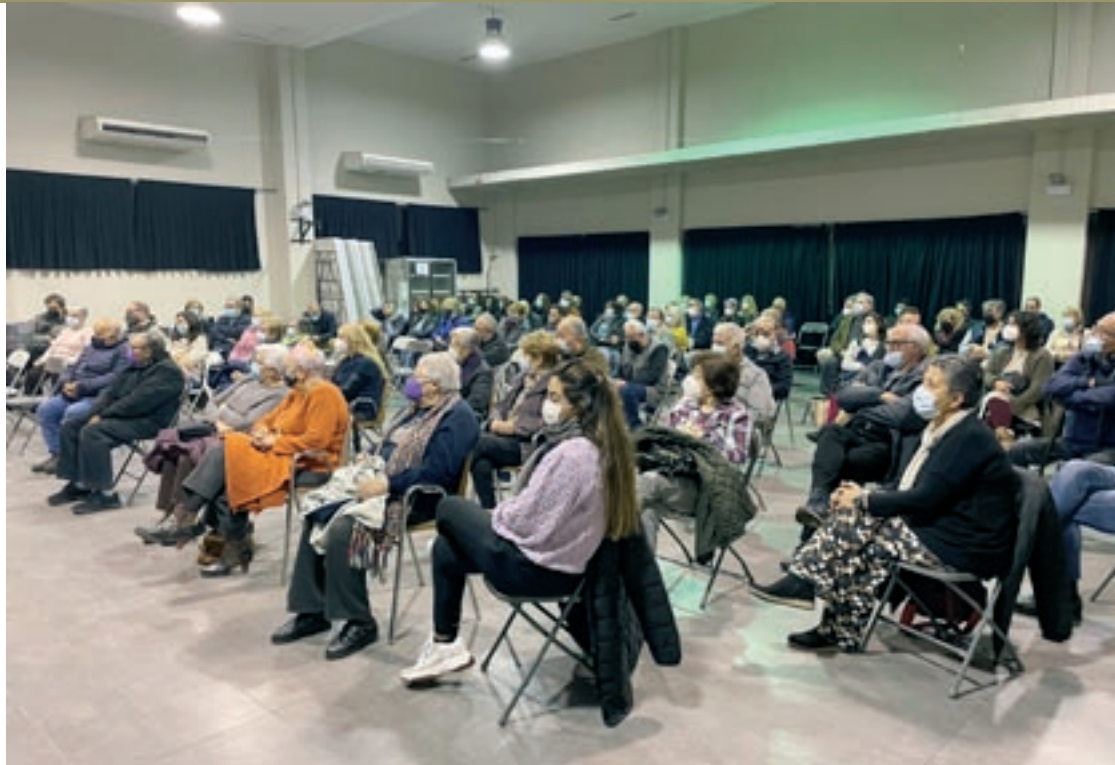
L'Audiència va reunir un centenar de persones al Casino divendres al vespre