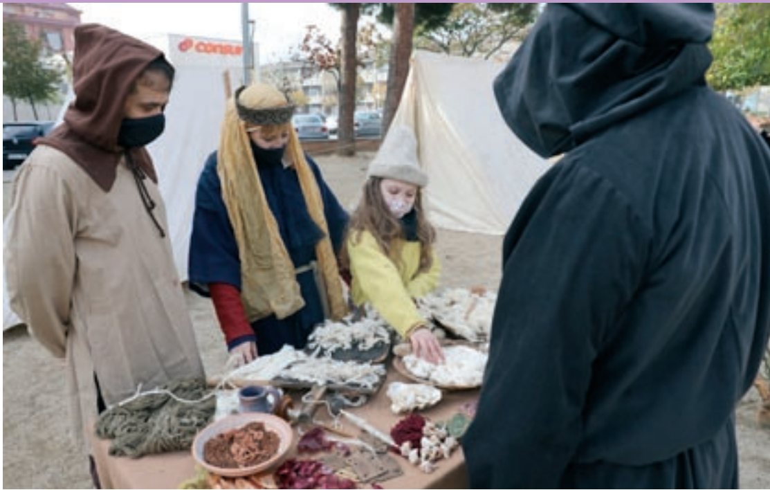
La plaça també va acollir un mercat d’artesans i una mostra d’oficis medievals

“Com a Ajuntament estem molt contents perquè hem impulsat un programa molt interessant quant a recuperació i promoció del patri-