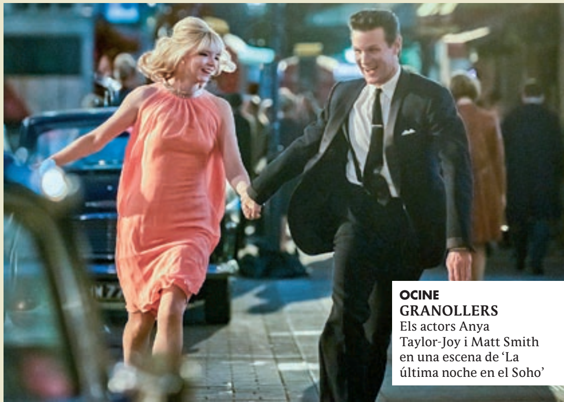
Els actors Anya Taylor-Joy i Matt Smith en una escena de 'La última noche en el Soho'