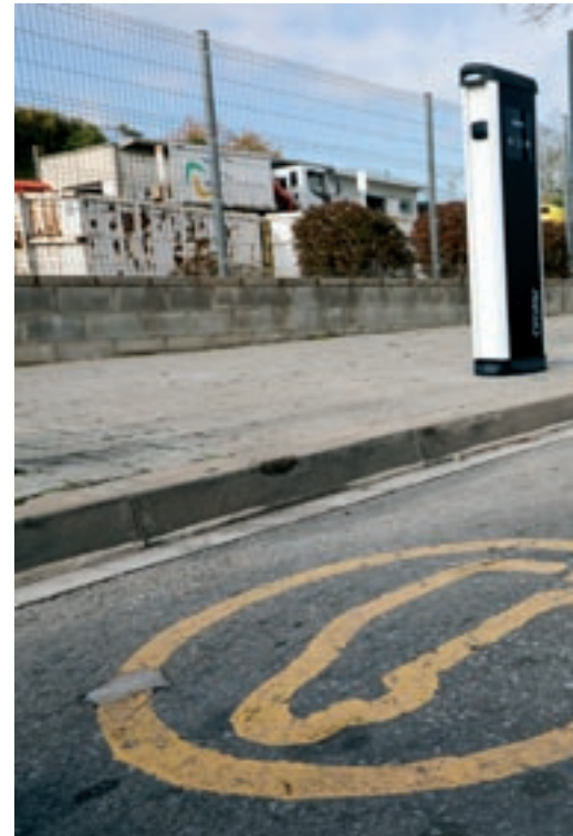
El nou punt de recàrrega de vehicles elèctrics al camí

Tots tres punts són de càrrega semiràpida i permeten que hi hagi dos vehicles connectats a la vegada. Permetran ampliar la xarxa, que ara està formada per quatre punts: un de càrrega ràpida al carrer Camp de les Morenes, dos punts de recàrrega semiràpida (Can Muntanyola i al carrer Josep Umbert) i un punt de recàrrega lenta al carrer del Rec. Per ara, tots són gratuïts. A banda, hi ha els punts de recàrrega de l'aparcament soterrat de Can Comas, que són de càrrega lenta. En aquest cas, l'energia elèctrica consumida per carregar el vehicle està inclosa al tiquet del vehicle, que té les mateixes tarifes que un vehicle de motor de combustió, segons informa el web municipal.