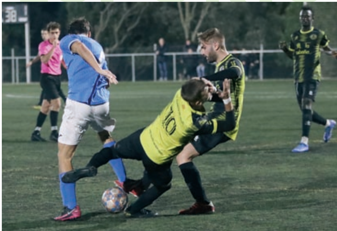
L'empat entre el Llerona i el Vilanova va estar marcat per l'actuació arbitral a la segona meitat