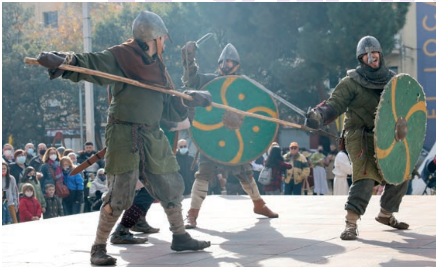
Els combats de guerrers medievals van ser una de les grans atraccions del matí de dissabte a la plaça de la Joventut