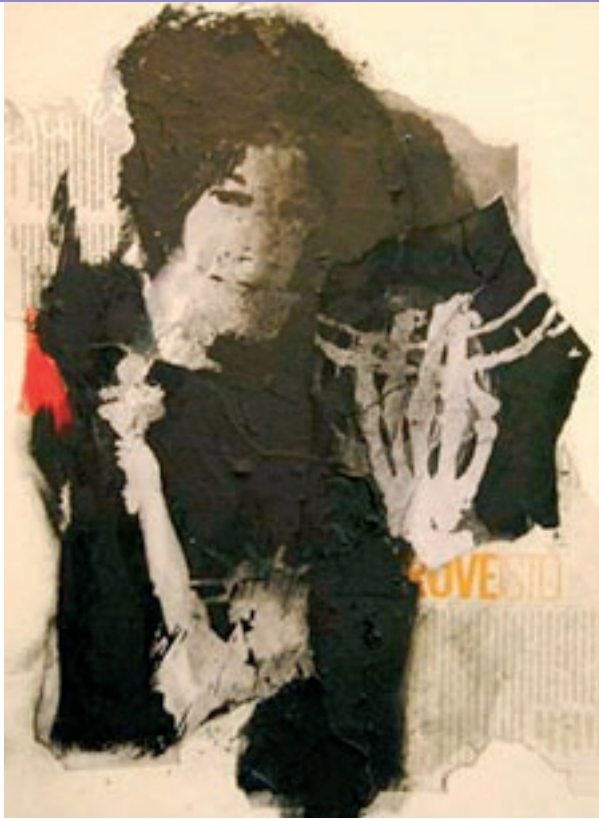
VASCO TORRES (SAATCHIART)

El senyor Tristor es va enfurismar com mai, va acusar la senyoria Alegria de deslleial i de traïdora, va esclatar el seu disgust i va deixar de queixar-se