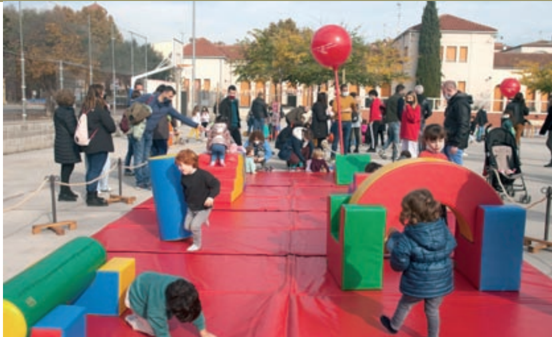
Aquest dissabte s'han fet activitats diverses al pati de l'escola Lluís Piquer

García ha recordat que un dels objectius del mandat és fomentar la transformació dels patis de les quatre escoles del poble: Pau Vila –de titularitat municipal–, Pompeu Fabra, Vila Parietes