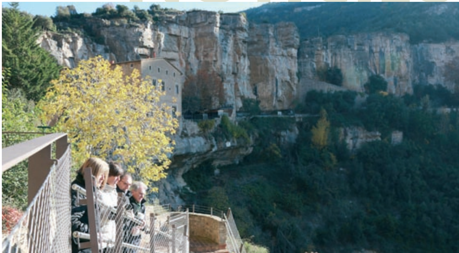
JUDITH CONTRERAS / DIPUTACIÓ DE BARCELONA