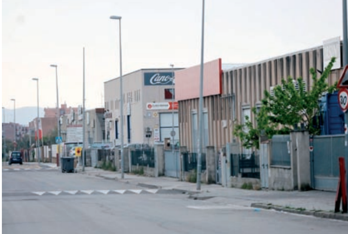
La reactivació del mercat de naus industrials progressa amb lentitud després del període de pandèmia

Aquests són els principals trets de l'informe trimestral del mercat immobiliari industrial de l'Observatori dels Polígons d'Activitat Econòmica del Vallès Oriental (OPAE). En el tancament del mes de setembre, el nombre de naus en oferta havia baixat el 12,5% respecte del trimestre anterior i apunta a una baixa més notable respecte dels màxims de gener.