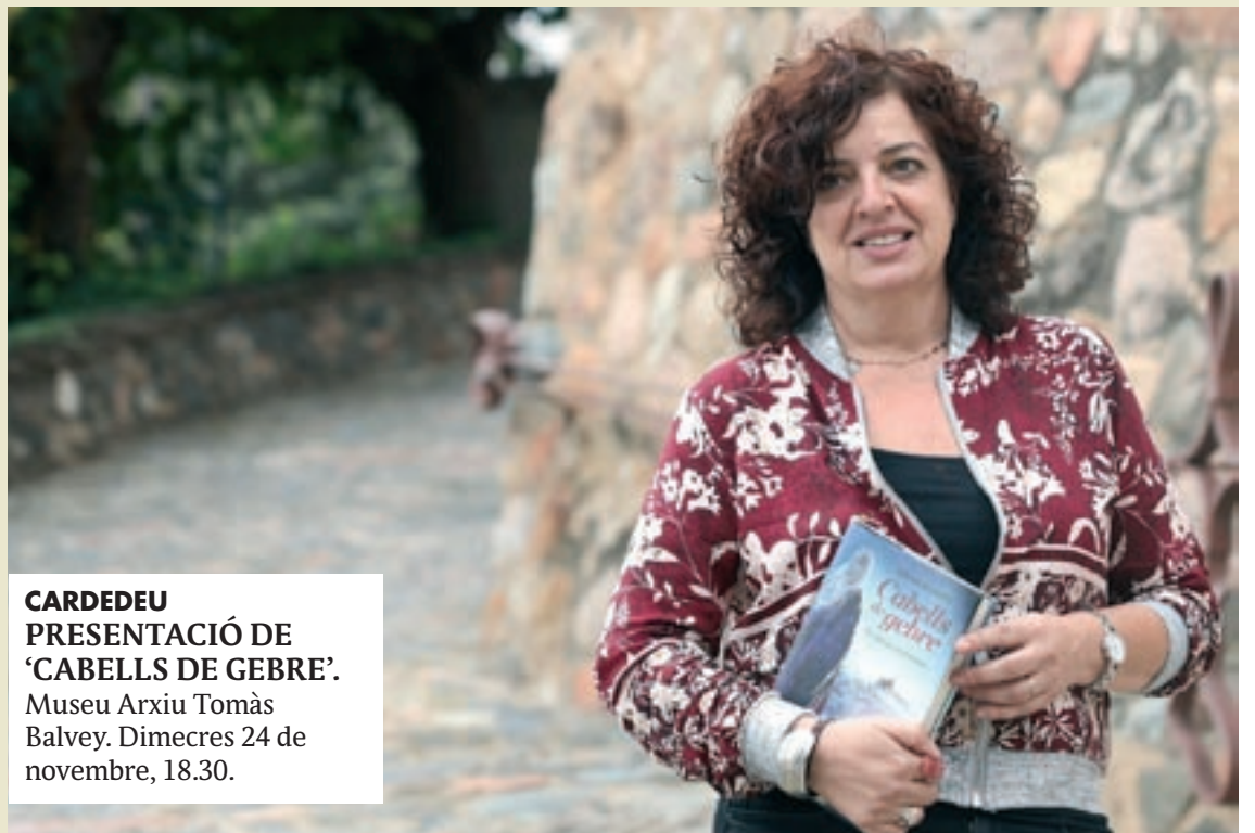
CARDEDEU PRESENTACIÓ DE 'CABELLS DE GEBRE'. Museu Arxiu Tomàs Balvey. Dimecres 24 de novembre, 18.30.

Tardoral de cinema de muntanya: Made in voyage . Agrupació Excursionista. 20.00.