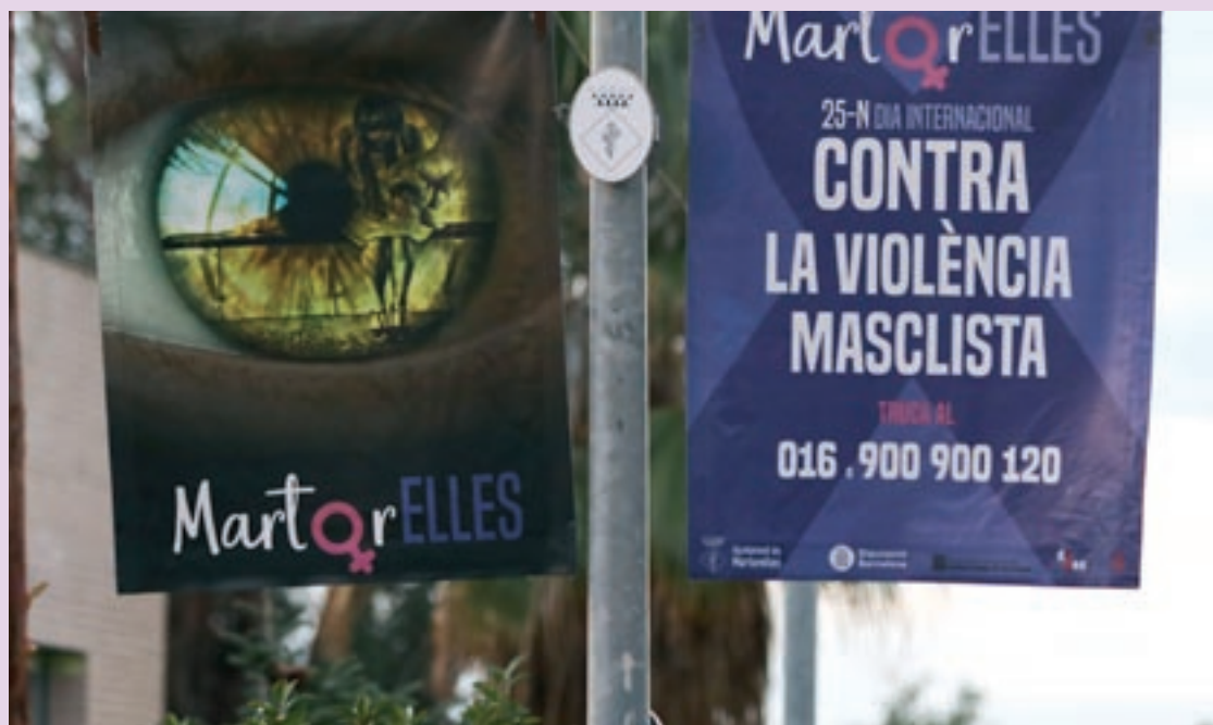
Unes banderoles recorden la celebració del 25 als carrers de Martorelles

Dins de la programació amb motiu del 25-N, l'Ajuntament de Martorelles ha fet difusió de la campanya del col·lectiu Flora Tristan feta a partir de l'estudi publicat l'any 2019 pel Ministeri de Presidència, Relacions amb les Corts i Igualtat El impacto de la violencia de género en España: una valoración de sus costes en 2016 . Segons aquest estudi, el cost mitjà de la violència contra les dones seria de 28 euros per habitant i any, d'acord amb els càlculs més conservadors. Extrapolant les dades, a Martorelles, el cost mitjà de les violències masclistes és de 132.507 euros. Un cop analitzades les dades, es poden estimar els guanys potencials que es derivarien d'aconseguir