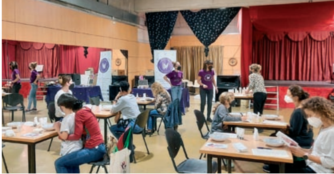
El SIAD de les Franqueses ha organitzat tallers com el d'autocura que va anar a càrrec de l'associació Mirall

Als mercats de Bellavista i Corró d'Avall, els dies 23 i 27 de novembre es farà l'activitat participativa “Un pensament per eliminar la violència masclista”. Es convidarà les persones participants a apuntar una frase o pensa-