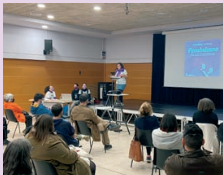
Una activitat relacionada amb el 25-N de l'any passat

També a l'institut, dijous a les 6 de la tarda, s'oferirà una xerrada telemàtica dirigida a les famílies sobre l'acompanyament a la diversitat sexual i de gènere. La mateixa xerrada es farà