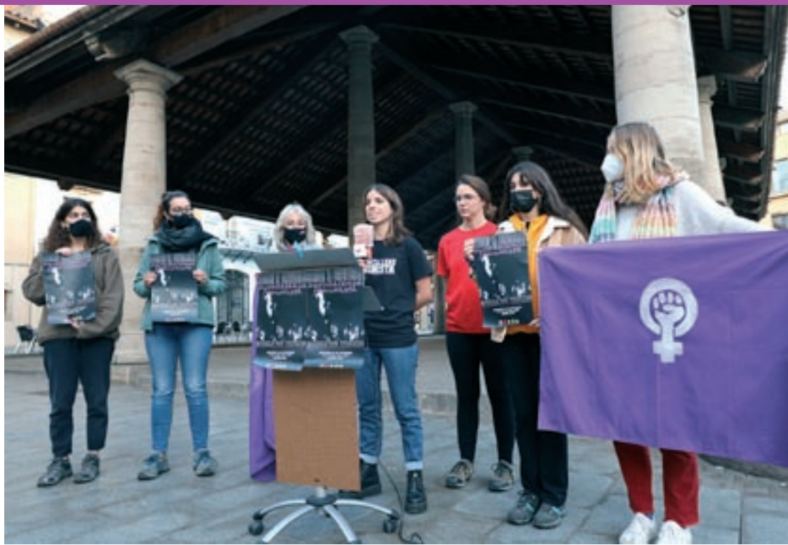
Les representants de les entitats Endavant, La Malgirbada, TLBG i la CUP i el CDR de Granollers en la presentació