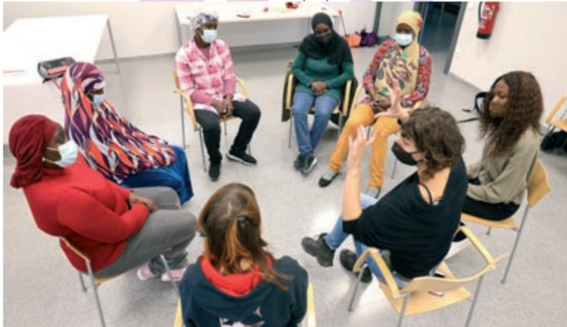
El taller de llibertat i tabús per a dones adultes es fa els dimarts a la segona planta de la biblioteca Frederica Montseny

L'acte central del programa es farà el mateix 25-N a les