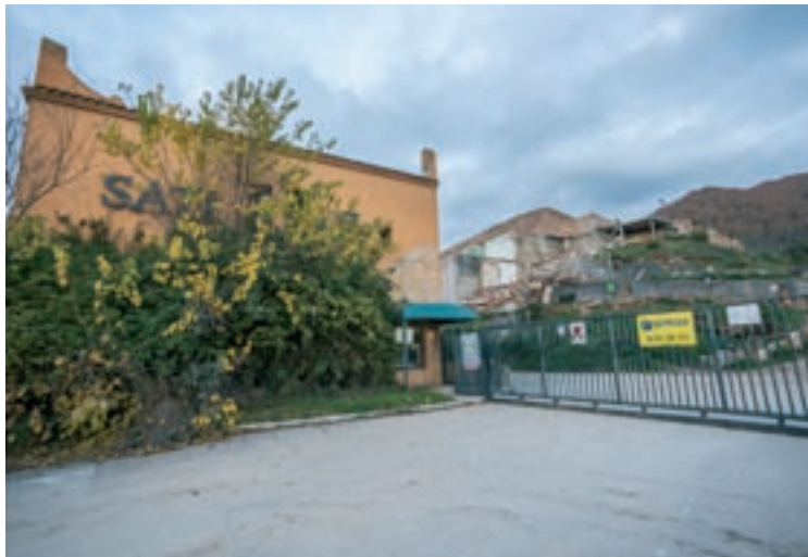
Les instal·lacions de Sati ja tenen compromesos espais per a logística