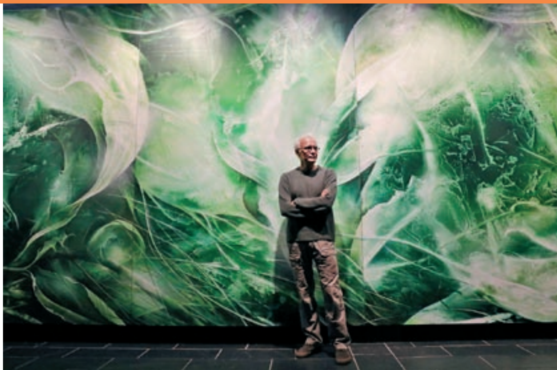
L'artista va presentar "Submergències" al Museu de Granollers

A finals de gener es va inaugurar la gran exposició antològica "Els llocs de la pintura" als Espais Volart de la Fundació Vila Casas de Barcelona, que recollia els més de 40 anys de la seva trajectòria artística. S'hi podien veure des de les visions urbanes de les ciutats en flames dels anys 80 fins a la sèrie de motius vegetals "Sota el Sui". Va ser una