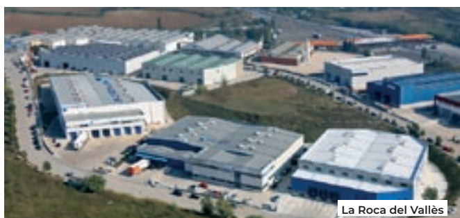
La Roca del Vallès

Consum experimental que es pot veure agreujat quan va acompanyat de malestars reals invisibles. Com de diferent seria la intervenció amb el consum si en comptes de perseguir miréssim més enllà i visibilitzéssim allò que és invisible? Estem veient el que amaga l'iceberg? Oferir eines per gestionar els malestars és la millor arma per fer front al consum problemàtic de les drogues. Sumant esforços i apostant per una població jove empoderada garantirem una disminució de les relacions problemàtiques amb el consum.