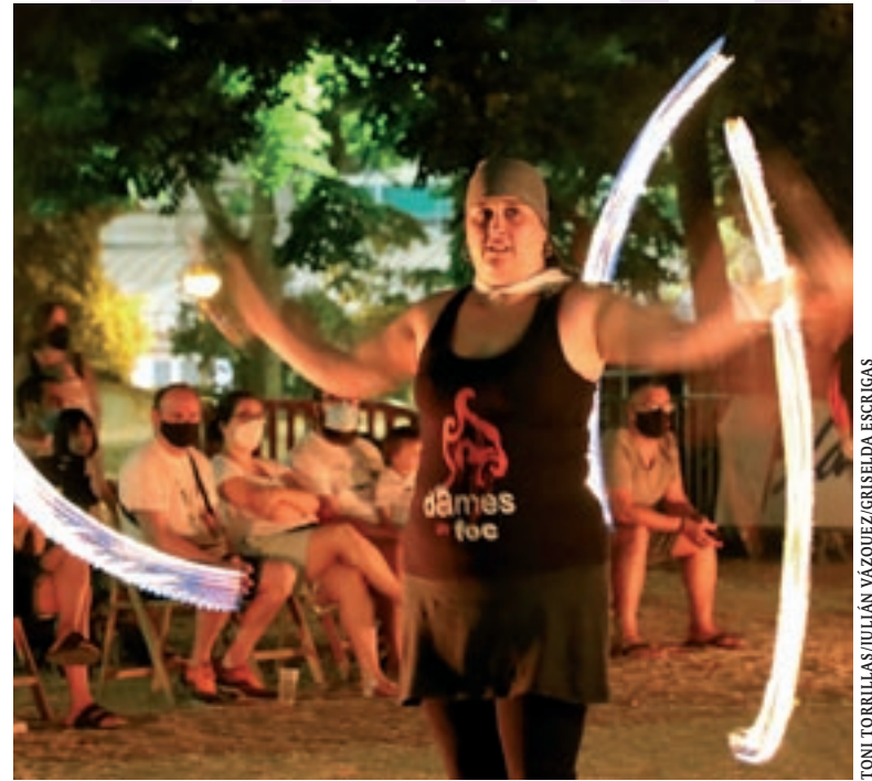
D'esquerra a dreta, els Xics fan un 5 de 7 en la seva diada, el 7 de novembre; l'Escaldàrium de Caldes, el 10 de juliol, i les Dames de Foc a la festa major de Granollers