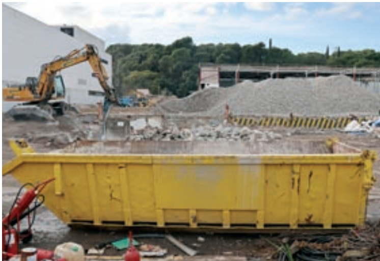
Sagax alça la primera implantació logística a l'Estat a l'antiga nau de Bigsa