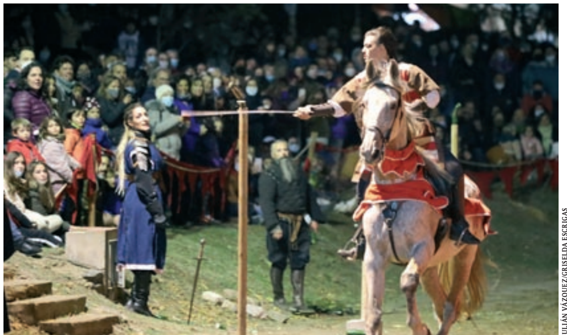
A la dreta, catifaires a la Garriga durant la festa del Corpus. A l'esquerra, els dies 6 i 7 de novembre Sant Pere de Vilamajor va recuperar la gran festa medieval del Vilamagore