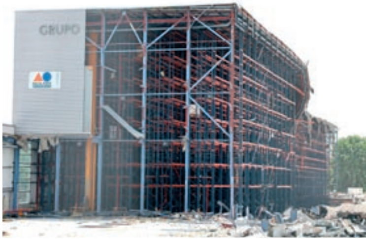
L'estructura de la rotativa del Grup Zeta durant els treballs de desmantellament