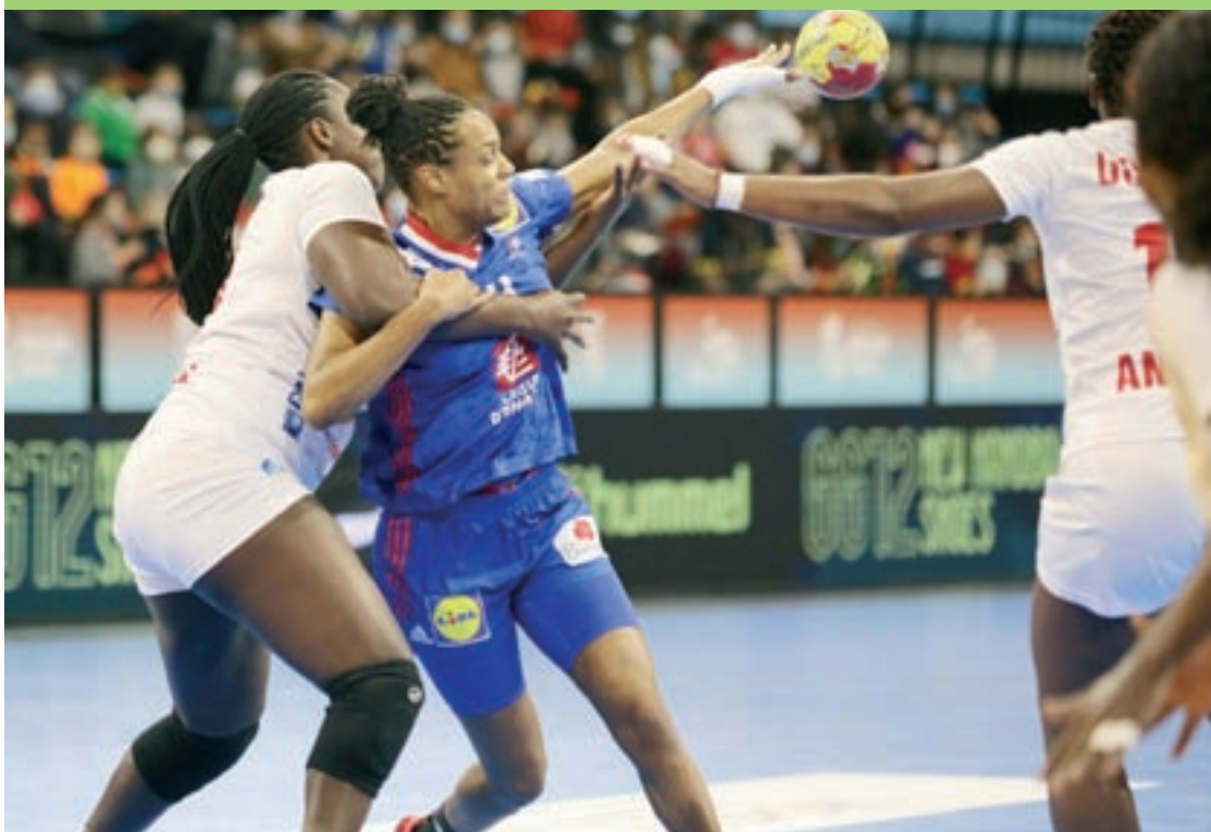
França i Angola van disputar un dels enfrontaments de la fase de grups als Palau d'Esports de Granollers

La ciutat s'ha convertit en la seu principal del Mundial que s'ha disputat a l'Estat espanyol