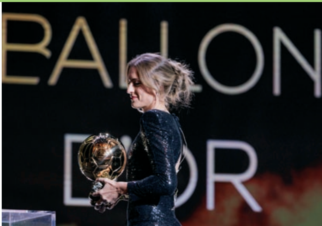
Alexia Putellas va rebre la Pilota d'Or el 29 de novembre en una gala a París

Amb el seu equip, el Barça, Alexia ho va guanyar tot la temporada passada. I amb una solvència com poques vegades es pot veure en el món del futbol. L'equip blau-grana té Alexia com a batec, al mig del camp i amb el braç de capitana engan-