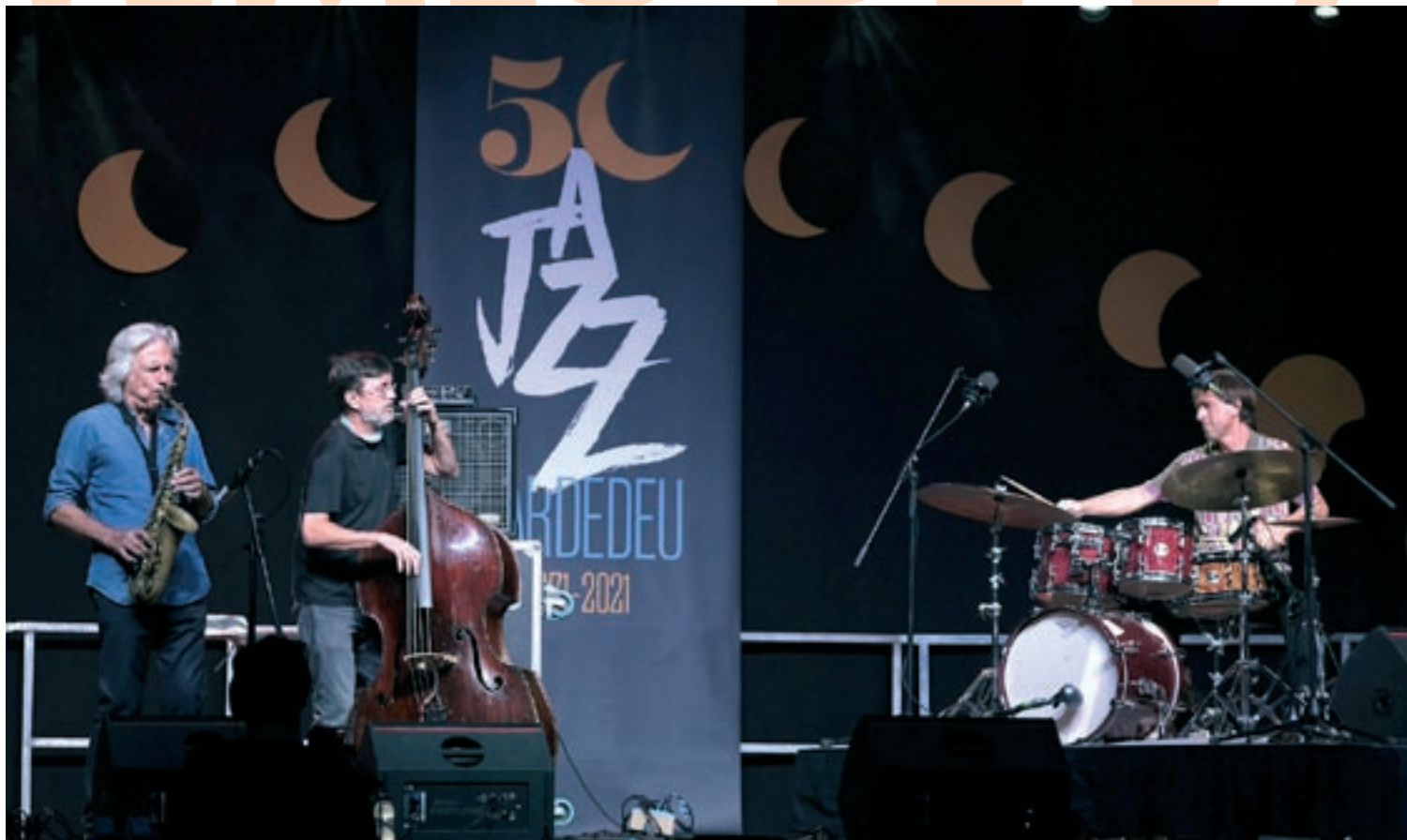
El 4 de setembre es va fer un concert commemoratiu amb un cartell excepcional a la pista coberta del Parc Pompeu Fabra