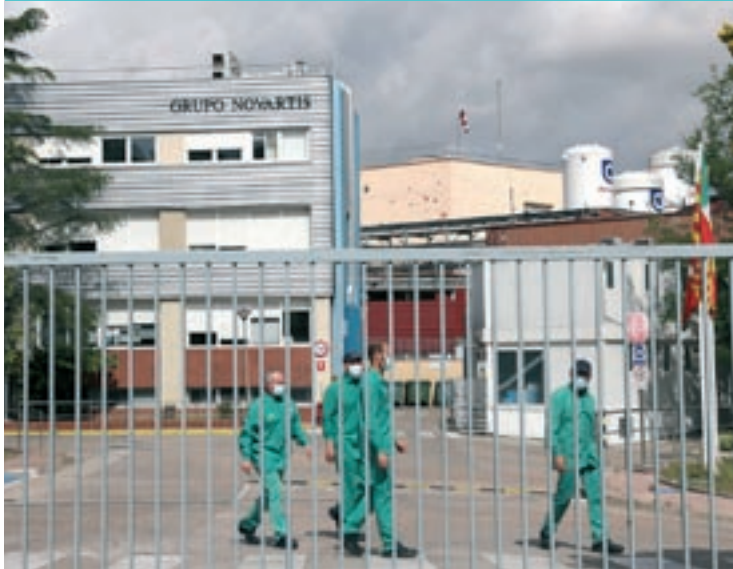
Treballadors de Sandoz, del grup Novartis, a l'accés de l'empresa a les Franqueses

Bosch i Sandoz acorden el tancament i Luxiona deixa Canovelles