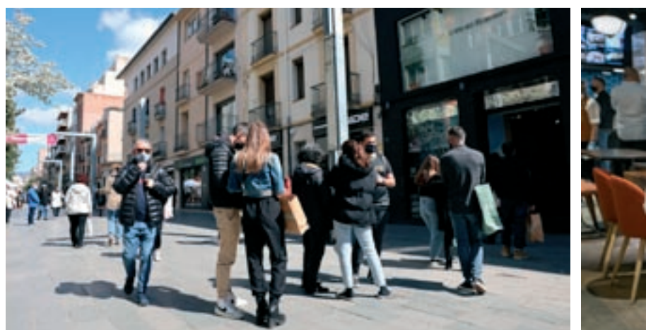
D'esquerra a dreta, les botigues van poder obrir sense límits a partir de l'octubre, els restaurants...