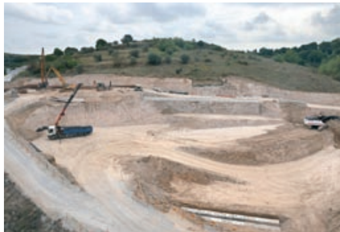
GRISelda ESCRIGAS / JULIÁN VÁZQUEZ