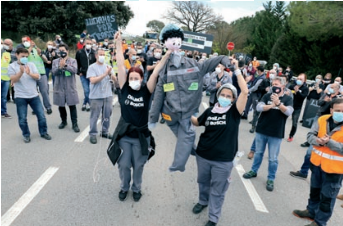
Una de les mobilitzacions de la plantilla de Bosch en plena negociació sobre les condicions per als 340 acomiadaments