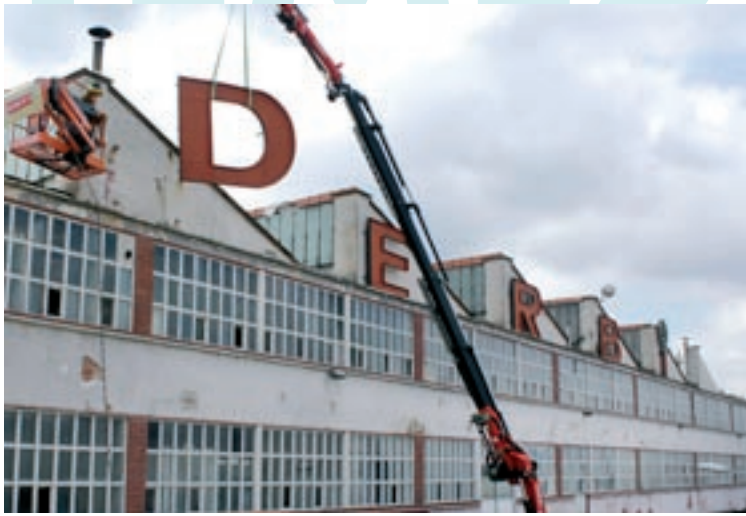
El rètol de Derbi es va despenjar abans de l'enderroc de la històrica nau