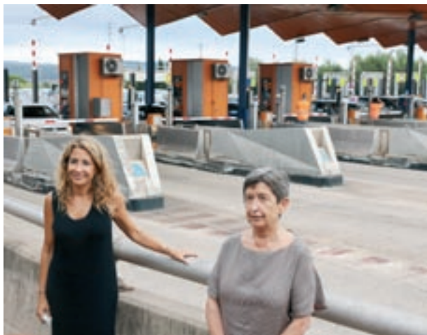
i, a sota, un peatge obert i la ministra a la Roca