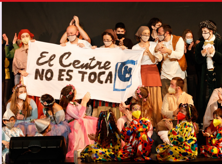
Actors i actrius al final de l'obra, amb la pancarta defensant el teatre

La representació Nit de Reis que es fa al Teatre El Centre de Sant Quirze va celebrar aquest cap de setmana un segle. Aquesta vegada també es tenia de reivindicació. Els actors i actrius van exhibir una pancarta en defensa de l'entitat, que té un conflicte obert amb un veí.