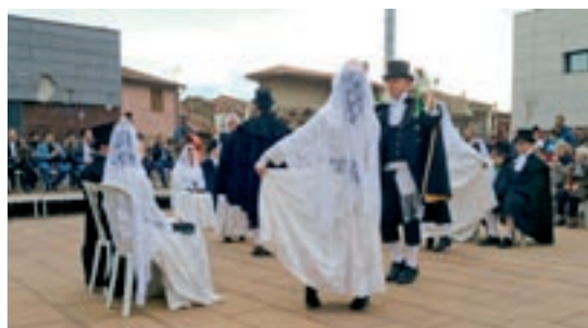
COBLA CIUTAT DE SABADELL

El baieton és un trinxat típic del Moianès. A Calders el serveixen per Sant Vicenç, dia 22 de gener. La particularitat d'aquest plat recau en el fet que utilitza una varietat de col autòctona: la col de Calders o col del Moianès. El plat destaca pel sabor intens i un color verd fort que li dona la col calderina i que el diferencia del trinxat de muntanya o d'altres trinxats de l'interior de Catalunya.