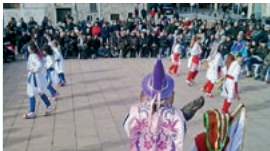
COBLA CIUTAT DE SABADELL

Moià és un exemple de poble que adapta les festes tradicionals als nous temps amb la flexibilitat indispensable per preservar-les i que