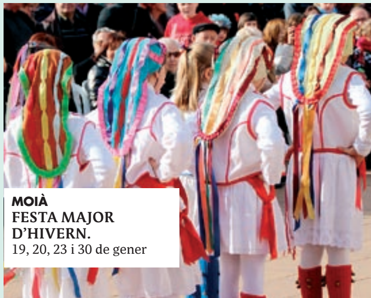
MOIÀ FESTA MAJOR D'HIVERN. 19, 20, 23 i 30 de gener

Castellcir. Camina per l'entorn del poble. Cal portar aigua, esmorzar i calçat ade-