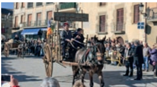
AJUNTAMENT DE CASTELLTERÇOL

El Pollo Matapuços Robaescaroles és una figura estrafolària que obre pas als garroffins, dos elements emblemàtics de cultura popular de Moià estretament lligats a la festa major d'hivern. La seva presència a les festes de Sant Sebastià es coneix des del segle XVIII. El Pollo també acompanya els gegants de la vila durant la festa major d'estiu per posar ordre, de manera poc eficaç, a la cercavila.