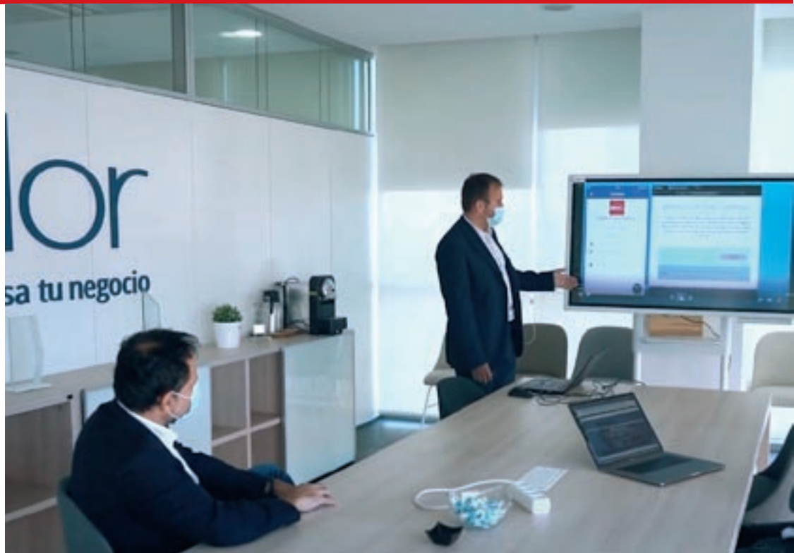
La presentació del projecte desenvolupat conjuntament amb la UVic, a la seu de Seidor

La iniciativa va partir de Seidor. L'empresa osonenca especialista en software de gestió i solucions de tecnologia amb alt valor afegit va oferir a la UVic-UCC la possibilitat de treballar junts en un projecte que comptava