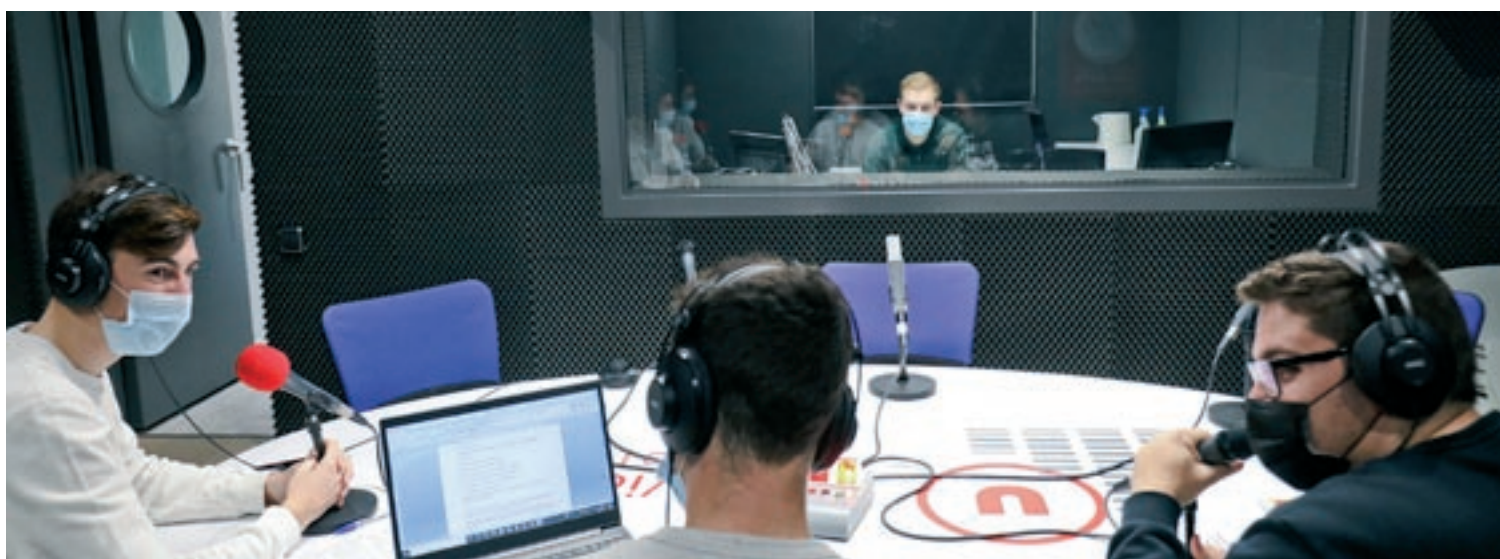
Un moment del programa 'RUVicub', aquest dimecres al matí a l'estudi