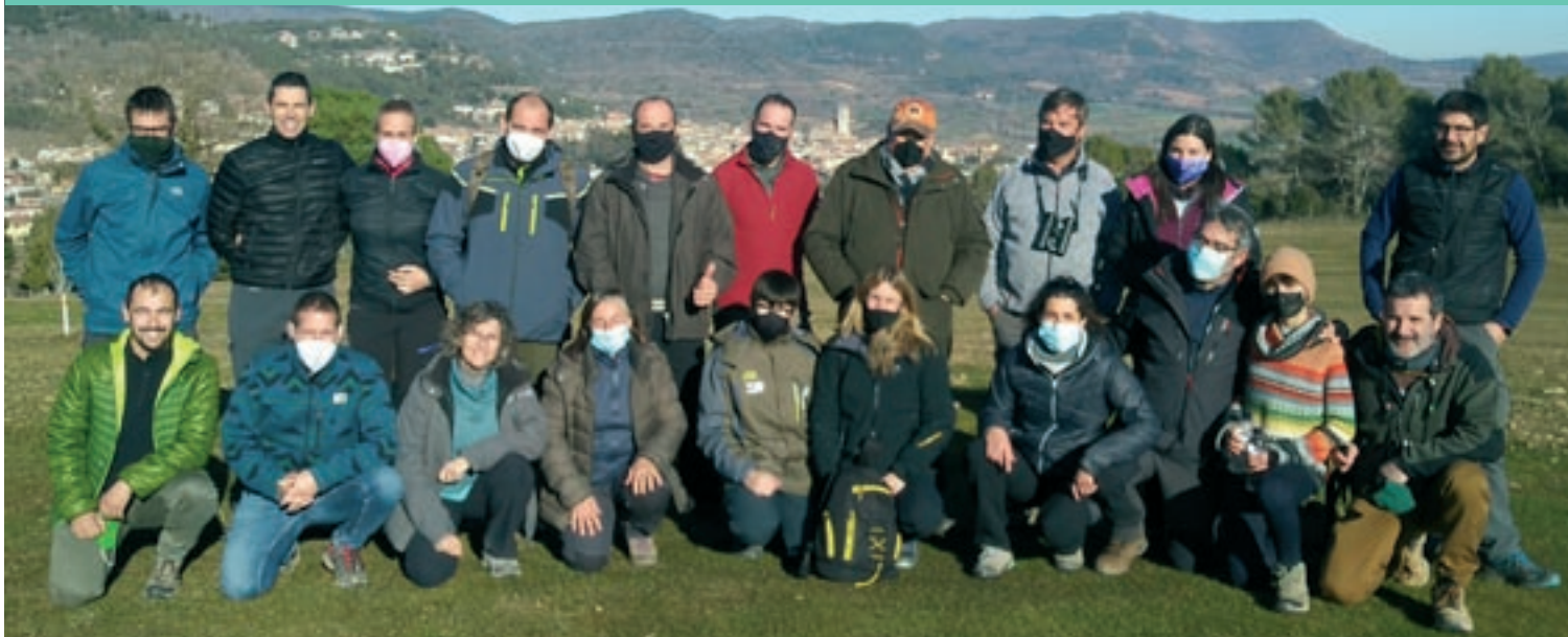
Alguns dels membres del grup que van recórrer els deu municipis de la comarca per fer el recompte d'espècies

Un grup d'aficionats a l'ornitologia s'ocupa de fer un recompte des del 2018