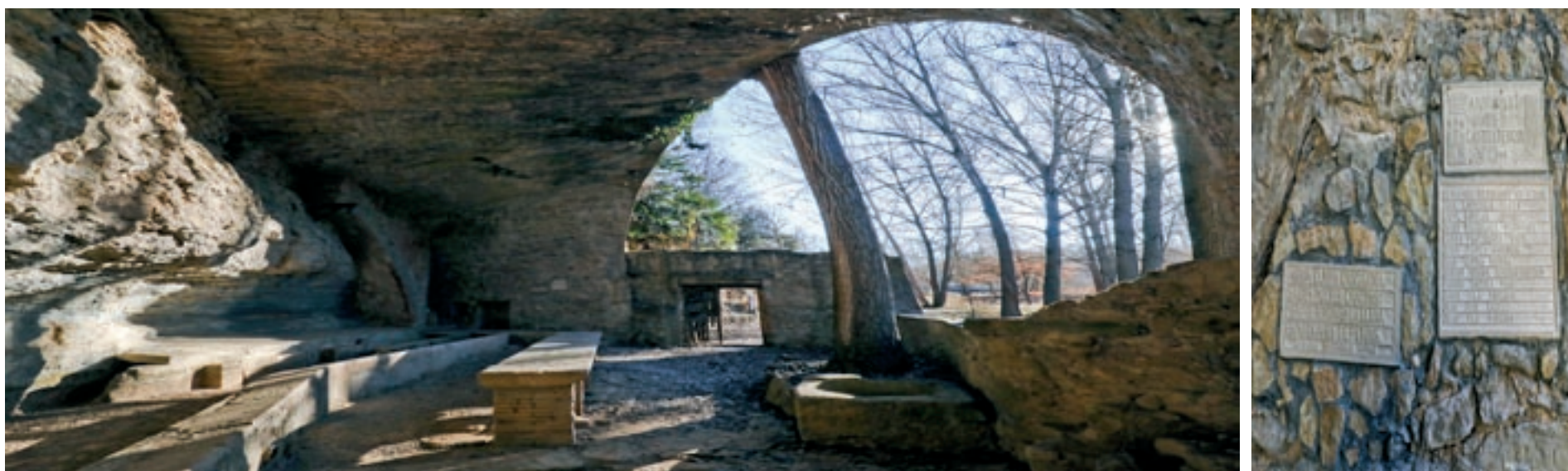
A dalt, el conjunt del rentador de llana. A sota, imatges de la planta inferior i la inscripció a la pedra amb els noms dels voluntaris que van fer la troballa