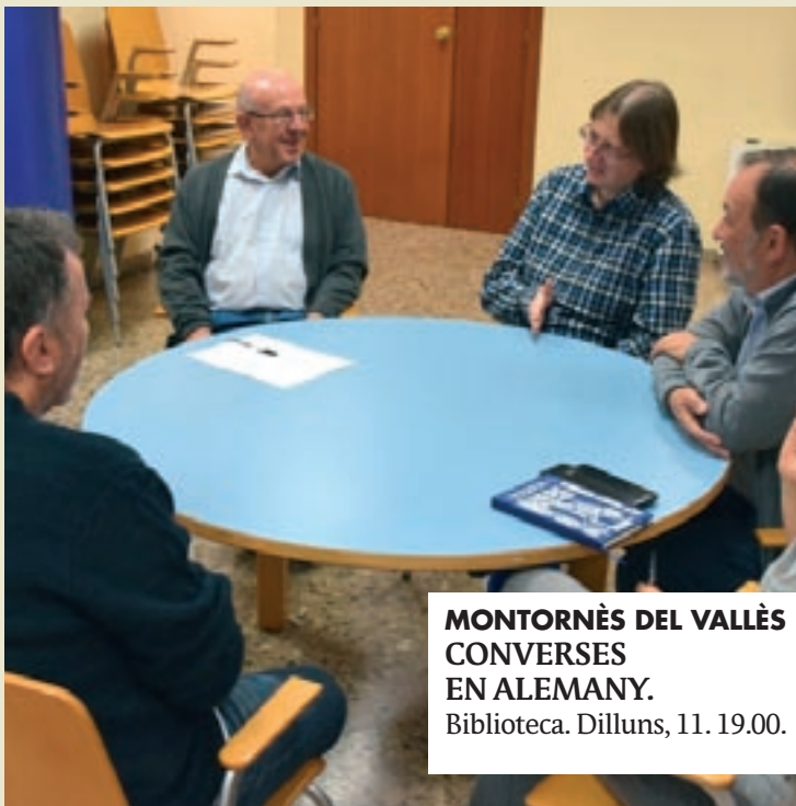
BIBLIOTECA DE MONTORNÈS