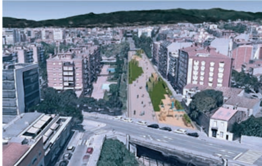
Estat actual i imatge virtual amb les vies cobertes i urbanitzades des del pont de Josep Umbert.