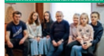
Reagrupant la família des de Castellterçol

Més de la meitat dels refugiats ucraïnesos que han arribat al Moianès són menors d'edat