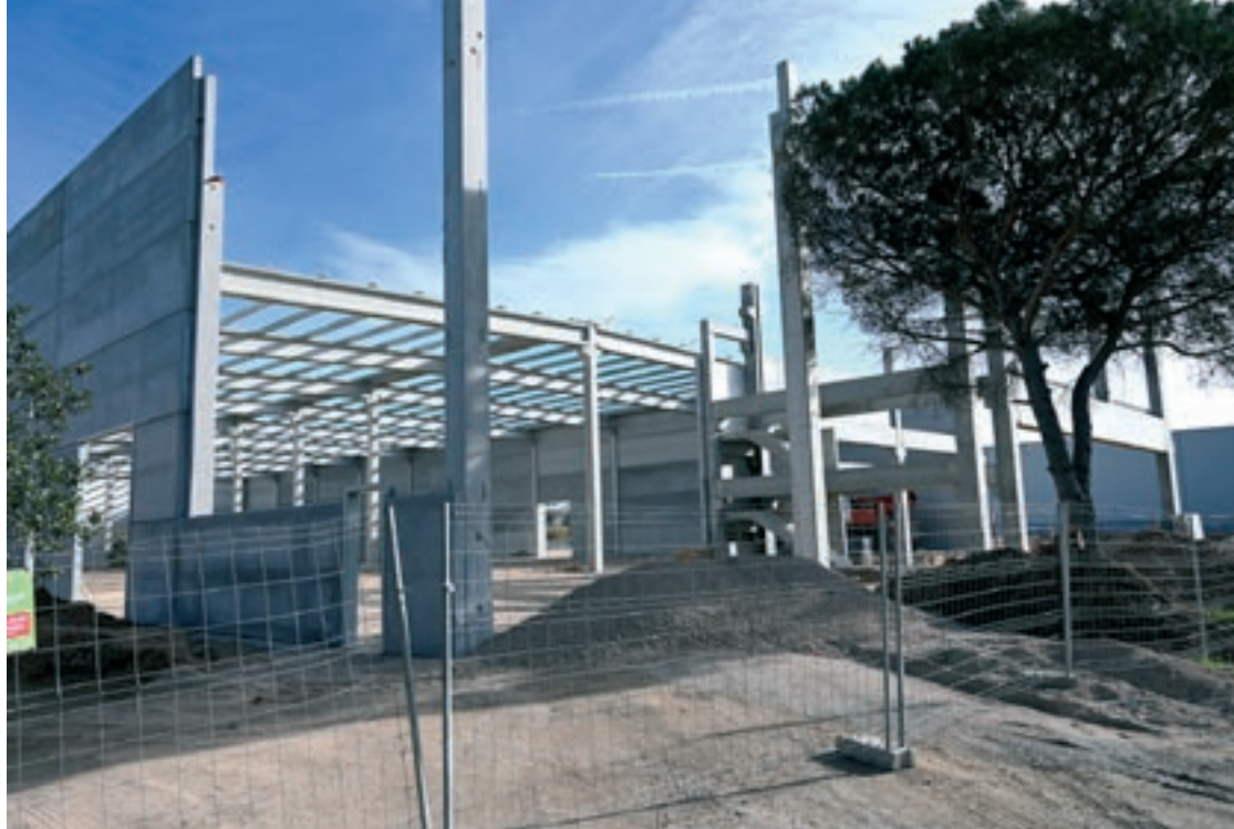
La construcció de noves naus, o la reforma completa d'instal·lacions actives, caracteritza el mercat industrial a la comarca

Mentre la demanda creixia, empesa per una major liquiditat i accés al crèdit, l'oferta es reduïa i això es va traduir en una limitació del volum de negoci que es podria haver generat i, també, en una alça de preus que ha situat el Vallès Oriental com la quarta comarca catalana més cara (723