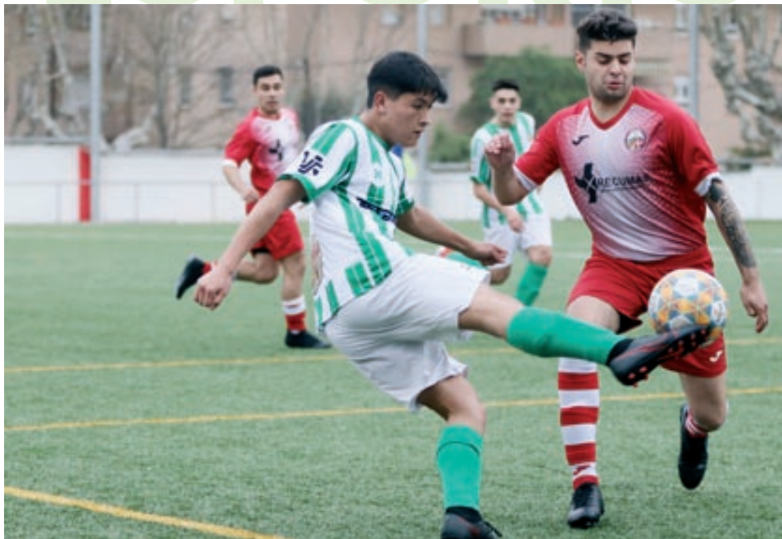
El Sant Celoni no va donar opció a La Batllòria, tot i que es va avançar en el marcador