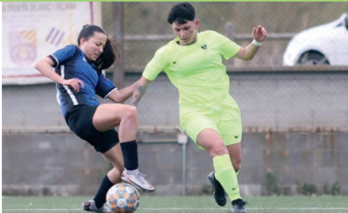
Coral trepitja la pilota per desfer-se de la pressió d'una jugadora de l'Igualada. La jugadora roquerola va marcar l'1 a 1

El Palautordera va encaixar la primera derrota en la fase d'ascens en perdre injustament al camp del Fundació UE Cornellà per 2 a 1 amb dos gols que van arribar en accions polèmiques. El Palautordera es va avançar amb un gol d'Ona i, a excepció dels primers minuts de la represa, va ser total dominador del partit. Un penal inexistent i una falta rigorosa a prop de l'àrea van suposar els gols que van permetre al Cornellà capgirar el resultat.