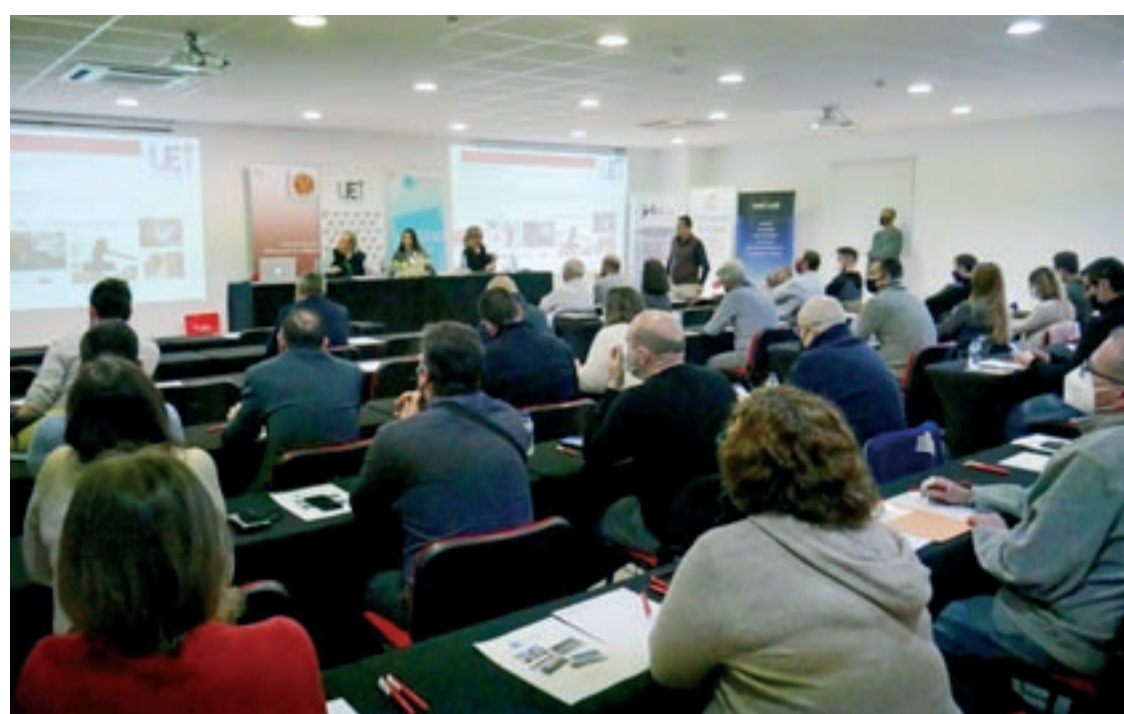
La jornada va aplegar una cinquantena d'empresaris del sector a la sala d'actes de la UEI

La cadena d'autoescoles Hoy-Voy va inaugurar la setmana passada el primer centre a Mollet. És la segona autoescola de la marca al Vallès Oriental, on ja tenia presència a Granollers. La de Mollet és la 38a autoescola Hoy-Voy de la companyia. Situada a l'avinguda Burgos, el centre té una superfície de 60 metres quadrats i ha suposat una inversió de més de 30.000 euros. Hoy-Voy implanta a Mollet el model, amb suport tecnològic i adaptació de tarifes i horaris, en el qual els alumnes no paguen si no aproven. El grup va facturar l'any passat 18 milions d'euros, un 29% més que el 2020.