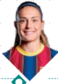
09 ALEXIA PUTELLAS FUTBOLISTA MOLLET DEL VALLÈS