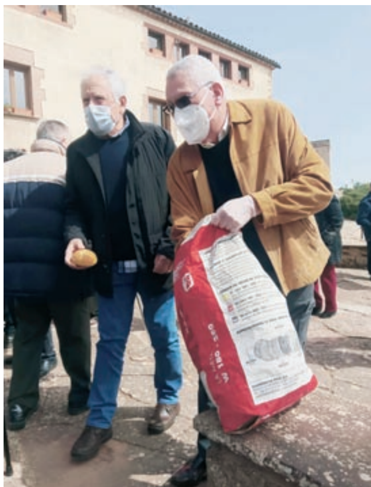
El repartiment de panets durant l'Aplec de Puiggraciós dels veïns de Figaró

la imatge de la marededéu que serà rebuda de manera solemne a la plaça de l'Església cap a les 10 de la nit amb un repic de campanes, el ball de l'homenatge i altres elements de cultura popular. La imatge s'estarà tota la jornada de dissabte –Sant Jordi– a l'església de Sant Esteve. Diumenge, a les 8 del matí, se sortirà a peu cap a Puiggraciós, on es preveu l'arribada cap a les 11 del matí. Hi haurà una missa de vot de poble amb la Cobla Maricel i l'Escolania Parroquial. A les 12, es farà una ballada de sardanes i, cap a 2/4 de 2, un dinar popular. A la tarda, hi haurà una quina i un concert de sardanes.