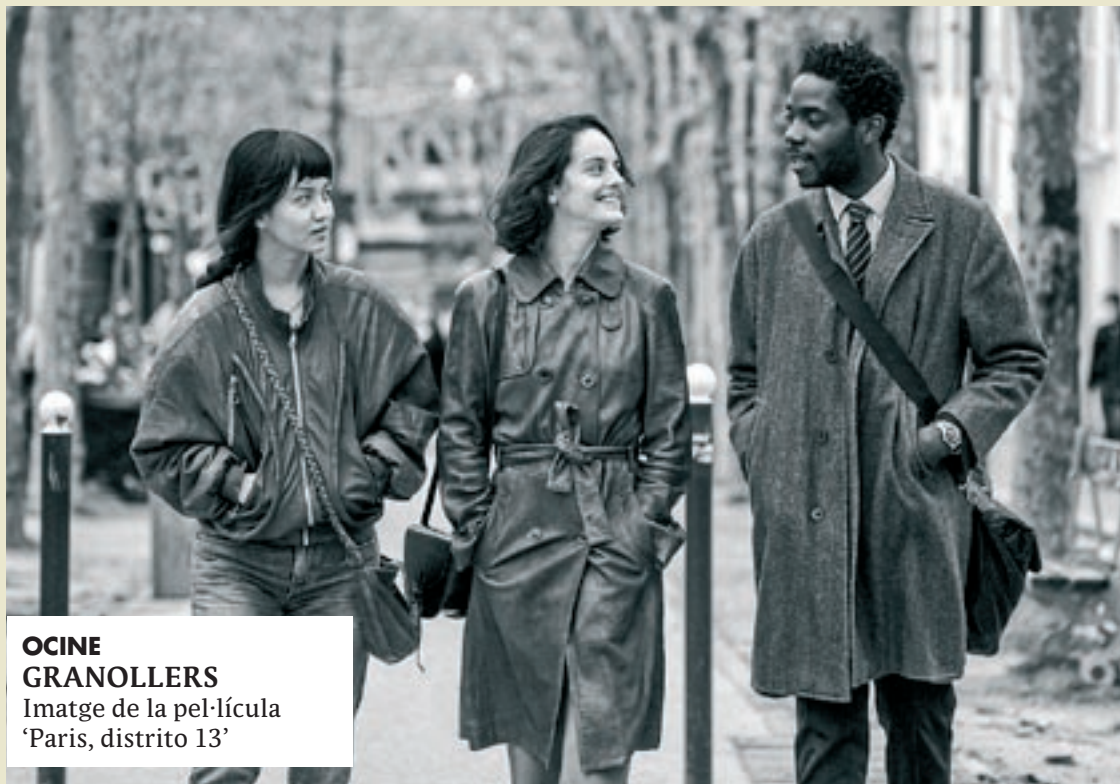
OCINE GRANOLLERS Imatge de la pel·lícula 'Paris, distrito 13'