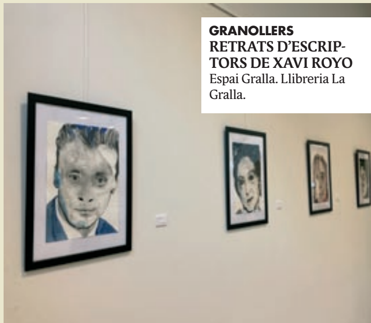
GRANOLLERS RETRATS D'ESCRIP- TORS DE XAVI ROYO Espai Gralla. Llibreria La Gralla.

“Retorn a Granollers del retaule gòtic de Sant Esteve”. Fins al juny del 2022.