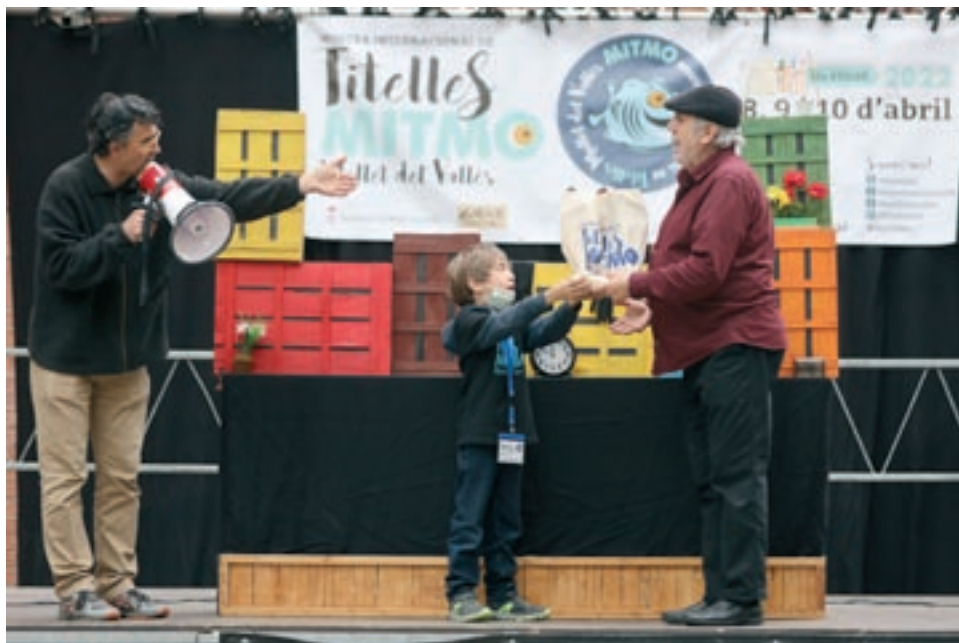
A la fotografia de l'esquerra, l'espectacle 'La que escombrava l'escaleta', de la companyia L'Invisible. A la dreta, l'espectacle inaugural de la Mitmo, 'En Patufet', de la companyia Galiot Teatre