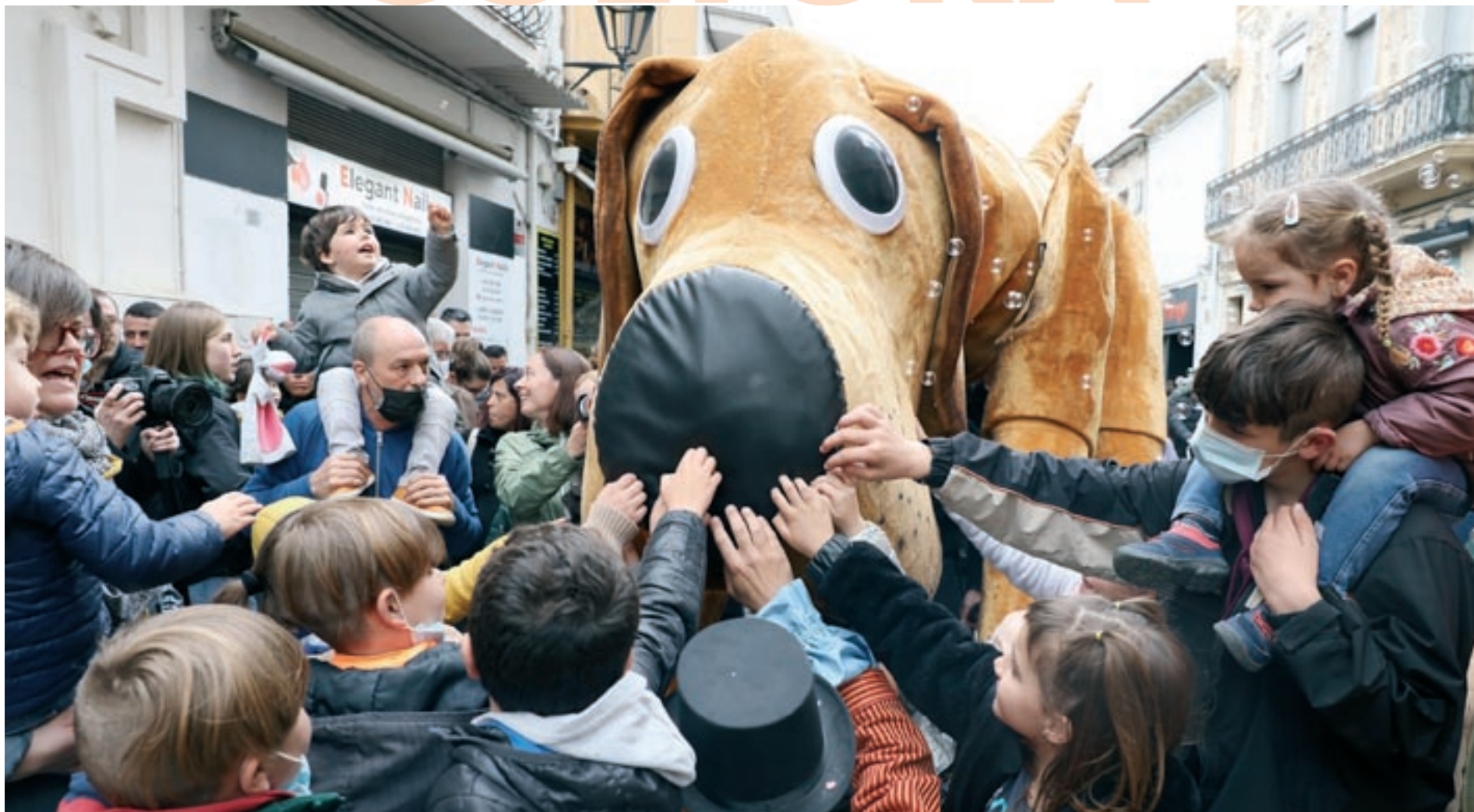
L'espectacle itinerant 'El petit Lilo', de la companyia Actua Produccions va aplegar públic de totes les edats, diumenge al matí al parc de les Pruneres