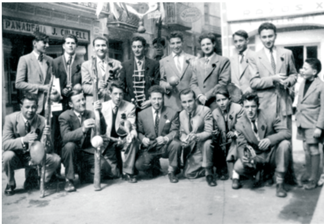
Les Joventuts Caramellaires –en una foto del 1952– són una de les agrupacions que recorda el llibre