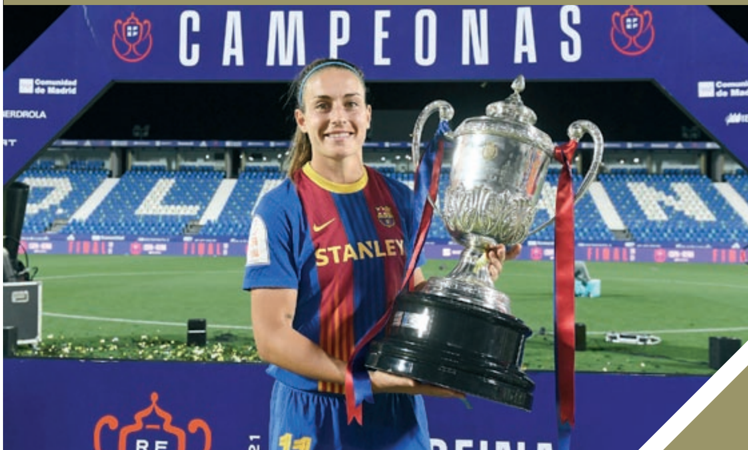
Alexia Putellas va culminar el triplet del Barça la temporada passada amb la consecució de la Copa del Rei