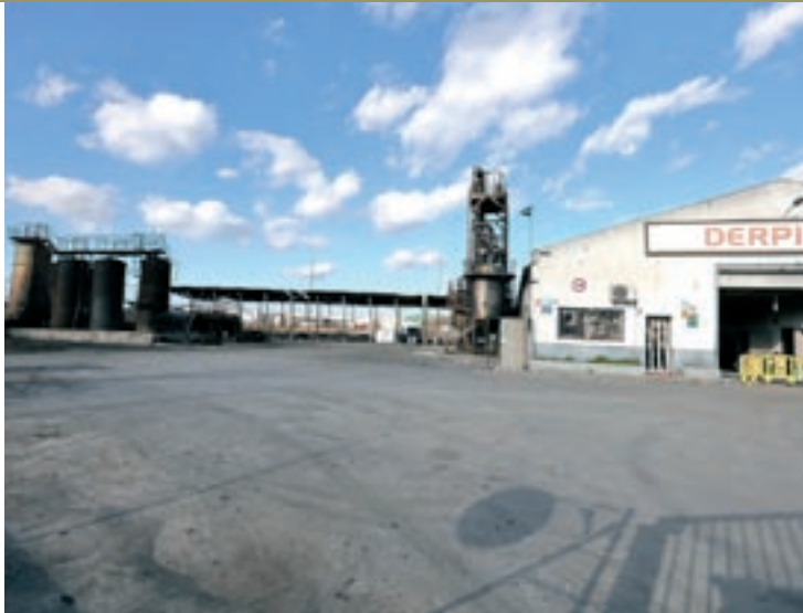
El solar de Ditecsa el desembre de 2022, dos anys després de l'incendi

gestionat com un canvi d'importància pels augments de les tones a l'any de dissolvents que es tractaven, de la quantitat d'aigua que es consumia per fer l'activitat de reciclatge d'aquests productes o pel major consum energètic que es requeria. Dels sis querellats, n'hi ha tres del servei de prevenció de la Direcció General de Qualitat Ambiental –una tècnica, el seu cap i el cap d'aquest– que van intervenir en l'autorització de l'augment d'activitat de l'any 2014. I tres més de l'OGAU –una tècnica, un cap