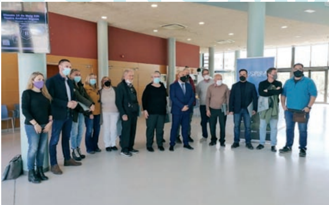
Els productors assistents i els representants dels municipis que impulsen la creació de la DOP

Montornès i les Franqueses figuren entre les poblacions catalanes que han experimentat un descens més acusat en el preu dels habitatges en el primer trimestre de l'any, segons dades del portal especialitzat Fotocasa, elaborat a partir de les ofertes que té disponibles. Montornès retrocedeix un 13% trimestral i és la segona població catalana amb més descensos, mentre que a les Franqueses el preu mitjà baixa el 6,9%. Arreu de Catalunya, durant el primer trimestre, els preus van pujar el 2,2%.