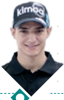
08 ÀLEX PALOU PILOT D'AUTOMOBILISME SANT ANTONI DE VILAMAJOR