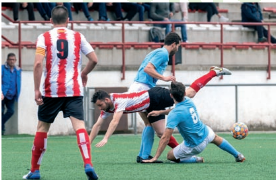
El partit entre el Cardedeu i el Torelló va estar marcat per les targetes que va ensenyar l'àrbitre

La Molletense ho tenia tot de cara per endur-se el partit d'aquest diumenge al migdia contra el Montcada. Els del Vallès Oriental hi van posar les ocasions i el domini en el joc. Malgrat intentar-ho, i tot i tenir un 0-1 favorable quan faltaven pocs minuts