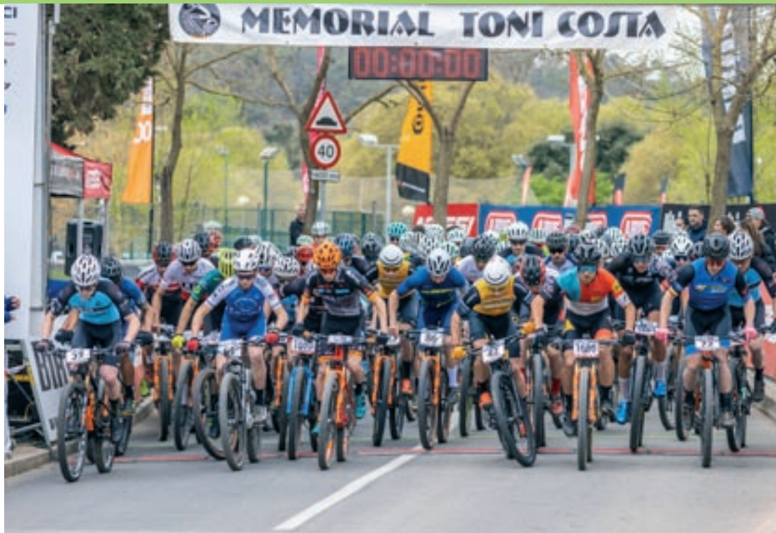
Sortida de la cursa Elit/Sub-23 des de la zona esportiva de Corró d'Amunt