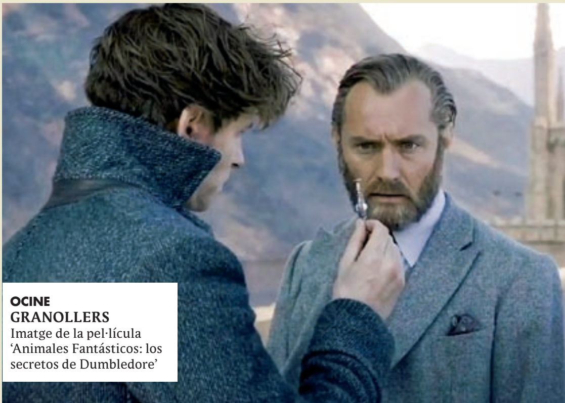
OCINE GRANOLLERS Imatge de la pel·lícula 'Animales Fantásticos: los secretos de Dumbledore'

Espanya 2022. Dir. Daniel Guzmán. Amb Joaquín González, Luis Tosar i Daniel Guzmán. Comèdia. Joaquín, Brujo i Luismi, tres canalles de barri, tornen a trobar-se després de vint anys. Brujo i Luismi segueixen sense ofici però amb algun benefici, mentre que Joaquín s'ha convertit en un important empresari. O això creu ell. Amb 47 anys continua vivint en Orcasitas, a casa d'Esther, la seva mare, de la seva filla i el seu germà. Joaquín viu en un 9èB, a nou pisos de la seva realitat, i un dia rep la notificació del jutjat informant-los de l'embargament de la casa per un préstec de Joaquín que Esther va avalar. Intentarà aconseguir els diners necessaris per a evitar el desnonament, però les brillants idees de Brujo i Luismi acabaran enfonsant Joaquín encara més en la misèria. Els tres amics iniciaran llavors una aventura desesperada per a solucionar el problema, i arrossegaran amb això tota la família.