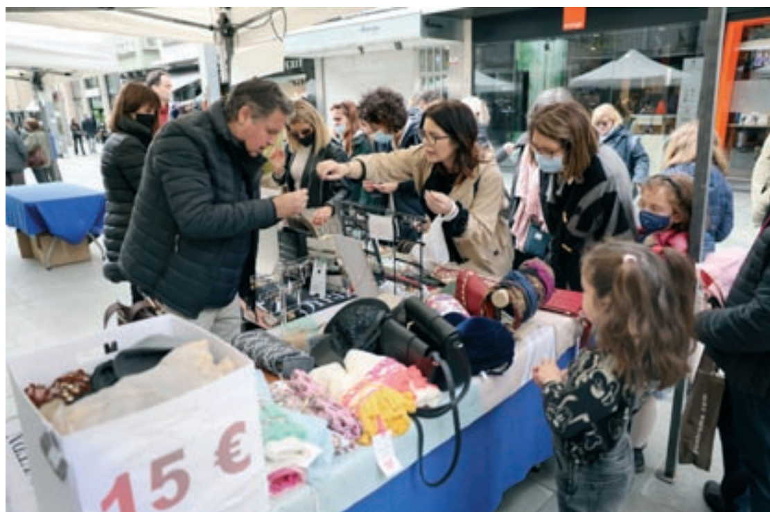
Una de les parades de la Gran Fira al Carrer, dissabte al migdia al carrer Anselm Clavé

La Gran Fira al Carrer se celebra dos cops l'any, els mesos de març i setembre, coincidint amb el final de les temporades d'hivern i estiu. Enguany, però, l'edició