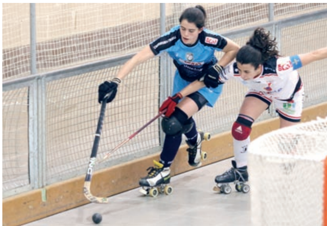
Dues jugadores disputen la bola en el partit que va enfrontar l'ORKLA i el Telecable Gijón

Doble compromís de lliga per a l'ORKLA Bigues i Riells aquest cap de setmana, amb sort diferent. Dissabte van jugar i guanyar a domicili per 0-2 al Mataró i diumenge es van enfrontar a casa en partit avançat al Telecable Gijón, corresponent a la jornada 23, amb qui van perdre per 3 gols a 0.