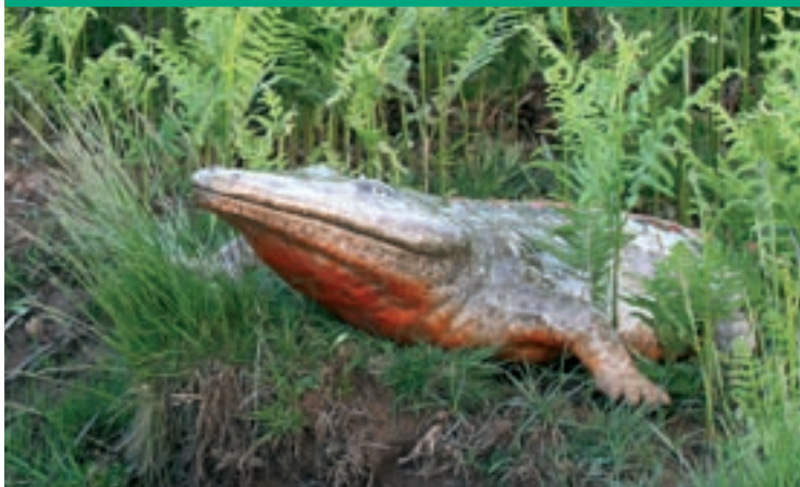
ENRIC PLANAS / RICARD MATEU

(Pàgina 17) Una de les imatges de la mostra