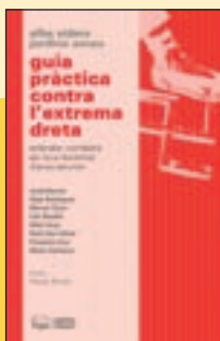
'Guia practica contra l'extrema dreta' A. Sidera i J. Arnau / Pagès Ed.

Amb aquest recull, l'autora va guanyar el premi dels Jocs Florals de Barcelona d'aquest 2022. La memòria i el passat, una mirada personal sobre l'erotisme i una exploració dels somnis constitueixen les tres parts del llibre d'aquesta destacada violoencelista que fa gairebé 10 anys va començar en paral·lel la trajectòria literària.