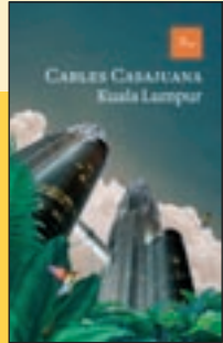
'Kuala Lumpur' Carles Casajuana Ed. Proa

Diplomàtic amb una ja dilatada trajectòria com a novel·lista, Carles Casajuana va publicar per primera vegada aquesta novel·la que ara es reedita l'any 2005. Ambientada a la capital de Malàisia quan es constrüen les famoses torres Petronas, és un relat negre però no exempt de les pinzellades d'humor que caracteritzen el seu estil.