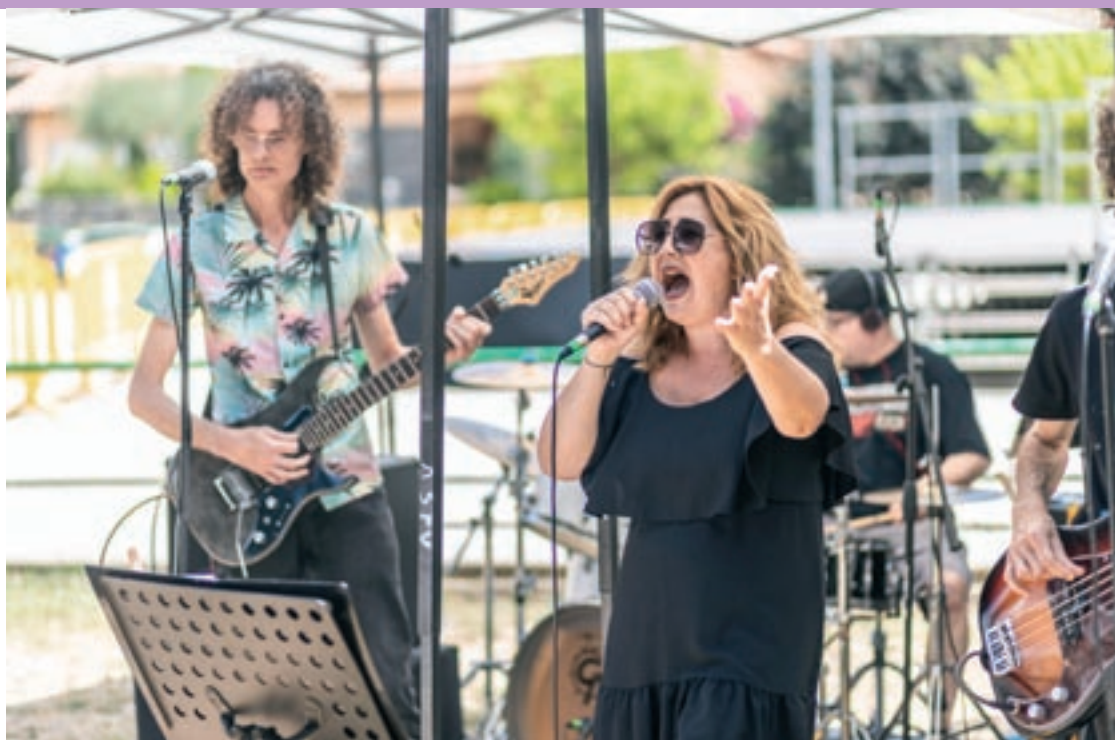
Concert vermut amb Reservoir Rock, diumenge al migdia a la plaça de l'Ajuntament

Una de les primeres activitats va ser la inauguració a La Mongia de l'exposició fotogràfica "Els capitosaus tornen al Montseny" amb la