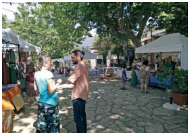
La Fira de les Esquelles es va situar a la plaça de la Vila de Montseny

A més d'Aguilà, artesans com Aida Palau o Ramon