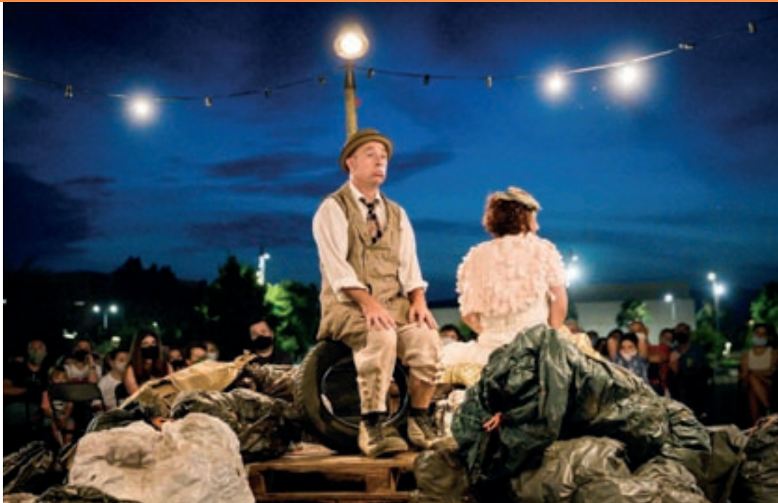
La companyia Industrial Teatrera representarà 'Herència' aquest dimecres

La dansa també serà present a l'Obert per Vacances. El 2 de juliol amb el col·lectiu local Liant la Troca, i el seu espectacle de dansa integrada Los nadie , i el 6 i el 13 de juliol amb dos itineraris de dan-