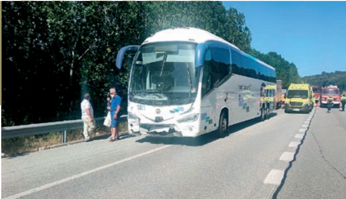
En primer terme, l'autocar accidentat, durant els treballs de l'operatiu d'emergències activat arran de l'accident

Entre els tres ferits, tots ocupants del turisme, un es trobava aquest diumenge una menor es trobava en esta crític, una dona tenia afectacions greus i un home tenia ferides de caràcter menys greu. El Sistema d'Emergències Mèdiques va traslladar els ferits a l'Hospital de la Vall d'Hebron. No hi va