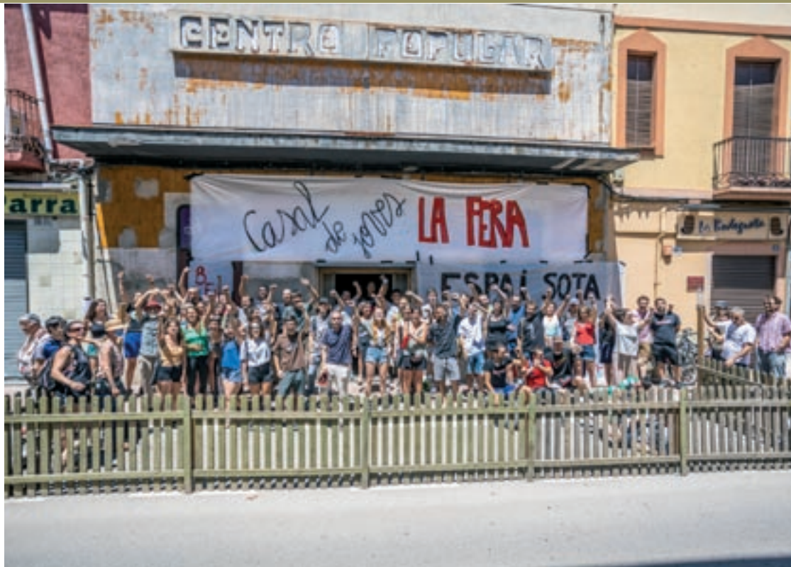
El Casal de Joves La Fera va néixer dissabte al migdia, després de l'ocupació del Centre Popular de la carretera Vella

L'espai que han ocupat té dues plantes i s'allarga a banda i banda: des de la carretera Vella al carrer de Sant Antoni, on hi ha acoblat el Centre Excursionista de Sant