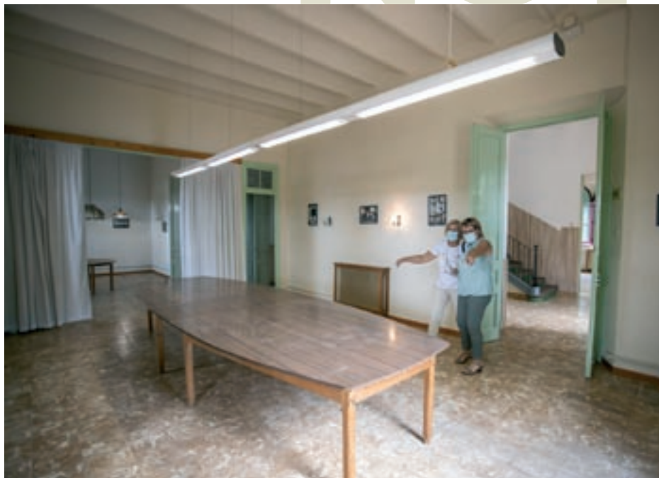
Interior de la Casa de les Monges en una jornada de portes obertes de fa un any