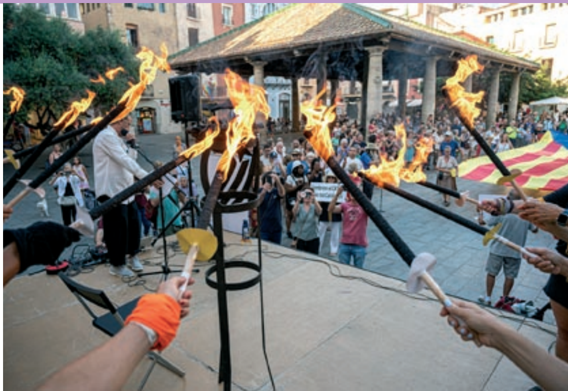
L'arribada de la Flama del Canigó a la Porxada de Granollers, dijous al vespre

L'acte, que va aplegar unes 200 persones al voltant d'una