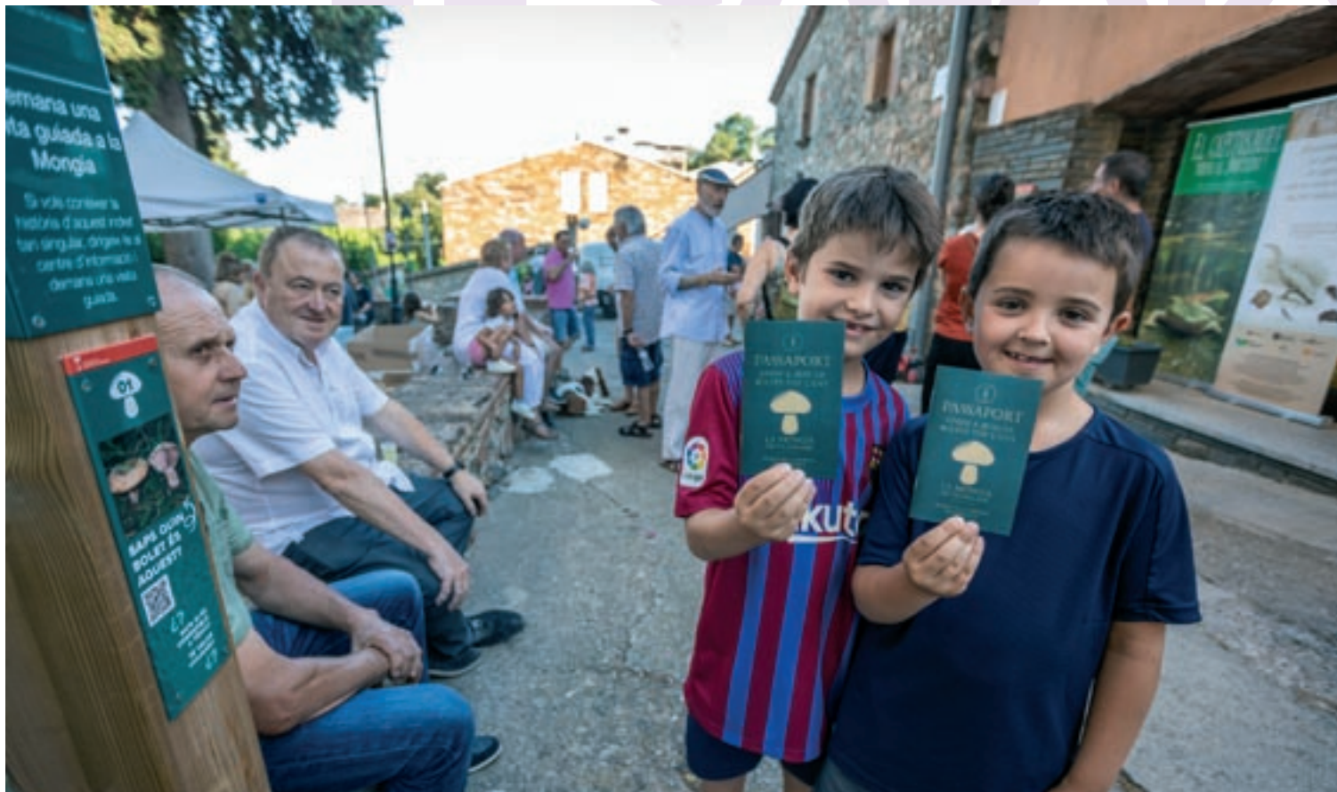
Presentació del passaport "A Vilamajor, bolets tot l'any", divendres al vespre a La Mongia