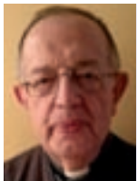
Alexandre Codinach Diac @santestevegr

El proper diumenge 3 de juliol celebrarem la Jornada per a la Responsabilitat en el Trànsit en la proximitat de la festa de sant Cristòfol, patró dels conductors, i també coincidint amb l'inici dels desplaçaments massius per carretera per vacances. Es tracta d'un bon motiu per apel·lar a la responsabilitat de tots a la carretera, no per temor a una multa, sinó per amor a Déu i respecte al proïsme. Conduir, i conduir bé, és una manera d'exercitar el sentit de