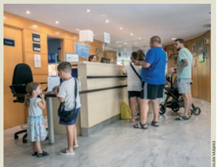
Turistes a l'hotel Holiday Inn Express de Granollers, divendres passat