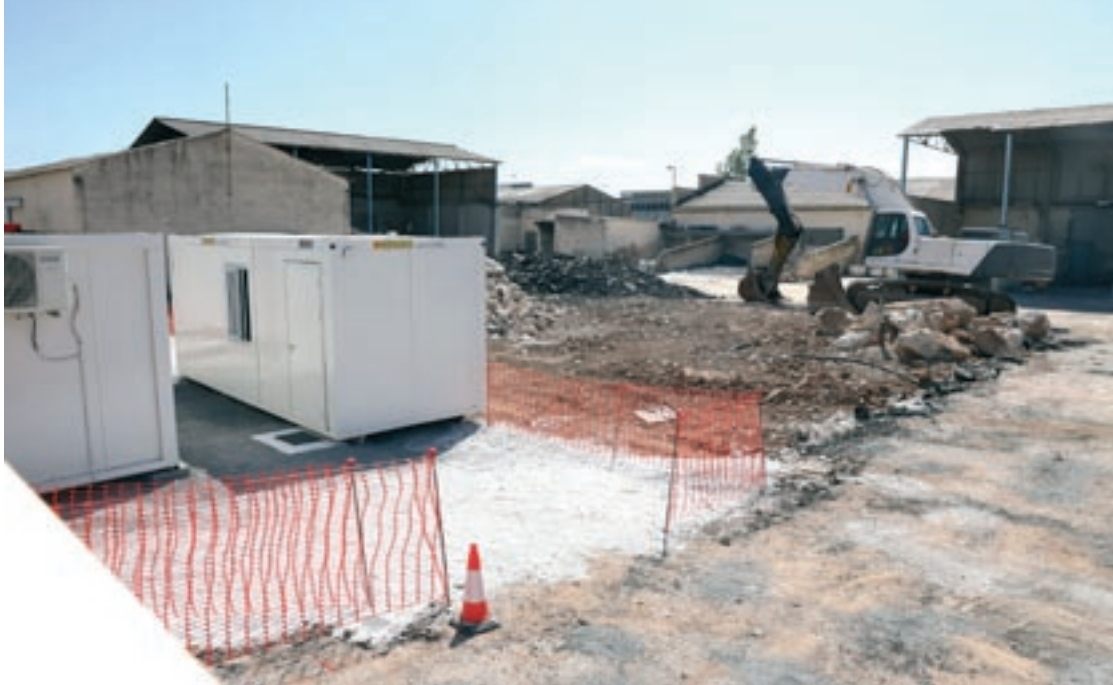
Les obres de la promoció que construeix Trammell Crow han començat recentment

Trammell Crow, filial promotora del grup immobiliari CBRE, ha començat les operacions a l'Estat i entre les tres primeres operacions que ha formalitzat hi ha el desenvolupament d'una promoció de 8.594 metres quadrats sobre el terreny de 13.787 metres quadrats que ha adquirit. Les obres ja han començat i s'espera que la promoció, que es concretarà en una transacció fora de mercat, s'enllesteixi a final