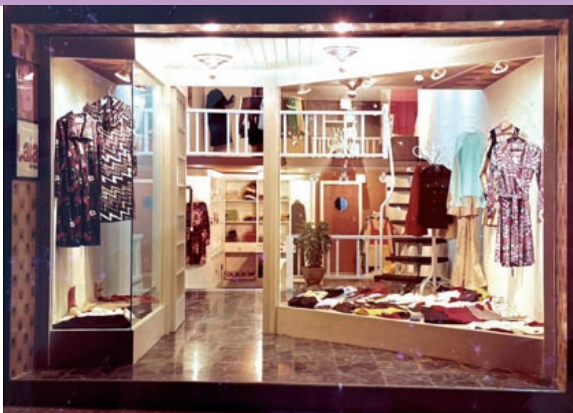
Una foto antiga de l'aparador de Boutique Laia, que aviat es convertirà en Miona Fashion Lab