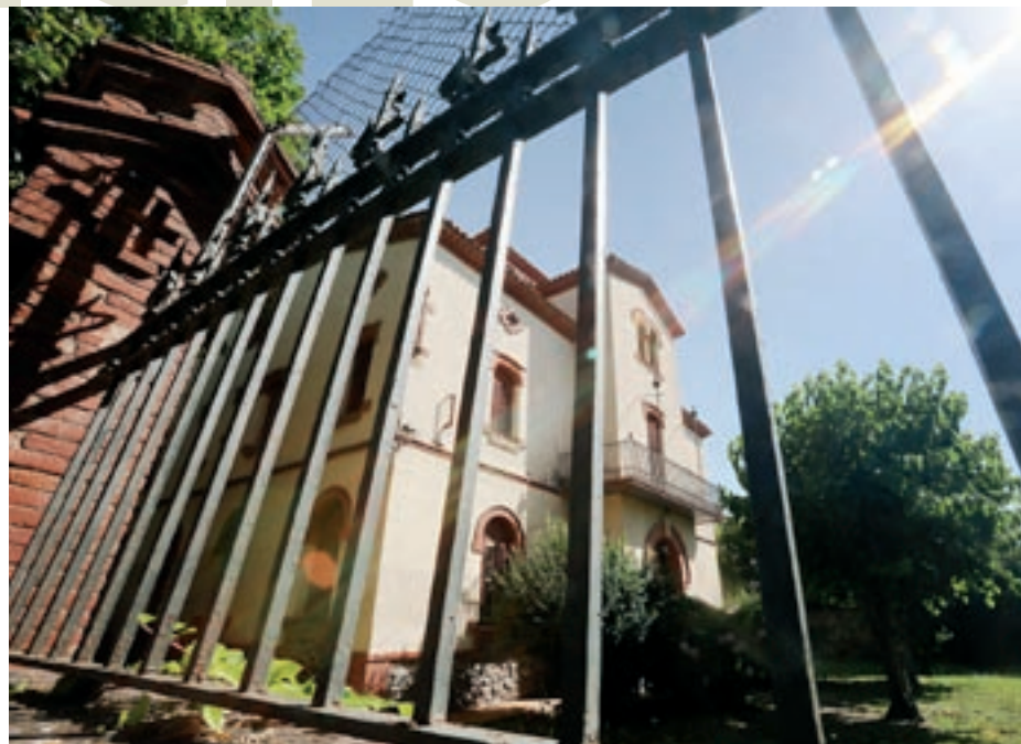
L'exterior de l'edifici en una imatge de l'any 2020