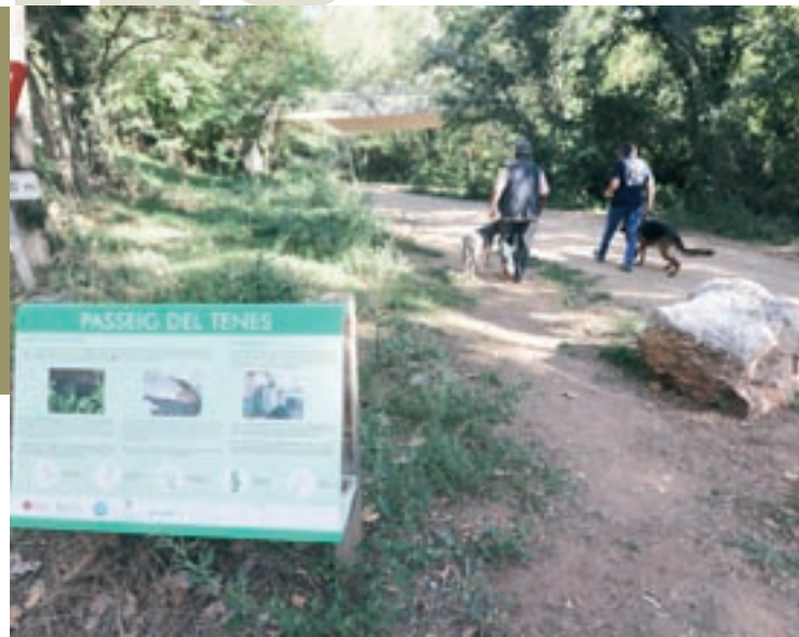
El passeig del Tenes prop de Can Noguera en una imatge de 2019

l'Ajuntament ha reprès la vigilància als accessos al Tenes i recorda que no és permès l'accés motoritzat, el bany ni accions que poden perjudicar l'entorn natural del riu.