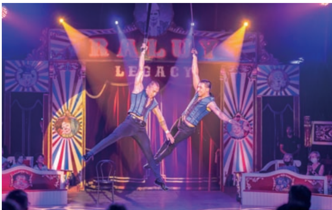
Una de les dues funcions d'"In Art We Trust" que el Circ Raluy va fer dissabte a la tarda a Montornès

Els actes de foc es van acabar pels volts de les 2 de la matinada. Tot seguit, els més valents encara van poder gaudir del concert del grup Set de Rumba per tancar una jornada plena de disbauxa i ambient festiu.