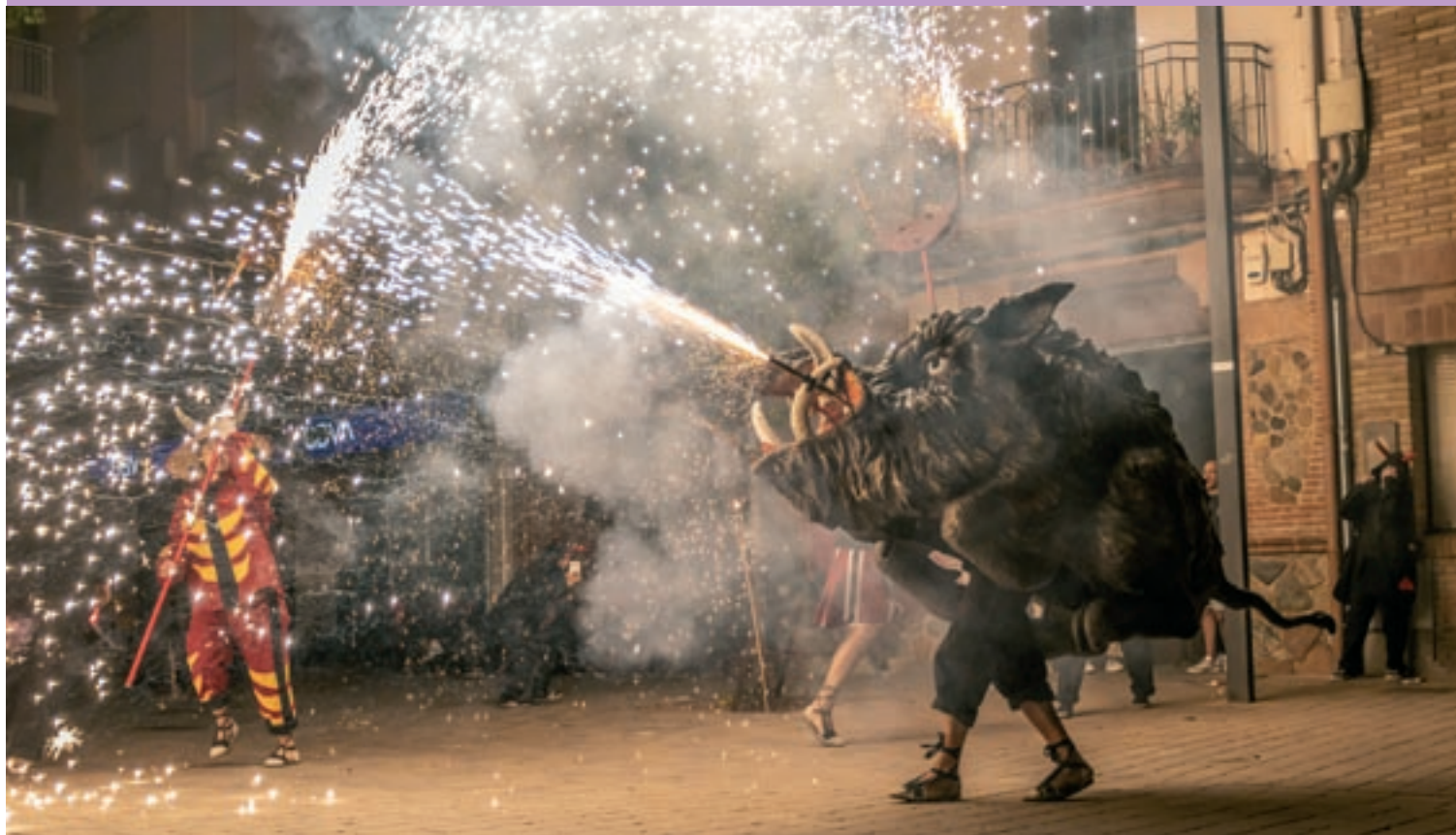
El ball del Verro, figura emblemàtica del bestiari de foc de Cardedeu, dissabte a la nit a la plaça Sant Corneli

Els Diables de Cardedeu celebren la Festa del Foc tot tornant al format pre-pandèmic