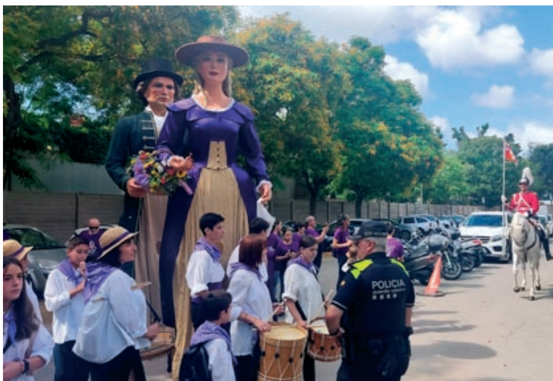
Els gegants de Parets, durant l'acte institucional de recepció de la Flama del Canigó al Parlament

estelada immensa, va acabar amb la ballada de la sardana de germanor de la Santa Espina.