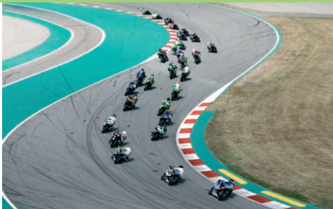
Espectacular vista de la xicana al final de la recta principal, poc després de la sortida de la cursa Superbike júnior