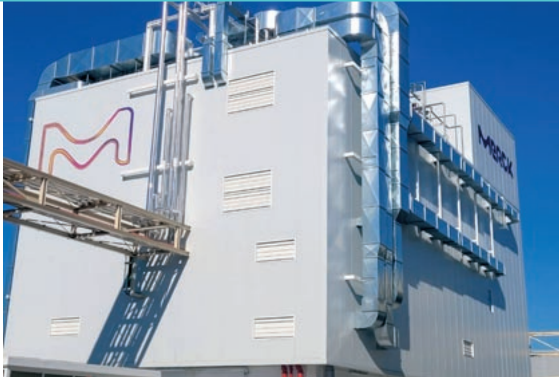
Espais que acolliran la nova producció a la planta de Merck a Mollet

L'ampliació de la planta de la divisió Electronics a Mollet suposa una manifestació de l'aposta del grup internacional Merck per l'Estat espanyol. També reforça el compromís d'aquesta planta amb el subministrament