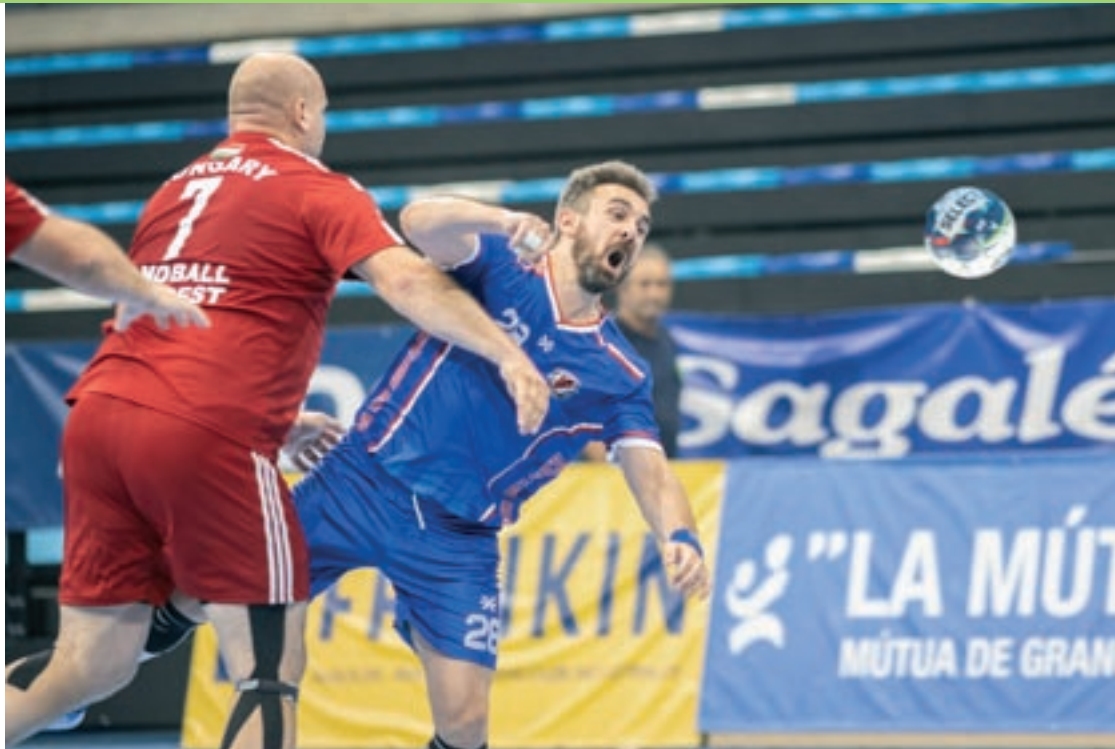
La final en categoria +45, entre el Budapest Old Boys i el BM Sevilla, va ser de les més disputades