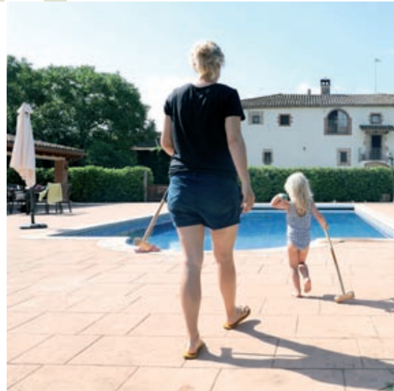
A la imatge de l'esquerra, treballadores de l'hotel balneari Termes Victòria posen a punt les taules del menjador, dijous passat a Caldes. A la dreta, una família anglesa que visita Can Burguès Agroturisme per segon cop,