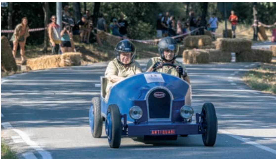
Un dels carretons que van participar en la cursa, dissabte a la tarda dins dels actes previs de la festa major de Bigues

També es va fer una cursa infantil, amb un recorregut més curt i un total de 18 carretons. En aquesta categoria, tots els participants van tenir premi. D'altra banda, també dins dels actes previs de la festa major, dijous es va fer la caminada cap a la posta de sol.