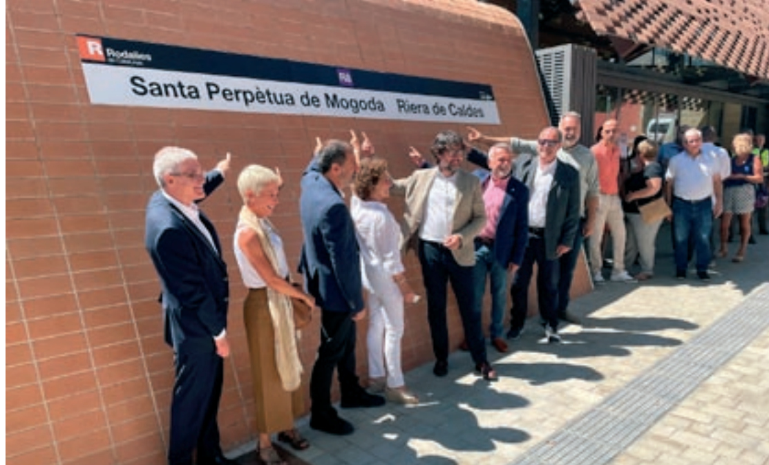
Les autoritats assenyalen el rètol de la nova estació, a la qual s'accedeix pel camí de la Granja

"Tenim ara una freqüència cada hora i jo crec que hem de duplicar aquestes freqüències i que, abans de