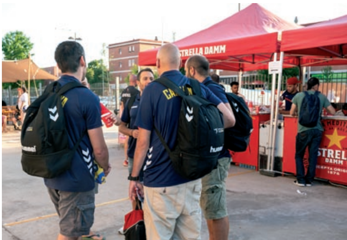
Alguns integrants de la Selecció catalana als afores del Palau, a la zona de lleure

categoria +50 com en +45, i per l'Odesa ucraïnès en +55.