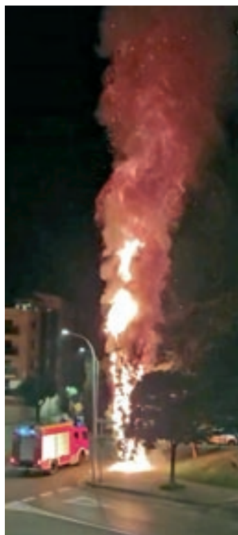
L'incendi d'un xiprer de Caldes

Per localitats, en conjunt, els Bombers van haver d'atendre nou incidències a Granollers. De la resta de municipis, destaquen les vuit actuacions a Mollet i Sant Celoni, set a Canovelles, sis a Caldes i tres a la Garriga. A la resta de municipis el nombre va ser inferior. En concret, hi