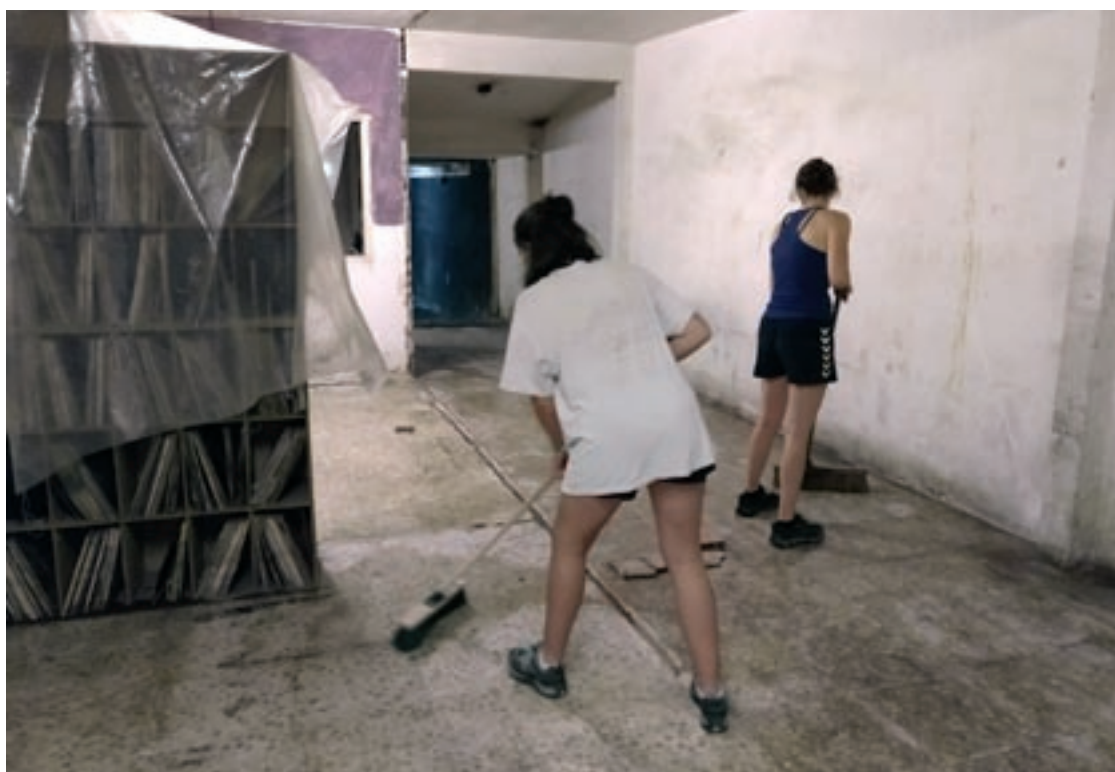
Dissabte els joves van començar a netejar l'espai on es troba el casal, que duia tancat 20 anys

Celoni, que té cedit un espai al mateix edifici. La idea de La Fera és convertir-se en lloc on fer activitats que ara no tenen on fer-se al municipi. “Troblem que el jovent està reclus i que l'oci i la socialització han quedat reduïts a l'espai privat”, explica una altra representant del casal.