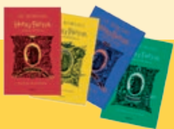
'Harry Potter i el misteri del príncep' J. K. Rowling / Empúries