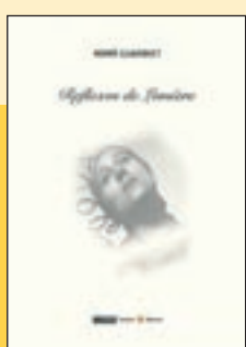
'Reflexos de Lumière' Romà Guardiet Ed. Laertes

Amb motiu dels 20 anys de l'estrena de la primera pel·lícula de la saga de Harry Potter, arriba una edició especial de la sisena novel·la de la saga. Especial perquè cadascú la pot triar segons la seva residència a Hogwarts: vermell per a Gryffindor, groc per a Hufflepuff, blau per a Ravenclaw i verd per a Slytherin. Tots amb il·lustracions de Levi Pinfold.