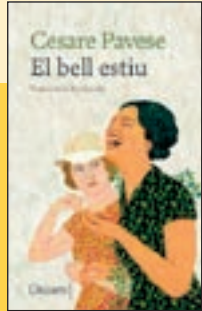
'El bell estiu' Cesare Pavese Univers

Retrocedim a un estiu dels anys 30 del segle XX, en aquesta novel·la on Pavese evoca aquest temps de l'any al Piemont. Llavors com ara, l'estiu és temps de descoberta i així ho viu la jove Ginia, de 16 anys, de la mà de la seva amiga més gran i sofisticada, Amelia. S'enamorarà d'un pintor enigmàtic i viurà un amor tan encès com efímer. Com l'estiu.