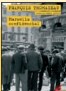
'Marsella confidencial' François Tomazeau / Crims.cat

Un japonès en plena carlinada? Això imagina l'autor en aquesta novel·la: la trobada de Blanca, cunyada del darrer pretendent carlí, amb Okita Soji, un dels darrers bushido , que arriba a Europa després que el darrer shogun és destituït. La princesa carlina el contracta com a mestre d'esgrima. Xoc de cultures i aventura a la Garrotxa del segle XIX.