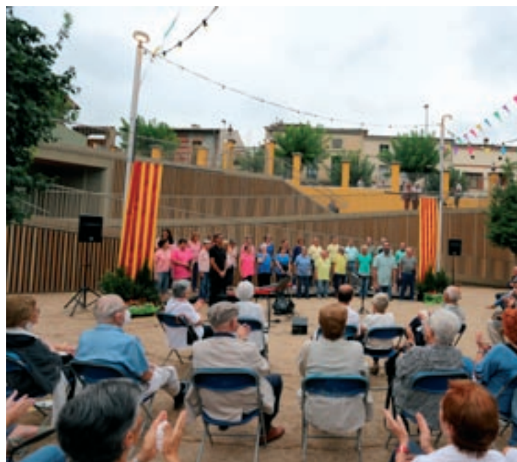
D'esquerra a dreta i de dalt a baix, la trobada de cotxes clàssics, la desfilada de Batuka Centelles, els Sagals d'Osona al Portal i el concert d'estiu de La Violeta