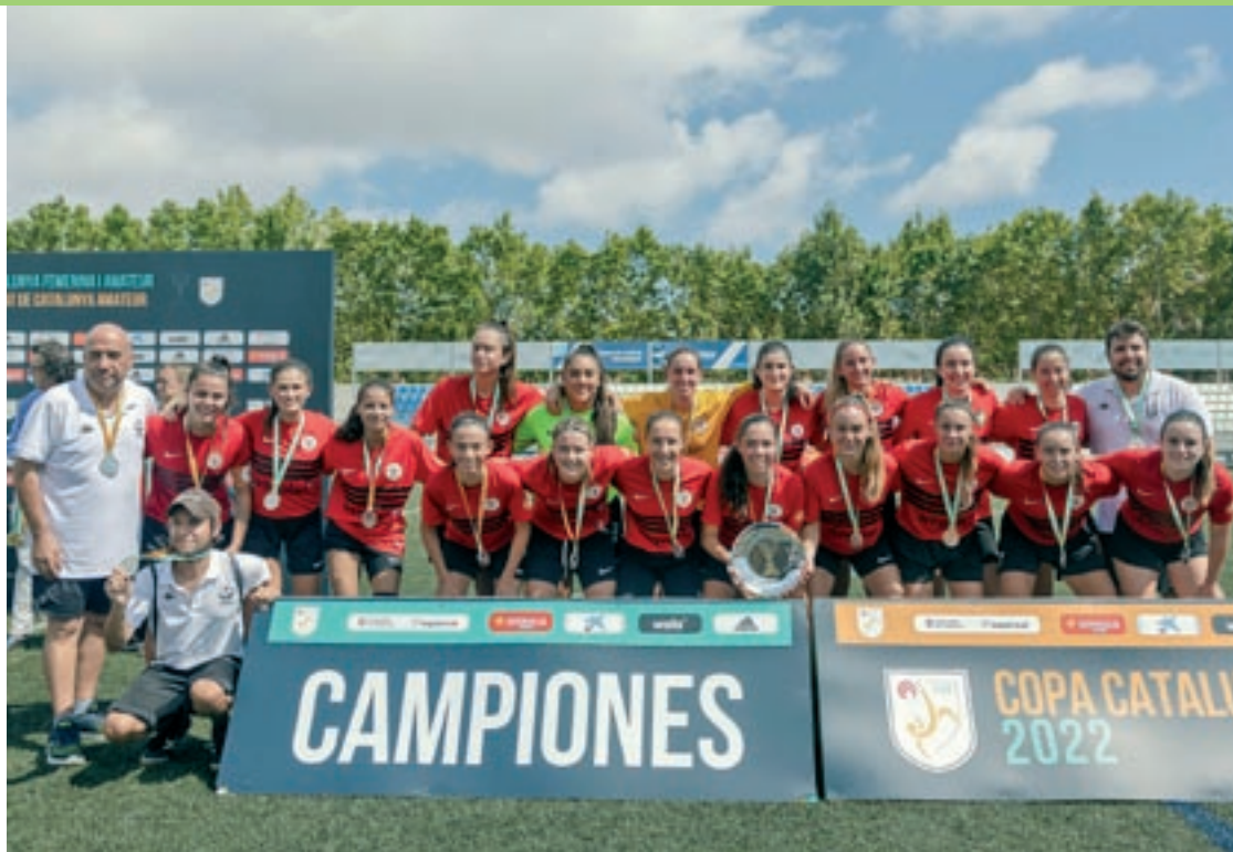
Les jugadores i el cos tècnic, amb les medalles i el trofeu de subcampiones

El Torelló és el primer equip amateur femení osonenc que es proclama subcampió de Catalunya. Tal i com li va passar el 2015 al Folgueroles masculí, les osoneneques