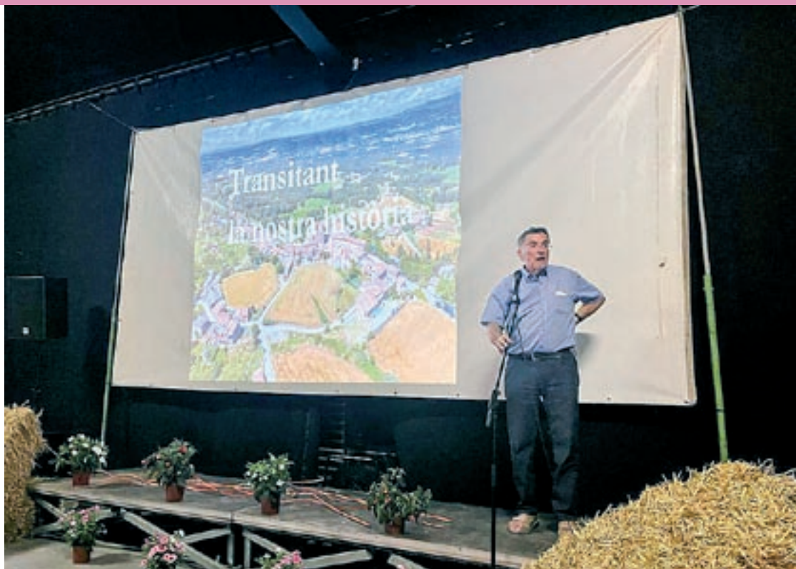
La presentació de l'audiovisual 'Perafita 3.0'

El vídeo està estructurat en diferents apartats com l'escola, les cases del municipi, el paper de la religió en l'àmbit local, el pas de la història o l'evolució d'una de les festes més representatives del poble: La Candelera, uns temes que els coordinadors van triar simplement perquè, segons especifiquen, eren dels que comptaven amb més informació. Gabarrós explica que se senten molt satisfets de la resposta del públic per-