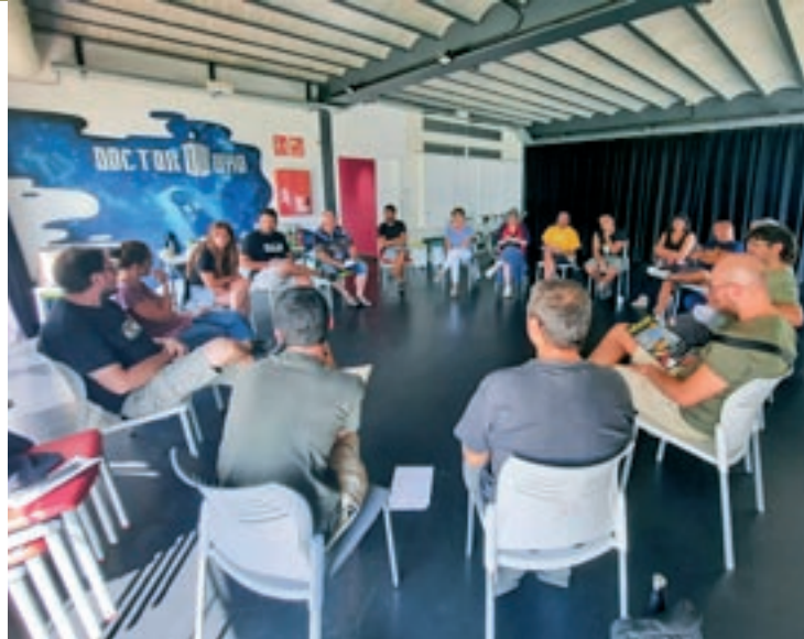
Un moment de l'assemblea oberta

Amb el motor per arribar a les municipals engegat, un cop s'hagi decidit el for-