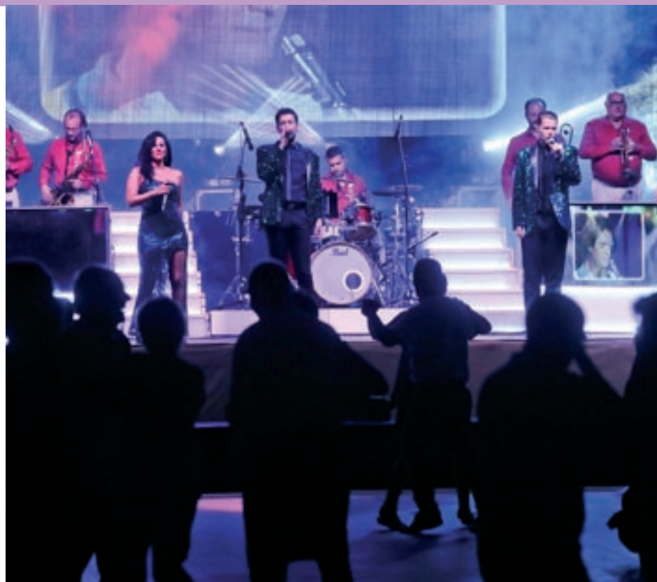
Dos moments de la festa major de Sant Hipòlit, la nit de dissabte. A l'esquerra, el correfoc i a la dreta el ball amb la Selvatana, en una nit en què coincidien activitats per a tots els públics