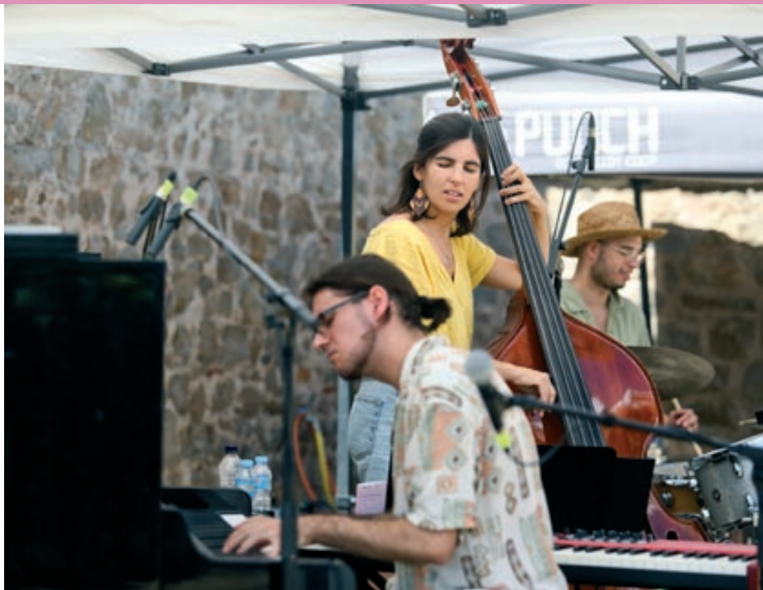
Els JF Trio, el primer grup que ha actuat aquest diumenge en els concerts del cicle Intrús, jazz pel forat del pany