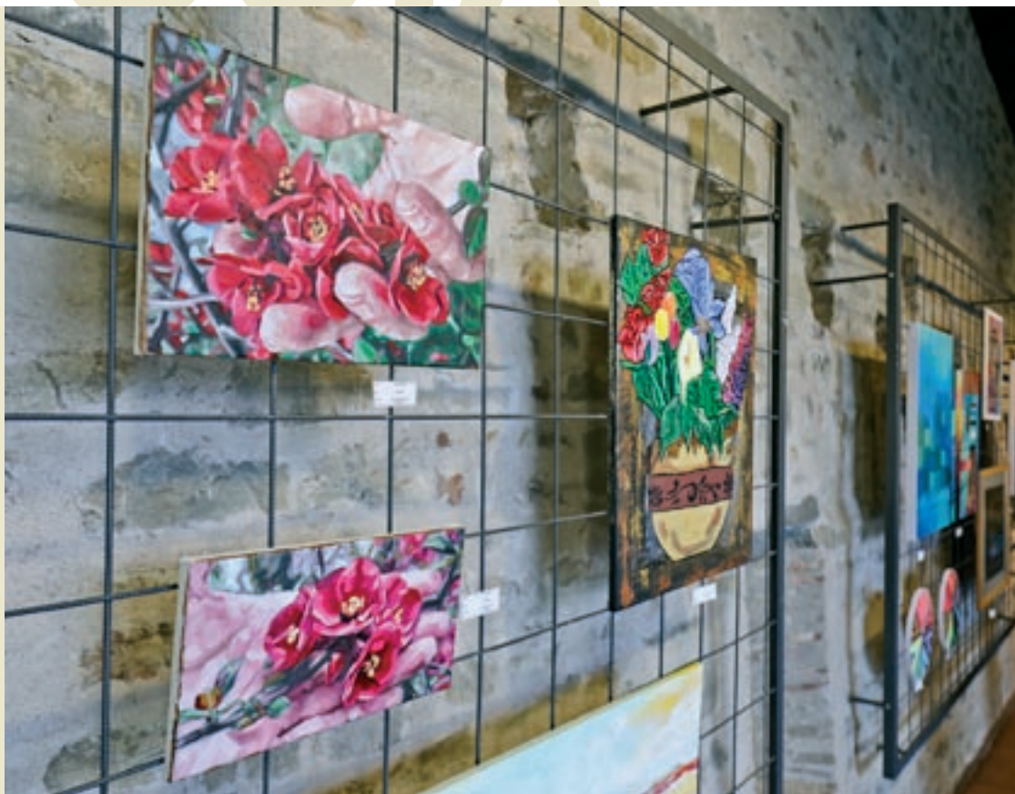
Detall de l'exposició "Bisaurart", que es pot visitar al Castell de Montesquiu fins al 25 de setembre

arrels" amb pintures de Pol Peiró. Horari: de dijous a diumenge de 18.00 a 20.00. Fins al 25 de setembre.