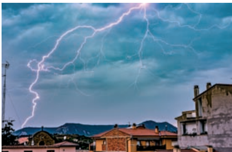
Imatges de boira, sequera i tempestes captades per fotògrafs osonencs aquest estiu