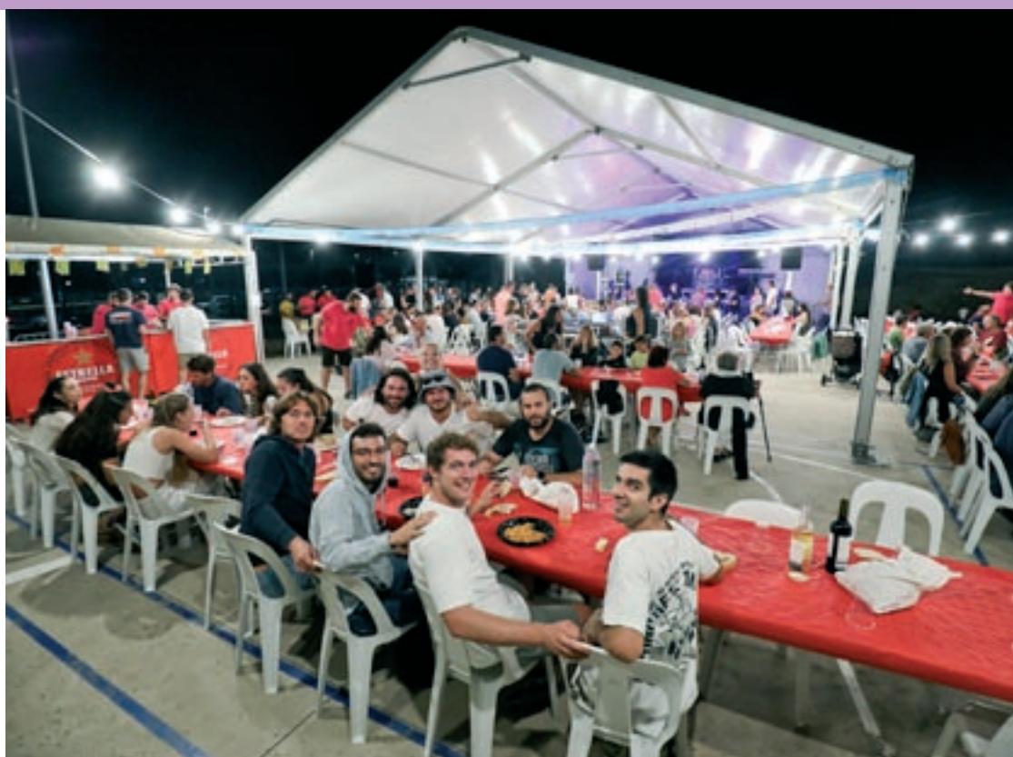
El sopar popular, aquest dissabte, un dels actes més concorreguts de la festa major de Santa Eugènia

El plat fort va arrencar dijous amb el ja tradicional Sopar del Revés, que va esgotar totes les entrades, acompanyat pel trio osonenc Pelat i Pelut. La festa va seguir l'endemà divendres amb la Santa Birra, que enguany recuperava el seu format de cercavila. Tot i això, les sorpreses no van ser poques. Algunes parades de cervesa es van convertir en un pis-