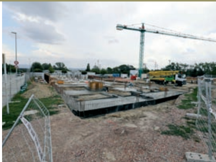
Vista actual de les obres de l'institut de Gurb, que van començar aquest juliol

Pel que fa a obres pendents, a Manlleu s'ha de resoldre la situació de l'institut del Ter, que des que va obrir ha operat en cargoles. Malgrat que era una prioritat pel departament d'Educació i els