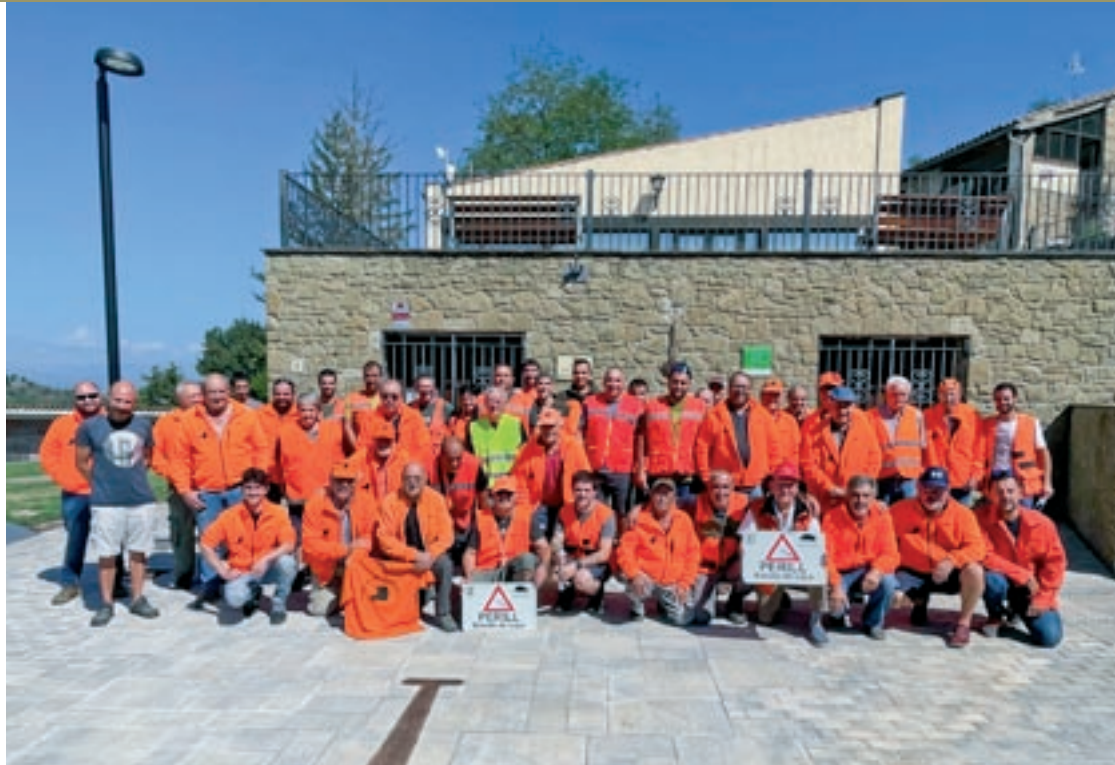
Membres de l'associació de caça Colla de les Guillerries, aquest diumenge a davant l'ajuntament de Tavèrnoles

Protestant a les 12 del migdia a davant dels ajuntaments. Així és com van viure els caçadors el primer dia de la temporada de caça del senglar, aquest diumenge: sense escopetes, gossos ni trets, i fent servir els petos taronges no per guanyar visibilitat a bosc, sinó per manifestar-se simultàniament arreu de Catalunya amb motiu del pols que mantenen amb el departament d'Acció Climàtica. Tal com detallava EL 9 NOU de divendres, el detonant de la vaga és un nou article que s'ha introduït a la normativa i que obliga les colles a comunicar amb 48 hores d'antelació on portaran a terme les batudes. La Generalitat defensa la mesura argumentant que incrementarà la seguretat al medi natural i servirà per compatibilitzar millor la caça amb activitats de lleure i esport.