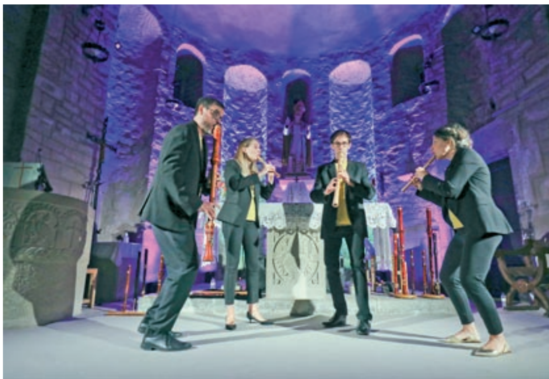
El concert d'obertura del Cap de Setmana de Música Barroca, divendres amb Windu Quartet

Windu va interpretar obres renaixentistes, barroques i contemporànies, com molt bé van dir, hi va haver un forat històric en què la flauta de bec, metafòrica-