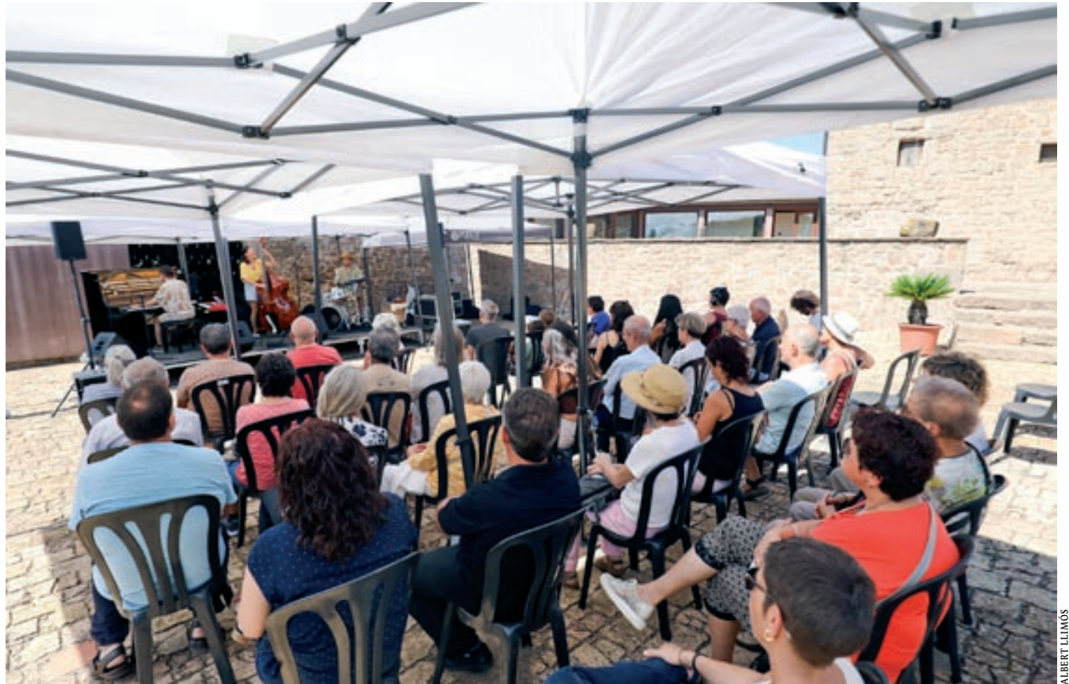
El primer concert de l'Intrús d'enguany, aquest diumenge al migdia a la Vila de Sant Andreu de Llanars, a Prats de Lluçanès

Perafita presenta un audiovisual amb imatges històriques