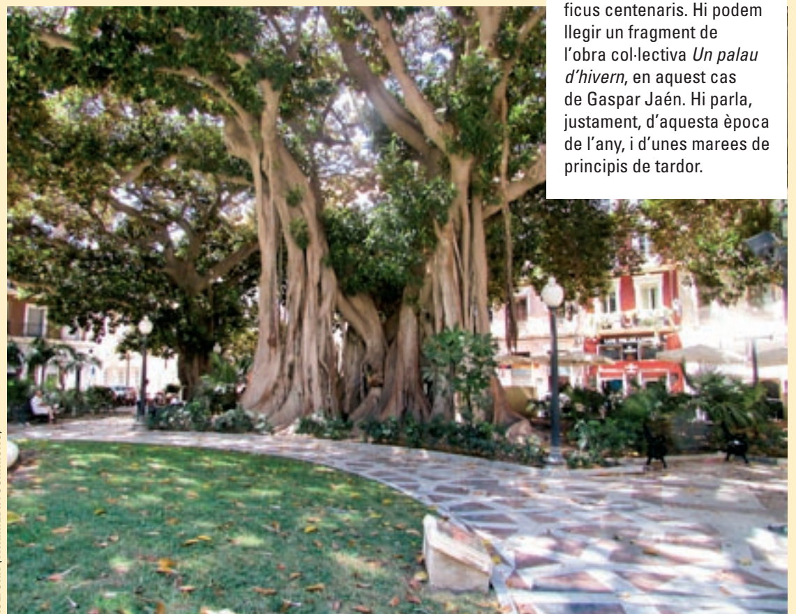
KOLFORN (WIKIMEDIA COMMONS)

La plaça de Gabriel Miró d'Alacant és coneguda popularment com la de Correus per acollir en un dels seus laterals l'edifici oficial d'aquest servei. També, antigament era coneguda com la plaça de les Barques perquè fins a aquest punt arribaven les embarcacions del port. A banda del monument dedicat a Gabriel Miró i la font de l'Aiguadera, obra de Vicent Bañuls, de 1918, hi destaquen diversos ficus centenaris. Hi podem llegir un fragment de l'obra col·lectiva Un palau d'hivern , en aquest cas de Gaspar Jaén. Hi parla, justament, d'aquesta època de l'any, i d'unes mareas de principis de tardor.