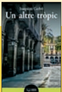
'Un altre tròpic' Joaquim Carbó Pagès Ed.

"La Sara el mira desorientada [...] La neu sembla que s'ha aturat i el llop es posa en marxa". La Sara és escriptora, viu força aïllada al Berguedà. I el llop, se'l troba un dia d'hivern a la muntanya. Sembla que s'entenguin des del primer moment. Ella fa 20 anys que no es parla amb el seu fill, i li dol. L'encontre amb l'animal li canviarà la vida.