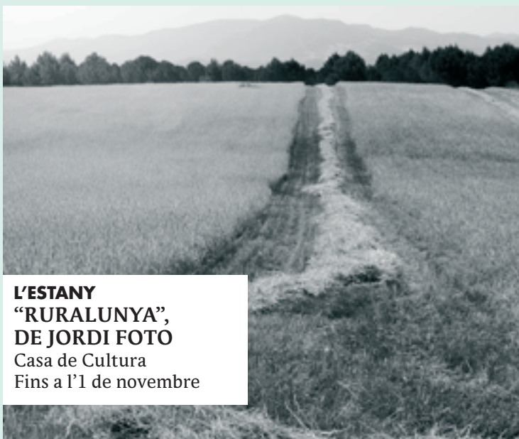
L'ESTANY "RURALUNYA", DE JORDI FOTO Casa de Cultura Fins a l'1 de novembre

Sala polivalent de la Casa de Cultura. "Ruralunya", fotografies de Jordi Foto. Fins a l'1 de novembre.