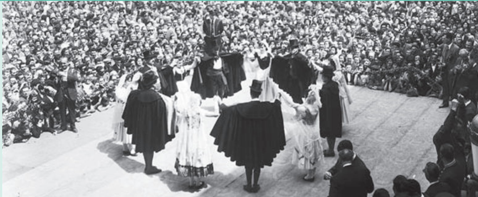
FAMÍLIA CUYÀS / INSTITUT CARTOGRAFIC GEOLOGIC DE CATALUNYA

La Dansa de Castellterçol està catalogada com una de les peces cerimonials més importants del folklore català. Tant per la bellesa i originalitat de la seva música, com per la seva coreografia solemne i senyorial, aquesta dansa que es balla a la festa major, el quart cap de setmana de l'agost, va ser declarada d'Interès Nacional el 1985 per la Generalitat. Aquesta imatge correspon al 1957 i va ser disparada per Enric Cuyàs i Prat (1910-1989).