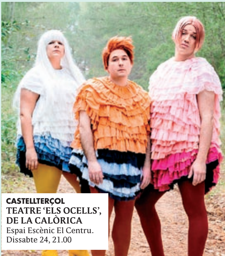
CASTELLTERÇOL TEATRE 'ELS OCELLS', DE LA CALÒRICA Espai Escènic El Centru. Dissabte 24, 21.00