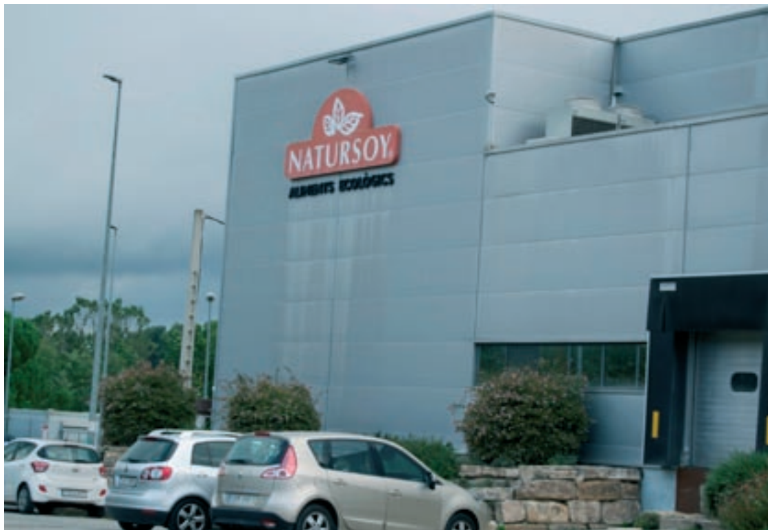
Seu de Natursoy, una de les empreses pioneres dins del sector ecològic de la comarca