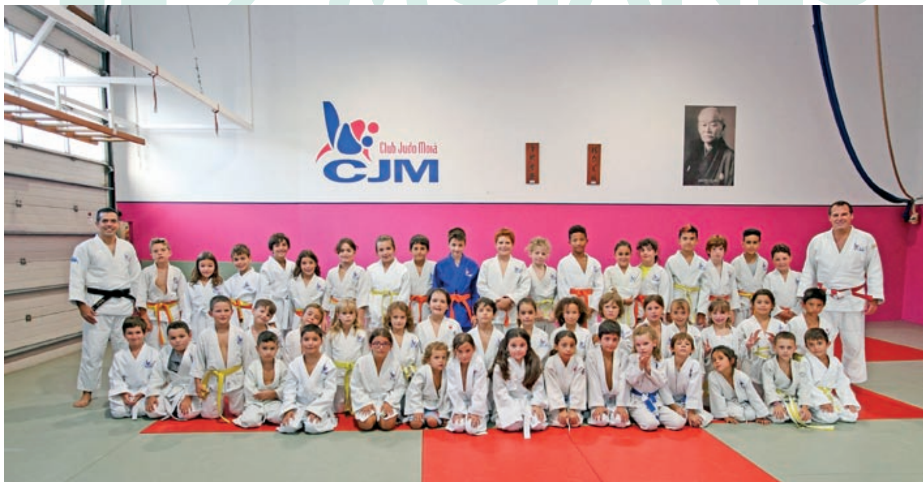
Foto de família d'alumnes i professors del Club Judo Mojà, amb origen als anys noranta