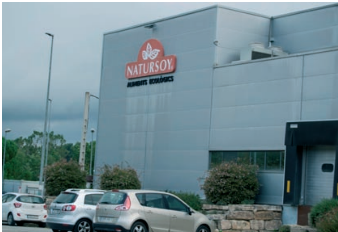
Seu de Natursoy, una de les empreses pioneres dins del sector ecològic de la comarca