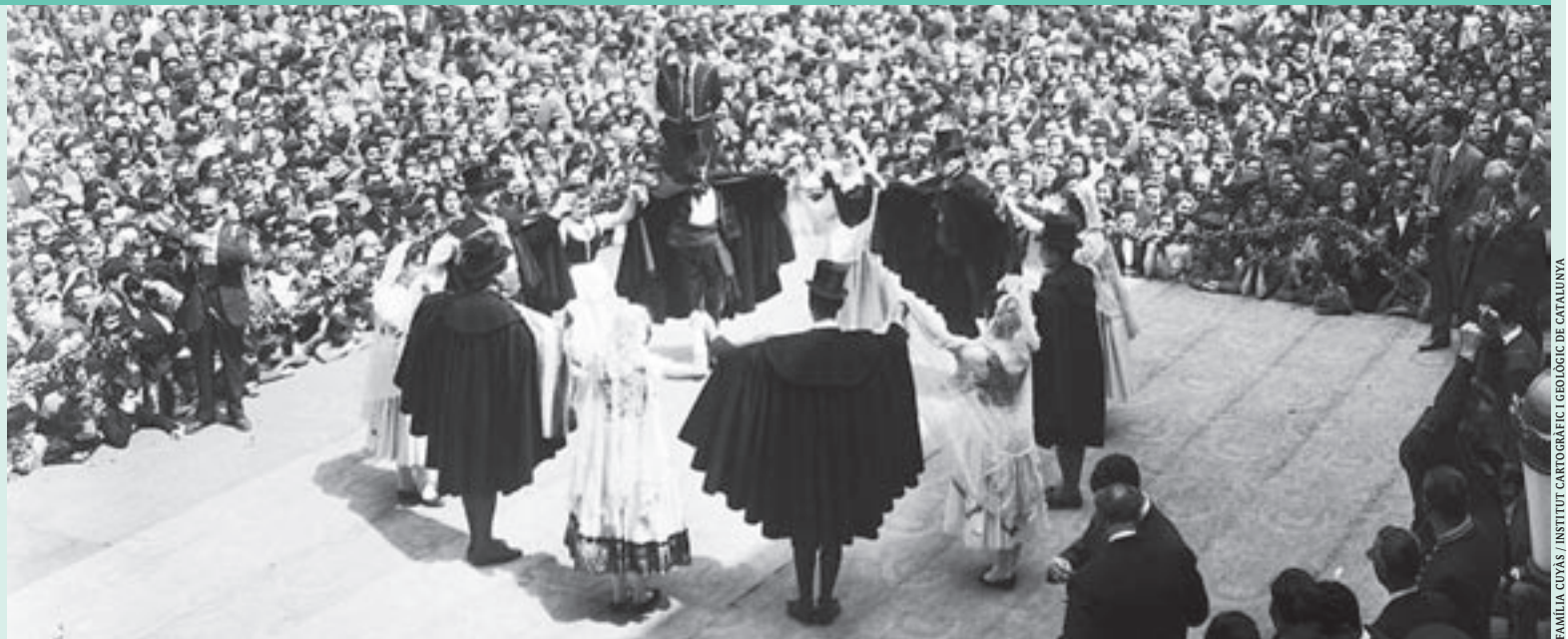
FAMÍLIA CUYÀS / INSTITUT CARTOGRAFIC GEOLOGIC DE CATALUNYA

La Dansa de Castellterçol està catalogada com una de les peces cerimonials més importants del folklore català. Tant per la bellesa i originalitat de la seva música, com per la seva coreografia solemne i senyorial, aquesta dansa que es balla a la festa major, el quart cap de setmana de l'agost, va ser declarada d'Interès Nacional el 1985 per la Generalitat. Aquesta imatge correspon al 1957 i va ser disparada per Enric Cuyàs i Prat (1910-1989).