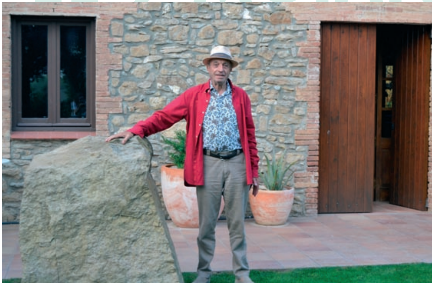
Salvador Sala al Mas Montserrat (Castellcir), situat a la finca on també hi ha la fàbrica de Vegetalia