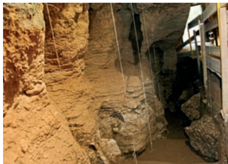
A dalt, l'interior de la cova. A sota, reproduccions d'animals que s'hi han trobat i les parets resultat de la fossilització de l'escull de corall