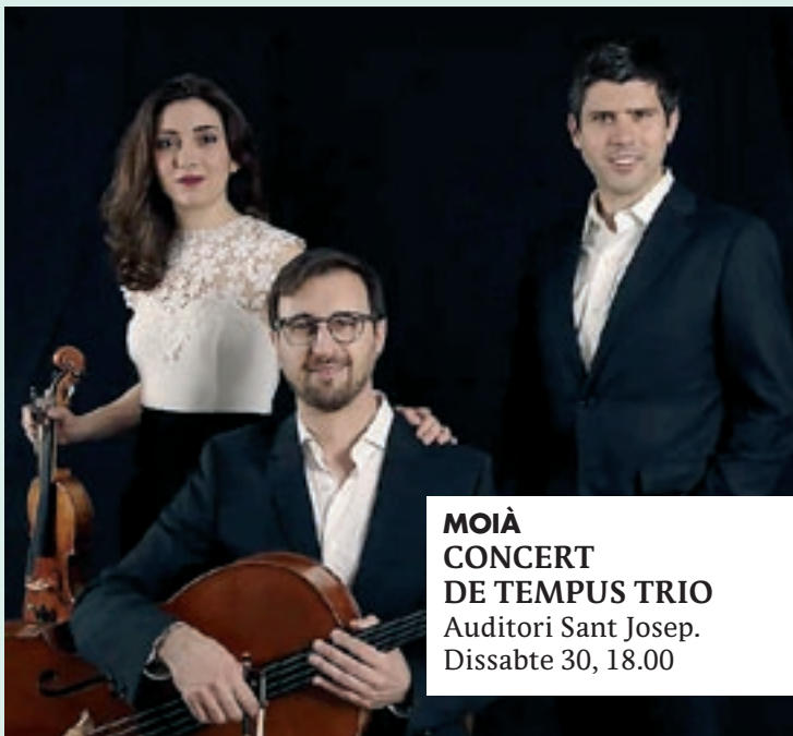
MOIÀ CONCERT DE TEMPUS TRIO Auditori Sant Josep. Dissabte 30, 18.00

Santa Maria d'Oló. Intercanvi amb la Llar del