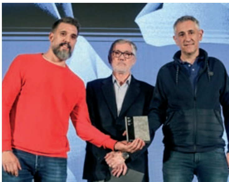
Moment en què els responsables de Neurekalab recollien el premi

*Estudiants de Periodisme de la UVic-UCC