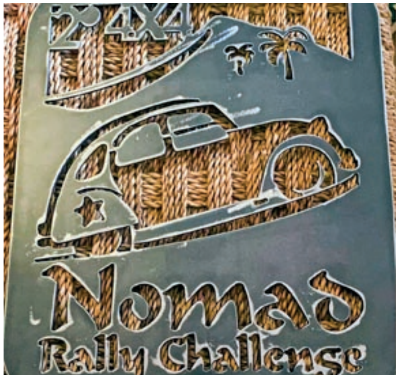
Placa de record per als guanyadors del ral·li

premís amb una celebració final. En tot el trajecte els membres del Nomad es van allotjar a diversos hotels i càmpings a prop de les seves metes.