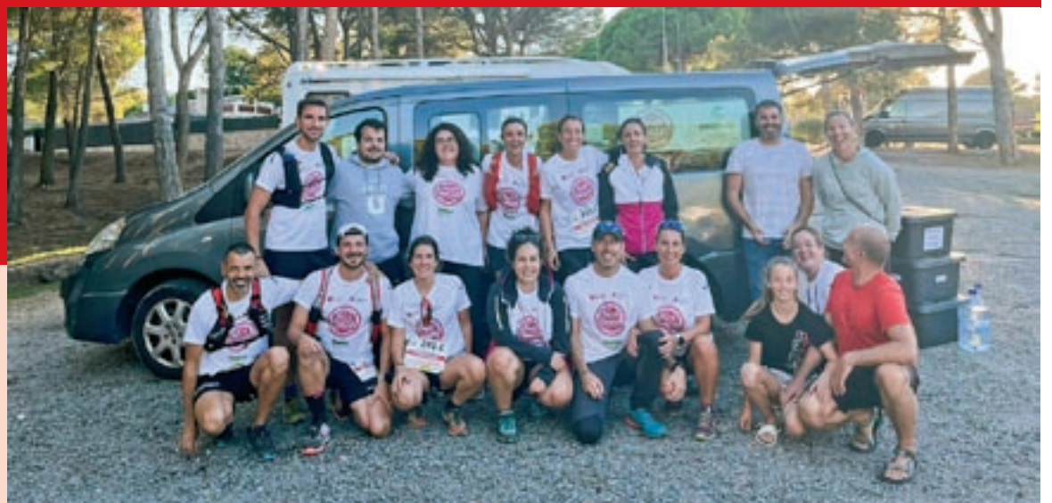
Integrants de l’equip de la UVic que va participar en la cursa solidària

de 100 quilòmetres organitzada per la Fundació Oncolliga Girona, que té per objectiu recaptar fons per millorar la qualitat de vida dels malalts de càncer. Per poder participar-hi, cada equip ha de fer un donatiu de 1.000 euros.