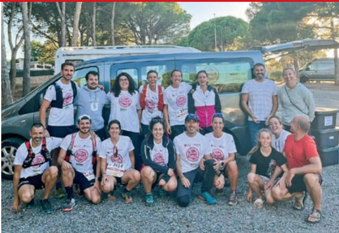
Integrants de l'equip de la UVic que va participar a l'Oncotrail

Ambdós coincideixen que és una bona manera de promocionar l'activitat física dins el centre, amb el valor afegit de tenir una finalitat solidària. D'aquesta manera, l'equip d'UVic Fuck Càncer, explica Font, lliga la part