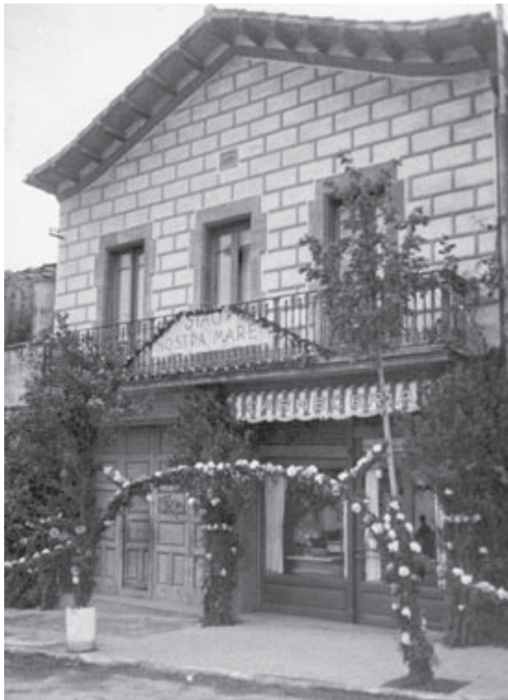
La botiga, engalanada amb motiu de la Mare de Déu de Fàtima, l'any 1951