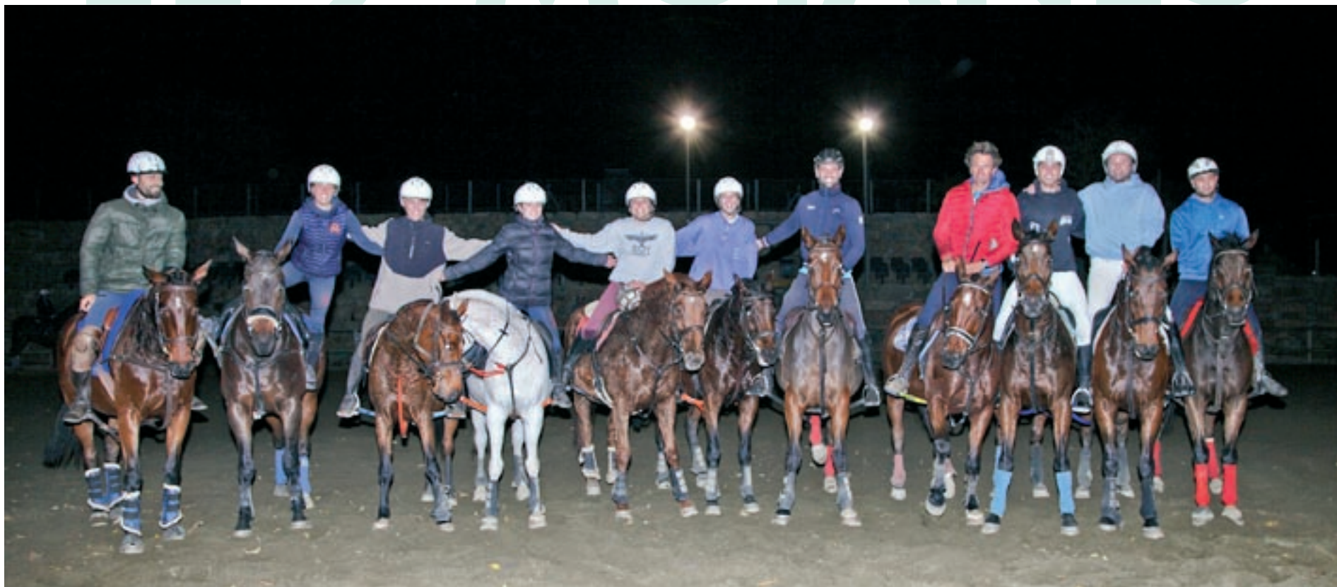
Jugadors de tres dels vuit equips de l'hípica El Serrat de Moià, després d'un entrenament