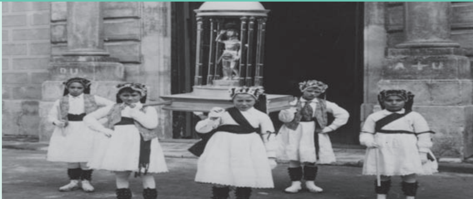
JUST RENOM (ARXIU HISTÒRIC DE MOIÀ)

Els nens de la imatge formaven part del Ball de Garrofins el 20 de gener de 1936, darrera vegada que varen sortir abans de l'inici de la Guerra Civil i una tradició que no es va recuperar fins al 1974. El Ball de Garrofins és una dansa de mitjan segle XVII que es ballava per la festa de Sant Sebastià, patró de Moià. A més d'executar la dansa en diferents places i carrers, els garrofins eren els encarregats de portar la imatge de plata del sant a la processó que es feia.