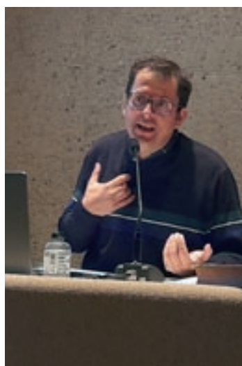
Miró dijous al Museu

inquietuds per la predicció del temps, Puig va estudiar dret i va guanyar una plaça com a escrivà del jutjat de Granollers. Es va integrar en el món cultural de la vila i va formar part de "Les tertúlies del Congost", en al·lusió al setmanari local que es va editar en l'últim terç del segle XIX i principis del XX. Soci de la Unió Liberal i president del Casino en dues ocasions, el 1903 i el 1914, Puig es movia en l'entorn intel·lectual del modernisme. Així, el 1896 va organitzar el V Certamen Científic i Literari de Granollers, que va reunir la flor i nata del modernisme, entre els quals el pintor Santiago Rusiñol. Puig va