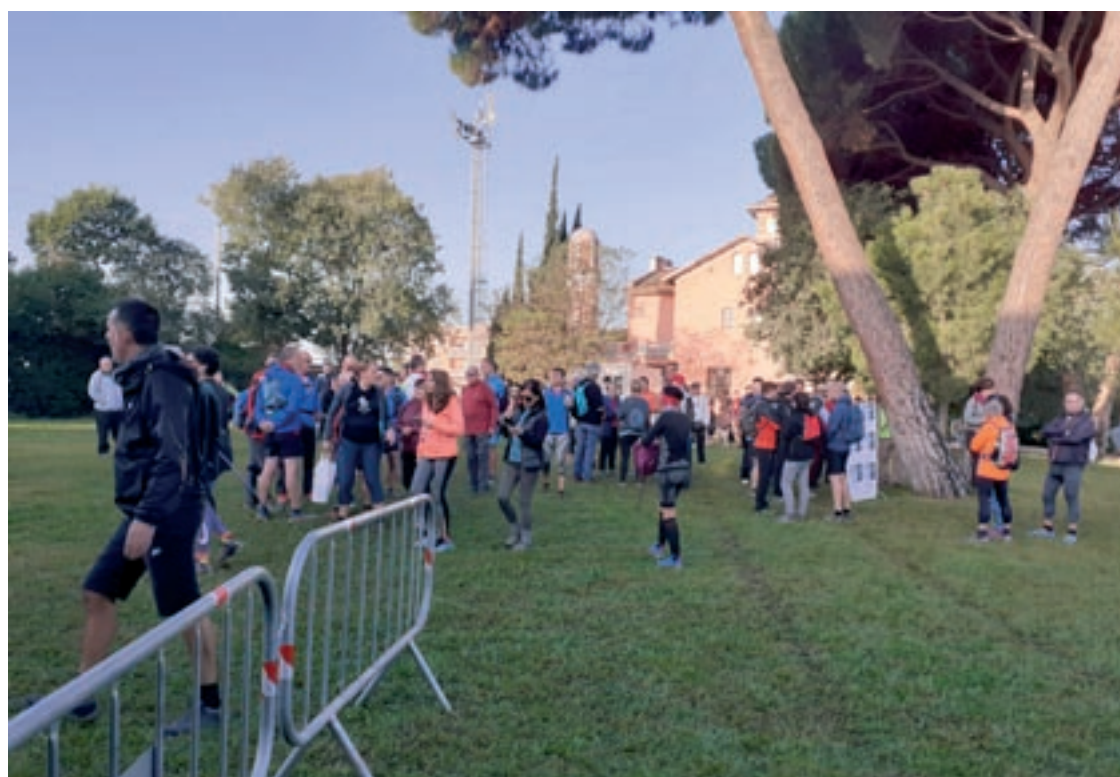
La Ruta de les Fonts va comptar enguany amb quatre recorreguts diferents