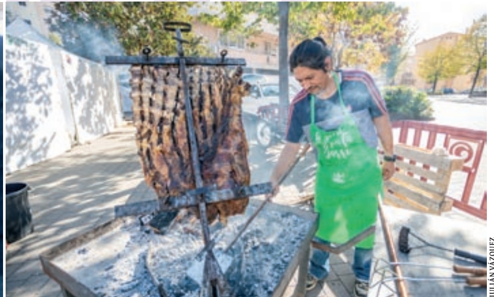
A la foto de l'esquerra, les típiques 'migas' andaluses fetes amb farina; a la de la dreta, l'asado' argentí, que també es va poder degustar a la plaça de les Hortes