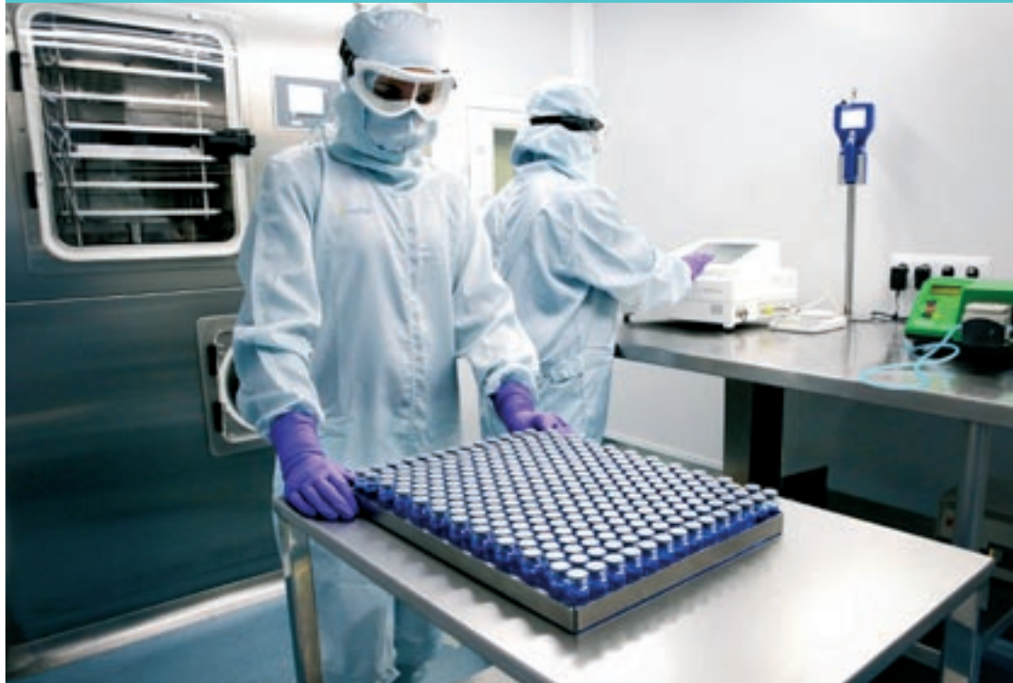
Un dels processos productius de Neftis a les instal·lacions de Santa Eulàlia

L'empresa de productes cosmètics i mèdics amplia els espais corporatius i productius