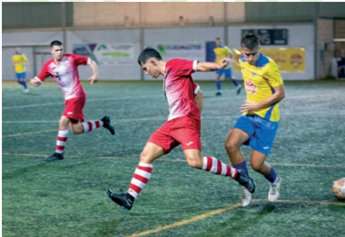
El Sant Celoni va patir per vèncer el duel del Baix Montseny disputat a Santa Maria de Palautordera