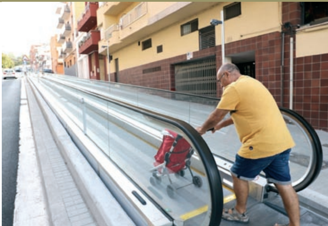
Les rampes mecàniques del carrer Carles Riba de Granollers

El sector empresarial serà el beneficiari més gran d'aquests fons, amb una partida de 12.300.688 euros que es repartiran entre 143 empreses. El segueix de prop el sector públic, que rebrà una injecció d'11.296.636 euros a repartir entre 24 ajuntaments i el Consorci per la Gestió dels Residus. Set centres de recerca i formació rebran un import total de 2.796.850 euros, i tres entitats del tercer sector obtindran la suma de 48.957 euros. Els 2.693.356 restants