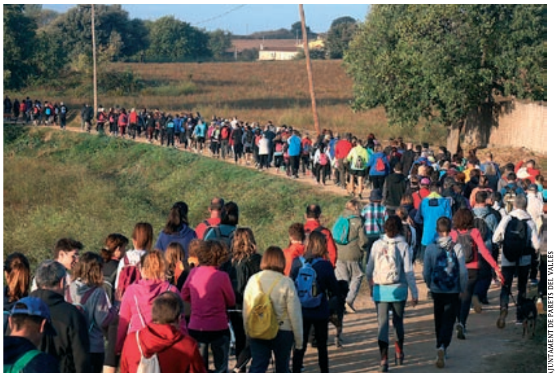
Més de 400 persones van passejar pel terme municipal de Parets i l'espai natural de Gallecs

La majoria de participants a la caminada s'hi havien inscrit de forma anticipada, fet que feia preveure una bona afluència de públic a l'hora d'iniciar la marxa, com així va ser. A més de gaudir de l'entorn en un ambient de germanor i de posar en valor el patrimoni natural de l'entorn de Gallecs, els participants també van poder recuperar forces a mig camí amb un entrepà de botifarra. Un cop al final del recorregut, tots els assistents van rebre un obsequi commemoratiu de part de l'organització.