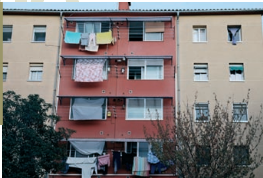
Un bloc de pisos de Primer de Maig a Granollers. Europa aportarà 1,6 milions per a la millora de

A Granollers, concretament, es rehabilitaran una quarta part dels 41 blocs d'habitatges del barri de Primer de Maig, 140 dels 550