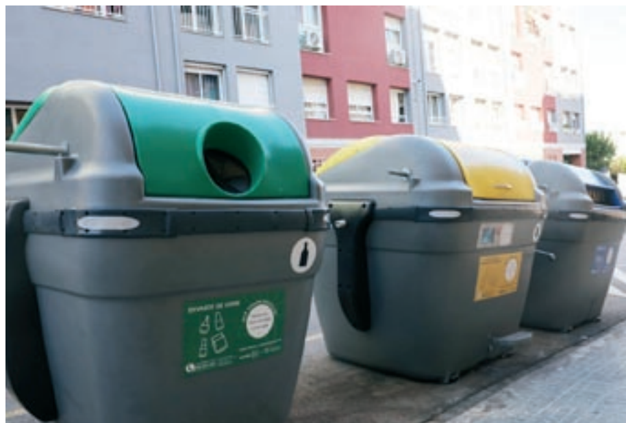
Contenidors intel·ligents de Montmeló. És el primer municipi de la comarca que els instal·la