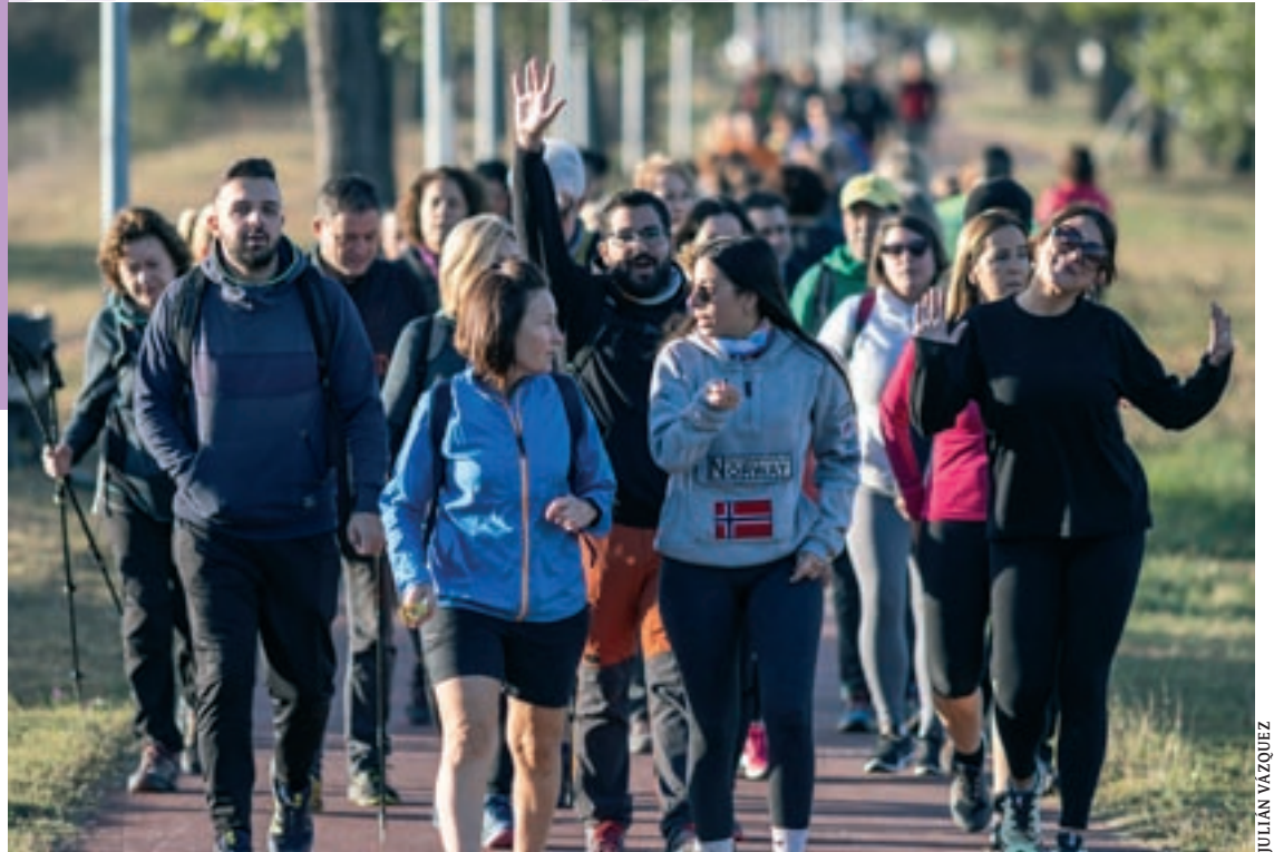
Participants a la caminada segueixen la llera del riu Congost al tram inicial del recorregut