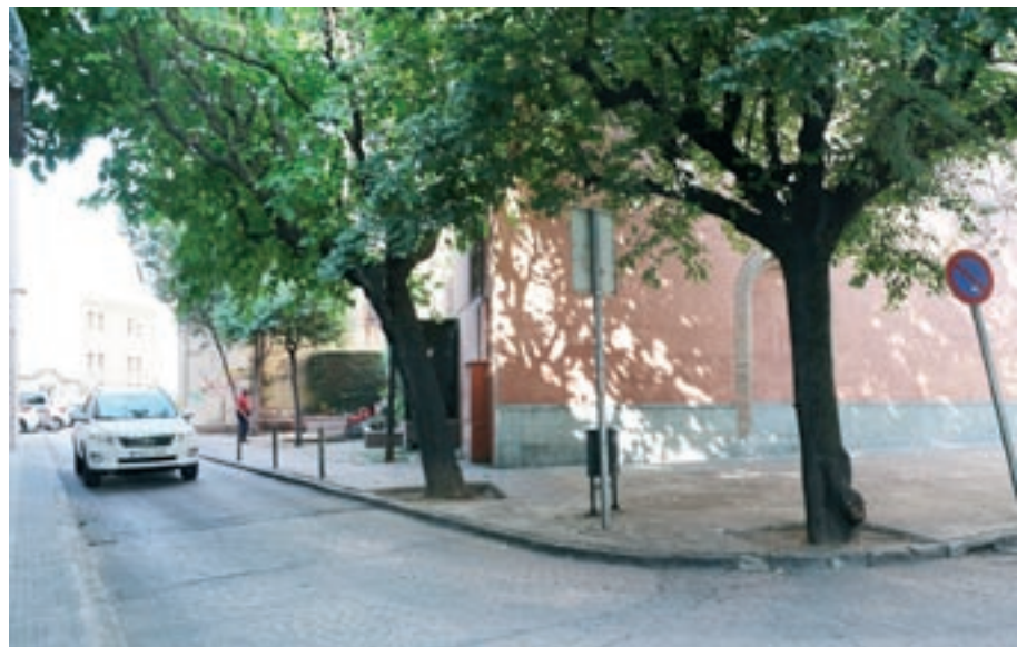
Mollet vol transformar l'entorn de l'església en un espai amb prioritat per als vianants