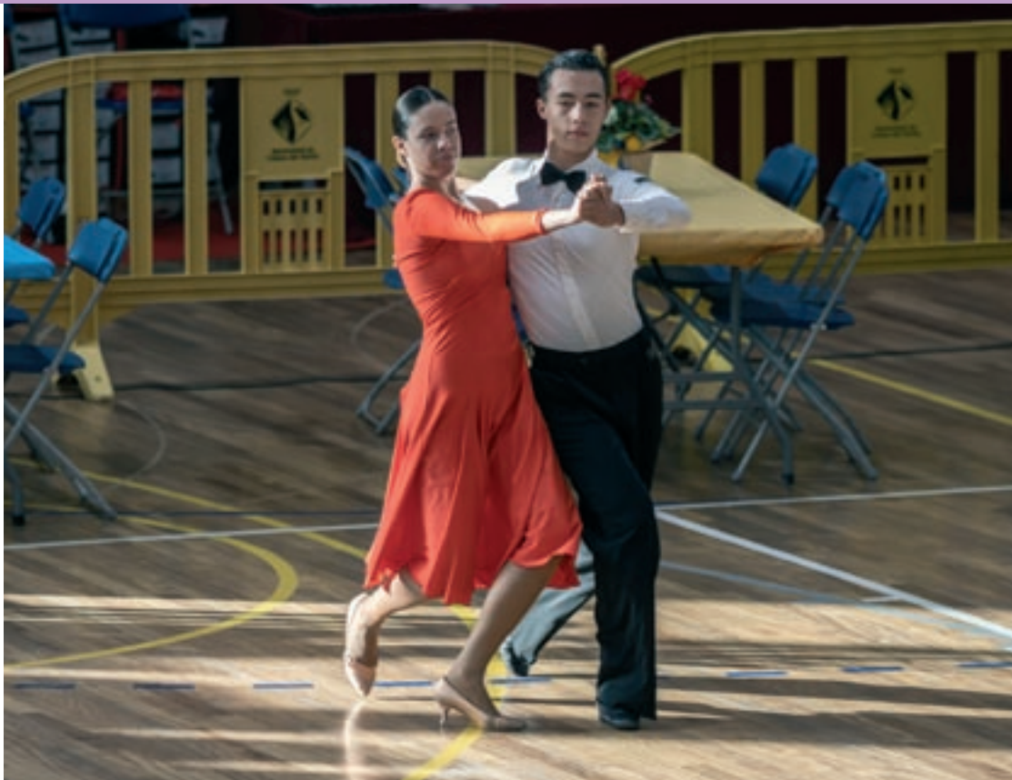
Una de les parelles que van participar al Trofeu de Balls de Saló, diumenge al matí al pavelló d'esports de Llinars

El mateix Patrón reconeixia "el gran nivell, amb campions d'Espanya i del món". Un nivell que el públic va aplaudir i admirar. A mig matí i cap al final de la competició, les grades estaven plenes a vessar. Des de les 9 del matí fins les 8 del vespre, el parquet del pavelló es va omplir de participants de les diferents categories i nivells, en un ambient com