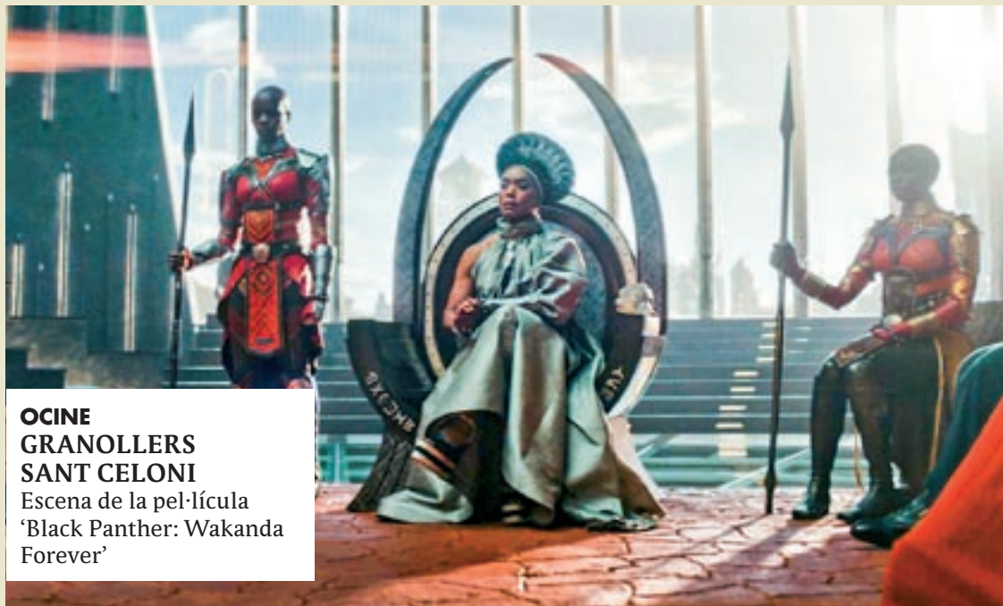
OCINE GRANOLLERS SANT CELONI Escena de la pel·lícula 'Black Panther: Wakanda Forever'

cotxe i últimament també al seu cor. Julián vol aprofitar el viatge per a sincerar-se amb ella, però un error a l'hora de triar la resta dels ocupants inclou a un inquietant passatger, que provocarà un radical canvi en el rumb dels esdeveniments.