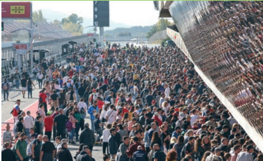
Diumenge el públic assistent va poder passejar pel 'pit lane' i va poder conèixer alguns dels pilots participants