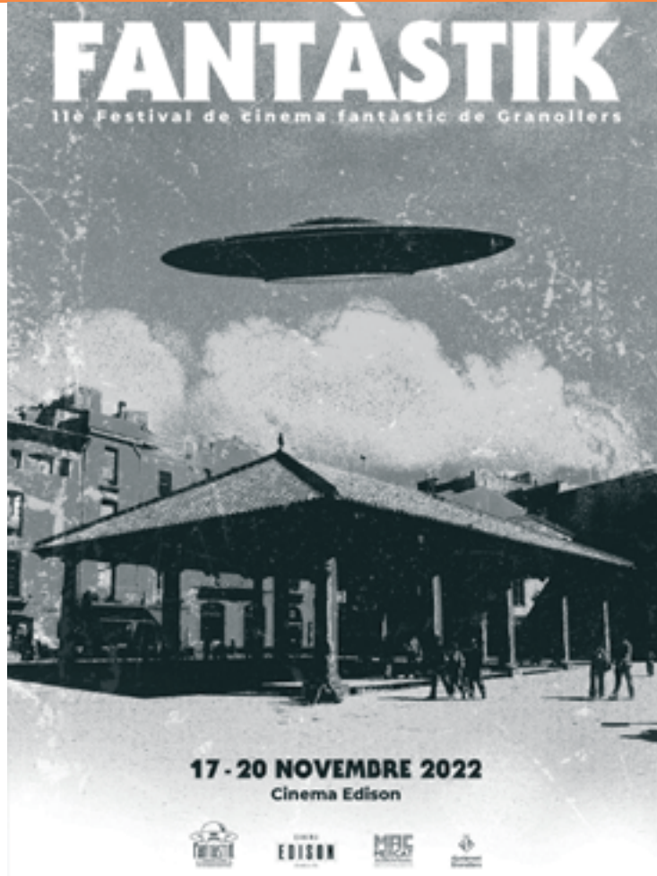
El cartell del festival és de Biombó Studio, amb referències alienígenes

Pel que fa als llargmetratges, hi haurà 5 preestrenes que han obtingut les millors crítiques al Festival de Sitges