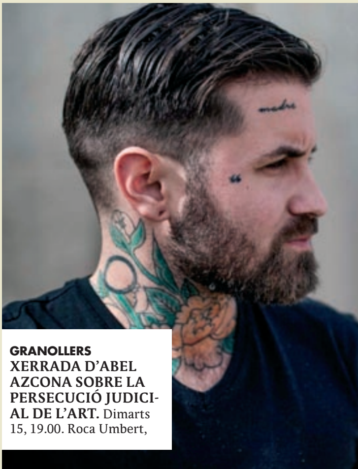
GRANOLLERS XERRADA D'ABEL AZCONA SOBRE LA PERSECUCIÓ JUDICIAL DE L'ART. Dimarts 15, 19.00. Roca Umbert,

Santa Eulàlia de Ronçana. Cicle de sortides naturalistes. Sortida al riu Tenes. La