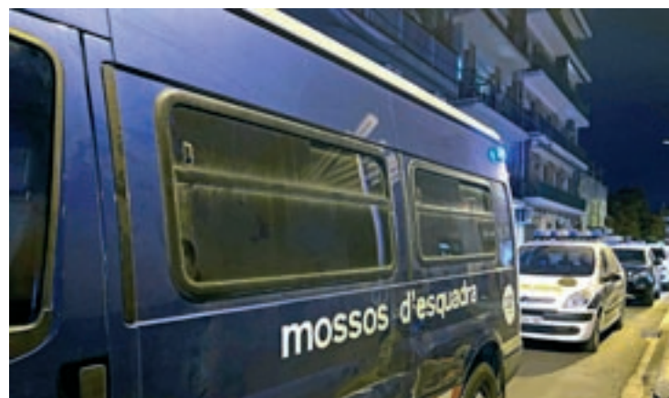
Vehicles policials dijous passat a Canovelles

En el control, es va denunciar dues persones per