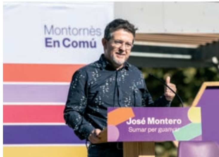
Montero en la presentació d'aquest diumenge

El candidat va explicar que vol mantenir la qualitat de vida pels ciutadans i ciutadanes de Montornès. “Sabem