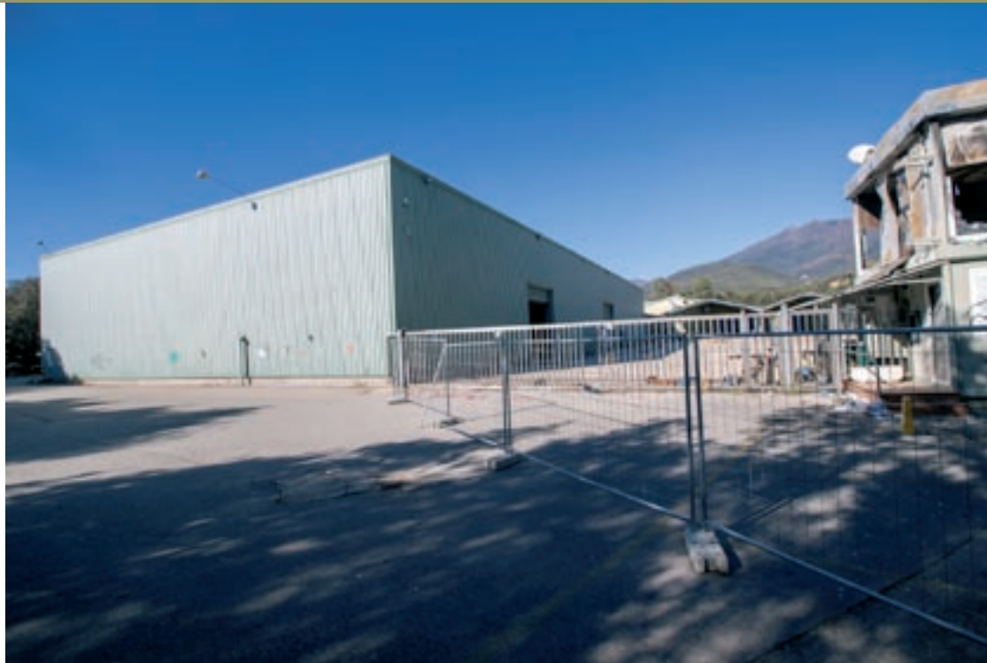
La fàbrica d'Aigua del Montseny està abandonada des que l'empresa que hi treballava va fer fallida el 2019