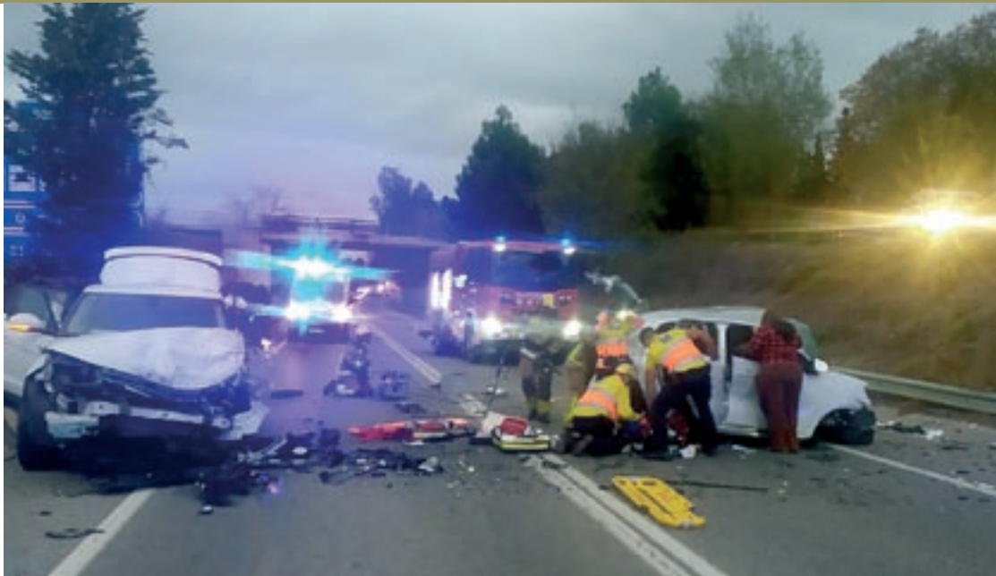
Els dos vehicles en la posició en què van quedar després de l'impacte frontal en un tram amb doble línia continua

L'accident va passar pocs minuts després de les 5 de la tarda a l'altura del quilòmetre 46,5 de la C-35. A causa