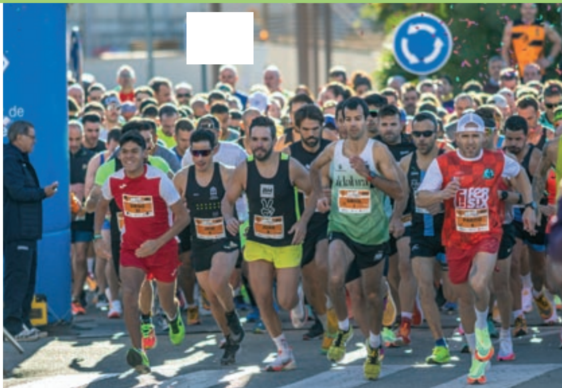
Els 10km de les Franqueses es van disputar diumenge al matí des de la zona esportiva de Corró d'Avall