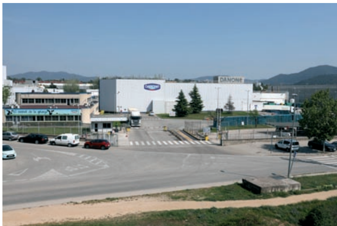
Aspecte del polígon Sector Autopista, amb Danone, una de les empreses més representatives de la zona

Els 12.509 contractes laborals formalitzats al Vallès Oriental durant el mes d'octubre marquen un descens superior al 4% tant en termes mensuals com interanuals, segons dades que difon el Consell Comarcal, a través del seu observatori. Aquesta serà, molt probablement, una tendència en els mesos vinents, perquè el creixement de la contractació indefinida suposa un límit a les modalitats temporals i, per tant, en global s'acaben firmant menys contractes. Les modalitats indefinides suposen un 38% del total de contractes que, si bé és una xifra inferior al 42% del mes precedent, està clarament per damunt el 14% que representaven fa un any. Tot i el descens, activats com les sanitàries i els serveis socials creixen en contractació.