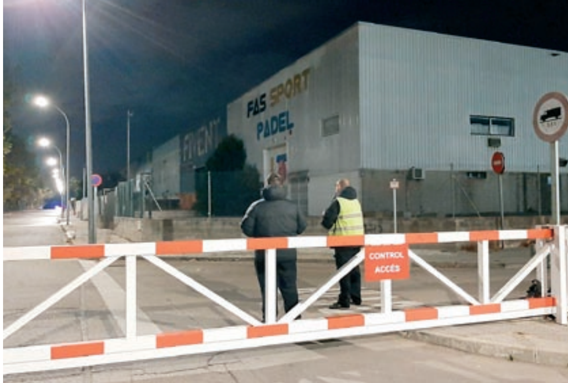
Uns vigilants controlen la barrera que impedeix el pas de vehicles a les nits

Alguns veïns havien denunciat a través de les xarxes socials el soroll dels cotxes a la nit. Cada un d'aquests polígons té dues entrades que es tanquen amb una porta de ferro. En un dels accessos hi ha vigilants privats que controlen tots els vehicles que volen entrar o sortir, com camions que van a descarregar a alguna de les indústries o treballadors del torn de nit. L'altre accés