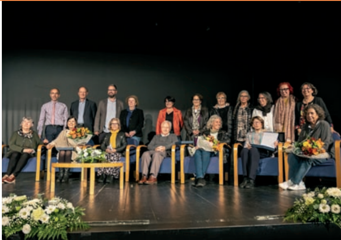
El col·lectiu de dones guanyadores, juntament amb membres del jurat i representants dels finalistes