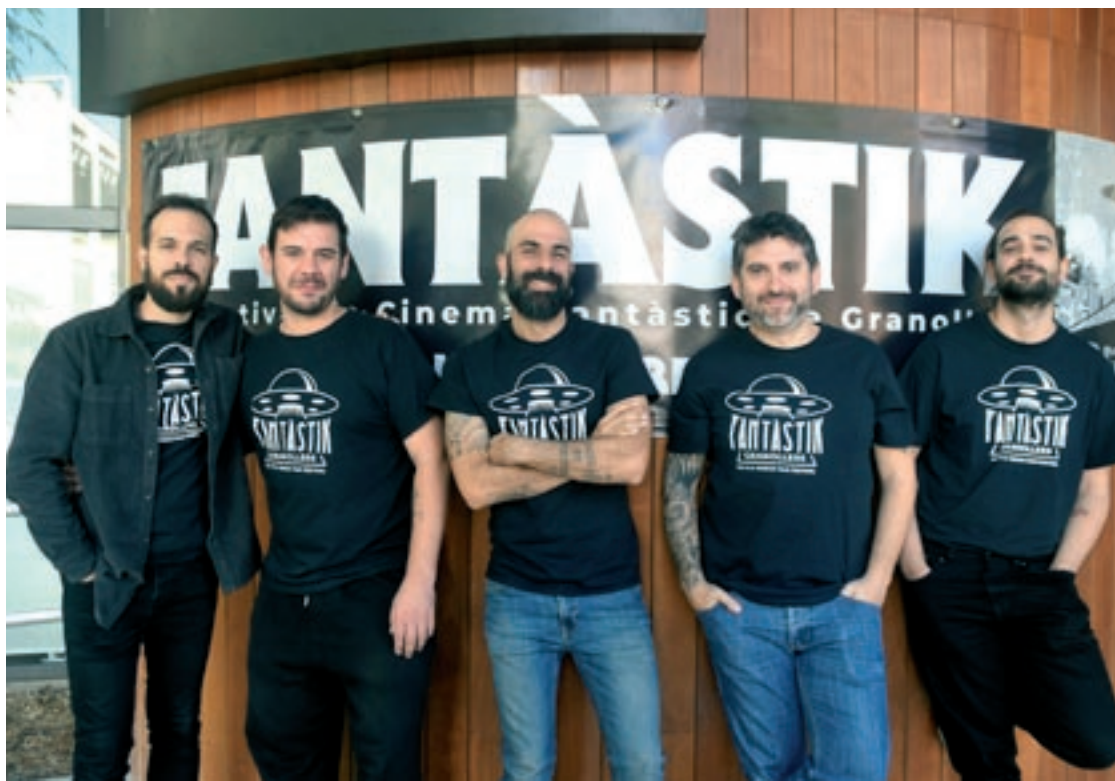
Els organitzadors del festival, al Cinema Edison de Granollers