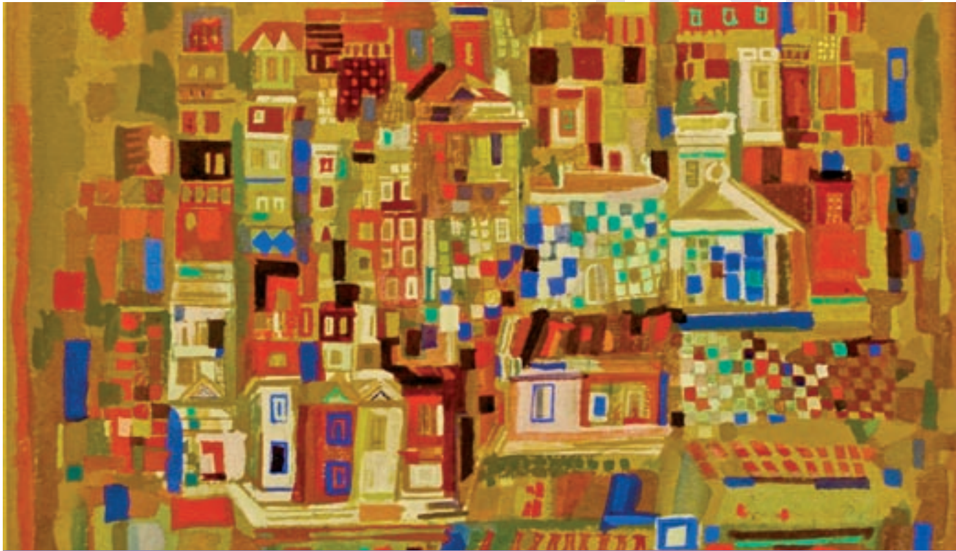
MARIA HELENA VIEIRA DA SILVA (1948-1951)