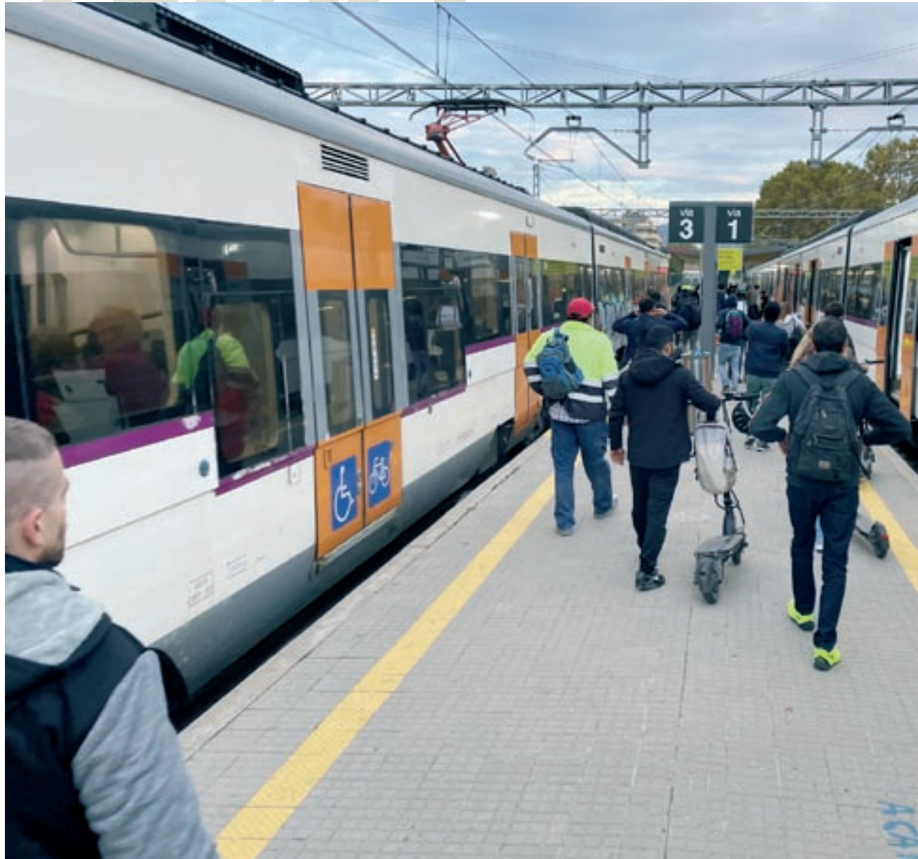
Usuaris a l'estació de tren de Granollers-Canovelles dijous passat a primera hora del matí quan van creuar-se dos trens