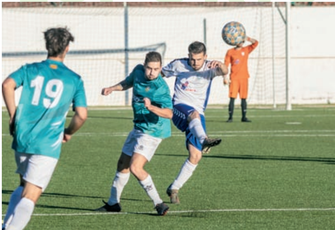
El partit entre el Bigues i l'Aiguafreda va transcórrer amb un intercanvi de gols i ocasions