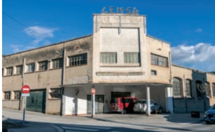
Les lletres de pedres de Cemsa formen part del paisatge des de fa dècades

En tot aquest procés, l'Ajuntament ha tramitat una modificació del nou Pla d'Ordenació Urbanística Municipal (POUM) per canviar l'ús d'habitatge residencial que s'havia previst per aquesta zona per un de zona verda, equipament –la intenció és poder-hi fer un teatre-auditori "d'acord amb la mida del poble"–, habitatge social i una porxada conservant les arcades que formen una de les naus més antigues. Serà l'única part que es preveu conservar del conjunt industrial on durant dècades es va dissenyar i produir maquinària per a la indústria tèxtil.