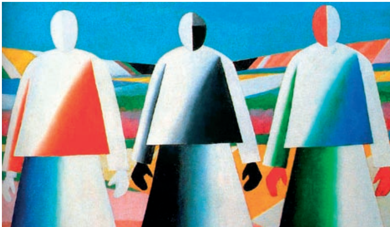
KAZIMIR MALEVITX (1879-1935)