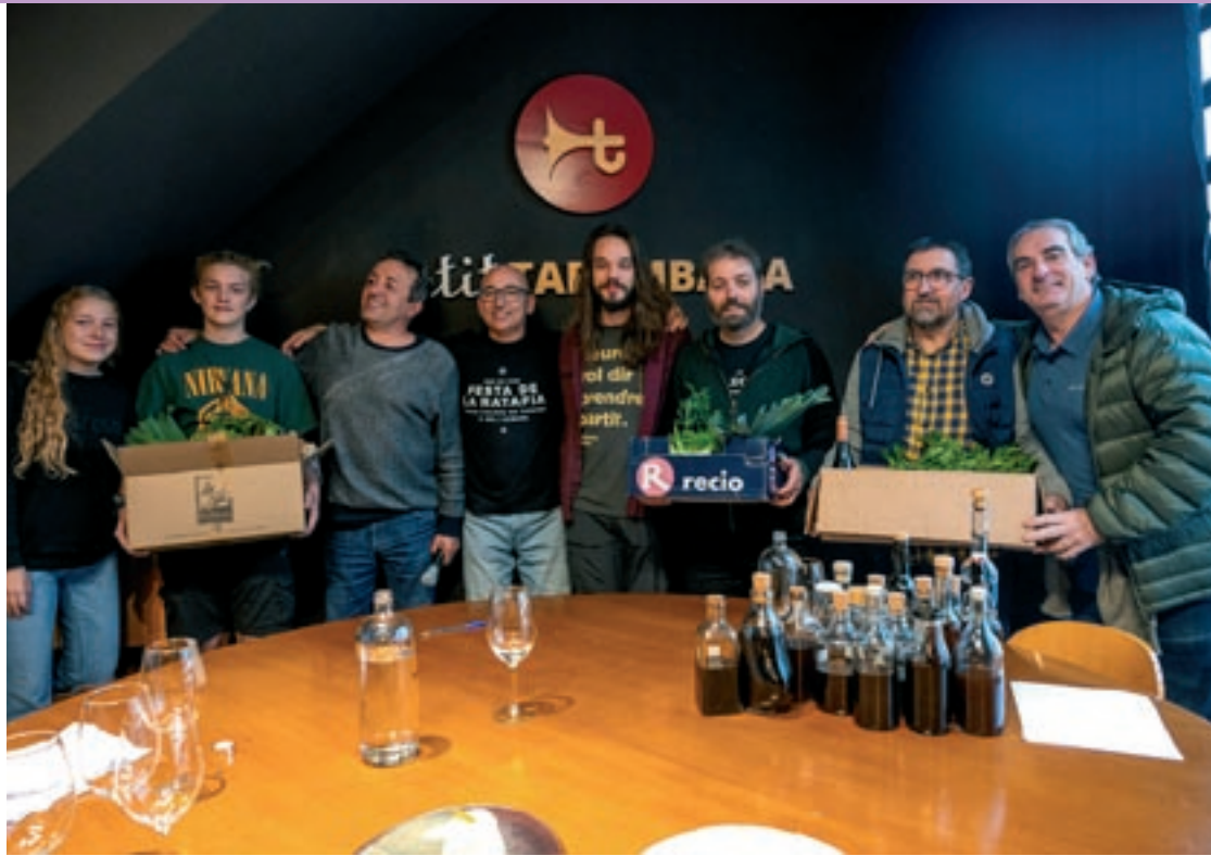
El concurs de la ratafia és un dels plats forts de la festa

de ratafia a la comarca de la Selva i un dels membres del jurat, va explicar el que s'havien trobat en el concurs d'enguany com a norma general: "Hem vist que en aquesta zona hi ha un estil de ratafia bastant implantat,