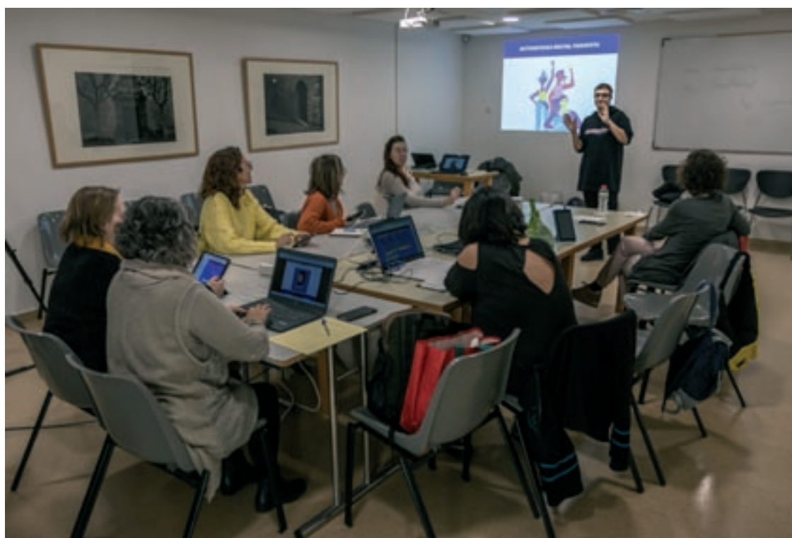
Un dels tallers que es van fer dissabte a Cardedeu en el marc de la jornada Cardedeu Coeduca

Simultàniament en el Museu-Arxiu Tomàs Balvey es va fer el taller "Eines ciberfeministes per l'empoderament digital", a càrrec de