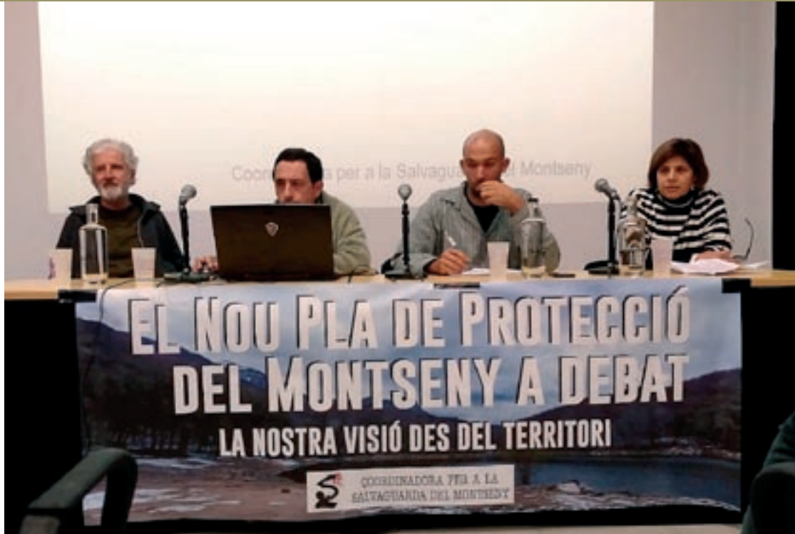
La Salvaguarda va organitzar una trobada amb experts dissabte a l'Ateneu de Sant Celoni sobre l'estat del Montseny