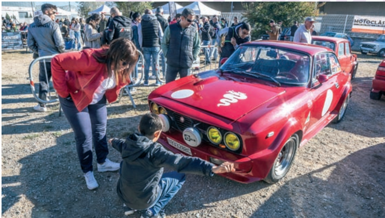
La trobada es va traslladar aquest any al polígon El Pedregar per poder encabir més vehicles