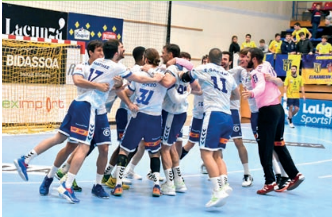
Els jugadors del Fraikin, eufòrics, celebren el triomf al final del partit