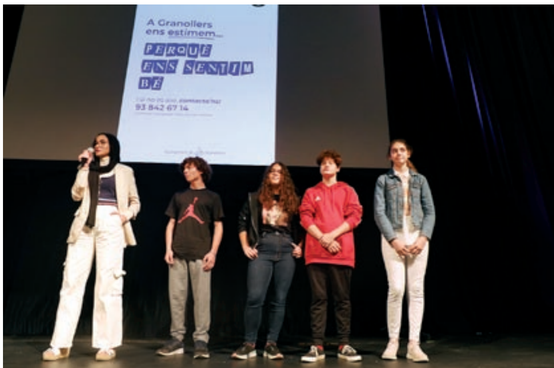
Representants de l'Arrel-Fòrum de les Adolescències, divendres durant la presentació de la campanya al TAG

Sota el títol "Des del món educatiu actuem vers les violències masclistes i sexuals", el projecte es va presentar