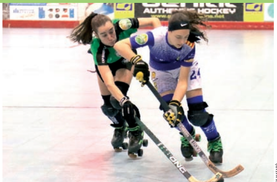
El Bigues va perdre dissabte a la pista del Mataró, tot i haver estat per davant al marcador