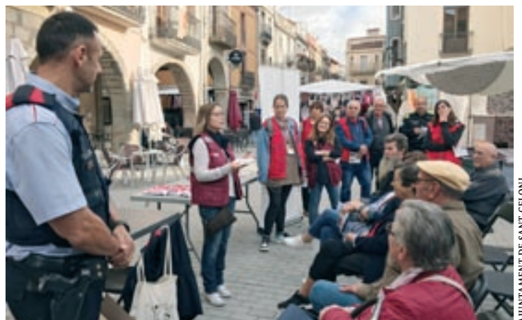
AJUNTAMENT DE SANT CELONI

Granollers Un total de 67 persones van donar sang dimarts de la setmana passada en una recollida a la comissaria dels Mossos d'Esquadra de Granollers. Hi ha nou persones més que es van interessar per fer la donació però que no la van poder fer per motius mèdics. Del total de persones, nou era la primera vegada que donaven sang.