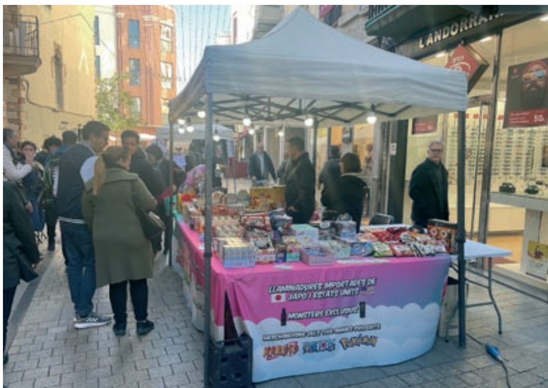
Una de les parades de la fira instal·lada al carrer Sant Roc

tes que van omplir el carrer Sant Roc amb productes de tot tipus, com llaminadures importades del Japó i els Estats Units, jocs o tot tipus de productes relacionats amb Harry Potter. Precisament, la plaça de l'Església va ser un territori dedicat a aquest personatge, amb la pràctica del quidditch . A la plaça Folch i Torres, en canvi, s'hi van fer demostracions i taller sobre lluita celta i vikinga. També es va posar a disposició dels pares una zona friqui infantil, a càrrec de l'escola bressol La Cabanya, amb personal especialitzat que els feien activitats. A La Gralla, en canvi, s'hi van fer presentacions de llibres i taules