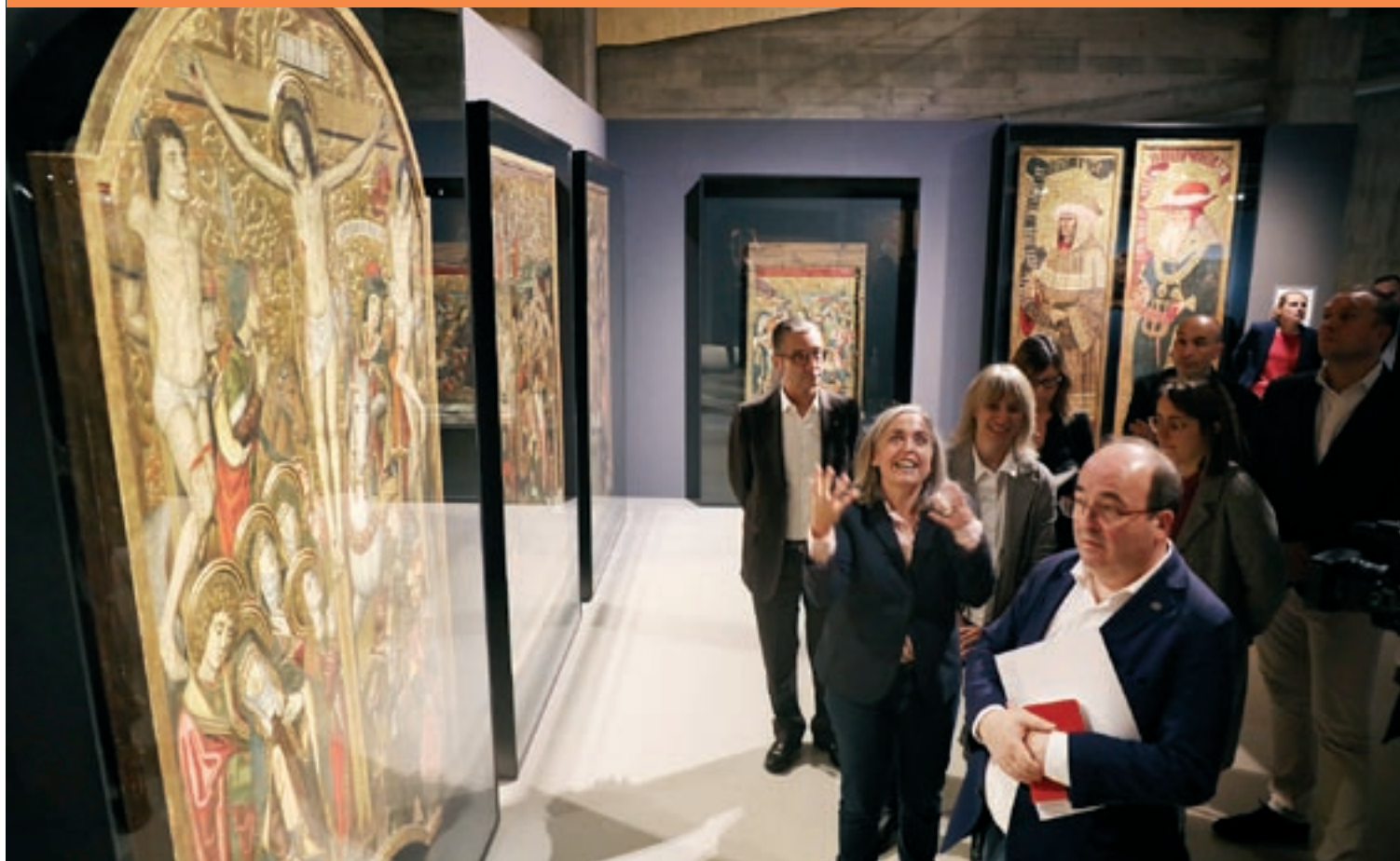
El ministre Miquel Iceta durant la visita a l'exposició "Tabula rasa", al Museu, on es pot veure el retaule de Sant Esteve

L'equip de govern treballa ara per poder mostrar tot el retaule sencer algun dia