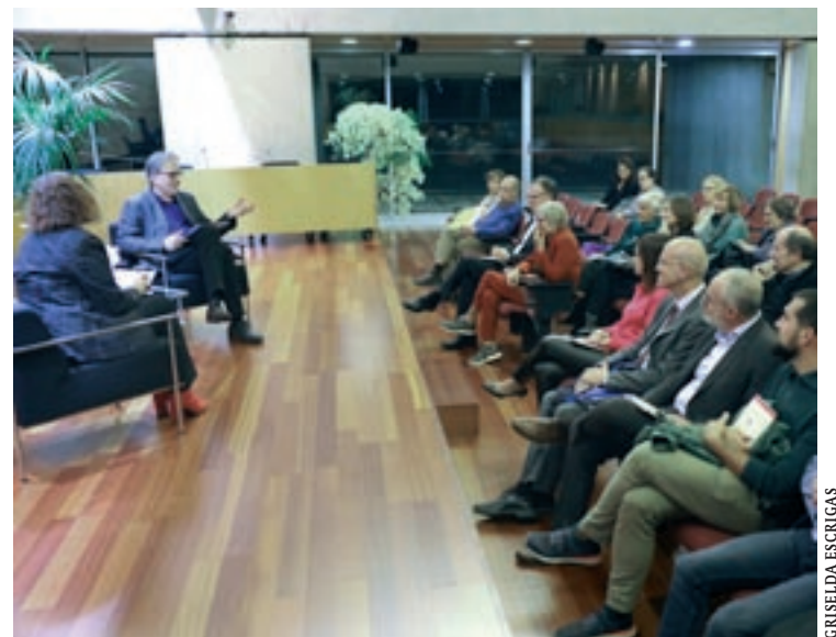
Subirats durant la presentació del nou volum que es va fer divendres

En la visita, Subirats va parlar de la nova Llei Orgànica del Sistema Universitari, que, va dir, és la seva principal preocupació. Va recordar que la llei actual es va fer fa més de 20 anys i ha quedat desfasada. Va assegurar que la nova llei vol construir un sistema universitari europeu que faciliti la mobilitat de professors i alumnes o fer que a més de producció científica hi hagi transferència de coneixement fora.