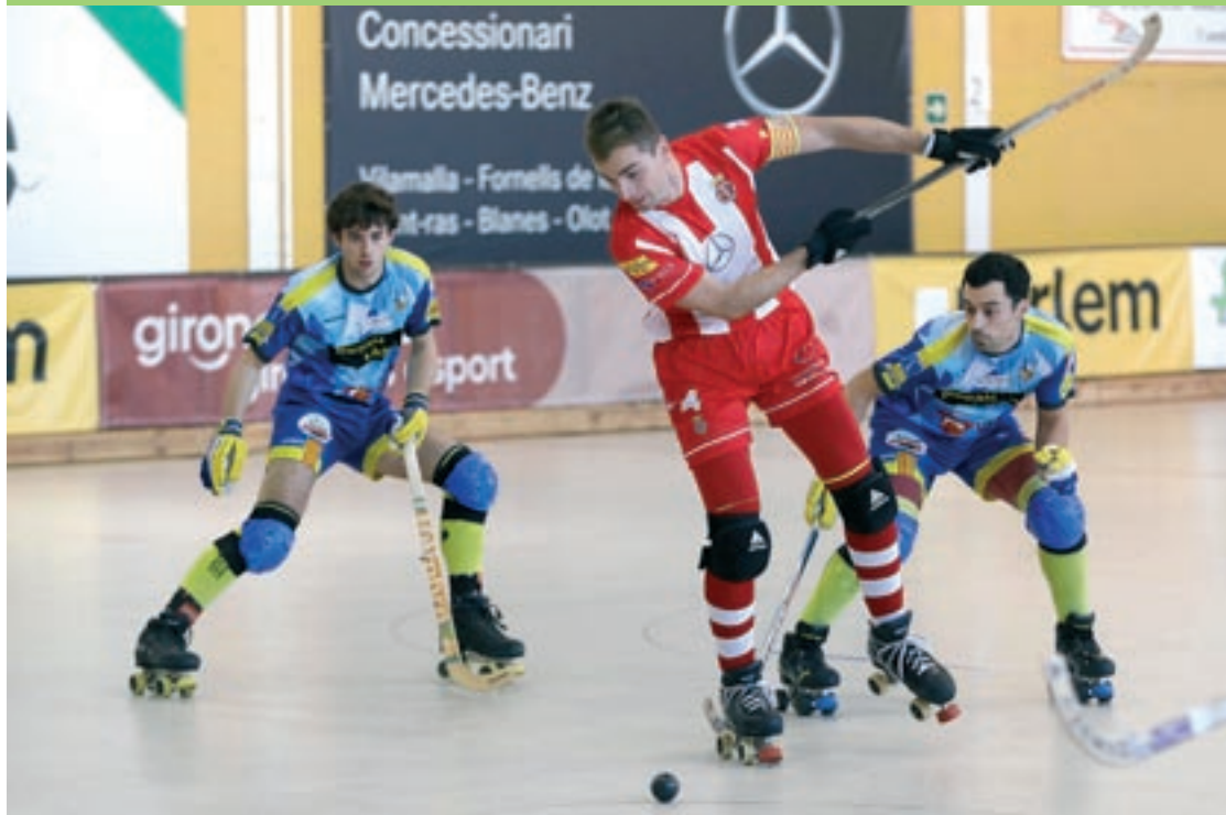
El Recam Làser Caldes va desencallar el partit contra el Girona –que estava empatat– amb dos gols a la segona meitat

Els vallesans remunten un 2-1 advers en el retorn a la lliga després de cinc setmanes