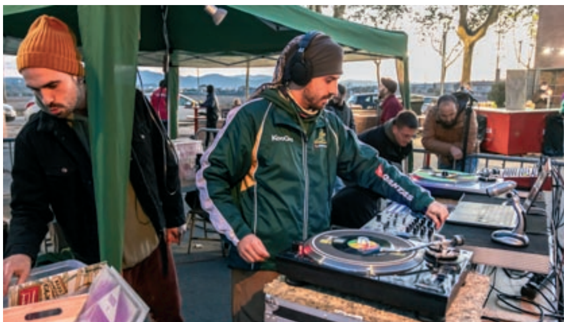
Dos membres d'Endemic seleccionen clàssics jamaicans en vinil, dissabte a la tarda a la plaça Joan Oliver

Endemic i les Dames de Foc són dos dels col·lectius convidats a Can Bassa Goes Reggae, una festa promoguda per One Drop, associació amb dos anys de vida que té com a objectiu difondre la música i la cultura jamaicanes a Granollers, però sobretot descentralitzar