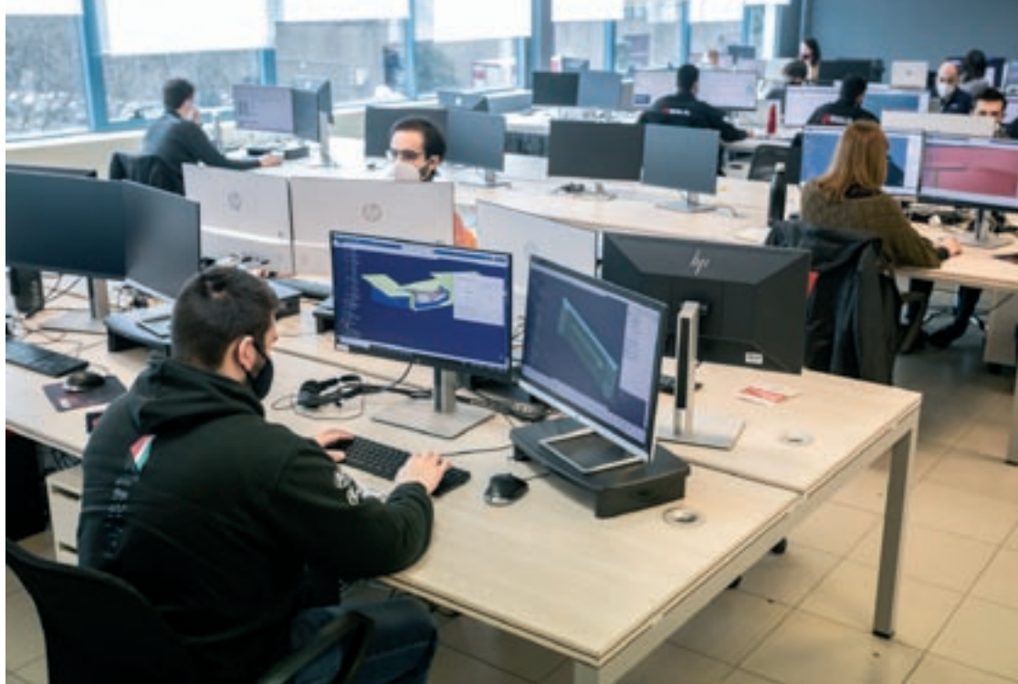
Les oficines de Bold a Montmeló, prop del Circuit, acullen desenes d'enginyers que treballen en nous desenvolupaments

El projecte ha obtingut una subvenció de tres milions d'euros per part del Centre per al Desenvolupament Tecnològic Industrial, que depèn del govern espanyol. Amb aquest suport públic, les empreses participants (Wallbox, Bold, Sky Life i Tekniatest) desenvoluparan bateries modulares amb capacitat per subministrar equips per carregar vehicles elèc-