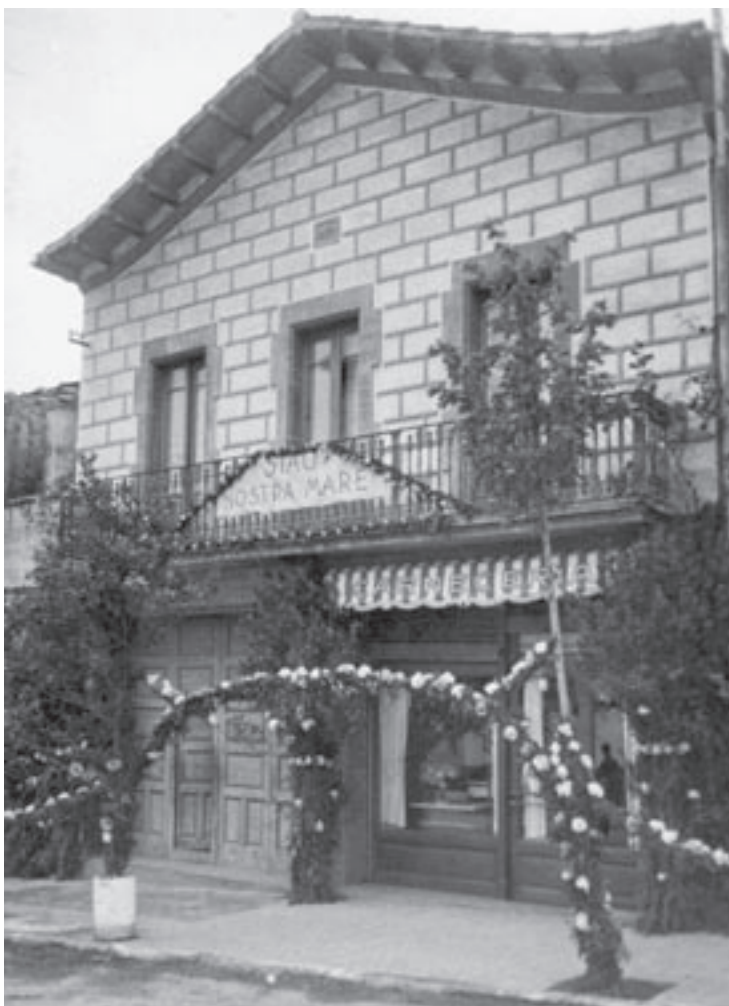
La botiga, engalanada amb motiu de la Mare de Déu de Fàtima, l'any 1951