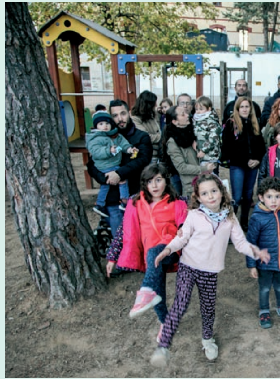
El grup de famílies que s'ha organitzat a Castellterçol per reclamar més hores de pediatria

Davant de les queixes de les famílies de Castellterçol, la Regió Sanitària Catalunya Central reconeix que hi ha una manca generalitzada de professionals, però al mateix temps remarca que la ciutadania del Moianès té garantida l'assistència a