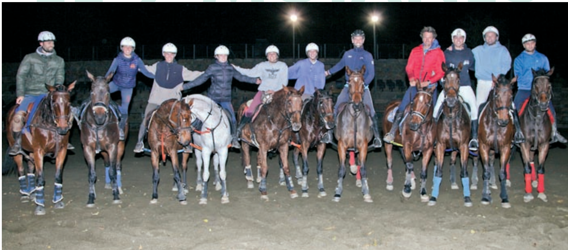
Jugadors de tres dels vuit equips de l'hípica El Serrat de Moià, després d'un entrenament