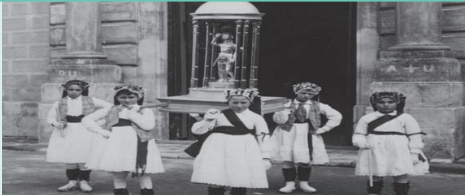
JUST RENOM (ARXIU HISTÒRIC DE MOIÀ)

Aquests nens de la imatge formaven part del Ball de Garroffins el 20 de gener de 1936, darrera vegada que varen sortir abans de l'inici de la Guerra Civil i una tradició que no es va recuperar fins al 1974. El Ball de Garroffins és una dansa de mitjan segle XVII que es ballava per la festa de Sant Sebastià, patró de Moià. A més d'executar la dansa en diferents places i carrers, els garroffins eren els encarregats de portar la imatge de plata del sant a la processó que es feia.