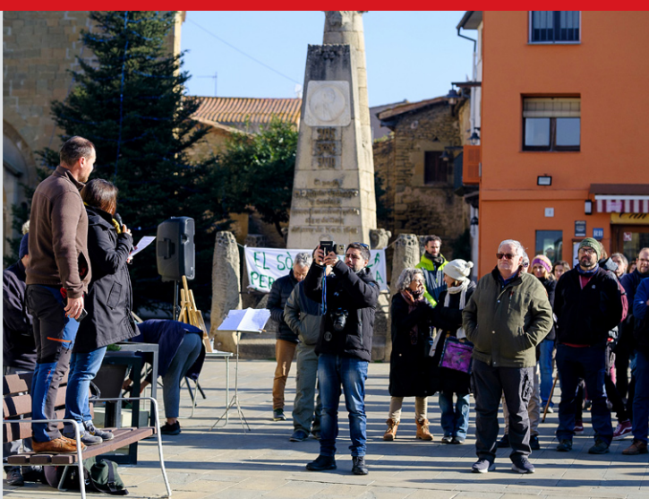
Els concentrats van llegir un manifest a la plaça de Folgueroles

Convocats per la plataforma Per Una Plana Viva, un centenar de persones es van concentrar dissabte a Folgueroles en contra del Caganer Festimarket, un festival de Nadal d'iniciativa privada que es vol fer tot el mes de desembre. L'Ajuntament ha denegat els permisos de la fira, però els impulsors presentaran recurs a la decisió del consistori.